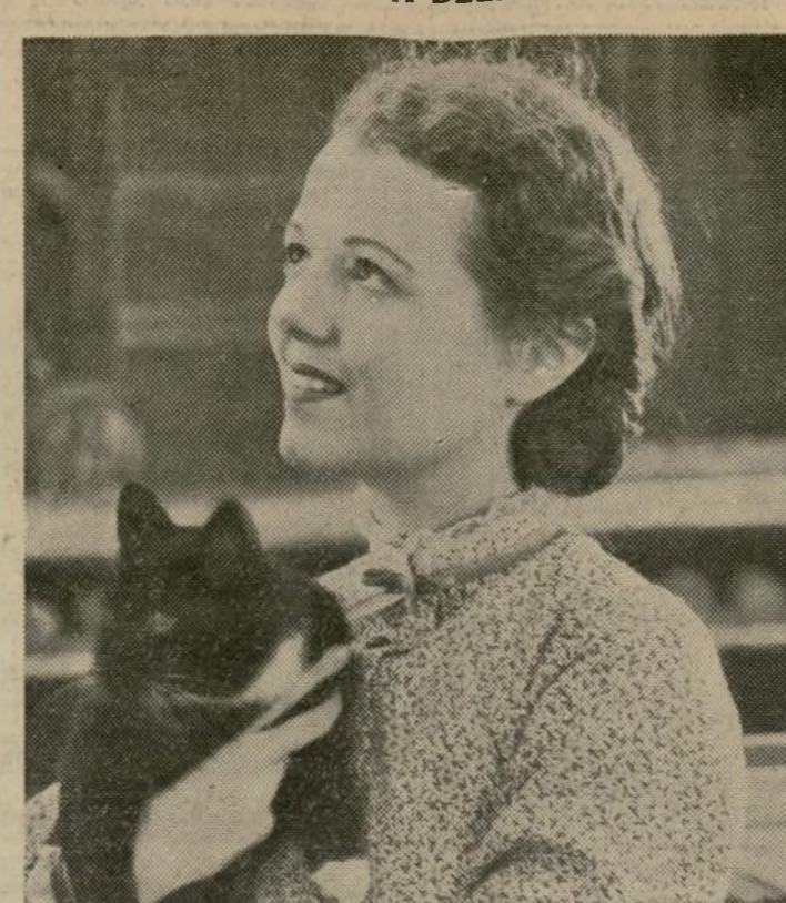
Janet Gaynor, protagonista de la película "The Farmer Takes a Wife", producción de la casa Fox, en una de las escenas de dicha cinta que está considerada como una de sus mejores. Esta película se exhibe en el teatro Regent de la R.K.O.