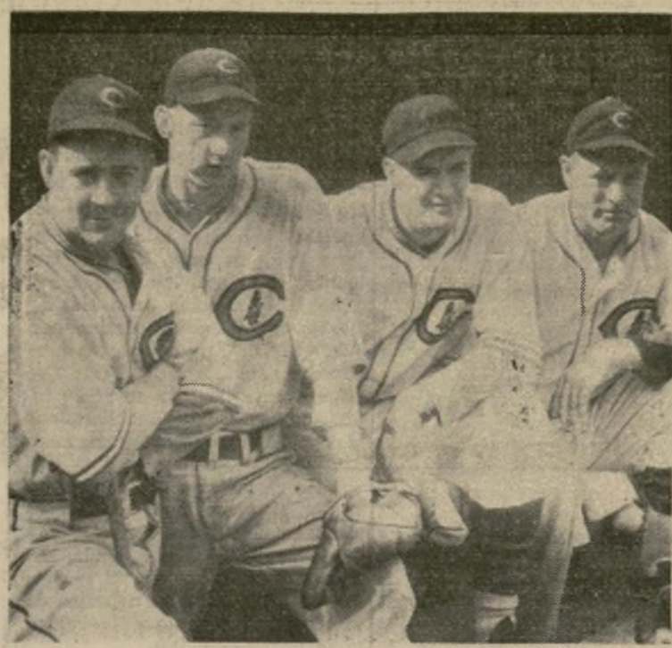
He aquí a cuatro de los factores principalísimos de la marcha triunfal de los Chicago Cubs al primer puesto de la Liga Nacional. Son, de izquierda a derecha: Larry French, Lon Warneke, Bill Lee y Charlie Root.