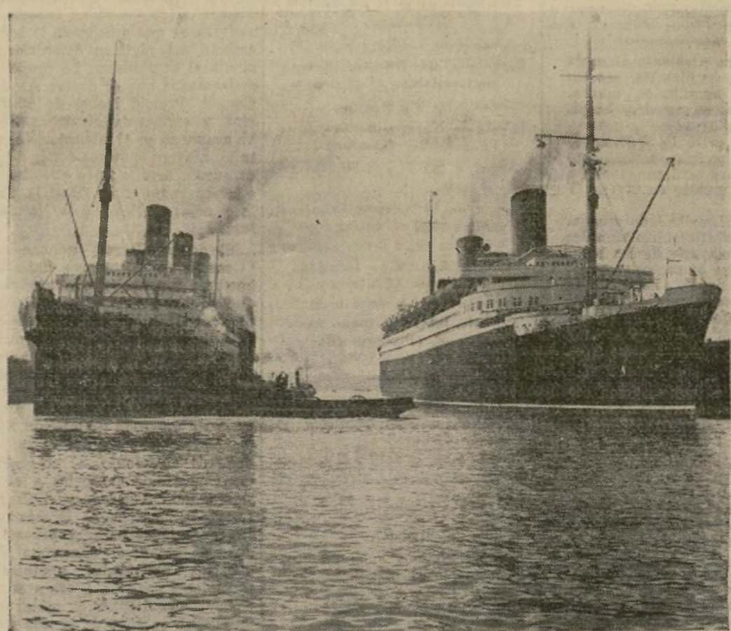
El "Berengaria" (izquierda), que llegó a Southampton desde Nueva York una noche a las 9:30 y zarpó la siguiente mañana a las 11, saliendo del muelle en el puerto inglés. Ocho mil camareros, sobrecargos y estibadores trabajaron toda la noche para hacer posible la salida. A la derecha está el "Bremen".

LLEGA A PUERTO Y ZARPA EN RECORD DE TIEMPO