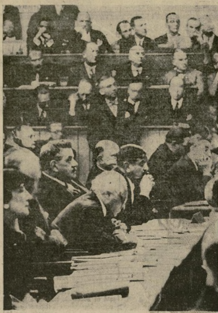
Los delegados franceses a la Liga de las Naciones prestan en Ginebra la mayor atención al discurso del representante de Abisinia cuando contestó a las acusaciones que contra su país lanzó Italia. De izquierda a derecha, en el centro, Paul Boncour, Edouard Herriot y el primer ministro Laval, de todos en la mesa.