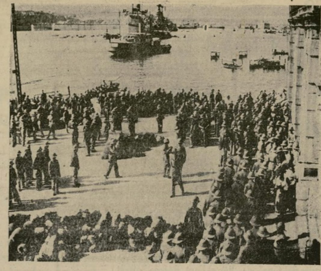
Artillería, ingenieros y cuerpos de señales del ejército imperial británico desembarcan en el puerto de Valetta, Isla de Malta, base naval de gran importancia, considerada como uno de los puntos más estratégicos de la "arteria" vital del imperio.