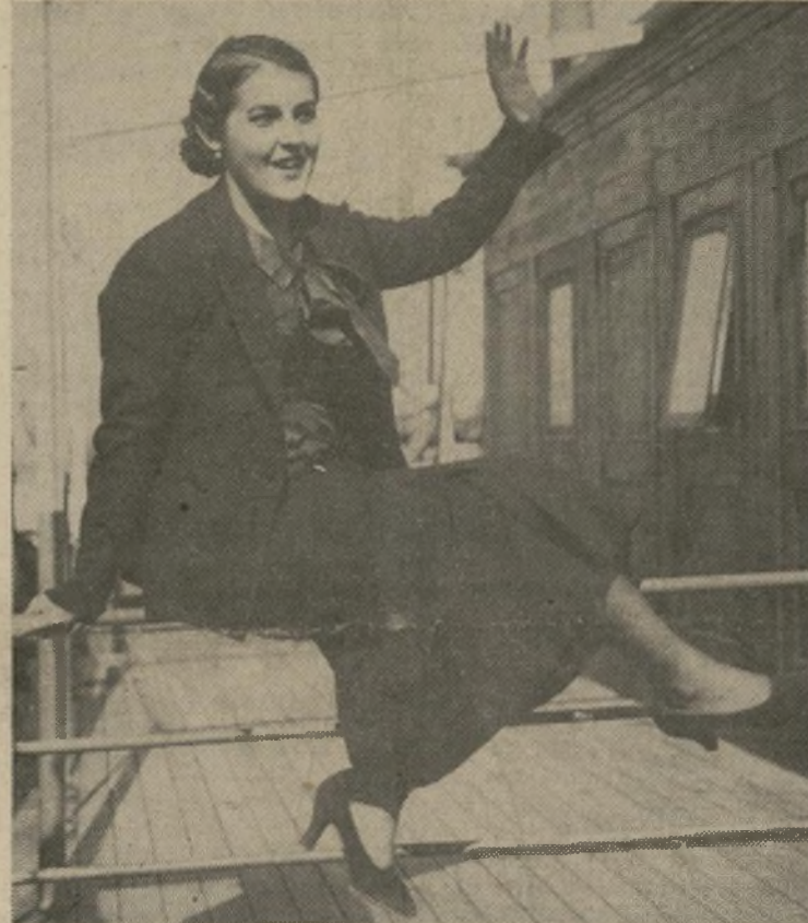
Desea que se relegue a último término el idilio y se juzgue en su mérito el ideal verdadero que originó el vuelo.