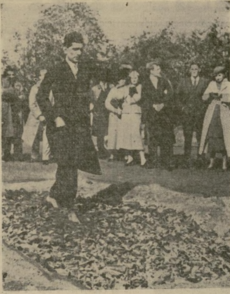
Kuda-Bux, hindú de Cachemira, camina sobre un foso lleno de brasas de carbon vegetal de una temperatura de 800 grados Fahrenheit, en una demostración ante científicos ingleses, del rito de caminar por el fuego que ha sido practicado durante siglos en el Oriente. Un doctor certifica que sus pies no tenían señales de quemaduras después de la demostración.