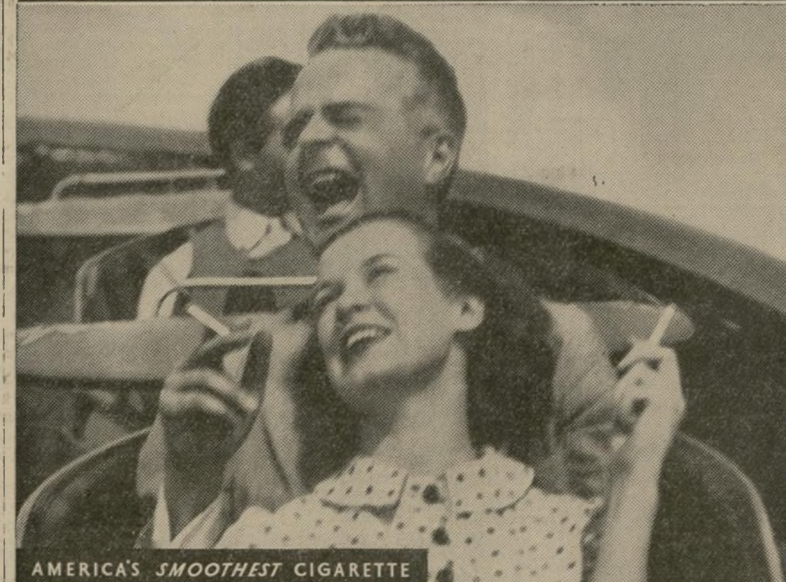
AMERICA'S SMOOTHEST CIGARETTE