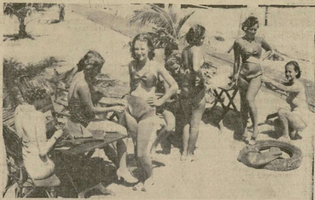
Muchachas visitantes en un club de bañistas de Miami crean una nueva moda de trajes de baño para la estación invernal de Florida, fabricando ellas mismas calzones y brassiers con cámaras viejas de automóviles. Un tubo de suficiente material para dos trajes.