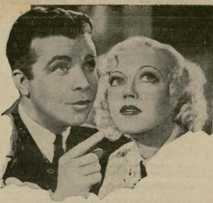
Escena de la película "Page Miss Glory" en la que toman parte Marion Davies y Dick Powell. Esta cinta se exhibe en el teatro Regent de la R.K.O. Es una de las últimas producciones de estos dos astros de la pantalla sonora.