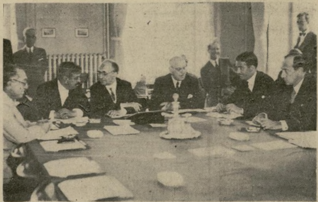
El subcomité de Cinco nombrado para conciliar la cuestión italo-abisinia. De derecha a izquierda: Tewfik Ruchdi Aras, de Turquía; el primer ministro de Francia, Pierre Laval; Salvador de Madariaga, de España, presidente del subcomité; Joseph Avenol, secretario general de la Liga; el capitán Anthony Eden, de Inglaterra; y Josef M. Beck, de Polonia.