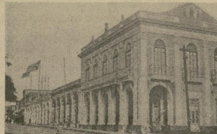
Arriba, edificio del antiguo Casino Español de Cienfuegos; abajo, vista general de la ciudad que más sufrió en el terrible huracán que acaba de azotar el centro de la isla de Cuba.