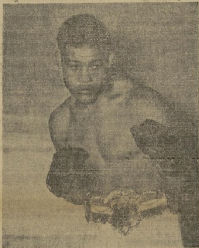
Joe Louis, campeón mundial "heavyweight" de boxeo.