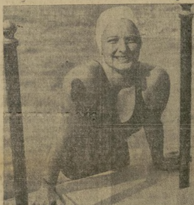
Katherine Rawls, campeona nacional de natación.