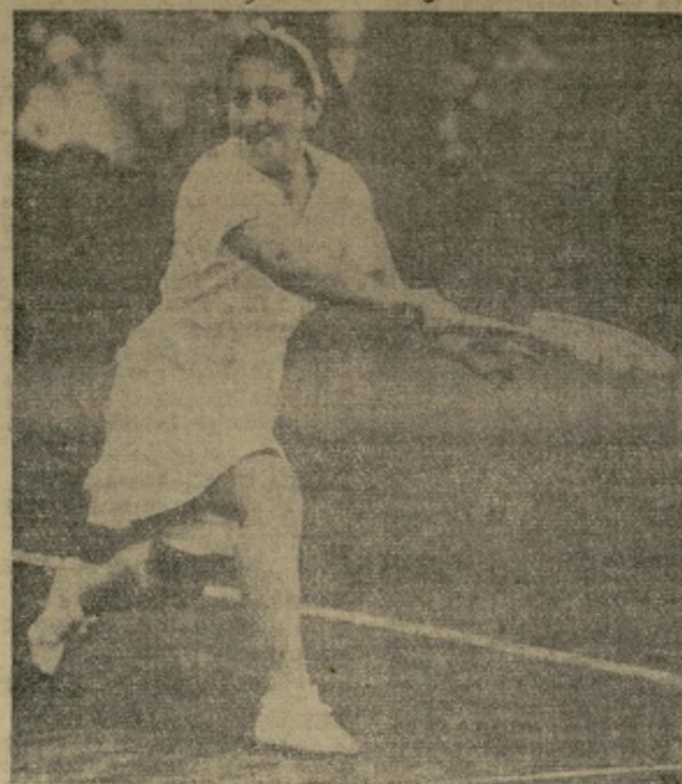
Anita Lizana, campeona mundial de tennis.

GANARON EN 1937 Y PROMETEN REPETIR LA MISMA SUERTE EN 1938