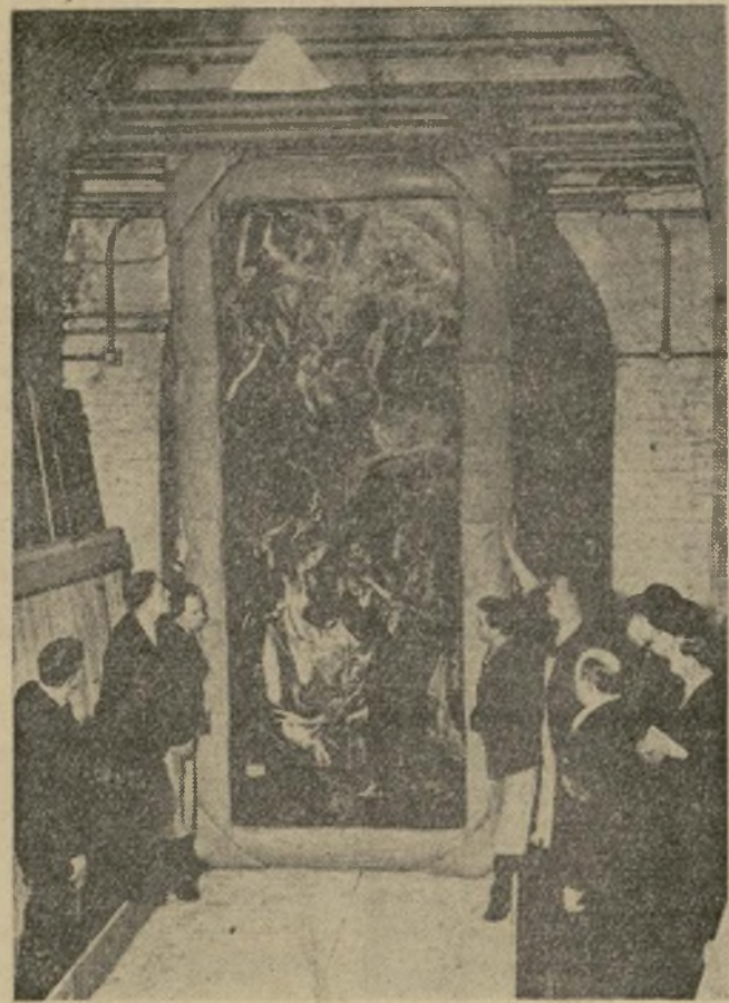
La "Adoración de los Pastores" de El Greco, uno de los cuadros más valiosos del mundo, el cual fué prestado por el rey Carol de Rumania para la exhibición de arte del siglo diez y siete en Londres, al sacarlo de la caja en presencia de una guardia de policía de Scotland Yard.