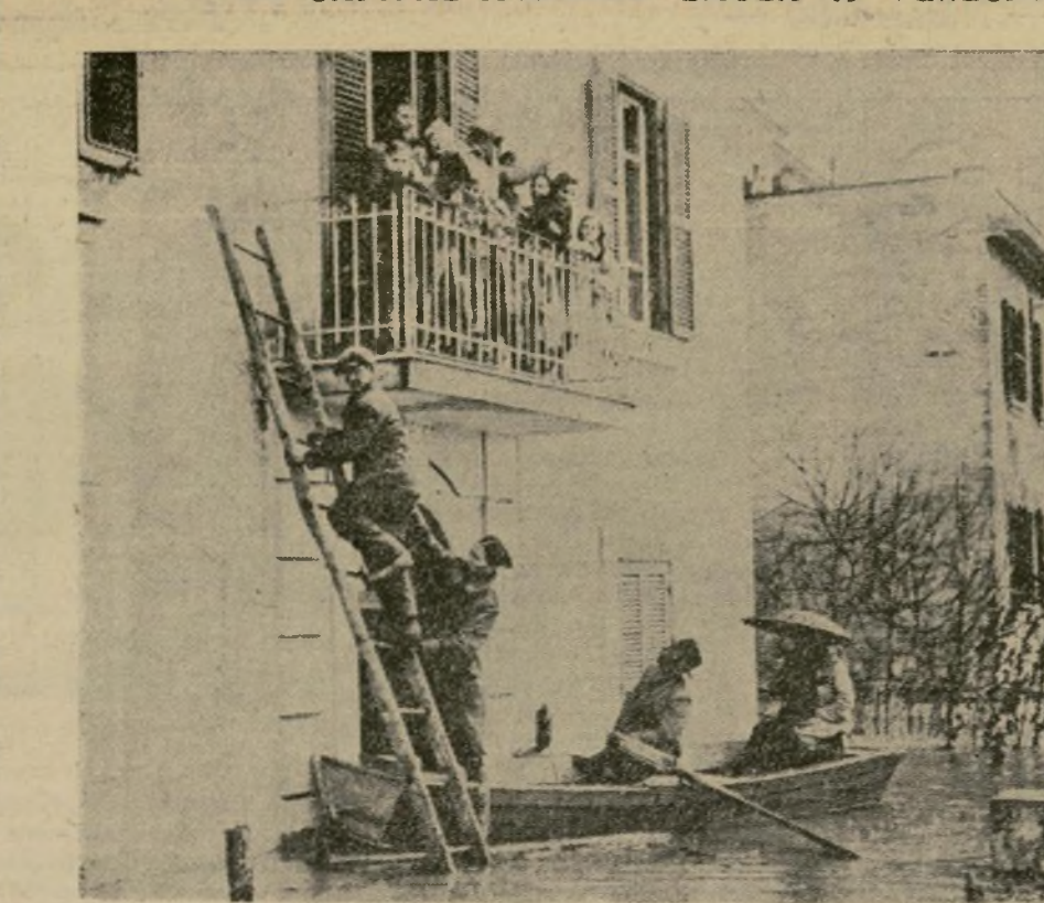
Una cuadrilla voluntaria de rescate llega a remover familias "varadas" en una casa en las afueras de Roma durante la culminación de la inundación más grande en el valle del Tiber en 67 años. Daños a la propiedad de más de $3,000,000 fueron causados por las abultadas aguas del río el cual se elevó a una altura de 55 pies 7 pulgadas en Roma.

La lista cerró, en su mayoría, con alza.