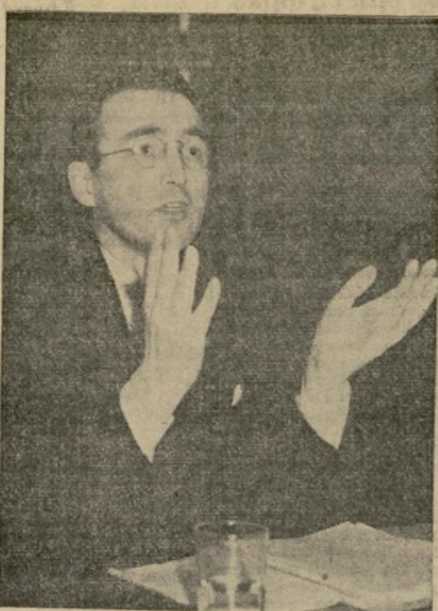
Arthur J. Altmeyer, presidente de la Junta de Seguro Social, declarando ante el Comité Senatorial sobre Socorro y Desempleo. Este dijo que la compensación para cesantes atenuará los efectos de la crisis actual.