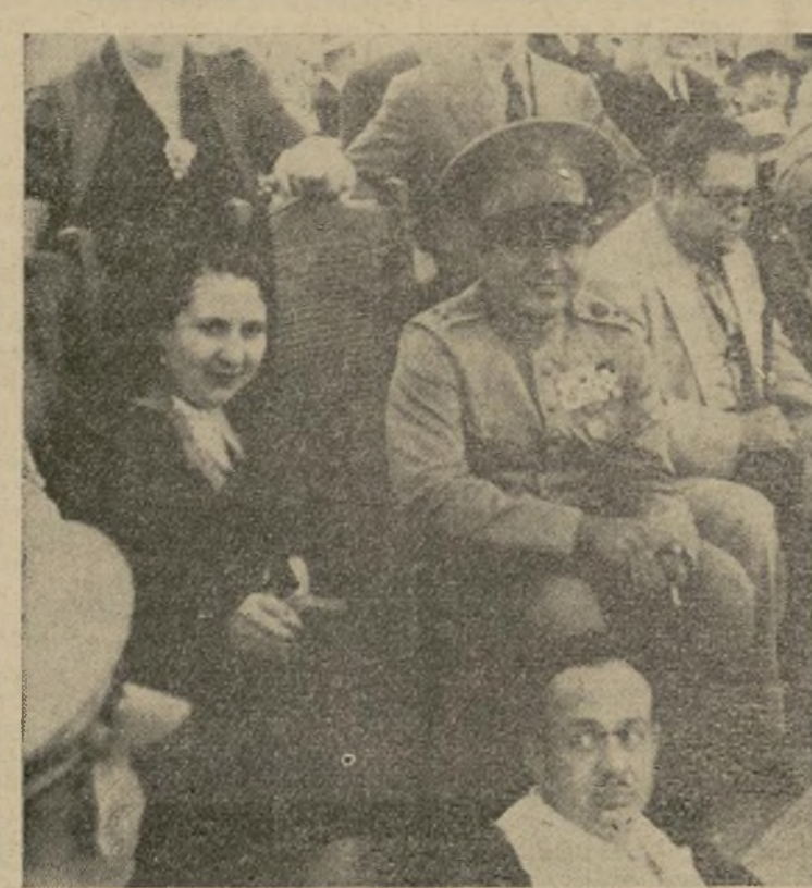
El coronel Fulgencio Batista, "hombre fuerte" de Cuba presencia acompañado de su esposa el primer juego de una serie entre el equipo "del 124" Cuerpo de Artillería de Chicago y el equipo del ejército cubano.