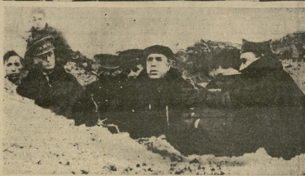
En el grabado superior el general Vicente Rojo, director de la ofensiva leal que conquistó Teruel y 500 millas cuadradas, comenta el resultado de las batallas. En el posterior, Indalecio Prieto, ministro de Defensa observa las operaciones, desde una trinchera helada.