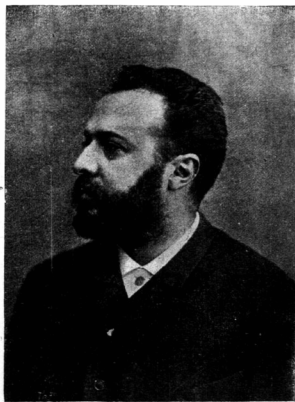
DON JOSÉ ORTEGA MUNILLA