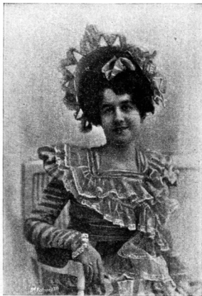
IRONNE LE RICK