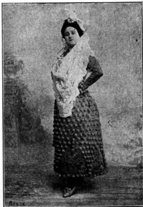
MAT. LD 3 PRETEL