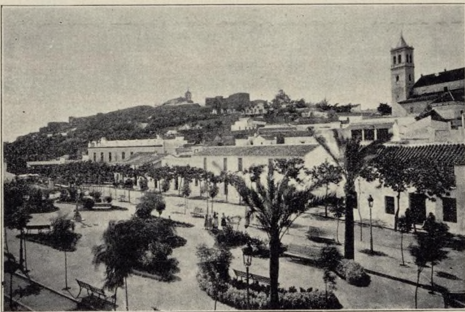
ALCALÁ DE GUADAIRA.—Plaza de Perafán de Rivera