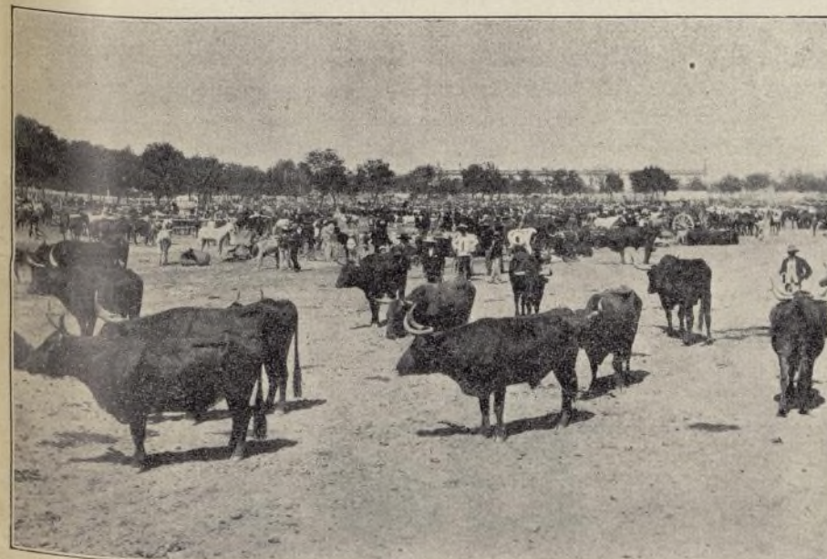
EL GANADO.—Fotografía para "ARCO IRIS"