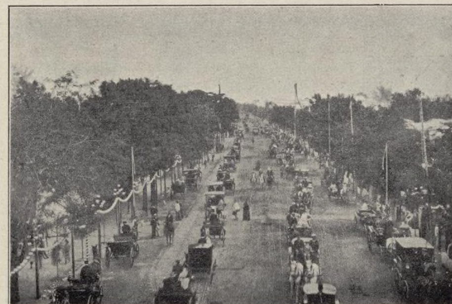
PASEO DE CARRUAJES.—Fotografía para "ARCO IRIS"

En los caballitos la gente menuda se disputa la posesión breve de aquellos nobles animales .