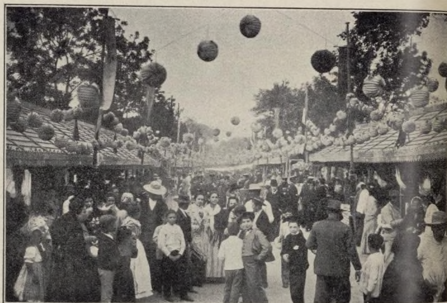
PUESTOS DE AVELLANAS Y TURRON.