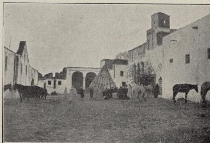
PATIO DE LA ALCAZABA

Gran Camisería.—IDIGORAS H. NOS.—SIERPES, 57.—SEVILLA