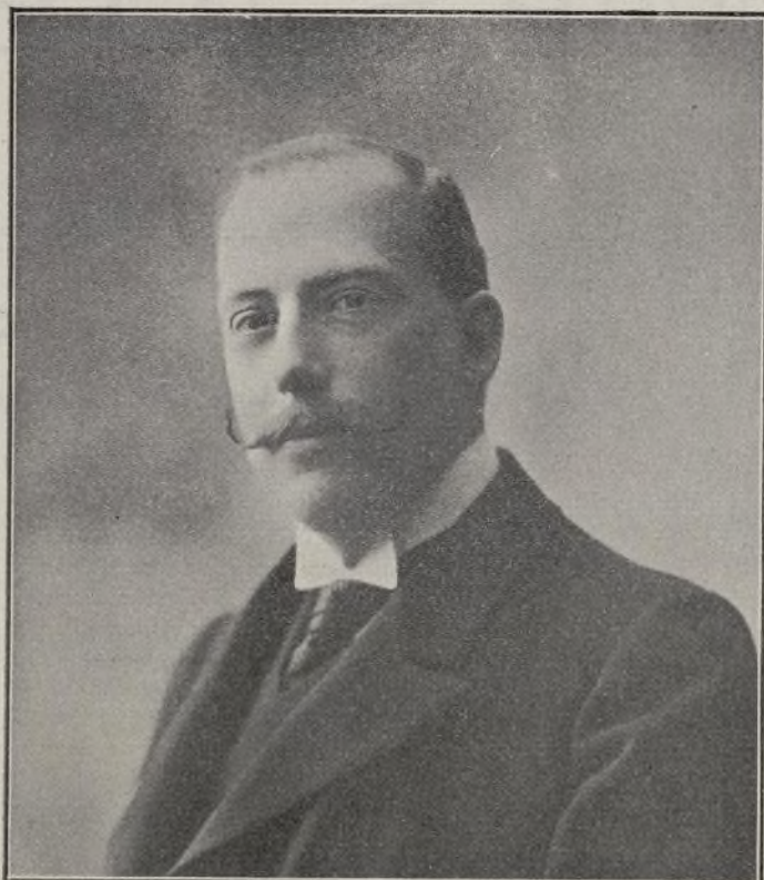
D. TORCUATO LUCA DE TENA Director de "BLANCO Y NEGRO" y "A B C"