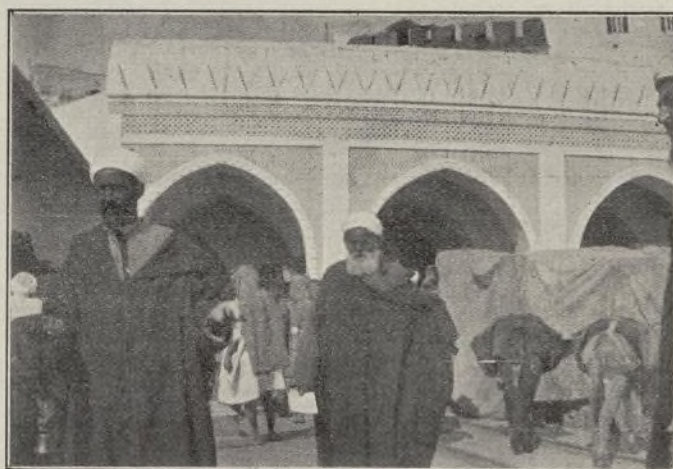
PUERTA DE LA MAR