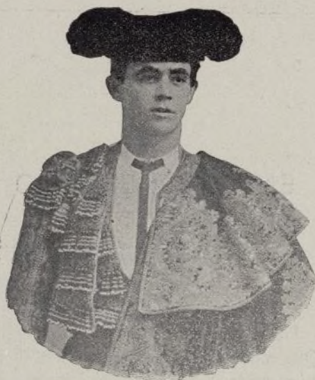
RAFAEL GONZÁLEZ (MACHAQUITO)

En estas páginas daremos á conocer á nuestros lectores el retrato de todos los diestros cuyas fotografías nos sean remitidas, así como las que nos envíen nuestros corresponsales de las corridas que se celebren en España y á nuestro juicio sean dignas de publicidad.