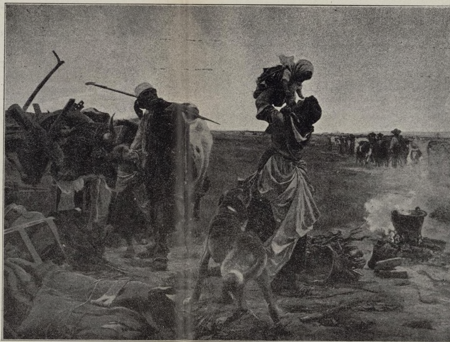
LA VUELTA AL HATO (G. Bilbao)