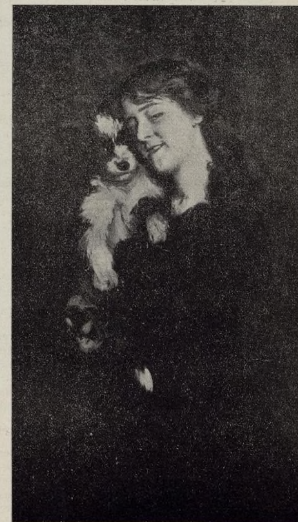
EL FAVORITO (G. Bilbao)

Traslada hábilmente al lienzo las hermosuras de la naturaleza y estas grandes cualidades le hicieron merecedor de dos medallas de 2. a clase y dos de oro en las Exposiciones de Madrid, 3. a y 2. a en los Salones de París, medalla de oro en Berlín, única en Chicago y otra en España, Gran Cruz de Isabel la Católica, Encomienda de Alfonso XII y Cruz de Carlos III.