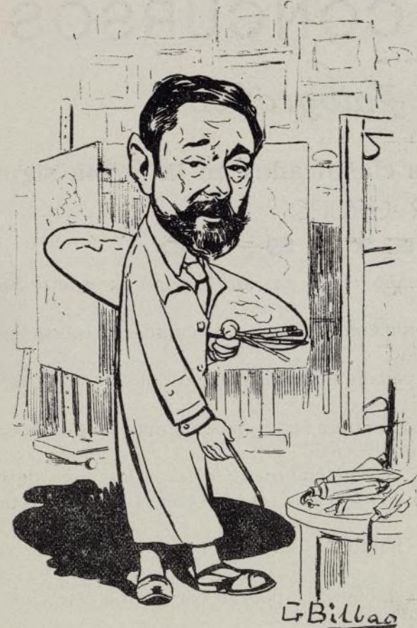
Excmo. Sr. D. Gonzalo Bilbao (Caricatura de Moyano)