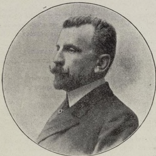
Excmo. Sr. D. Amalio Jimeno Ministro de Instrucción Pública