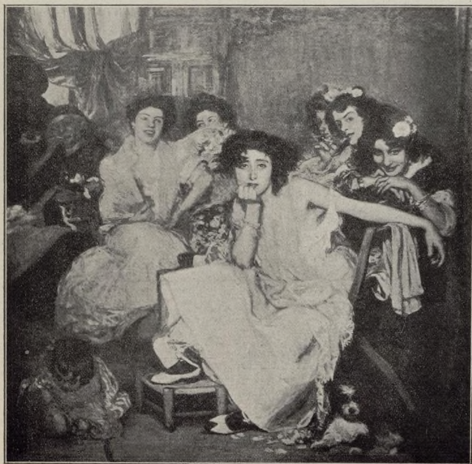
LA ESCLAVA (G. Bilbao)