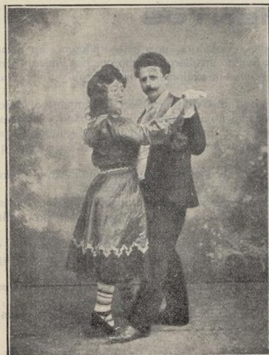
SANZ, con su intrepida bailarina artificial