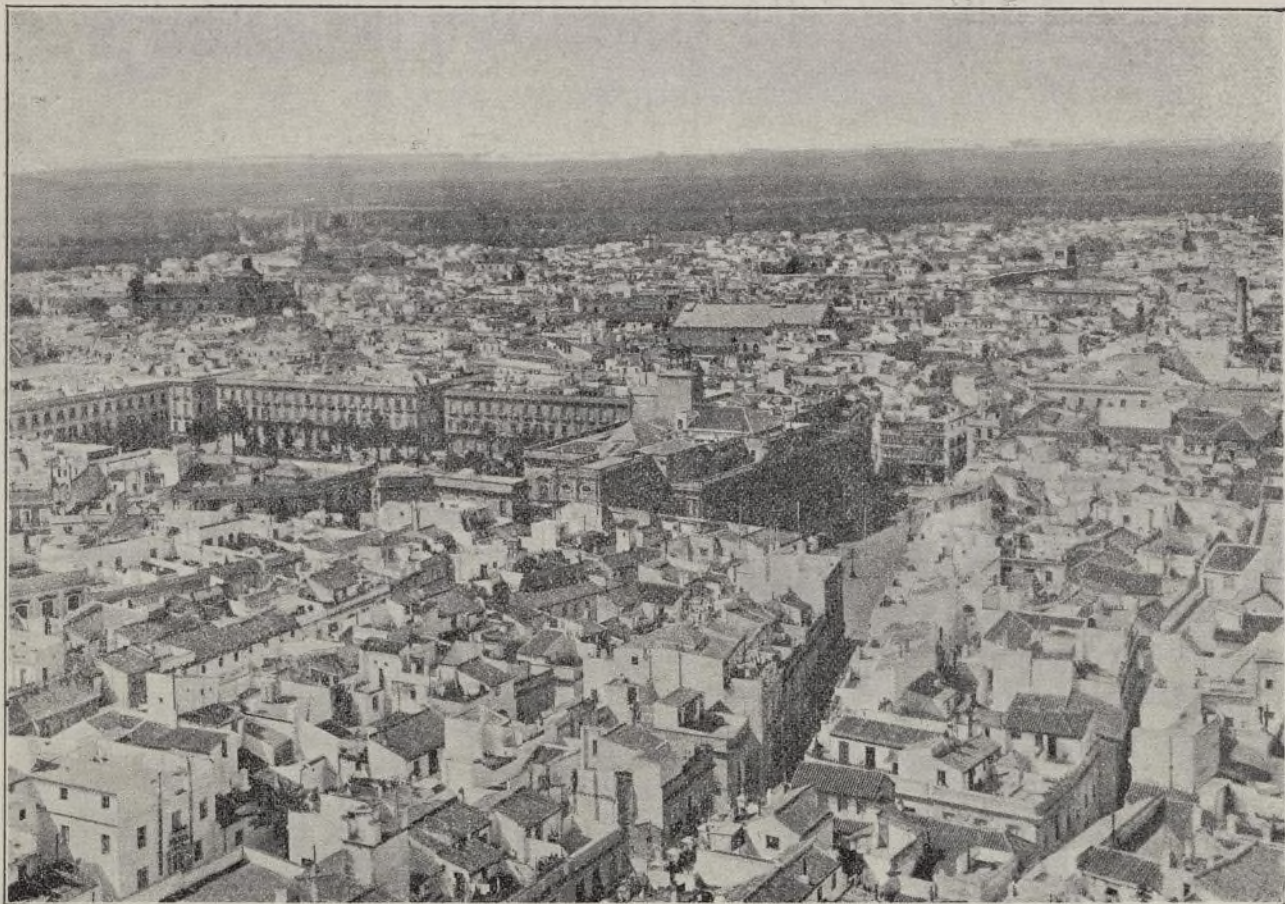
VISTA GENERAL DE SEVILLA