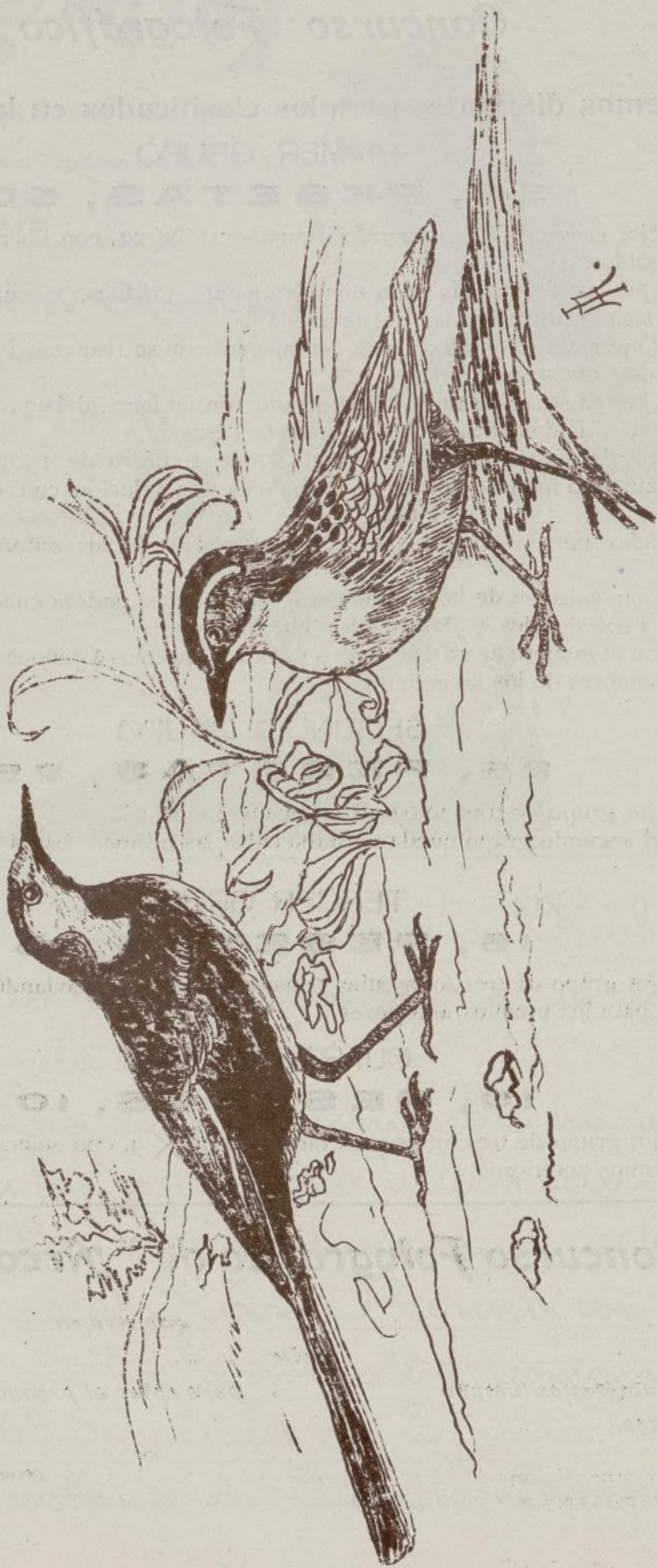
Cayricho para Cojin bordado en seday de color (de encargo)