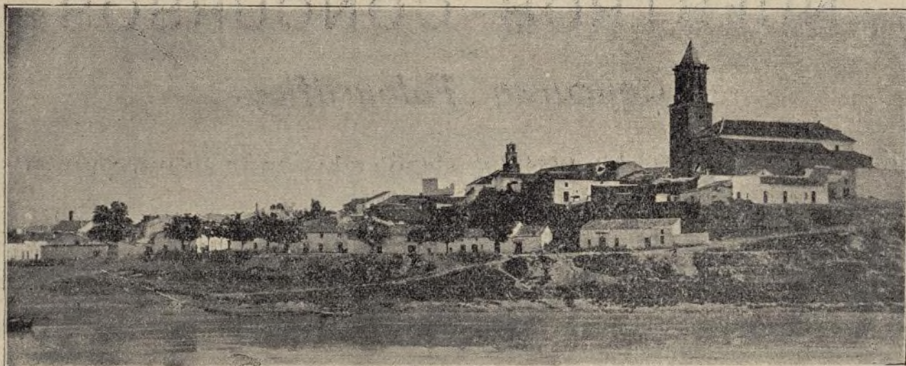
VISTA GENERAL DE CANTILLANA.-SEVILLA