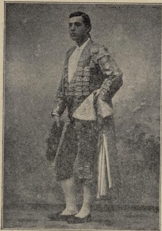
HILARIO GONZALEZ (SERRANITO)