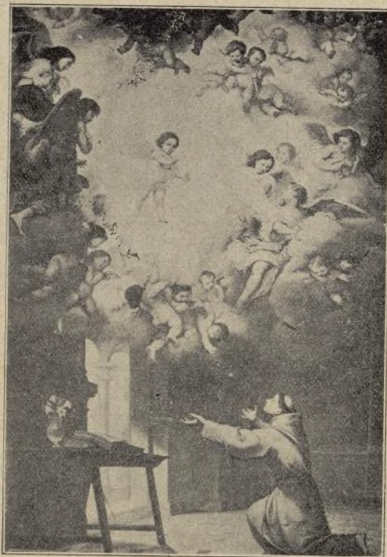
SAN ANTONIO DE MURILLO