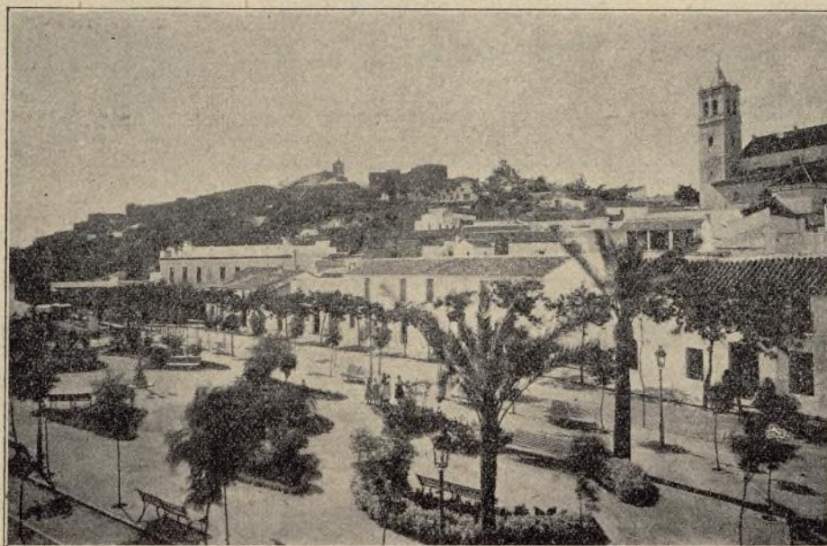
ALCALÁ DE GUADAIRA.—Plaza de Perafán de Rivera