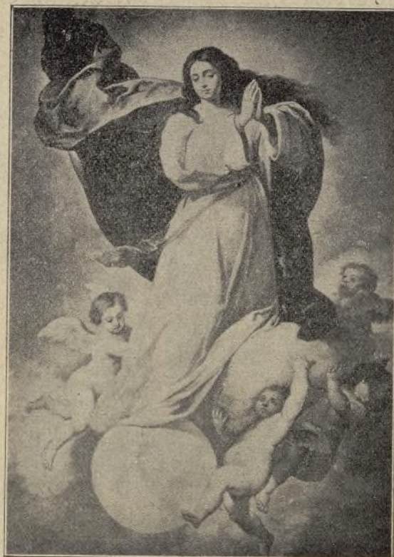
CONCEPCIÓN DE MURILLO