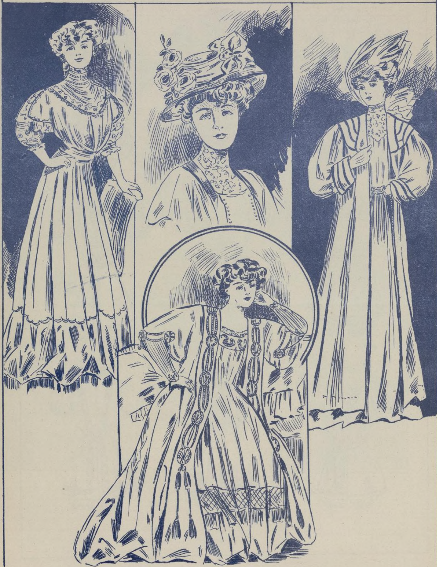
Figurín de la Última Moda de París