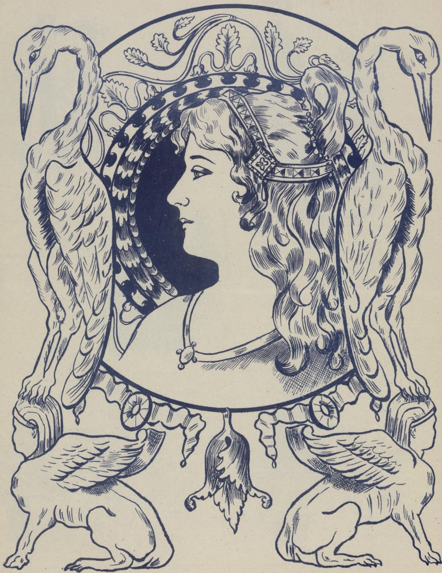
Centro de cojín bordado en sedas de colores