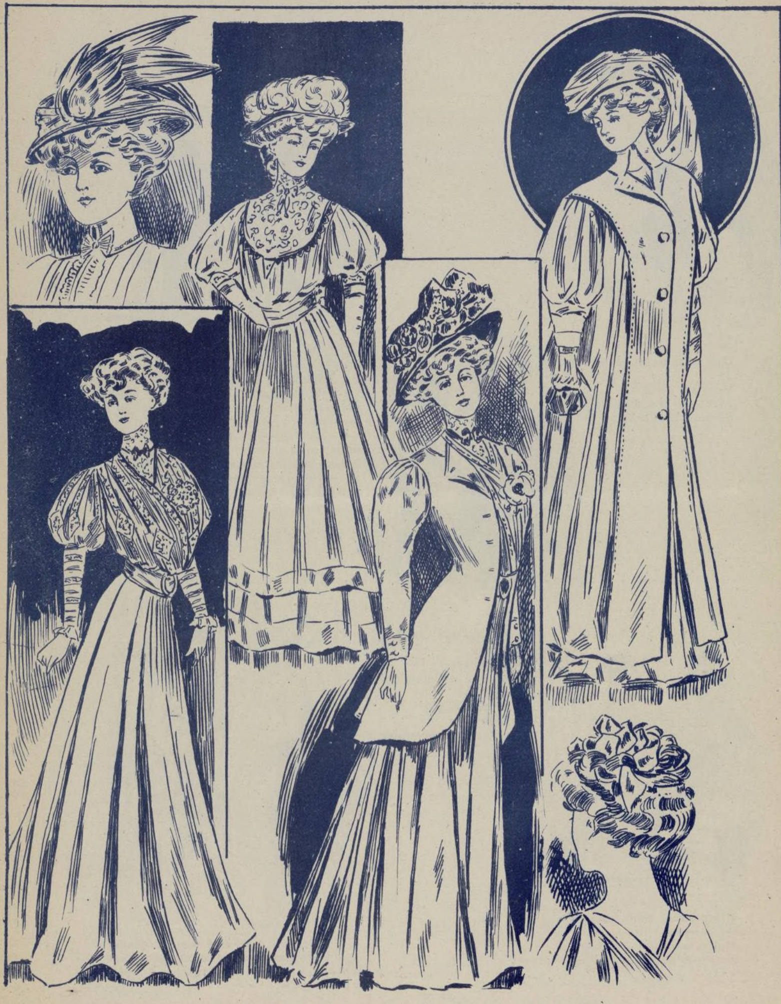
ÚLTIMO FIGURÍN DE PARÍS