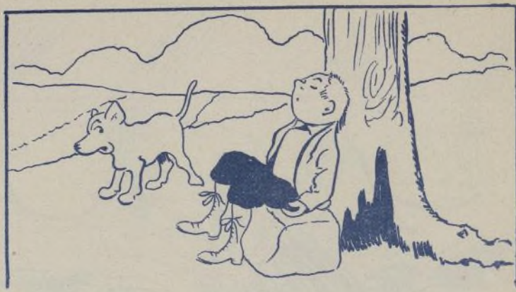
Y esto tenía contrariado al can.