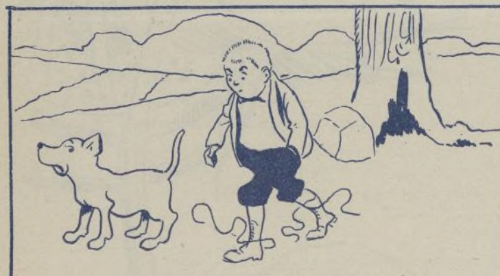
El que al despertar y salir andando.