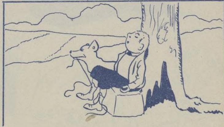
Y puso en práctica su plan deshaciendo el cordón de las botas mientras dormía Juanito.