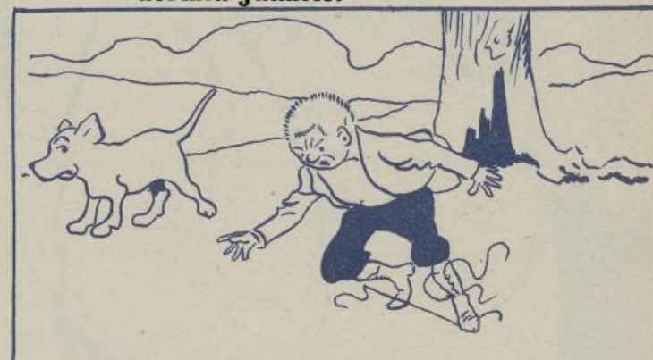
Dió un traspiés peligroso.