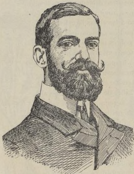
D. Aureliano del Castillo Poeta premiado con la flor natural