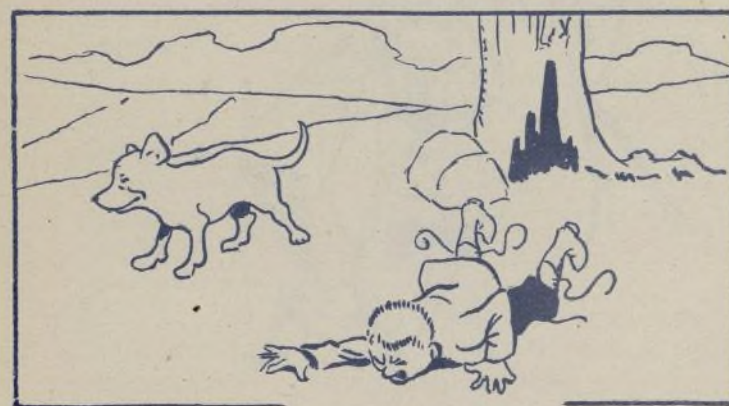
Que le dejó tendido en tierra con la nariz destrozada.