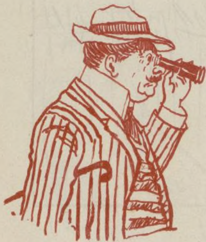
A divertirse en Buena Vista.