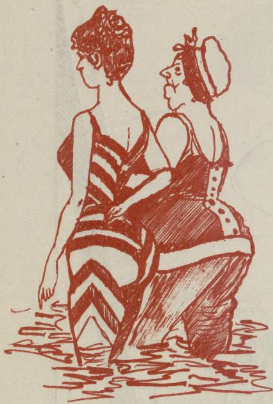
A huir de los acreedores.