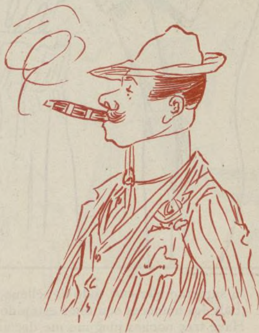
A darla de Lila ó de Tenorio.