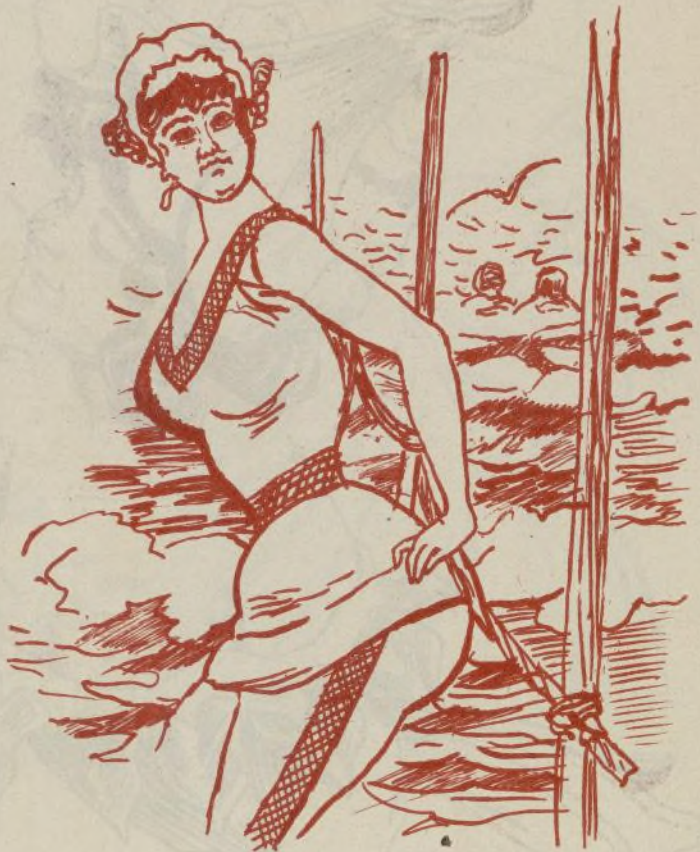
A que la vean en traje acuático.