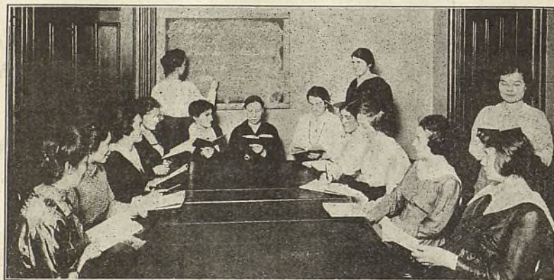
The Y. W. C. A. gives practical lessons in Americanization to foreign Women.