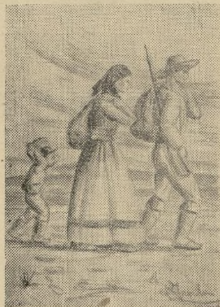
La vuelta al hogar reconquistado.

Suponemos que los tales pertrechos no pertenecerían a una colección de armas antiguas, a las que tan aficionados eran los cristianos del «no matar».