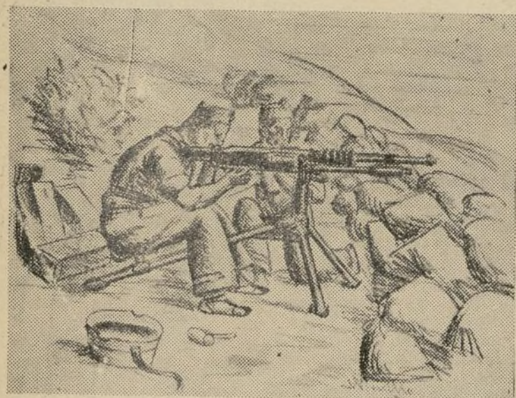
Con esta máquina a la que da vida el corazón del miliciano, puede salvarse toda una columna, teniendo el firme propósito de resistir hasta la muerte.