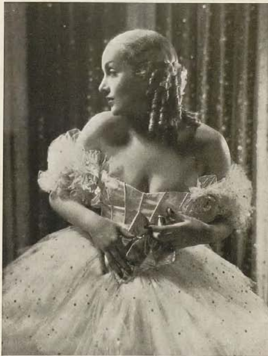
Una foto exquisita de Carole Lombard que actúa de primera dama con el ilustre John Barrymore en el film "20th Century" (La comedia de la vida), de Columbia.

Tras una breve luna de miel, sus negocios