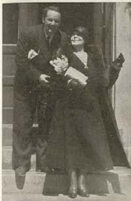
El director Richard Boleslavsky, como buen europeo y hombre de mundo, es galante con las damas. Al ver a Marie Dressler bajando algunos escalones en los estudios MGM, no pudo menos de ofrecerle la ayuda de sus fuertes brazos.

en la pantalla, acaba de suicidarse trágicamente. Soñaba con seguir las huellas de su famosa compatriota. Que esto sirva de lección a las miles de entusiastas que en nuestros países creen fácil lograr alcanzar la gloria cinesca.