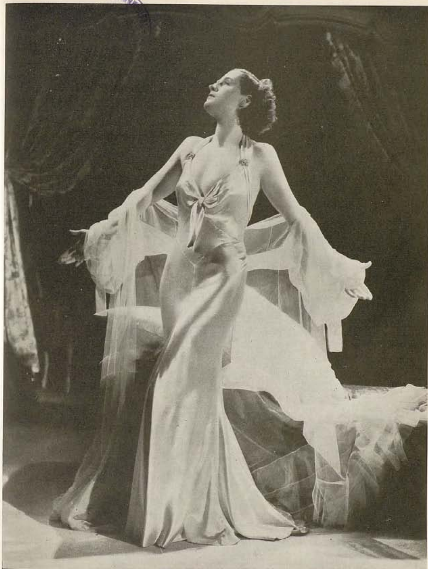
Norma Shearer, destacada estrella del elenco Metro-Goldwyn-Mayer, cuya exquisita labor en la caracterización principal del film "Riptide," ha causado gran sensación en los círculos cinematográficos de este país.