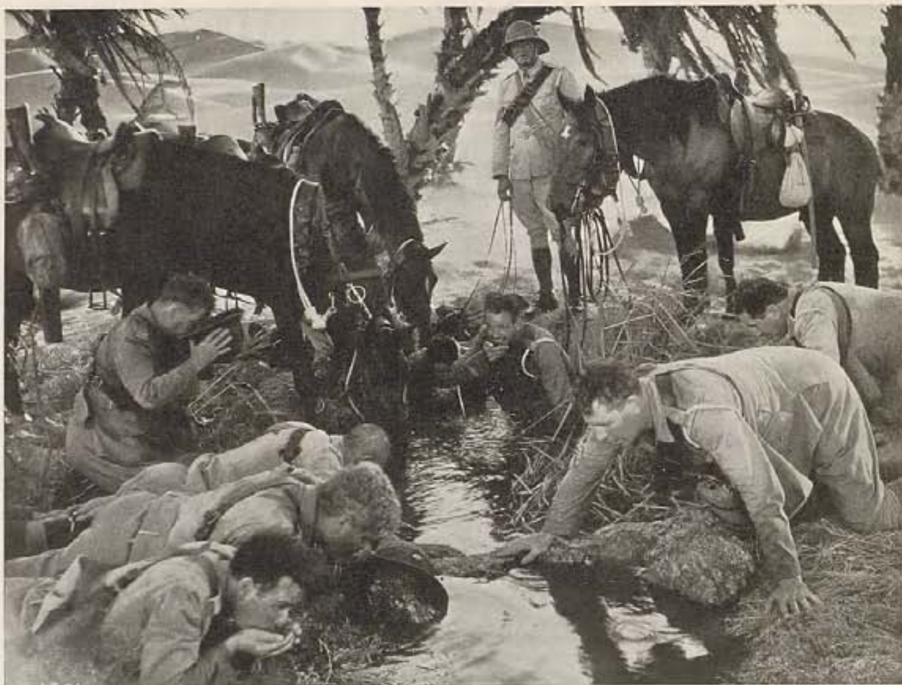
Los sobrevivientes de "La patrulla perdida," hombres y animales, llegan al oasis tan sedientos, que el charco de agua turbia les parece una fuente de exquisita ambrosía. Del film de ese título, producción de RKO.

a estrella de cine, se va sin transición.