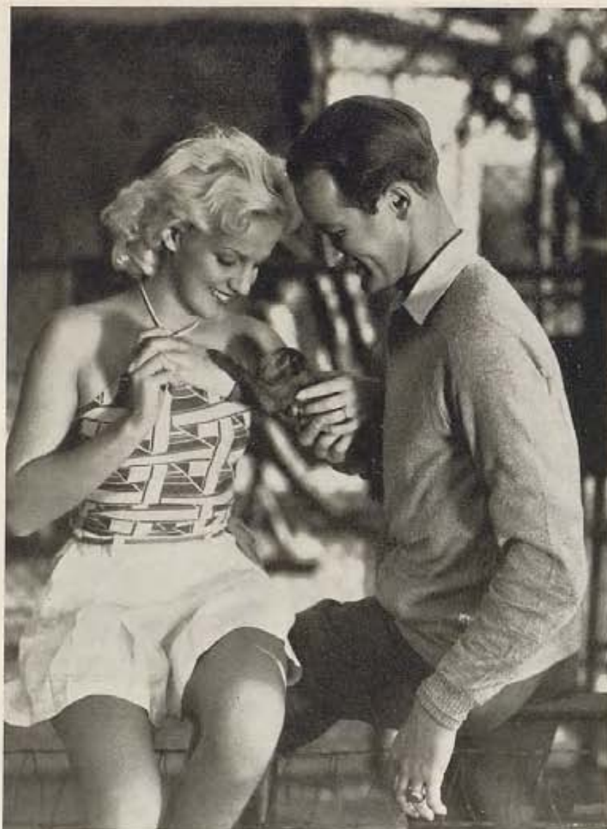
El joven actor Chick Chandler, de los estudios RKO, muestra a una joven amiga suya, la manera de criar a un pequeño mono. Este fué nacido a bordo del vapor que trajo a Frank Buck a su regreso de las Islas Malayas, donde filmó "Wild Cargo," para RKO.

ción una sinceridad expresiva y una bondad de gesto que le permiten conquistarse al público. Sus últimas películas musicales han sido éxitos rotundos y en algunas como en "Going Hollywood," conquistó todos los honores de la jornada a pesar de actuar junto a una estrella tan querida como lo es Marion Davies.