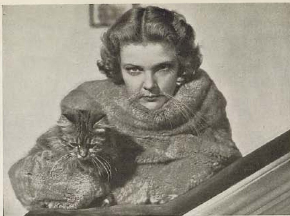
Elissa Landi, como buena gatita que es, tuvo la ocurrencia de retratarse con unos bigotes felinos, comparando así su expresión con la del gato que sostiene en sus brazos y que parece no tenerlas todas consigo