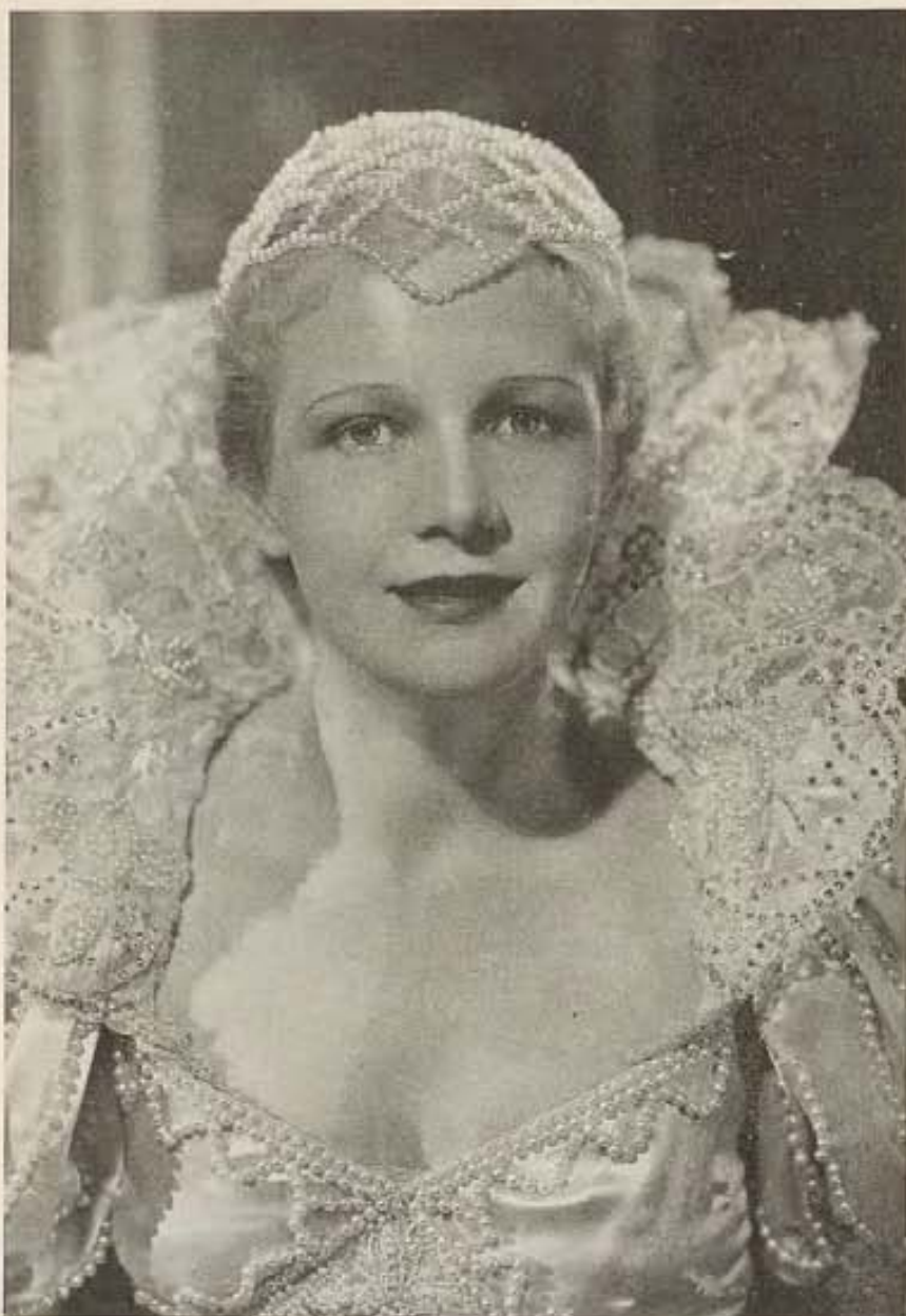
Su Majestad la reina Ana I de Hollywood y de los estudios RKO, en el vestido que usó durante la Fiesta celebrada bajo los auspicios del Club de Artistas Cinematográficos.

mujer una buena colocación en Fox Film Corporation, compañía de la que era estrella.