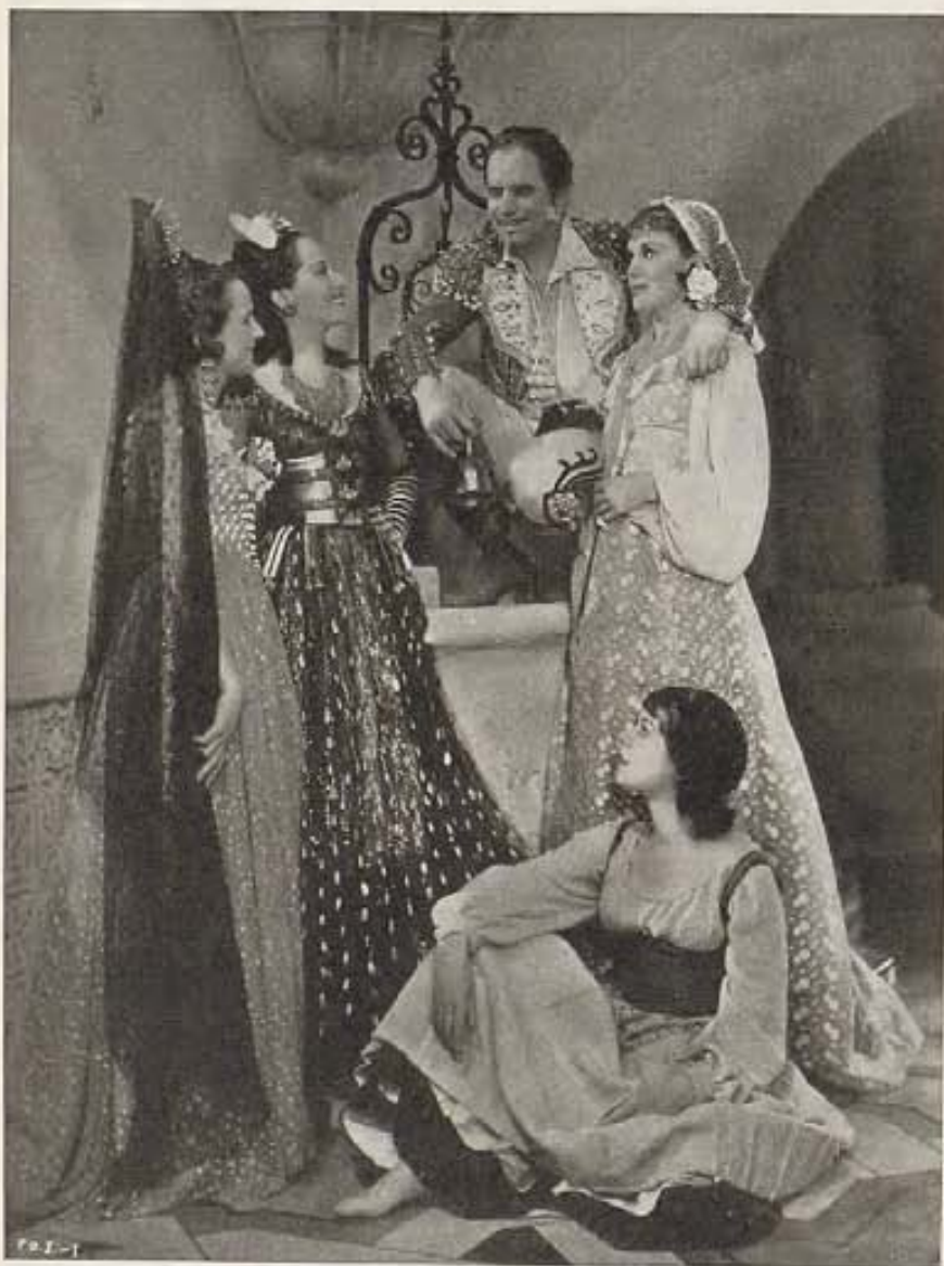
"Don Juan" Fairbanks (padre), se retrata rodeado de cuatro actrices que con él aparecen en el film "La vida privada de Don Juan," producción Artistas Unidos. De izquierda a derecha, Benita Hume, Merle Oberon, Douglas Fairbanks, Joan Gardner y Elsa Lanchester.

Estaba el vencedor de Caseros en campaña. La tropa había llegado a un rancho. Mientras los caballos se revolcaban en las cuerdas secándose las sudaderas con el heno y el estiércol de los corrales, los soldados jugaban a los dados sus modestas soldadas. Tiraba los dados el Sargento Furriel de un regimiento de Urquiza. Este entró inesperadamente y sorprendió al Sargento con los dados en la mano. Imposible esconderlos ni disimular.