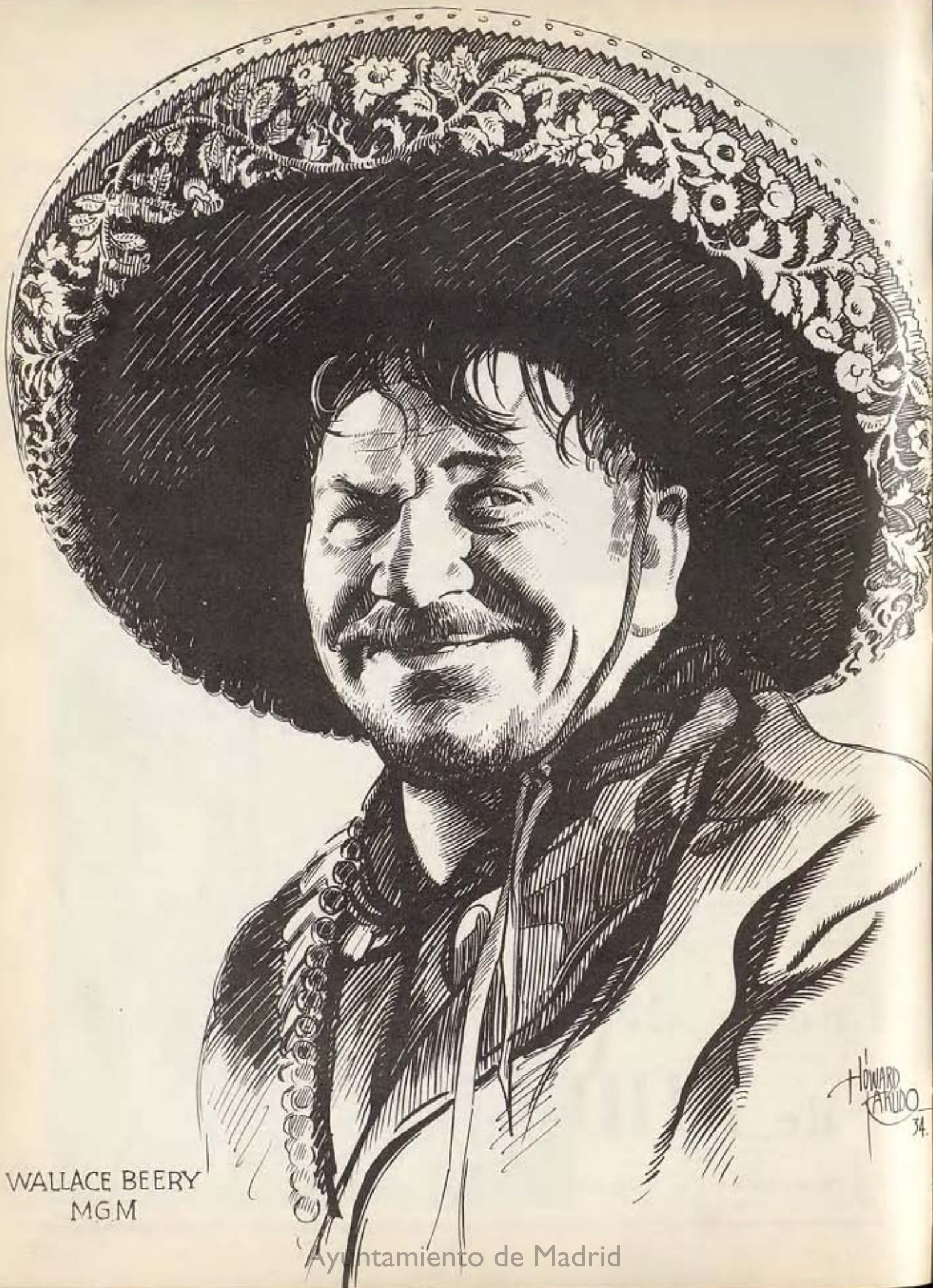
WALLACE BEERY MGM