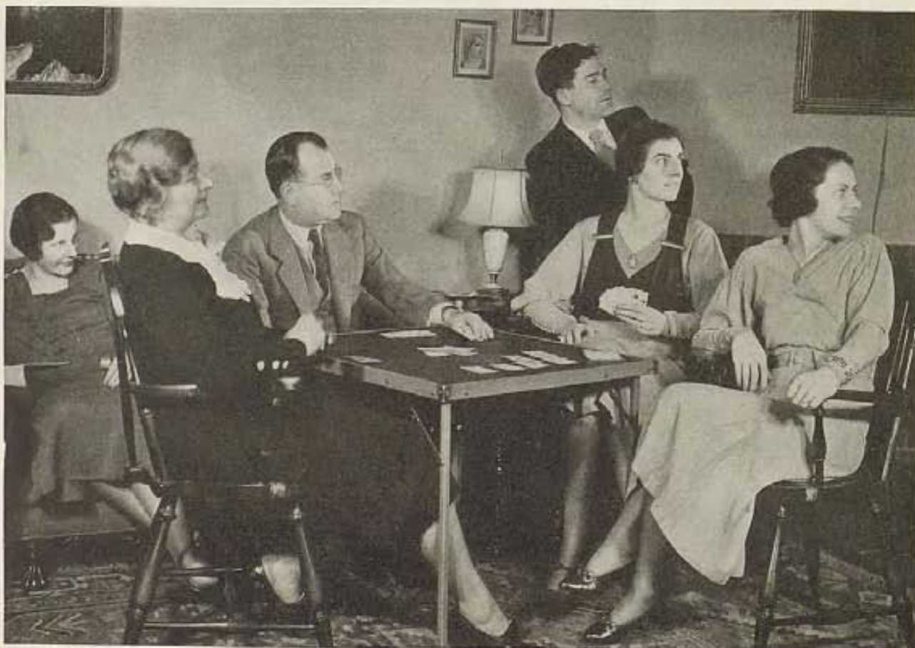
¿Del bridge al cine? Bastará mencionar este último para que empiece "la danza."