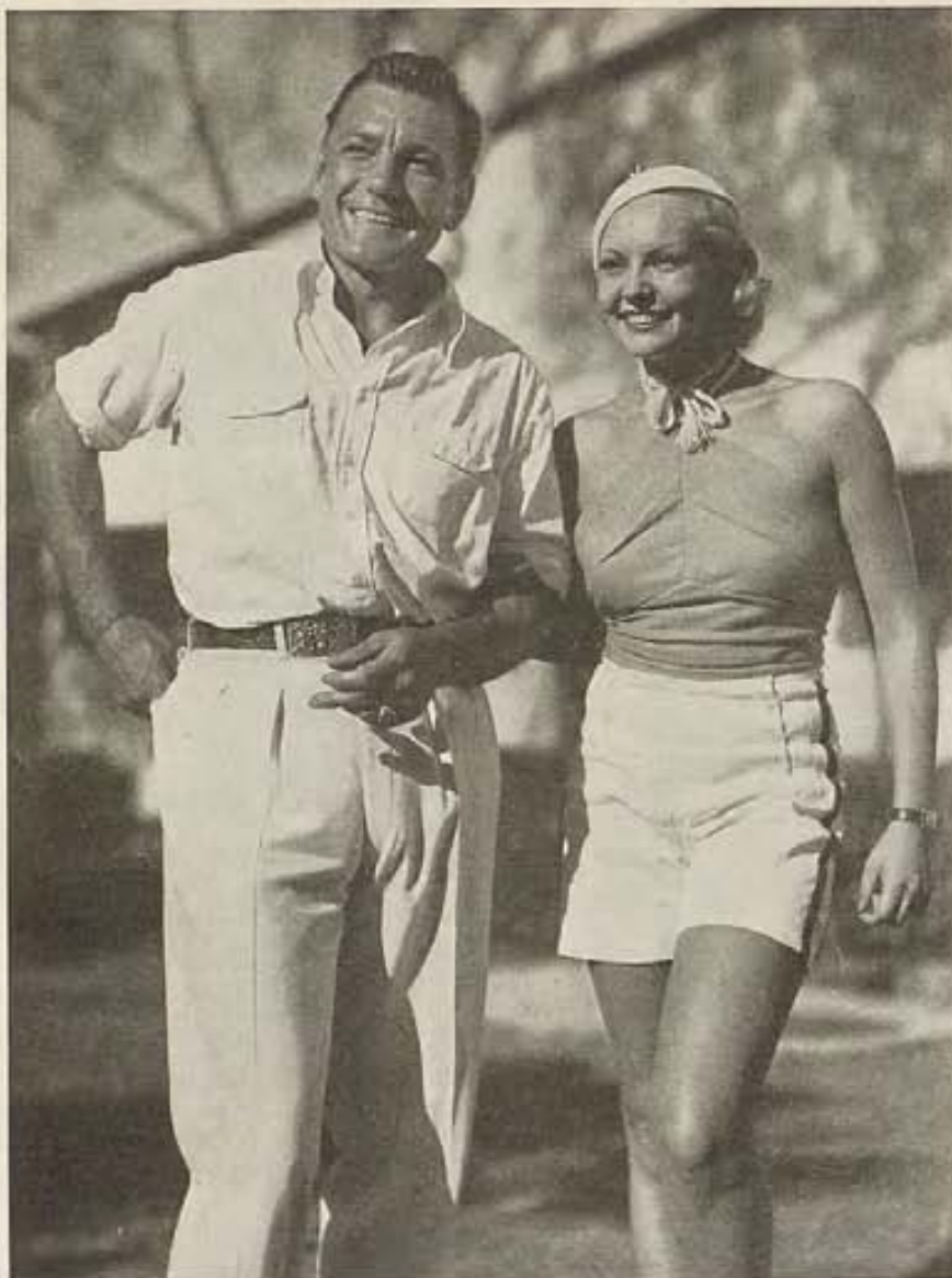
June Knight y Buck Jones, ambos artistas del elenco Universal, muestran con orgullo la piel tostada que en el verano es marca de distinción en Hollywood. June tostó su piel bajo el ardiente sol de la Florida y la negrura de Jones es herencia de sus días de vaquero.

mosos, salvándose apenas unos pocos de ese naufragio artístico que transformó a Hollywood?