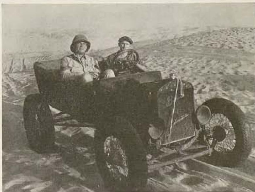
Victor McLaglen, astro del film "The Lost Patrol" (La patrulla perdida) de RKO, emplea este anticuado pero eficiente auto Ford para viajar sobre la arena del gran desierto californiano, durante la filmación de esa película.

ANTILLAS CHILE ECUADOR MEXICO PUERTO RICO HOLANDESAS COLOMBIA EL SALVADOR NICARAGUA REPUBLICA ARGENTINA COSTA RICA GUATEMALA PANAMA DOMINICANA BOLIVIA CUBA HONDURAS PERU URUGUAY BRASIL VENEZUELA ELIZABETH ARDEN • 691 Fifth Ave., Nueva York, E. U. A. LONDRES • PARIS • BERLIN • ROMA