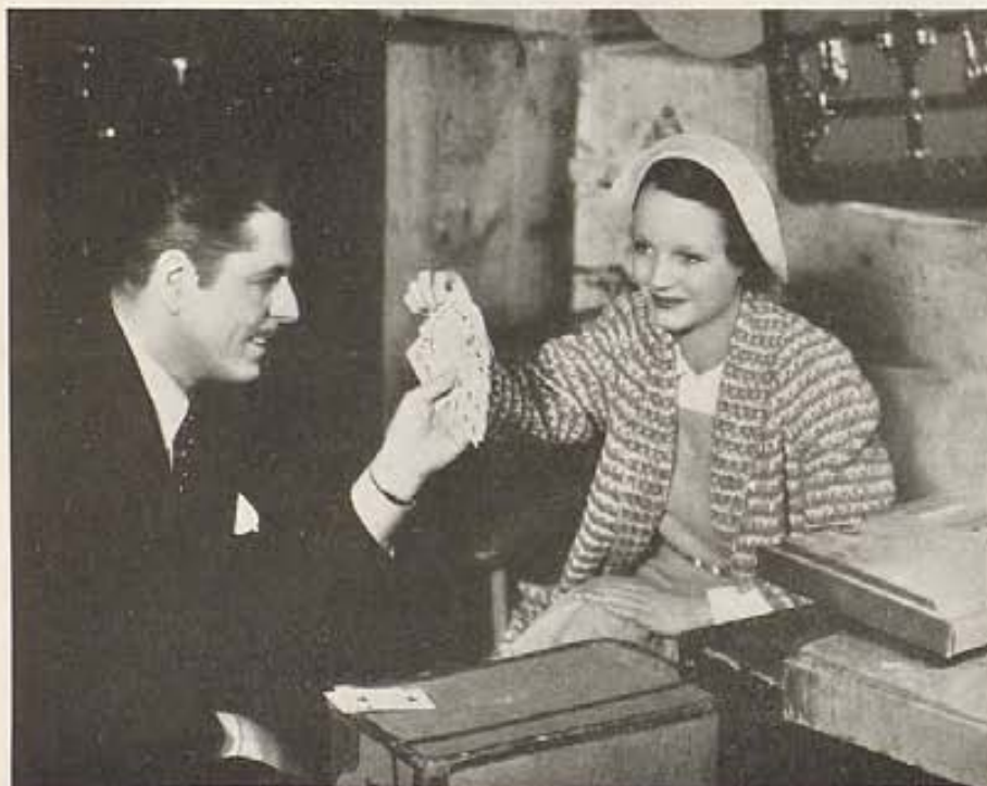
Warner Baxter y Rochelle Hudson se entretienen entre escenas de la película "Too Many Women," de la Fox. Rochelle está demostrando su habilidad en juegos de manos con naipes.

$70,000 dólares más, anualmente, que junto con lo que venía recibiendo forma una suma de seis cifras bastante apetecible.