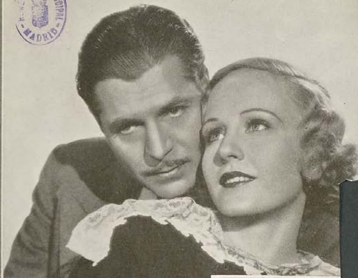
Warner Baxter y Madge Evans forman una simpática pareja en esta foto del film "Stand Up and Cheer," de la Fox.

elementos al cine. La mayoría de ellos han tenido la honradez artística de no abandonar por completo los salones de las difusoras y de volver a ellos de vez en cuando a reanudar su contacto, si así puede llamarse el que tienen con su público de entusiastas escuchas, sin dejar por eso de reconocer las mayores ventajas pecuniarias y de popularización que el cine les ofrece. Y es cierto también que muchos artistas de la pantalla han utilizado y siguen utilizando la radio como un medio muy práctico de dirigirse al público, de vez en cuando, en forma más directa, ya que en sus películas están circunscritos al asunto del libreto.