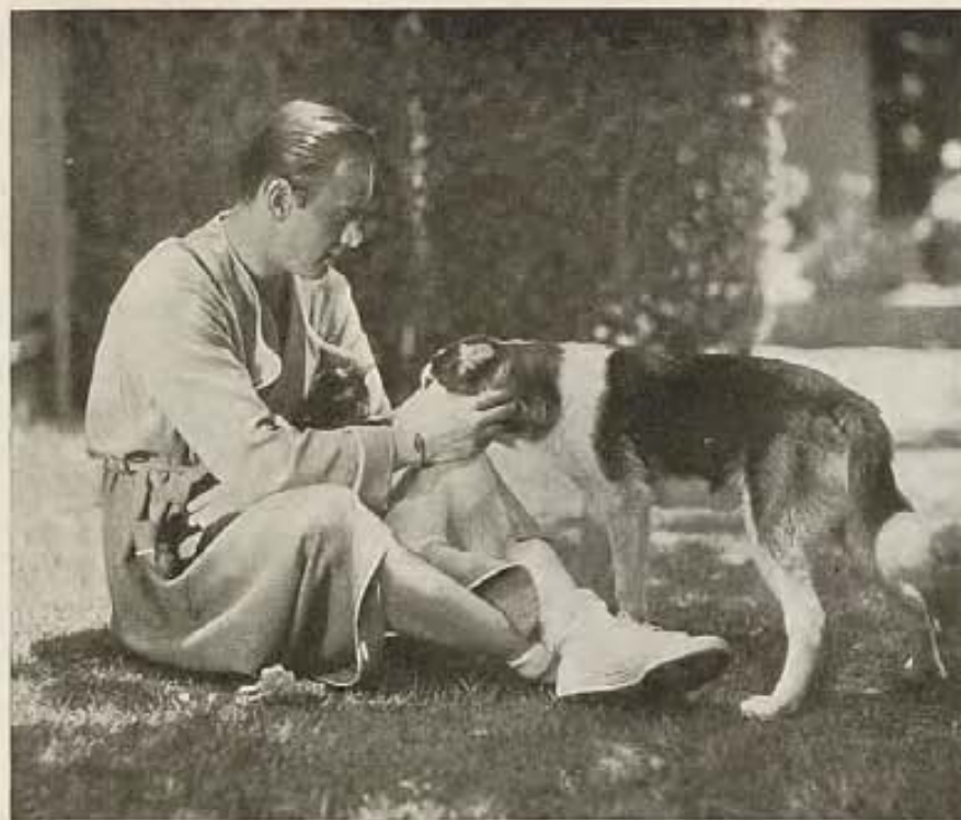
Russ Colombo, artista de la empresa Universal y favorito de millones de radioescuchas de Estados Unidos, está feliz con su nuevo perro, regalo de la madre de Carole Lombard.

Rogers y James Gleason, recibiendo de manos de Carole Lombard una gran copa, después de haber derrotado al team de polo compuesto por Darryl Zanuck, Hal Roach, Walter Disney y Roy Disney, en el campo del Riviera Country Club . . . Joan Crawford y Franchot Tone bailando en el Coconut Grove del Hotel Ambassador . . . Jean Harlow, acompañada de su madre, jugando golf en los links del Country Club . . . Gilbert Roland y Constance Bennett jugando una partida de tennis en la residencia de la segunda en Beverly Hills . . . Clark Gable haciendo compras en un almacén de Hollywood y preparándose para una excursión a las montañas . . . Greta Garbo y Rouben Mamoulian bogando tranquilamente en el Lago Arrowhead, sin ser la estrella sueca reconocida por nadie . . .