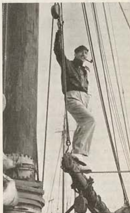
Warren William sale de vacaciones a bordo de su yate, después de una temporada de trabajo en que filmó no menos de ocho películas en corto espacio de tiempo. Acaba de filmar "Dragon Murder Case" en los estudios Warner, donde está contratado.

CHARLES LAUGHTON , el famoso actor inglés que ganase el codiciado título del mejor actor cinematográfico de 1933, acaba de llegar a Hollywood, procedente de Inglaterra, a reanudar su carrera cinematográfica. Actuará junto a Norma Shearer en la película "Barretts of Wimpole Street," para los estudios Metro-Goldwyn-Mayer.