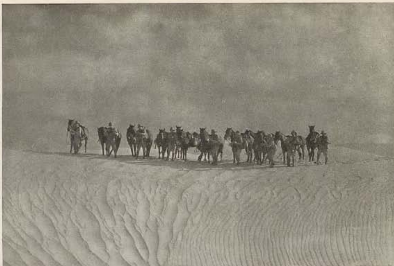
La Patrulla Perdida se detiene un momento en medio del desierto a confrontar al enemigo invisible que uno a uno va matando a los miembros de la patrulla. Un momento emocionante del film de ese título, producción de RKO.