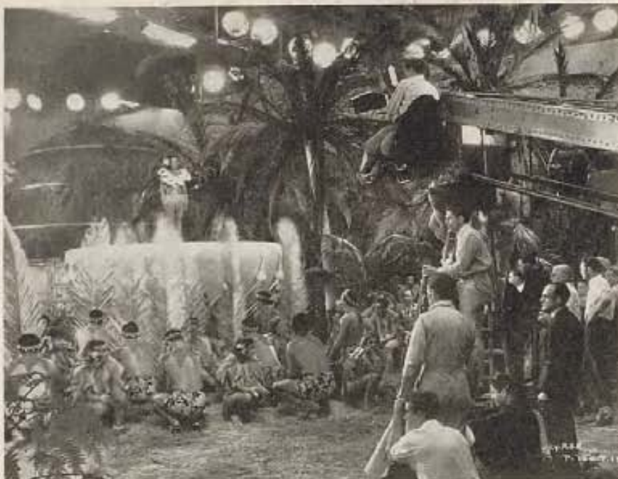
Este ambiente indigena de las islas hawaianas, fué "fabricado" en un estudio californiano, y cuando se vea en la pantalla resultará enteramente convincente. Del film "Down to Their Last Yacht," de la RKO.