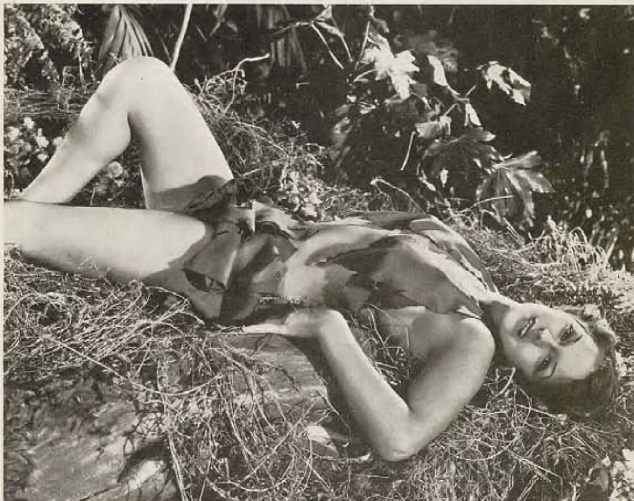
Esta belleza anónima es una bailarina del film musical "Down to Their Last Yacht," de RKO, en el que toman parte Sidney Fox, Mary Boland y Polly Moran.

UN popular galán se estaba aprovechando de una ligera operación a que ha debido someterse—y de la cual está ya restablecido—para burlar la celosa vigilancia de su esposa. Y a pesar de haber sido dado de alta sigue en el hospital, convaleciendo . . . durante el día, pues que de noche se va a divertir a los cabarets. Pero el ardid casi terminó en tragedia, cuando la otra noche marido y mujer se encontraron a boca de jarro en el mismo sitio, él con una estrellita y ella con un leading-man .