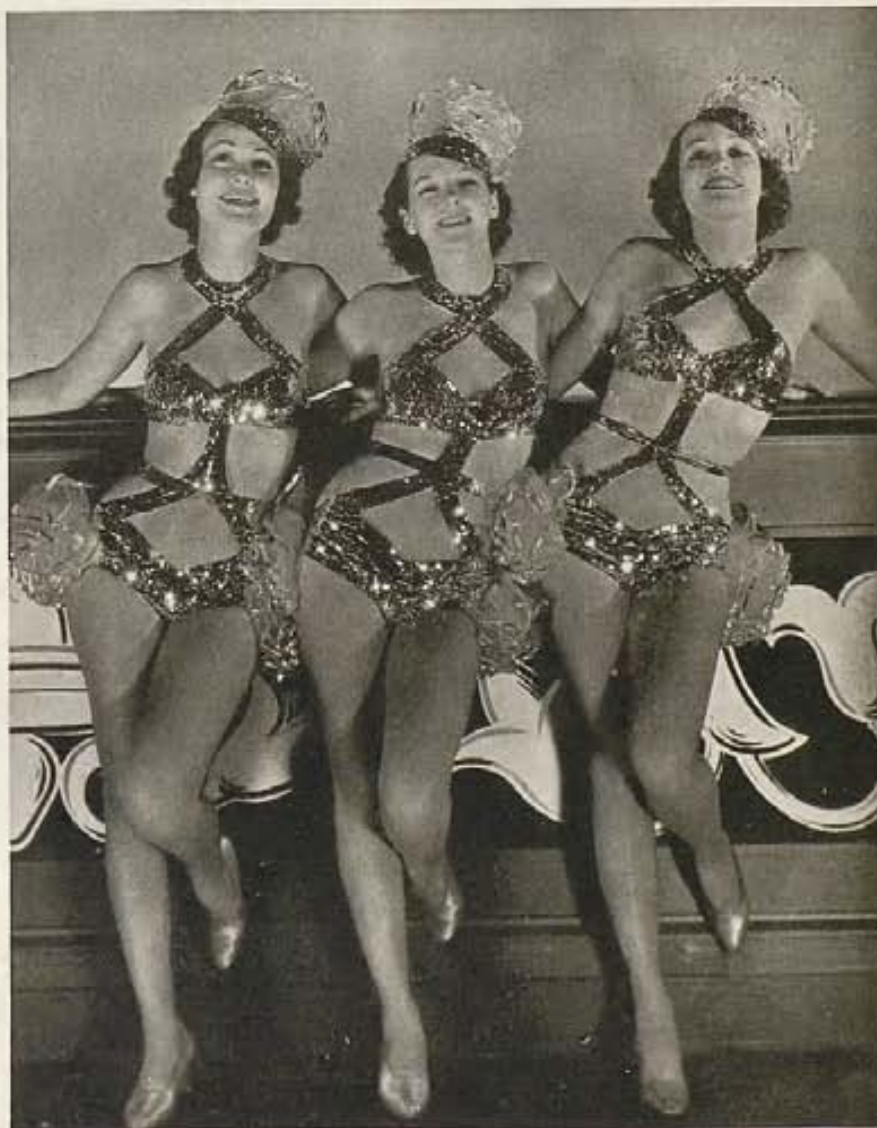
Este terno de lindas chicas son tan parecidas, que difícil sería distinguirlas aparte. Las tres tomaron parte en la revista musical "Hollywood Party," de MGM.