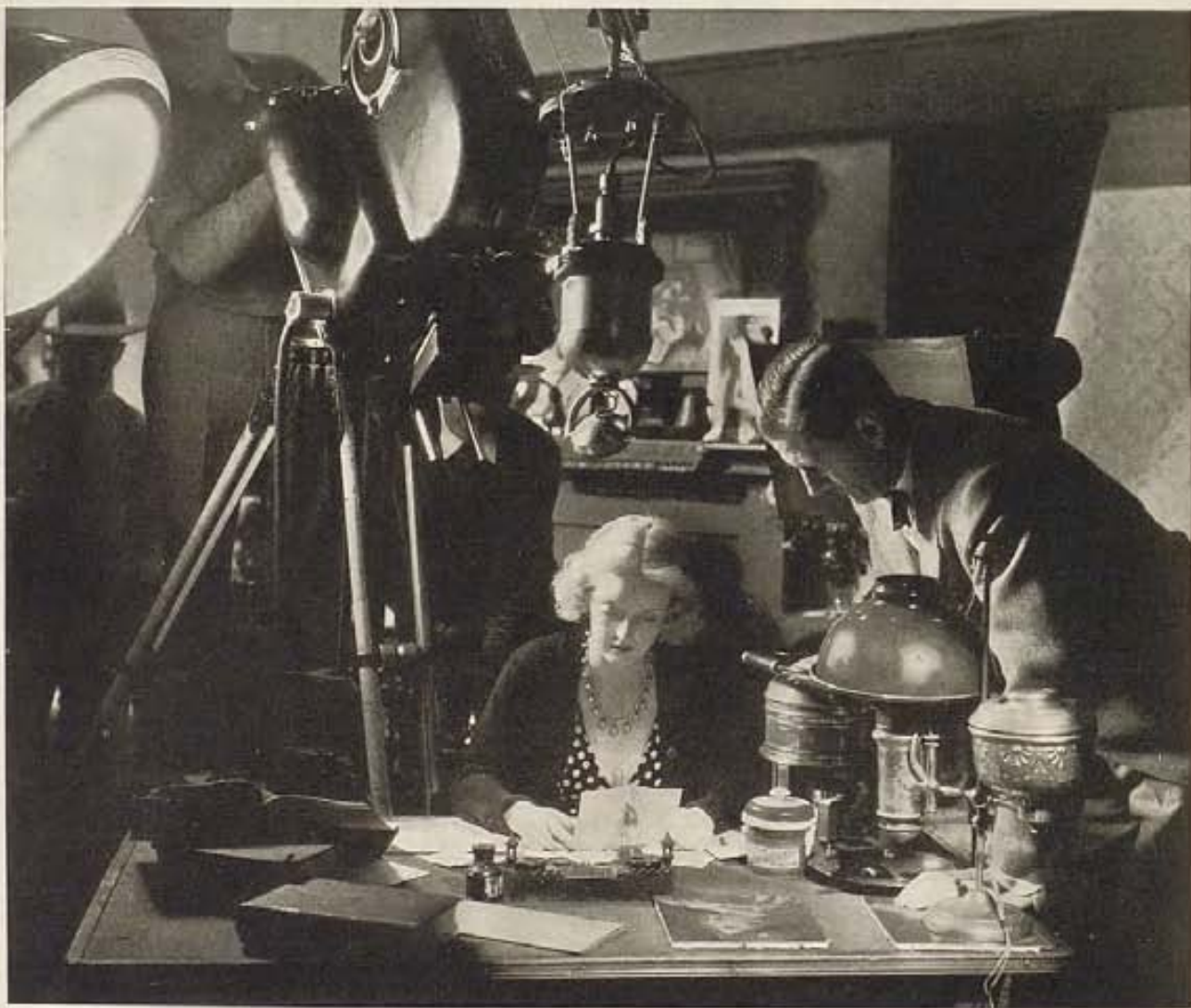
El director John Cromwell dirige el ensayo de una escena en que aparece Bette Davis. El film se titula "Of Human Bondage," con Leslie Howard en el papel principal, y es producción RKO.

INSTANTANEAS de Hollywood: Spencer Tracy, Johnny Mack Brown, Will