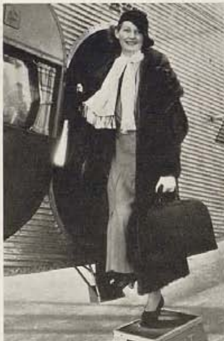
Elizabeth Allan, actriz inglesa que hace tiempo ha estado filmando en los estudios MGM, sale de Hollywood por avión en la primera etapa de su viaje a su país natal, en las primeras vacaciones que ha tenido desde su llegada a Cinelandia.

LOS ESTUDIOS de R.K.O. estuvieron a punto de perder los servicios de Katharine Hepburn cuando la gran estrella exigió un aumento de salario. Y éstos, en el acto, aceptaron. De ahora en adelante la gran Katharine recibirá