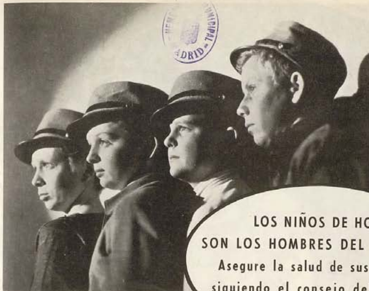
Cuatro Estupendos Astros Infantiles de Columbia en "Sin el Rugir del Cañón," de Frank Borzage.

LOS NIÑOS DE HOY SON LOS HOMBRES DEL MAÑANA: Asegure la salud de sus hijitos siguiendo el consejo del médico