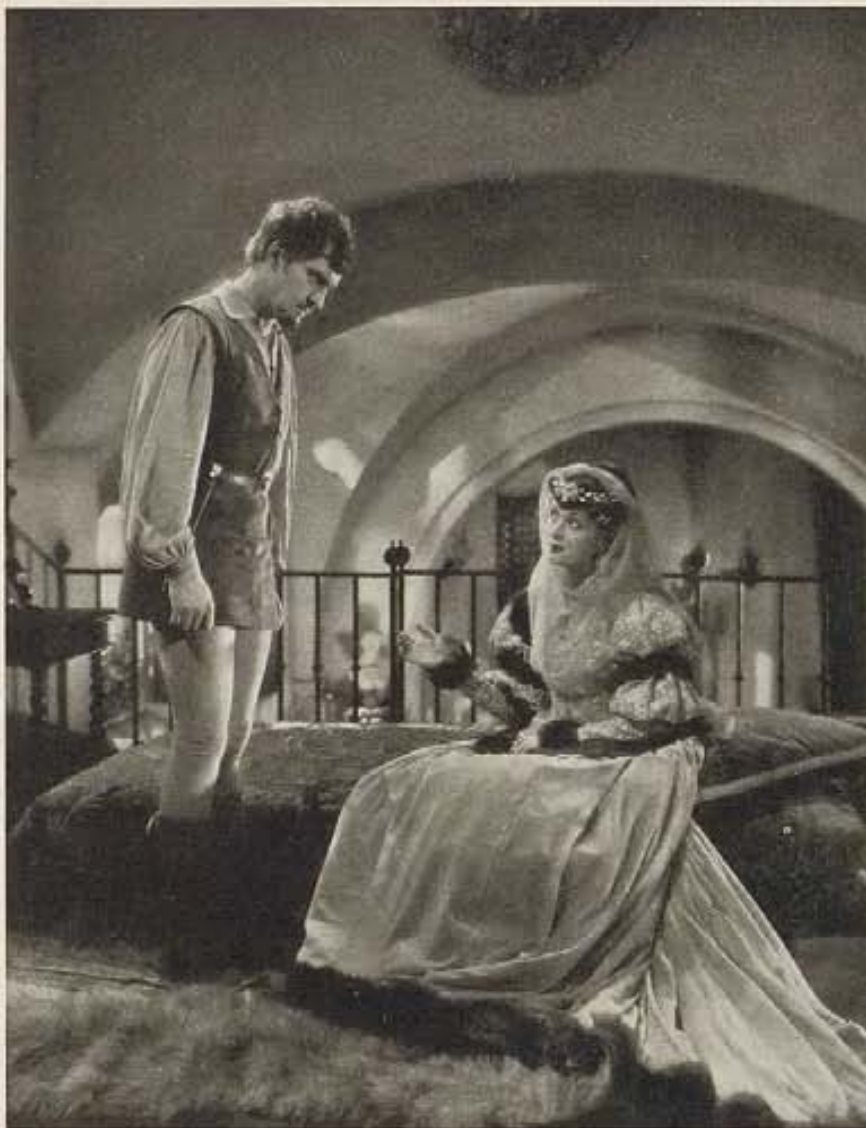
Esta interesante foto muestra a Fredric March y Constance Bennett en una de las escenas del film "The Affairs of Cellini," de la empresa Artistas Unidos.

las españolas están sólo en su infancia y como la crítica, siempre que sea constructiva, es bien recibida me apresuro a apuntarle mis observaciones.