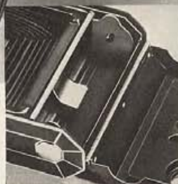
Fácil de cargar. El nuevo respaldo y el nuevo mecanismo para el carrete hacen más fácil y más rápido cargar esta Kodak.

EASTMAN KODAK CO., ROCHESTER, N. Y., E. U. A.