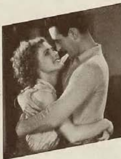
Arriba vemos a John Gilbert, (cuya popularidad ha sido traspasada a Clark Gable) con Lois Moran en una escena de "West of Broadway," de Metro-Goldwyn-Mayer.