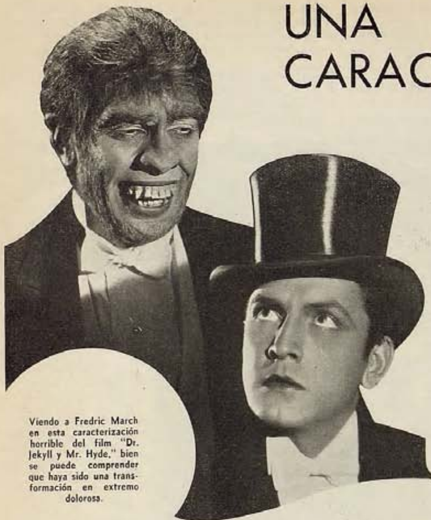
Viendo a Fredric March en esta caracterización horrible del film "Dr. Jekyll y Mr. Hyde," bien se puede comprender que haya sido una transformación en extremo dolorosa.