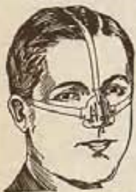
Para señores y señoras

testimonios y folleto gratis que le explica cómo obtener una nariz de forma perfecta.