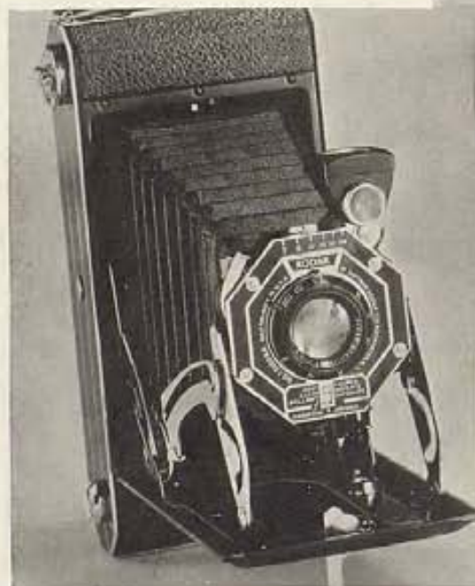
¡Clic! Con un movimiento queda la Kodak abierta y lista.

Nueva además por su estilo moderno, la facilidad con que se carga y su sencillez de manejo, la Kodak Six-16 es, en todo, de una novedad intrigante. Su precio con objetivo Kodak Anastigmático f .6.3, constituye una sorpresa.