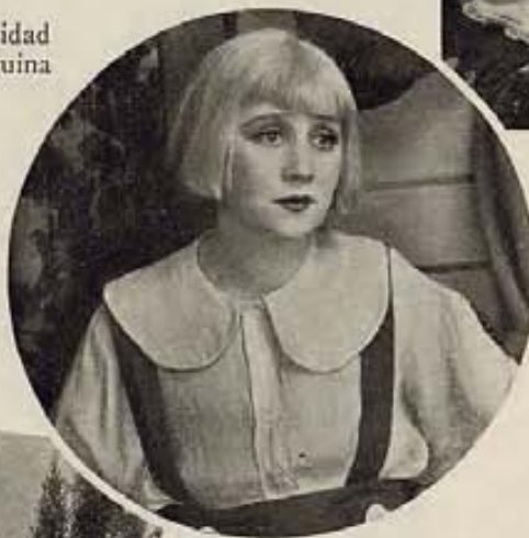
Arriba vemos a Nils Asther con su esposa Vivian y su bebé. En el círculo, Rosetta Duncan en "Seda y Algodón" que ambas filmaron para M-G-M. Abajo, una vista exterior de su morada y una pose cariñosa de Nils y Vivian.