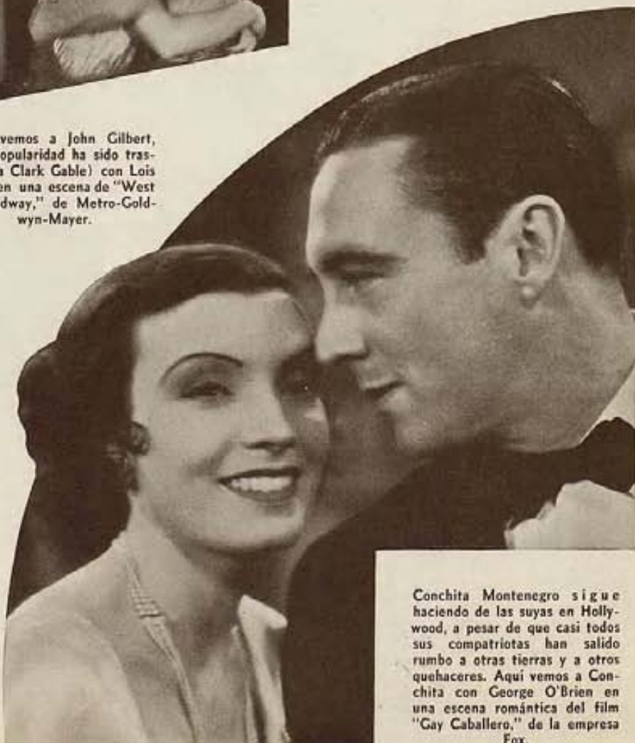
Conchita Montenegro sigue haciendo de las suyas en Hollywood, a pesar de que casi todos sus compatriotas han salido rumbo a otras tierras y a otros quehaceres. Aquí vemos a Conchita con George O'Brien en una escena romántica del film "Gay Caballero," de la empresa Fox.