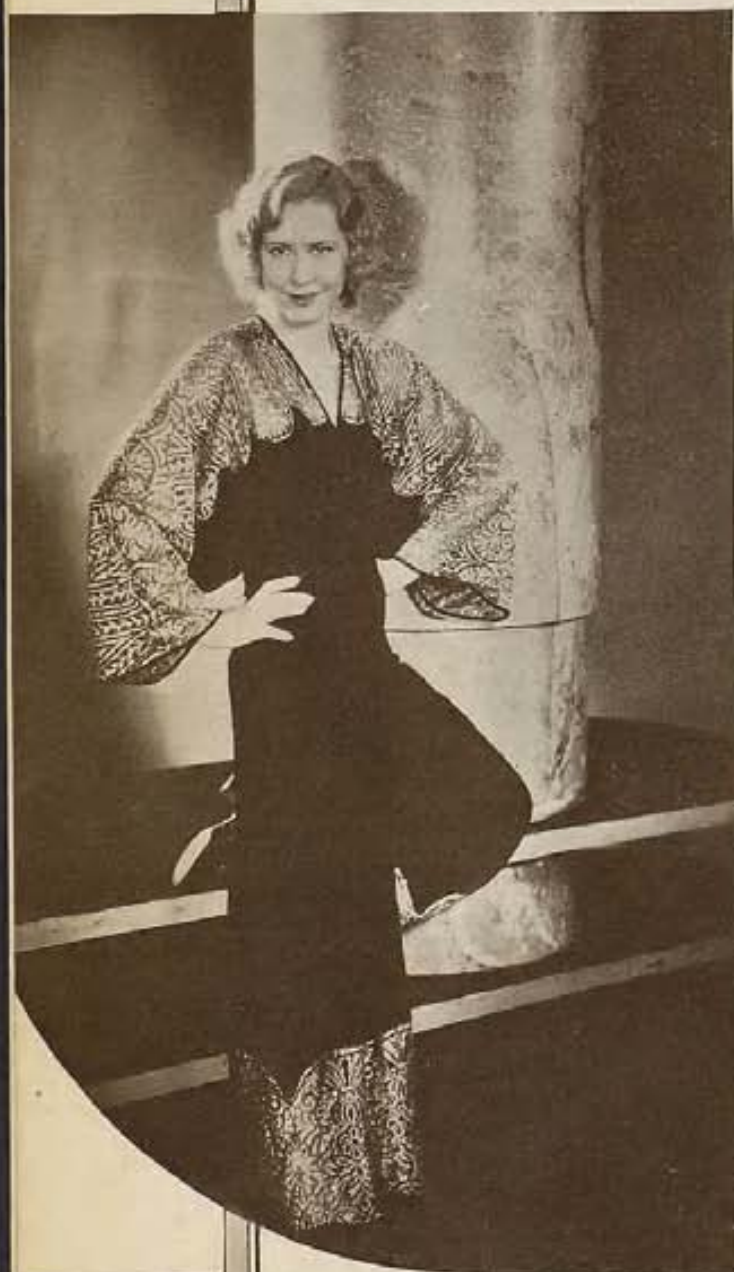
La bonita heroína de "Waterloo Bridge," Mae Clarke, aparece arriba en una pajama para fiesta informal. De terciopelo color negro. Las mangas y el adorno en el pantalón son de encaje de hilos de plata.

Y a la derecha, la rubia que es ahora Bebe Daniels, luce una extraordinaria combinación en pajamas: crepé, encaje, y rhinestones. Las que aquí vemos son de crepé y encaje color blanco.