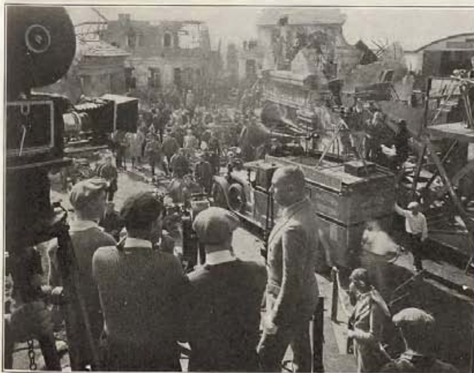
En esta fotografía vemos una escena tomada detrás de las cámaras, demostrando la violenta acción que se desarrolla en el set de "The Lost Squadron" en el momento de filmar una escena importante. Aquí vemos a Eric Von Stroheim que en este film representa al director, protagonista del argumento.

El boulevard está pendiente de la suerte que correrán estas tres veteranas.