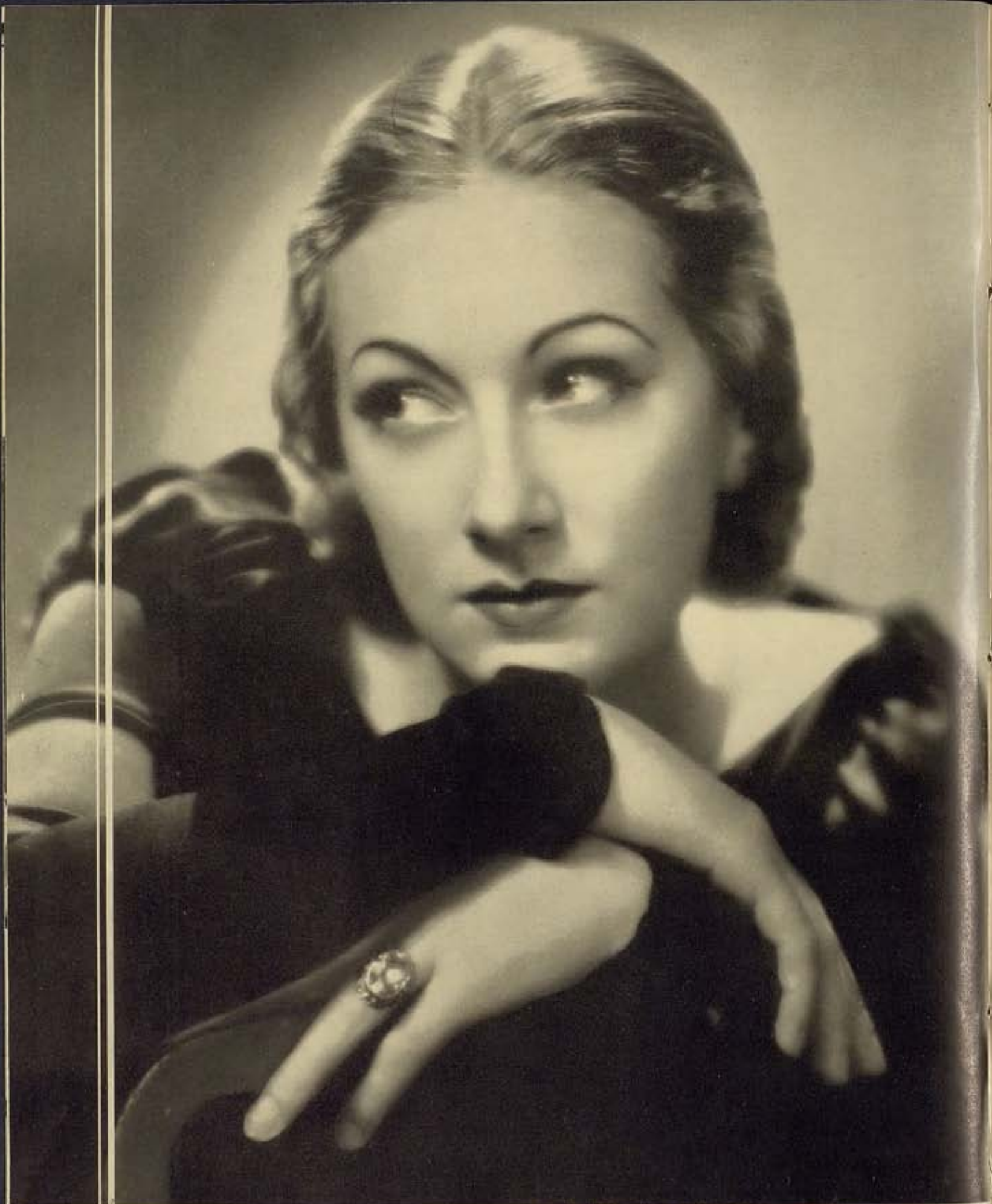
♦ TALA BIRELL ♦