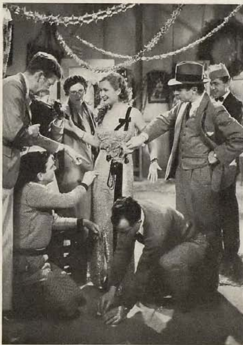
La preparación y toilette de una artista no es cosa de broma, como bien lo podemos juzgar por la atención y cuidado que toda esta gente prodiga a Miriam Hopkins, cuando ella se alista para una escena de "Dancers in the Dark," de Paramount. Otros en el reparto de este film, serán Jack Oakie y William Collier, Jr.

La producción ha empezado ya y será la primera película de Lloyd en dieciséis meses. (va a la página 50)