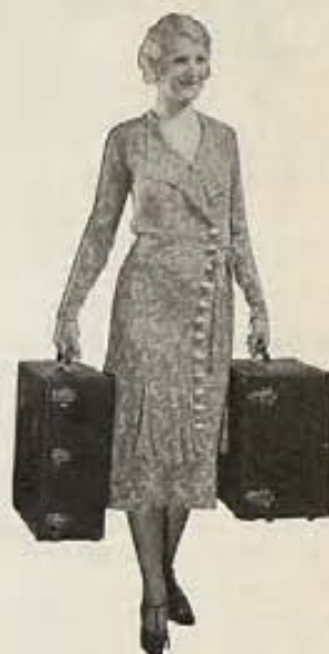
Dos petacas contienen el Proyector Sonoro Chicago, Amplificador de gran potencia, Altoparlante especial, válvulas, cordón de alambre, etc. todo listo para exhibir películas parlantes.

Los Proyectores Cinematográficos Sonoros Chicago para películas parlantes satisfacen las exigencias del público en salones hasta de 1000 personas tan completamente como los costosos equipos profesionales, y a un costo mucho menor. También exhiben películas mudas.