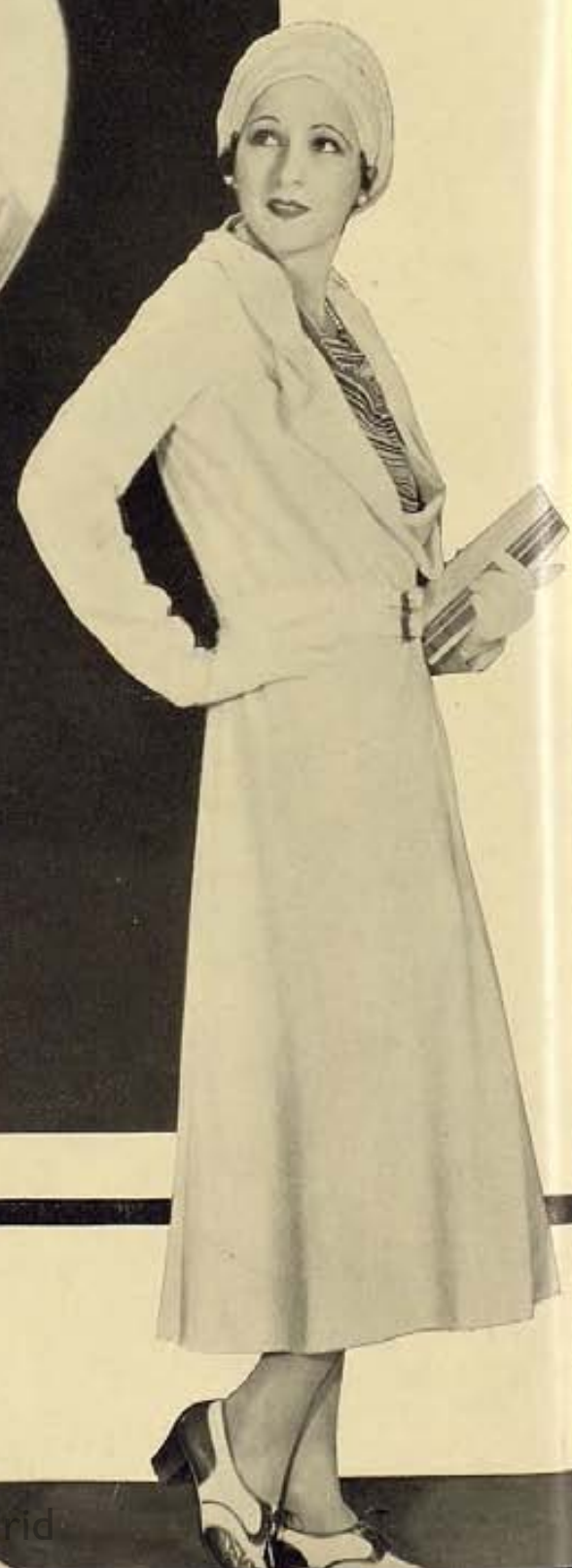
Juliette Compton de los estudios Paramount es una artista que últimamente ha estado cosechando grandes triunfos en todos los papeles que se le han confiado. Actualmente filma "The Black Robe" en los mismos estudios con Fredric March y Kay Francis en los papeles principales.