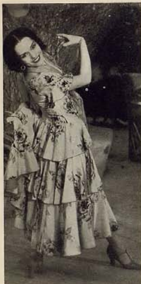
Lupe Vélez caracteriza el rol de "indígena" de un "país tropical" en el film "Broken Wing" de la Paramount. Aquí la vemos, aparentemente bailando un bolero andaluz con las indispensables castañuelas. ¡A ver en qué país de América se desarrolla esta española!