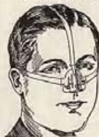
Para señores y señoras

El aparato Trueta Ma-delo 25 corrige ahora toda clase de narices defectuosas con rapidez, sin dolor, permanentemente, y cómodamente en el hogar. Es el único aparato ajustable, seguro y garantizado y patentado que puede darle una nariz de forma perfecta. Más de 10,000 personas lo han usado con entera satisfacción. Recomendado por los médicos desde hace muchos años. Mi experiencia de 15 años en el estudio y fabricación de Aparatos para Corregir Narices están a su disposición. Modelo 25-Jr. para las niñas. Escríbame solicitando testimonios y folleto gratis que le explican cómo obtener una nariz de forma perfecta.