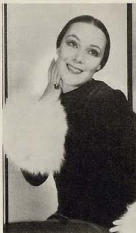
¿Aparecerá una nueva estrella en el firmamento de Hollywood, cuyo nombre sea tan eufónico como el de sus paisanas Dolores del Río (arriba), Lupita Tovar (izquierda) y Lupe Vélez (derecha)?

C IEN mil almas se congregan en el amplio recinto del Coliseo de Los Angeles para presenciar el magno desfile de las delegaciones atléticas extranjeras participantes, con el team norteamericano, en los Juegos Olímpicos Internacionales. A través del portal inmenso uno a uno van entrando los grupos de hombres jóvenes atletas llevando a la cabeza su abanderado que orgulloso ondea la insignia del país que representan en la maravillosa fiesta del músculo. Cada grupo viene luciendo sencillos y alegres uniformes por cuanto en todos ellos triunfa la nota clara. No hay colores sombríos; todos son, como sus portadores, vibrantes, jubilosos. De pronto rómpese la continuidad de cuerpos varoniles, frescos y ágiles sin que esa continuidad desdore, para dar paso a la gentil figura de una bella mujer vestida de blanco, como blanca es la carroza y albos los corceles que tiran de ella. Delante va un joven de tez bronceada, marcial el paso, empu-