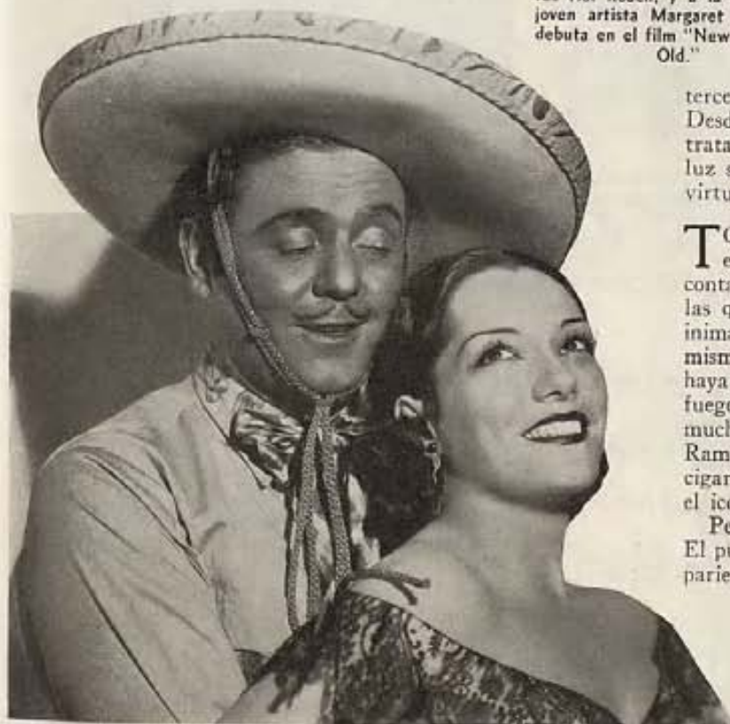
Lupe, la incorregible, se entretiene en coquetear con Leo Carrillo en "Alas quebradas" de Paramount. Este último luce un traje de charro mexicano, que según la idea de los estudios hollywoodenses, es el traje apropiado para los bandidos que en un tiempo se hallaran allende el Río Grande.