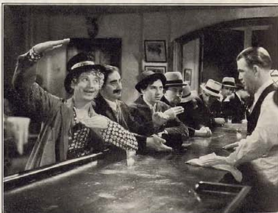
Aquí vemos a tres de los hermanos Marx, en fila, delante de una barra en una escena de su film "Horse feathers." Estos payasos dependen de sus bufonadas y de sus chistes para excitar la hilaridad de los espectadores. De izquierda a derecha, Chico, Groucho y Harpo.