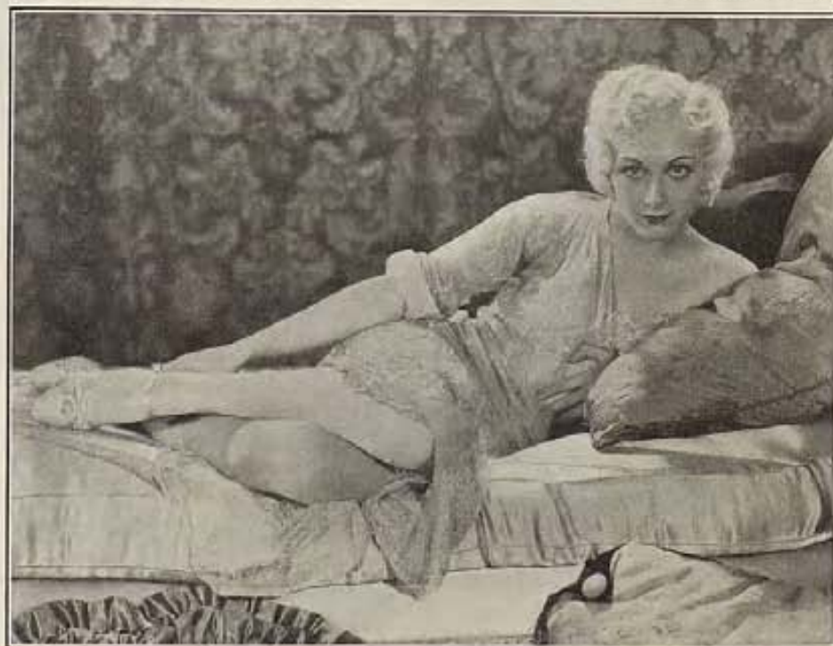
Arriba presentamos a Ann Dvorak con peluca rubia. El cabello natural de Ann es color castaño, pero es evidente que bien pudiera ella teñirse el pelo como aparece en la fotografía sin que su belleza disminuyera en lo absoluto.