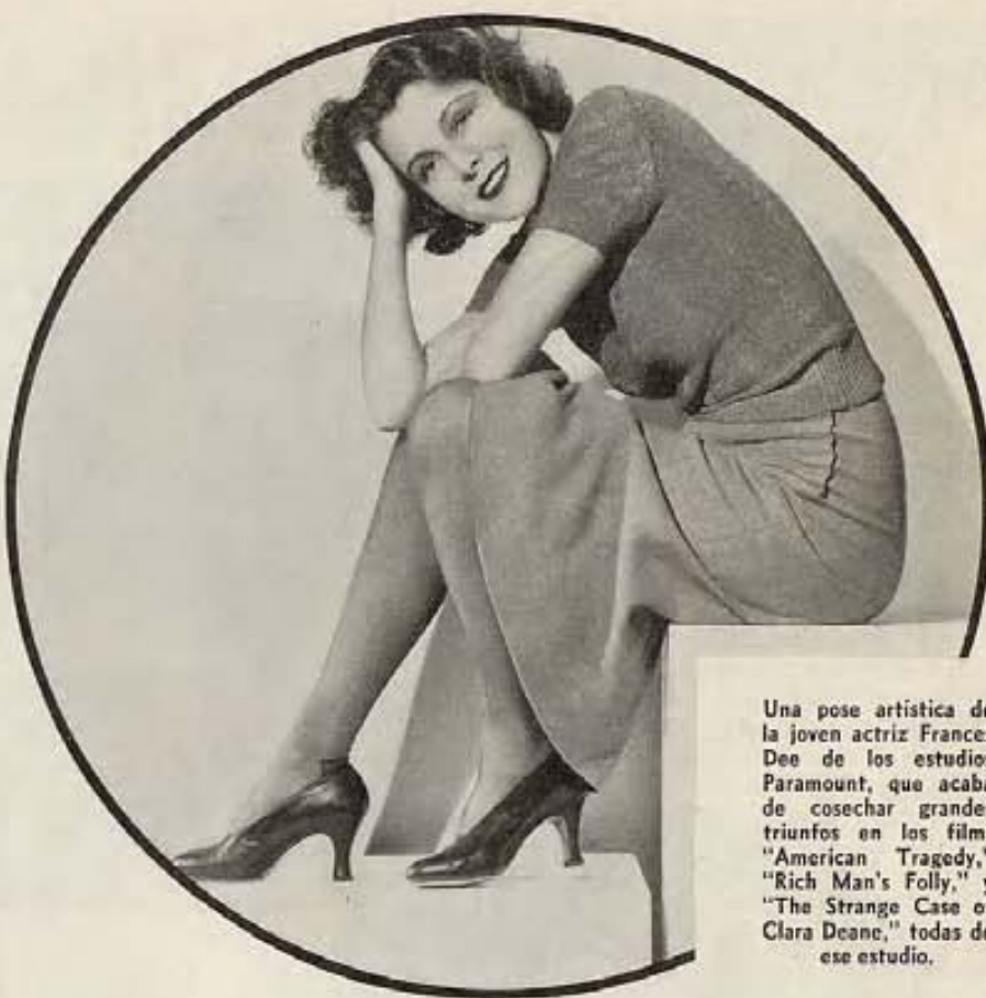
Una pose artística de la joven actriz Frances Dee de los estudios Paramount, que acaba de cosechar grandes triunfos en los films "American Tragedy," "Rich Man's Folly," y "The Strange Case of Clara Deane," todas de ese estudio.