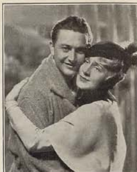
Norma Shearer en el film "Strange Interlude" se transforma en una mujer entrada en años. Aquí la vemos abrazando a Robert Young.

Los artistas contratados deben seguir todas las indicaciones del estudio: su tiempo está por entero tomado por la empresa, no habiendo limitaciones de trabajo salvo el que deban respetarse doce horas de descan-