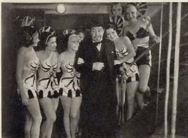
Warner Oland en el papel de detective chino en el film "Charley Chan's Chance" de la empresa Fox, se ve rodeado de un grupo de bellas coristas, en una escena de esa película.

A la derecha vemos a Gary Grant, nuevo galán joven de la Paramount, y a Thelma Todd, en una escena del film "This is the Night" en que ambos desempeñaron papeles muy importantes.