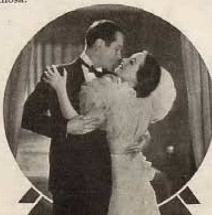
Robert Montgomery y Joan Crawford, en una escena tierna de la película "Letty Lynton" de Metro-Goldwyn-Mayer, que ambos filman actualmente.

Ya hace tiempo viene asegurándose que Greta está gravemente enferma