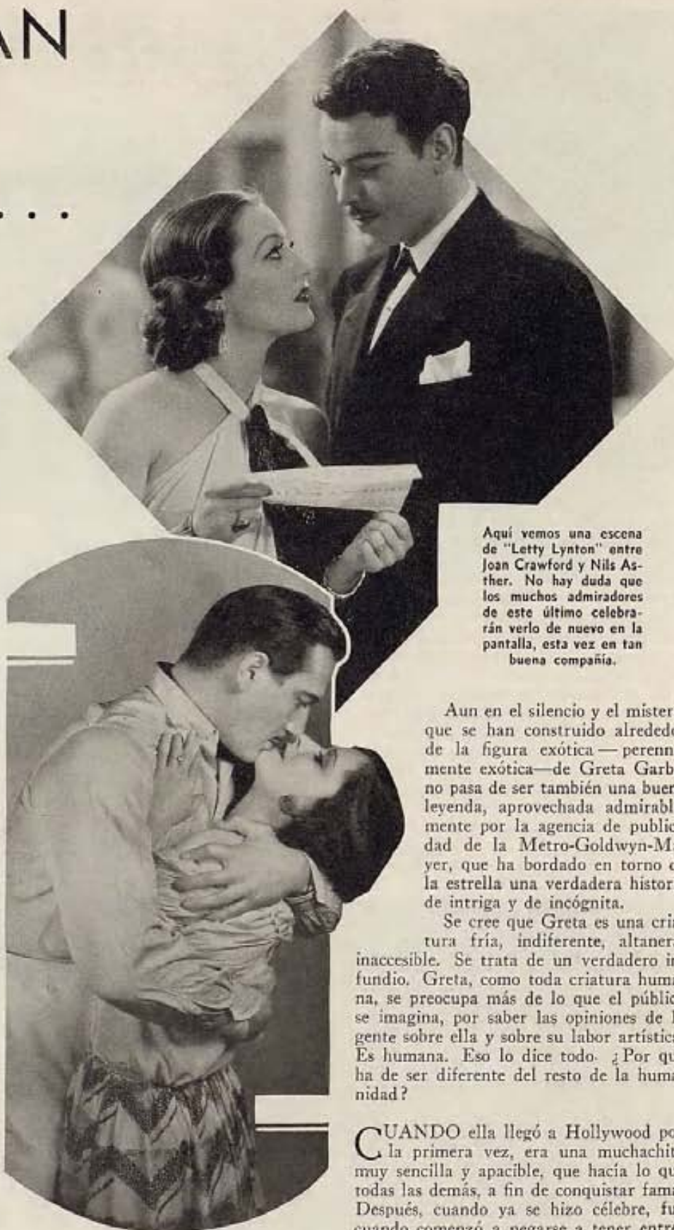
Aquí vemos una escena de "Letty Lynton" entre Joan Crawford y Nils Asther. No hay duda que los muchos admiradores de este último celebrarán verlo de nuevo en la pantalla, esta vez en tan buena compañía.

D E John Barrymore se ha dicho que le tiene un santo horror al agua. Ya sabemos, todos nosotros, lo que esto significa... Por supuesto que el gran actor no es ningún santo y que le agradan los buenos cocktails , pero si bebiera tanto como se ha dado en decir que bebe, estaría siempre en perpetuo estado de embriaguez, y por tanto incapacitado para desempeñar su trabajo en la pantalla. En este capítulo como en otros, acerca de la vida de las estrellas, hay mucho de exageración y de leyenda.