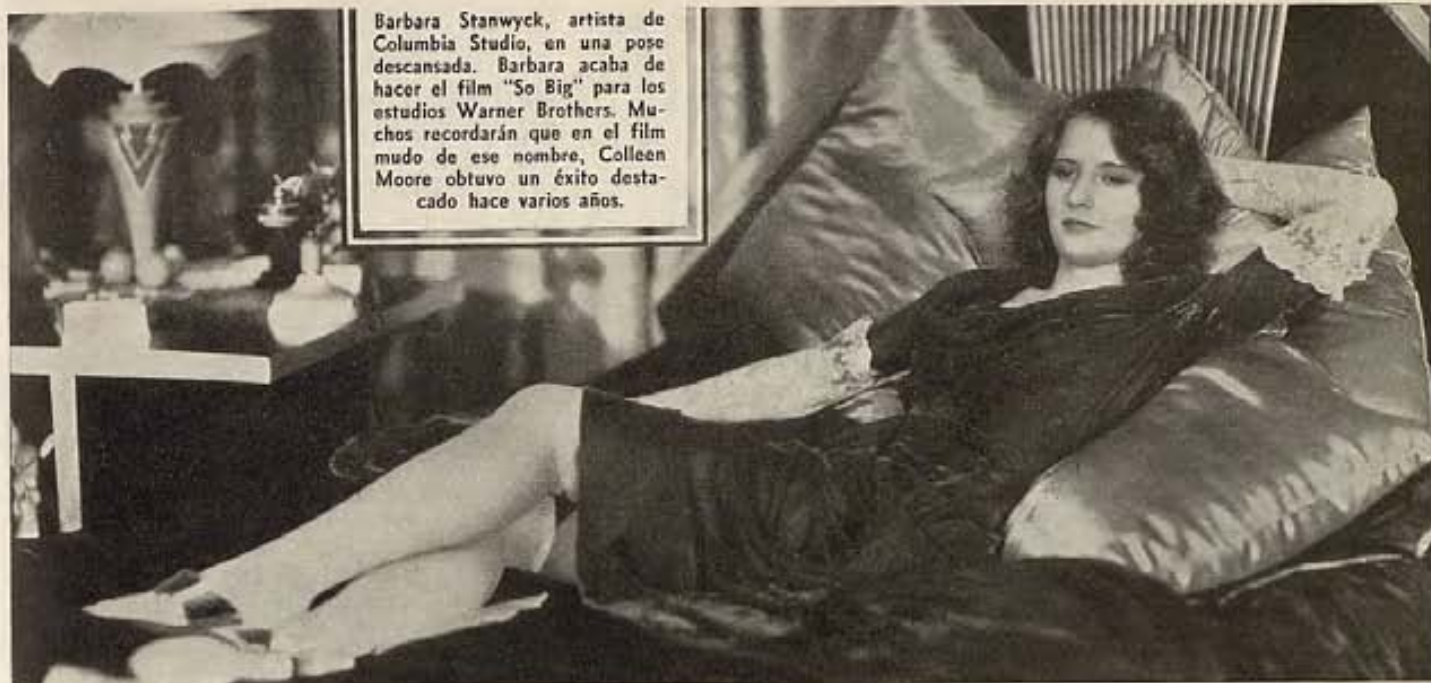
Barbara Stanwyck, artista de Columbia Studio, en una pose descansada. Barbara acaba de hacer el film "So Big" para los estudios Warner Brothers. Muchos recordarán que en el film mudo de ese nombre, Colleen Moore obtuvo un éxito destacado hace varios años.