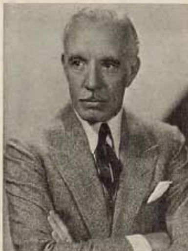
Arriba, Lewis Stone, y a la derecha, Lionel Barrymore, quienes tienen papeles importantes en este film.

Al filmarse la novela "Grand Hotel," de Vicki Baum, la talentosa y afortunada escritora vienesa, se quiso lle-