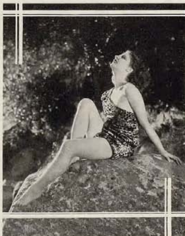
Lillian Bond, una de las actrices jóvenes del elenco M-G-M, gusta de pasar las horas al aire libre, sin más vestiduras que las necesarias para no incurrir en el desagrado de la policía angelina. Lillian acaba de aparecer en el film "The Trial of Vivienne Ware," de la Fox.

"IMAGINARSE" cada escena no es tarea fácil. Quizás un ejemplo ayudará mejor. Conviértamonos por un momento en un property man y leamos la primera escena de un próximo film