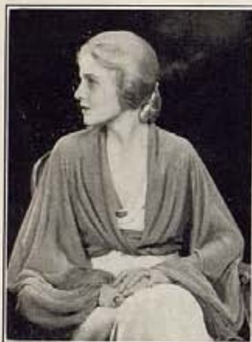
Una pose reciente de Ann Harding, estrella de la empresa RKO que acaba de divorciarse de su marido Harry Bannister.