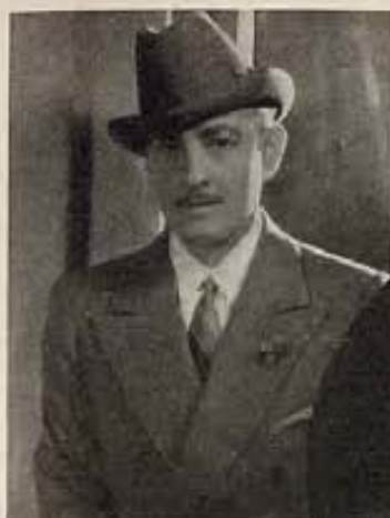
Cuatro astros que probablemente nunca se volverán a ver juntos en una misma película. De izquierda a derecha: John Barrymore, Wallace Beery, Joan Crawford, y Jean Hersholt. Un cuarteto que no puede sobrepasarse en excelencia artística.