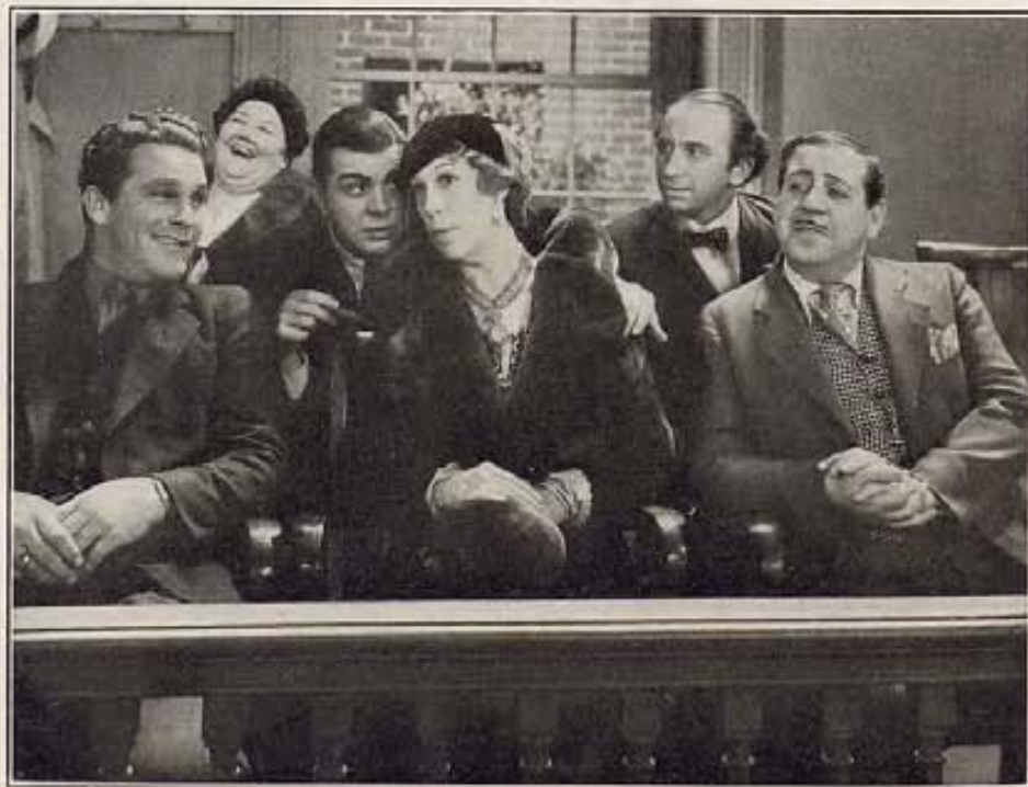
Aquí vemos una graciosa escena del jurado en el film "Damas del jurado" de la empresa R. K. O. La figura central es la de la actriz Edna May Oliver que en este film mantiene su bien ganada reputación de actriz cómica y única rival, hoy, de Marie Dresser.

Previamente se habían hecho tentativas para organizar una empresa, la Empresa