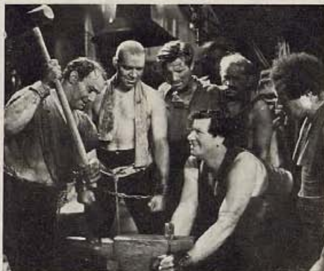
Una escena de la cinta "The World and the Flesh" (El mundo y la carne) de Paramount, en que veremos a George Bancroft en el rol principal, como siempre, de hombre fornido y vigoroso.