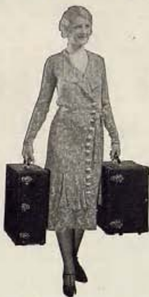
Dos petacas contienen el Proyector Sonoro Chicago, Amplificador de gran potencia. Altoparlante especial, válvulas, cordón de alambre, etc. todo listo para exhibir películas parlantes.

Los Proyectores Cinematográficos Sonoros Chicago para películas parlantes satisfacen las exigencias del público en salones hasta de 1000 personas tan completamente como los costosos equipos profesionales, y a un costo mucho menor. También exhiben películas mudas.