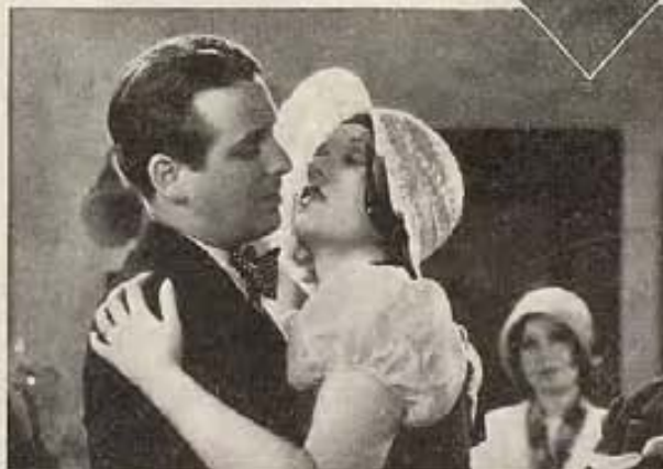
Aquí vemos a Wallace Ford y Anita Page en "Prosperity," la próxima cinta en que veremos a Marie Dressler, la excelsa comedianta.

CLARA confiesa que detrás de "aquel alocamiento sin bridas" que la hiciera notoria, no había sino una pobre muchacha asustada y temerosa, quizá hasta tímida, que encontró esa notoriedad como un medio de defensa de sí misma. Tener un antifaz, a tiempo, evita innumerables tomadas de pelo, engaños, desdenes, sorpresas, canalladas. Pero esta comedia llegó a su "climax" hace poco. Los nervios de Clara ya no podían aguantar más. Estallaron. Hubo serio peligro de un desequilibrio que le hubiera costado la razón. Entonces, como una legendaria tabla salvadora, surgió un hombre, sano, entusiasta, simpático: Rex Bell. Su amor ha sido un bálsamo