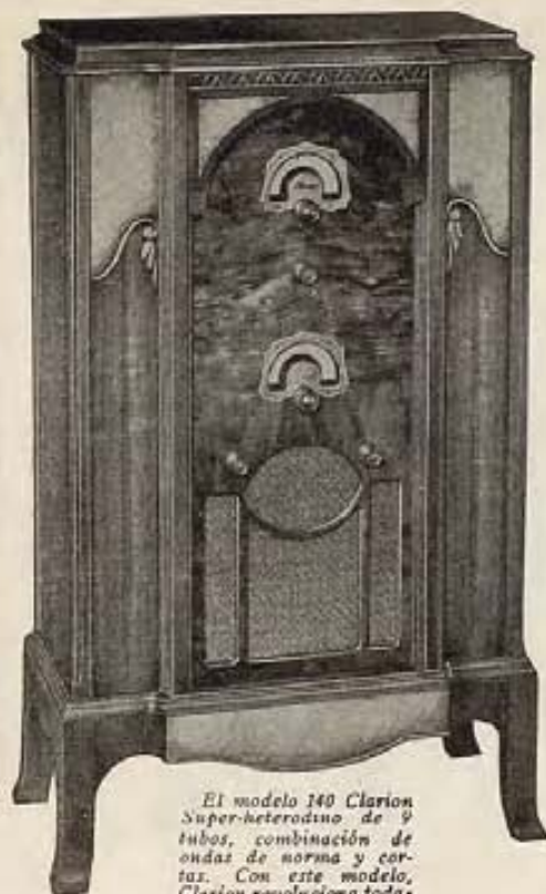
El modelo 140 Clarion Super-heterodino de 9 tubos, combinación de ondas de norma y corta. Con este modelo, Clarion revoluciona todas las normas establecidas.

¿Cuántos actores hay que harían esto? Ninguno, decimos nosotros.