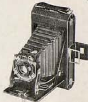
Kodak Six-20—Elegante, práctica, segura: una verdadera Kodak moderna, para ELLA... o para uno mismo. ¿Por qué no?