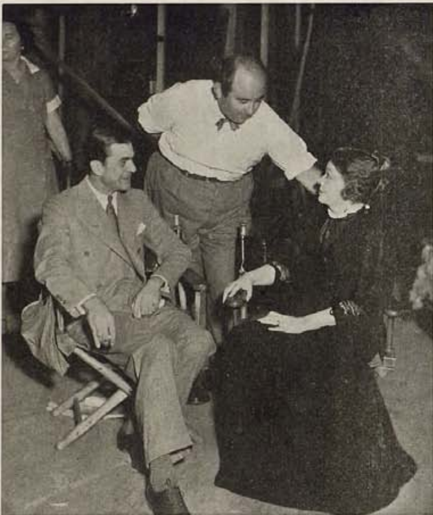
El director Norman Taurog se detiene un momento a dar instrucciones a la actriz de teatro, Pauline Lord, que interpreta el papel principal en el film "Mrs. Wiggs of the Cabbage Patch," de Paramount.

que hacerlo junto a Kit. Durante la función, y mientras actúan, ambos se confiesan su mutuo amor. La presentación es espléndida y los números musicales agradables al oído, constituyen un gran éxito.