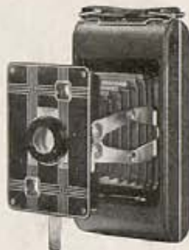
Kodak Tris-Tras (Jiffy)—Tris, se abre; tras, ya está la "foto." Segura y rápida, ha de gustar en un tris-tras.