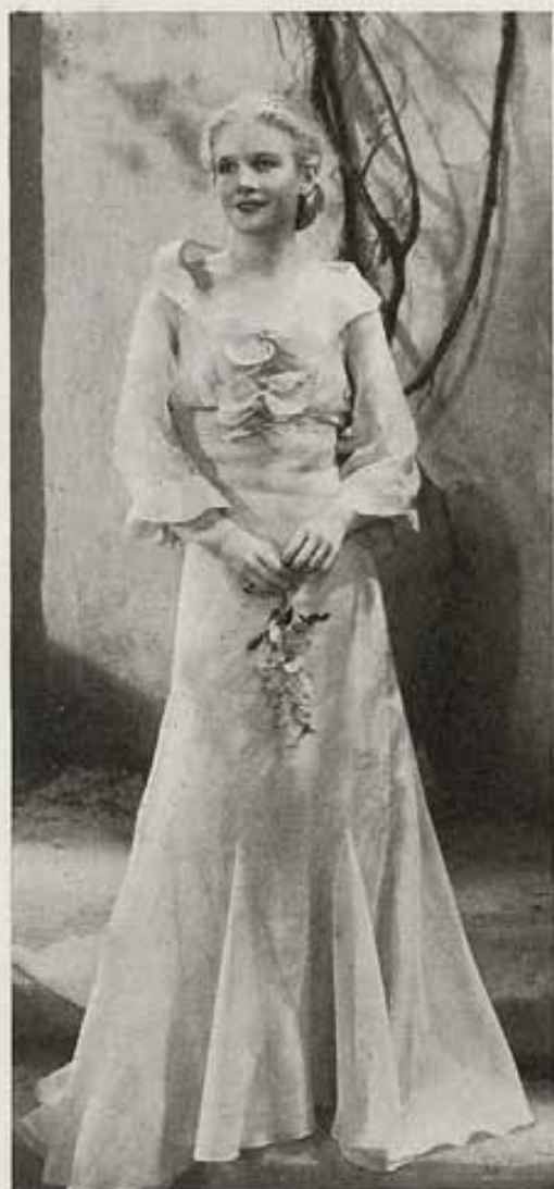
Arriba, la exquisita y popular estrella, Ann Harding, de R.K.O., presenta un vestido de organdí color lila. De falda larga hasta el suelo. Muy bonitas son las mangas con los puños que las adornan.

De terciopelo negro con hilos dorados es el traje formal que a la derecha podemos admirar en Jane Baxter, de los estudios R. K. O. Nótese las mangas postizas que lucen los bonitos brazos de la actriz.