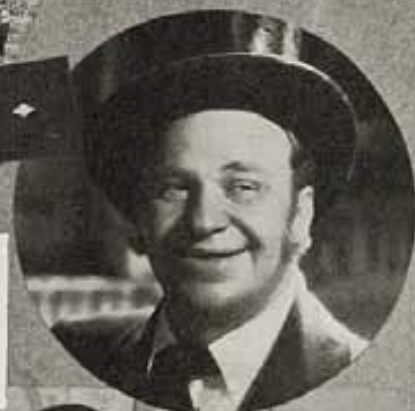
¿Se estará riendo de ello, Wallace Beery, que fué primer esposo de Gloria? Aquí lo vemos, a la derecha, en el papel de protagonista del film "The Mighty Barnum," de Artistas Unidos.