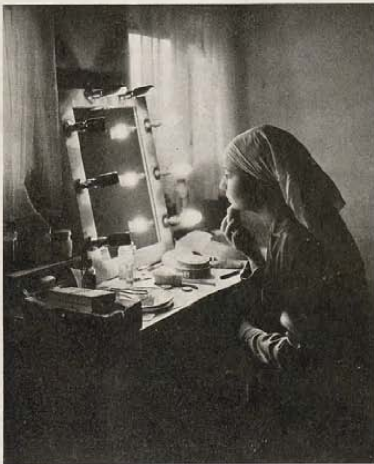
Un buen maquillaje es producto de la experiencia en saber seleccionar las cremas y cosméticos más apropiados y de valor reconocido.

Llega la noche de la representación. Dick ha cambiado su obra, de manera de poner en ridículo al teniente Biddle. En vista de que uno de sus "actores" está enfermo, debe él actuar en el rol de protagonista. Y tiene