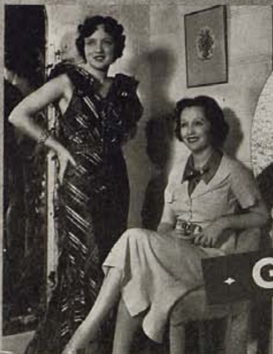
Bebe Daniels se retrata en su tienda de modas en el aristocrático barrio de Westwood, en Los Angeles, donde se estableció a raíz de su determinación a no tratar de seguir en la pantalla. Su visitante es la artista Sheila Manners, del elenco Columbia.