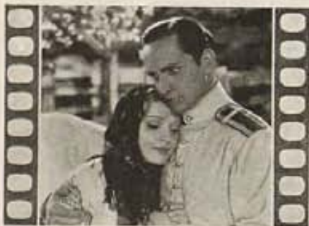
"WE LIVE AGAIN"

Edmund Lowe es un vivo a quien la suerte lo hace famoso de la noche a la mañana, por la virtud de su mágica voz y un desparpajo ilimitado. Gloria Stuart lo ayuda a escalar el elevado puesto y se enamora de él, para verlo más tarde caer víctima de su propio egoísmo y vanidad. Una entrevista falsa le hace perder su puesto con la compañía difusora y creyendo todo perdido se da a la borrachera. Pero Gloria aún lo quiere y con ayuda de dos o tres amigos vuelve a conquistar el puesto perdido. La atracción principal del film consiste en la presentación de varios artistas famosos de la radio: Ruth Etting, Phil Baker, Ethel Waters, Gene Austin, Alexander Wolcott y otros. En el reparto, Alice White, Victor Moore, Hugh O'Connell, Helen Vinson, Henry Armetta, Andy Devine, Wini Shaw, Marion Byron y otros.