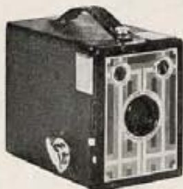
La Brownie Junior—Económica, fuerte, segura. La prefieren los Reyes para "el rey de la casa."