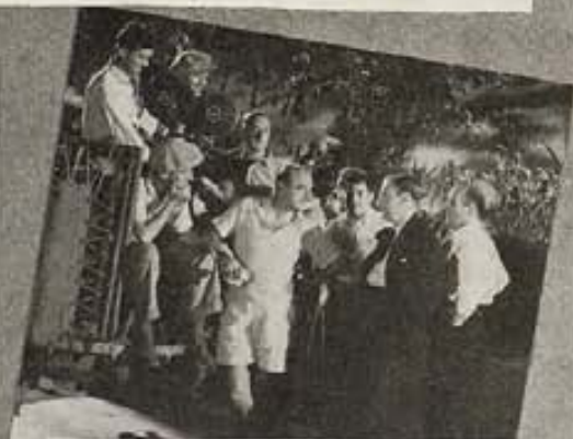
Una costumbre curiosa es la del director Lowell Sherman, cuyo modo favorito de "vestirse" mientras dirige, es en calzones cortos como aquí aparece trabajando en Universal.