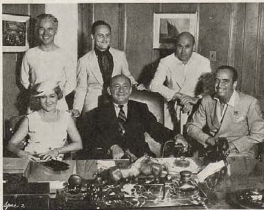
Un grupo de personalidades filmicas notables se reúnen en los estudios de Artistas Unidos para discutir asuntos de producción. Sentados: Mary Pickford, Joseph Schenck y Douglas Fairbanks. De pie: Charles Chaplin, Darryl Zanuck y Samuel Goldwyn, estos dos últimos, productores.

H UGH WALPOLE, conocido novelista inglés, ha llegado a Hollywood, con un suculento contrato con los estudios de Metro-Goldwyn-Mayer. Y a los pocos días de llegar, el productor Selznick lo "descubrió." Walpole encarnará al Vicario de Blunderstone, en