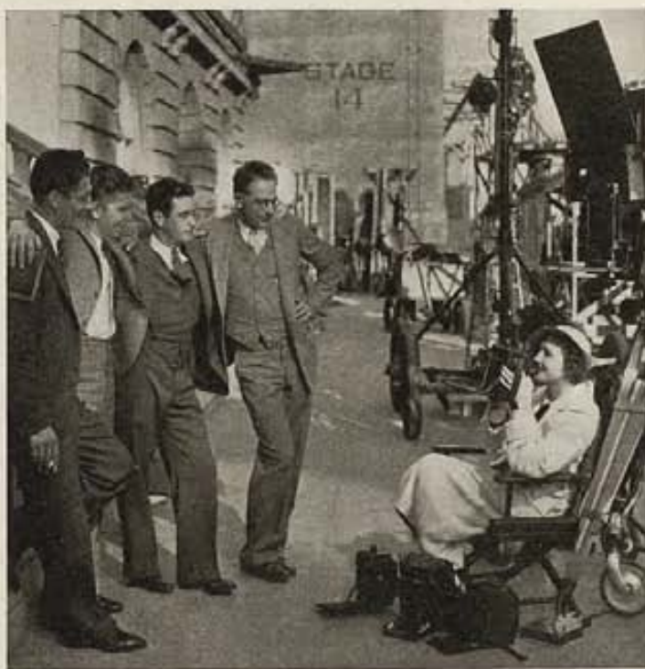
Claudette Colbert se desquita contra los fotógrafos que a diario la importunan, y les enfoca la cámara de uno de ellos. Claudette acaba de filmar "Imitation of Life," para Universal.

CHARLES BOYER sigue siendo uno de los artistas más solicitados del cine. No bien había terminado de filmar una cinta en francés en los estudios parisinos, cuando debió regresar apresuradamente a Hollywood para tomar parte en una película de los estudios de Fox. Y el pobre de Boyer, que es casado con la estrellita inglesa Pat Paterson, aún no ha podido darse el placer de realizar su proyectado viaje de luna de miel.