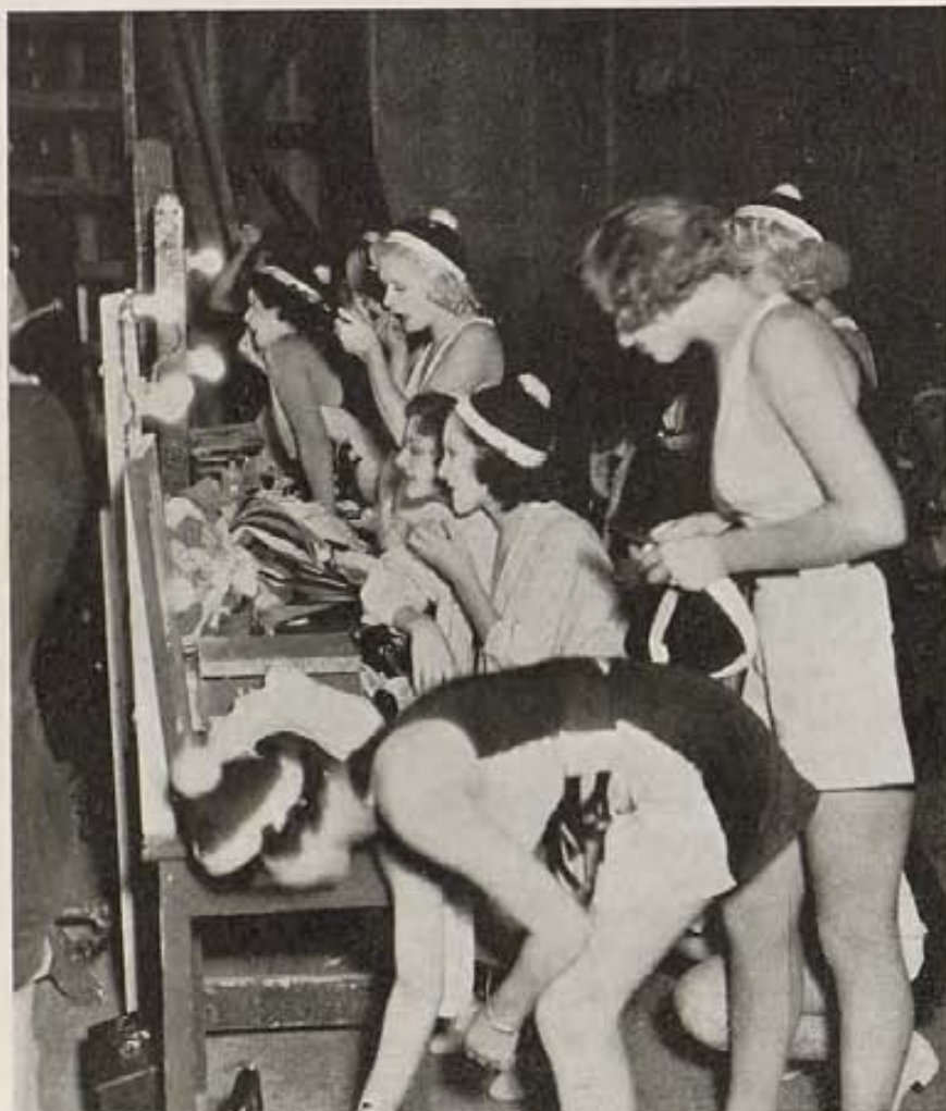
El fotógrafo imprudente sorprende a un grupo de coristas de "College Rhythm," detrás de bastidores, preparándose el maquillaje para la próxima escena de este film de Paramount.