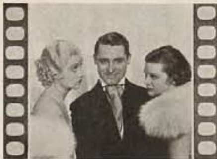
"KISS AND MAKE UP"

Clarence Brown, el director de esta película, supo sacarle todo el partido posible a este tema de triángulo sexual. Joan Crawford hace el papel de secretaria de un gran comerciante, Otto Kruger, y después de una temporada de mucho trabajo, va de vacaciones a la Argentina. A bordo se encuentra con Gable, un norteamericano establecido en la Argentina, criador de caballos de pura sangre. Se enamoran mutuamente, pero antes de aceptar, Joan le confiesa a Clark sus relaciones con Kruger y que éste quiere casarse con ella. Clark insiste, y ella regresa a Nueva York con el objeto de arreglar el asunto con Kruger y volver a la Argentina. Pero, llegada a Nueva York, teme abandonar a Kruger y le escribe a Clark desilusionándolo. Más tarde se encuentran de nuevo y todo se arregla.