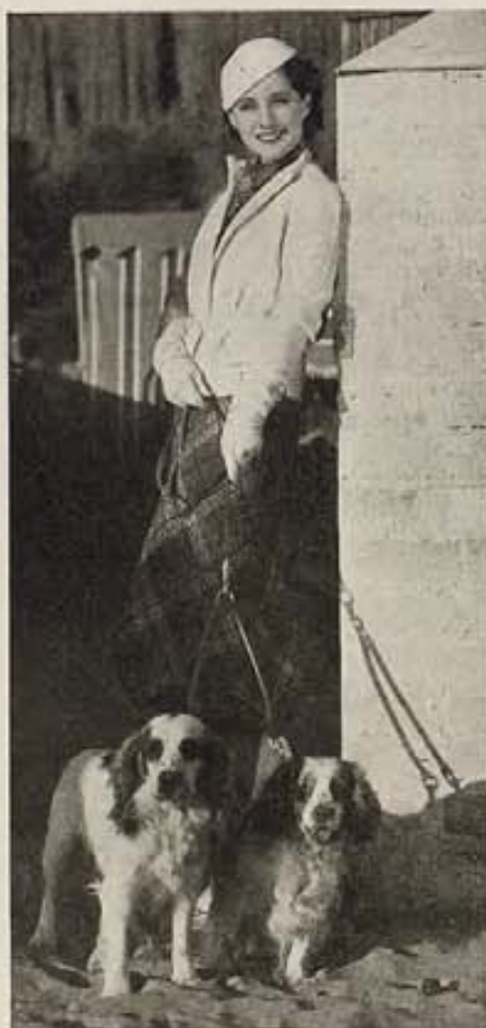
Norma Shearer acaba de anunciar su retirada del cine por algún tiempo. ¿La causa? Espera presentar a su esposo Irving Thalberg, alto funcionario de MGM, con un heredero o heredera.

YA HA PASADO al olvido el incidente entre Herbert Marshall y John Monk Saunders. Pero el caso ha vuelto a repetirse con diferentes protagonistas. El ring fué un club nocturno de Hollywood y el que rodó por debajo de las mesas fué Jack Oakie, después de una tremenda sopapina propinada por el