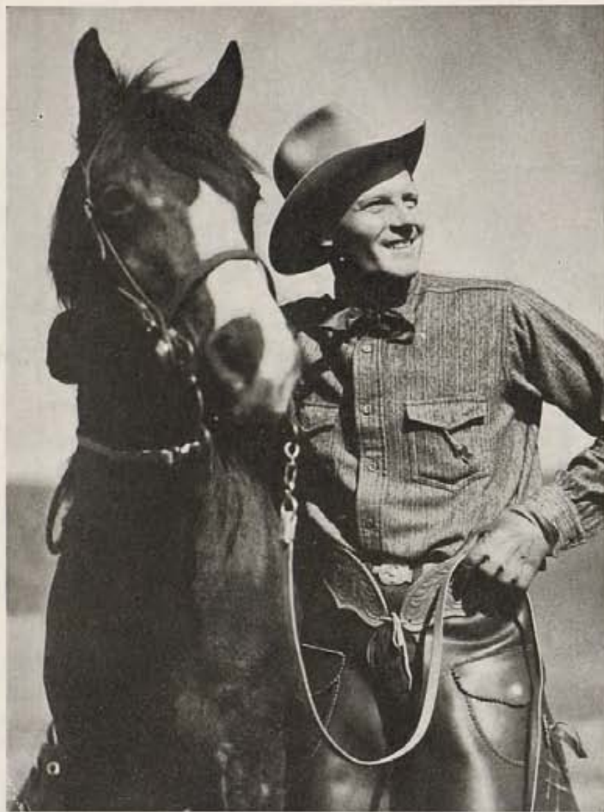
Joel McCrea, que además de ser buen actor, tiene la distinción de ser marido de Frances Dee y de haber abandonado la oportunidad de actuar junto a Marlene Dietrich por un disgusto que tuvo con el director Von Sternberg.

lizadas en libros y novelas privan en Hollywood entre gente de relativa cultura. La adquisición de diamantes tamaños como judías, el uso excesivo de trajes suntuosos cargados de elementos decorativos, etc.