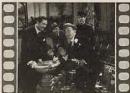
"GIFT OF GAB"