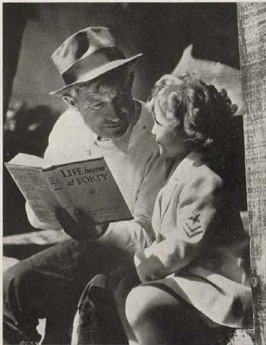
"La vida empieza a los cuarenta," es el título de este libro que Will Rogers le está leyendo a la diminuta Shirley Temple. Para ella la vida del cine empezó a los cuatro.

Fué uno de los primeros directores en especializarse, dándonos durante largo tiempo una serie de cintas de ambiente exterior, exóticas en su escenario y en su asunto, todas ellas maestras: "The Pagan," "White Shadows of the South Seas," "Trader Horn" y "Eskimo," esta última una verdadera joya de emoción y de psicología. Se le tildó de no poder salir de ese campo de países extraños, con mares, bosques e indígenas. Hizo entonces para probarnos lo contrario una espeluznante película policial, "Guilty Hands;" dirigió en seguida dos buenas películas de tema diverso, "Penthouse" y "The Prizefighter and the Lady"—esta última obra-tipo de lo que debe ser el cine dinámico. Y ahora, por último, acaba de obtener uno de