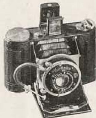
Kodak Volland—Diminuta, completa y precisa, la Volland es una joya para "fotos" superiores.