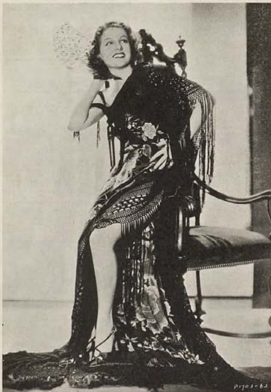
Esta americanita que descubre parcialmente sus encantos bajo un gran mantón de Manila, se llama Ann Sheridan y está contratada por Paramount.