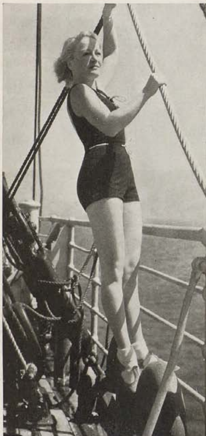
Wynne Gibson acaba de desempeñar un papel importante en el film de Columbia, "The Captain Hates the Sea" (El capitán odia el mar). Ella no está de acuerdo con el capitán y pasa muchas horas en las aguas del Pacífico cada vez que tiene oportunidad.