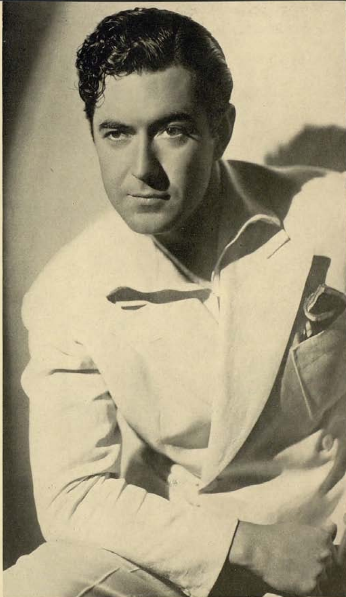
John Mack Brown

Después de una temporada de descanso, este popular actor se encuentra contratado por la empresa Columbia. Su film más reciente para esta productora se titula "Police Ambulance," con Sally Blane de primera dama