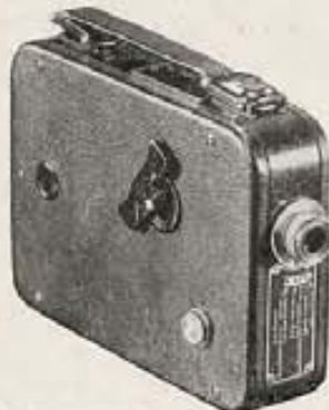
Cine-Kodak Eight (8)—¿Una Kodak para filmar?—Sí: ¿que mejor regalo para toda la familia?