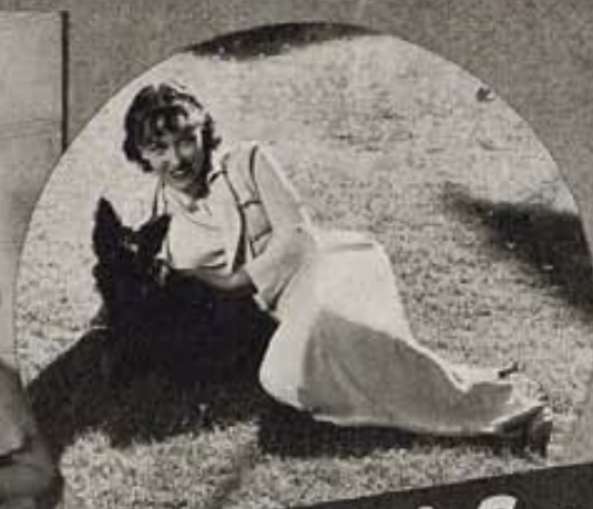
Después del trabajo viene el descanso, y Gloria Swanson piensa que bien se lo ha ganado después de trabajar sin pausa alguna en el film "Music in the Air," donde se verá por primera vez desde hace mucho. Gloria acaba de deshacerse de su último marido.