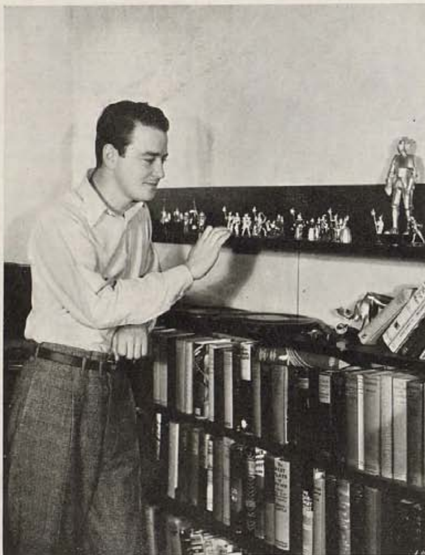
Lew Ayres acaba de casarse con Ginger Rogers. Lew es gran amante del hogar y aquí lo vemos con su famosa colección de miniaturas de la que está justamente orgulloso.

Warner Brothers la contrató para la filmación de "Little Caesar." Al exhibirse la cinta, nadie dudó de que la nueva rubia emigrada de las bambalinas neoyorquinas era sencillamente un fracaso.