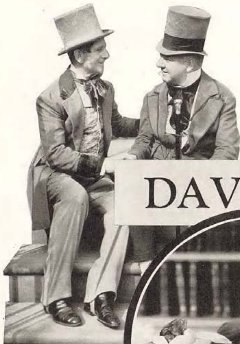
A la izquierda vemos a W. C. Fields en el papel de Micawber, caracter excéntrico y sumamente simpático, conversando con un viejo camarada de sus años de teatro.