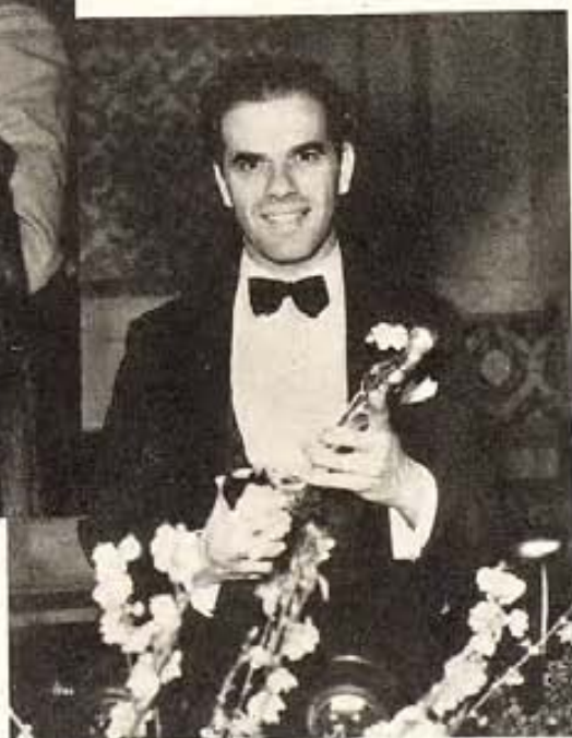
Frank Capra el mejor director

Arriba vemos a la niñita Shirley Temple, estrellita de la Fox, y Claudette Colbert, estrella de Paramount, felicitándose mutuamente. Shirley fué presentada con un premio especial por sus triunfos durante el año 1934. A la derecha, Capra, el director vencedor.