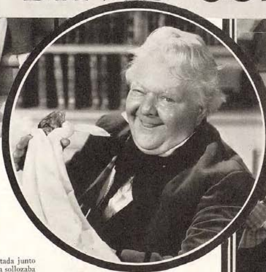
En el círculo, Mr. Dick, un tipo medio chiflado pero muy simpático, que es pariente de Betsey Trotwood, tía de David y quien depende de él y de su criterio en muchas ocasiones.