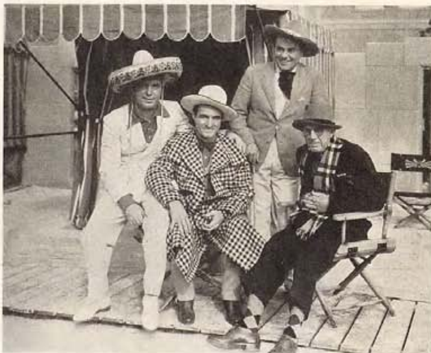
Tres cowboys de mentirillas y un director de verdad se juntan en el set del film "Caliente," de First National, para contarse unos chismes. Son Pat O'Brien, Tom Mix, Leo Carrillo (de pie) y Lloyd Bacon.