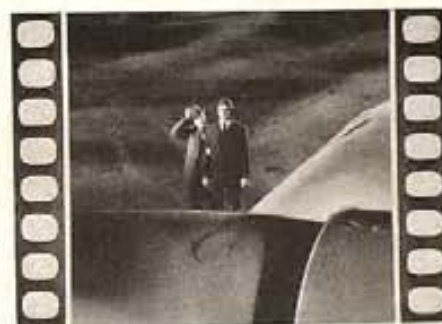
"WINGS IN THE DARK"

Alan Mowbray es un hombre que teniendo mucho dinero y poco que hacer, descubre un anillo mágico que le da el poder de transformar a las personas en estatuas de piedra y a las estatuas en seres de carne y hueso. Con tal poder en sus manos y siendo su carácter alegre y algo loco, se divierte de lo lindo y su vida es una serie continua de sucesos espeluznantes. Un día visita un Museo de Arte y se le ocurre transformar las estatuas de los dioses del Olimpo, devolviéndoles la vida. Naturalmente, que el resultado es de lo más ocurrencioso y la entrada al mundo de los vivos en esta época, de Venus, Baco, Mercurio y otros dioses, causa complicaciones asombrosas hasta que Mowbray los transforma de nuevo en estatuas. Con Florine McKinney, Peggy Shannon, Henry Armetta, y otros más.