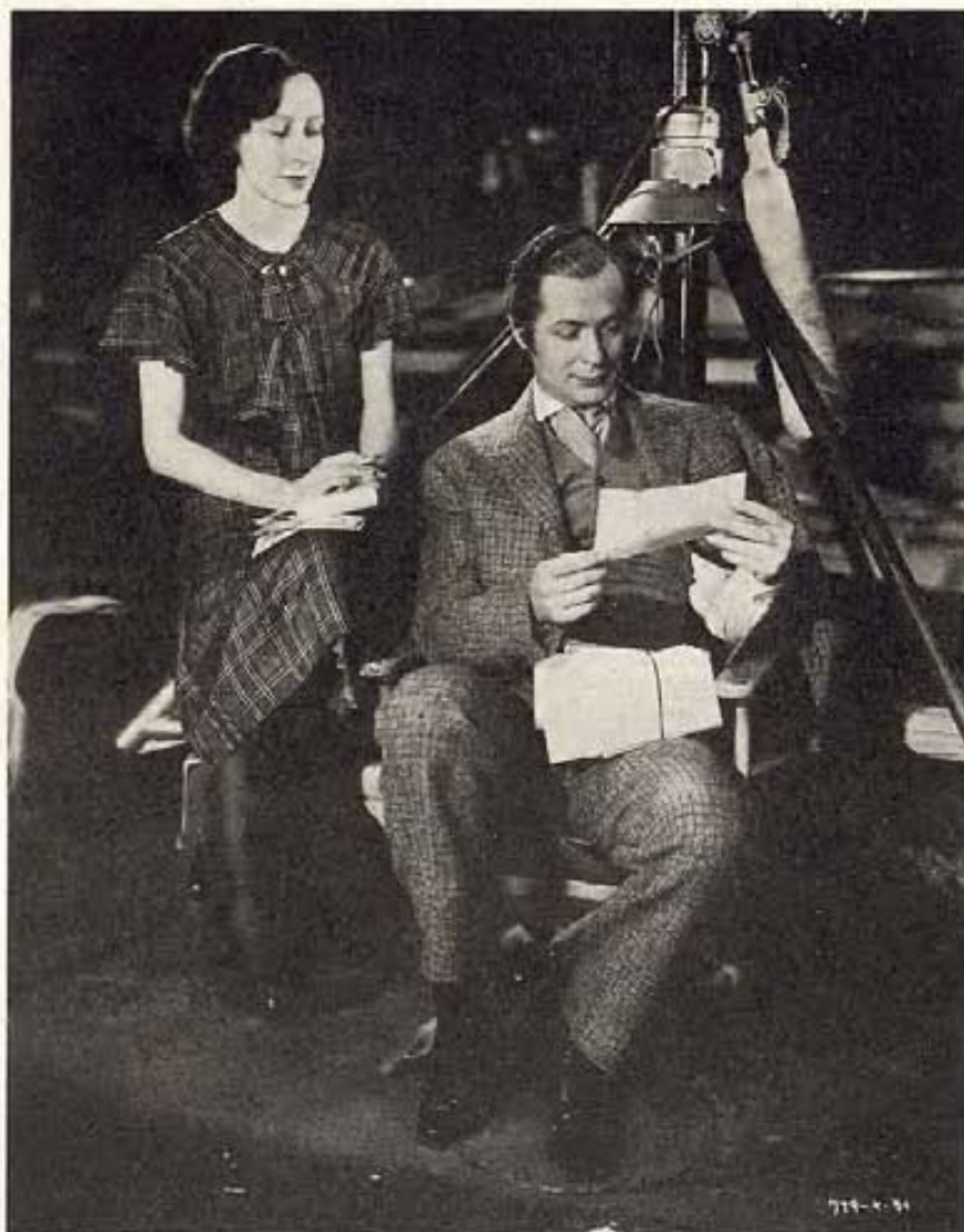
La secretaria de Robert Montgomery le enseña a éste una carta recibida de una fanática, durante la filmación de "Vanessa, Her Love Story" en los estudios MGM. A juzgar por la expresión del actor, la misiva en cuestión debe contener una de esas declaraciones ardientes que saben escribirle sus admiradoras.