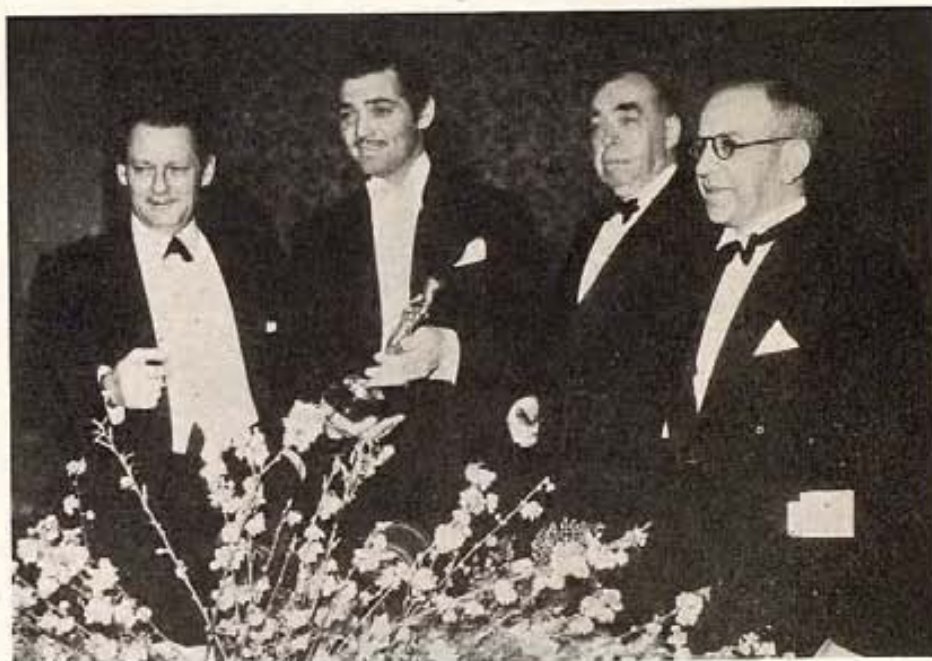
Clark Gable — el mejor actor

La adjudicación de premios tuvo lugar durante un banquete, el séptimo de los que año tras año ha venido dando la Academia de Ciencias y Artes Cinematográficas. La numerosa concurrencia de celebri-