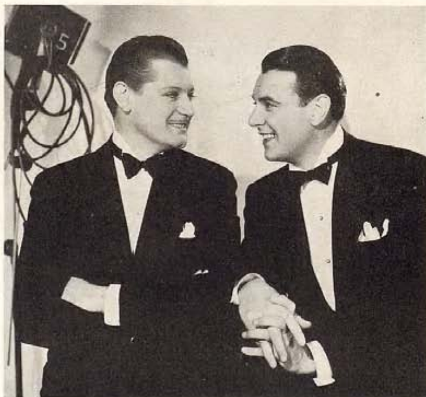
Estos dos actores que trabajan juntos en el film "The Goose and the Gander," de Warners, tienen una especie de parentesco. Ambos son divorciados de Ruth Chatterton, exactriz de cine. ¿De qué estarán hablando, tan divertidos?