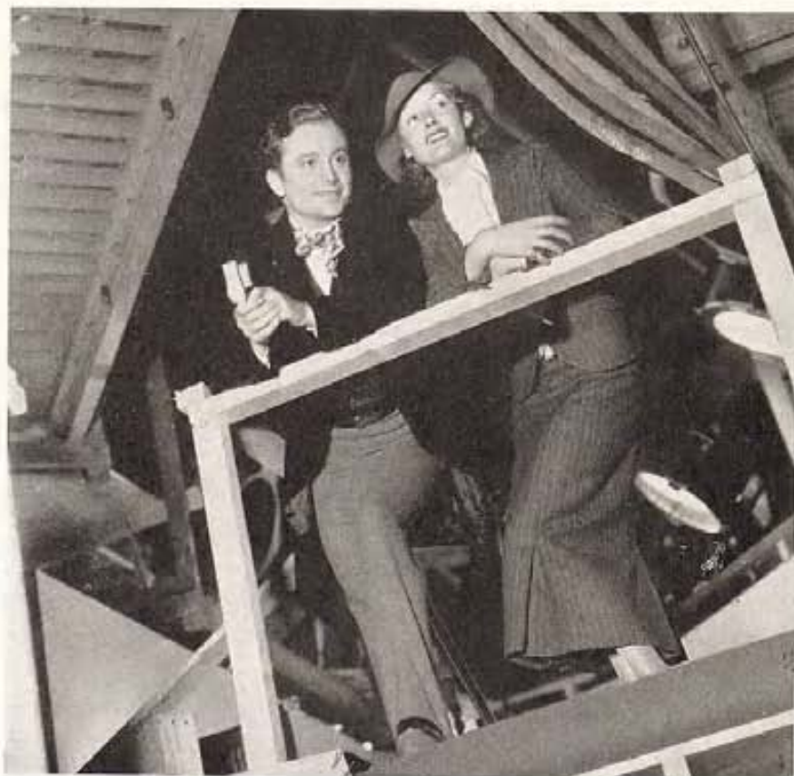
Frank Lawton y Elizabeth Allan, ambos oriundos de Inglaterra y artistas del elenco MGM, desempeñan papeles importantes en el film "David Copperfield," de ese estudio.

Clark Gable y Joan Crawford hacen de- (va a la página 55)