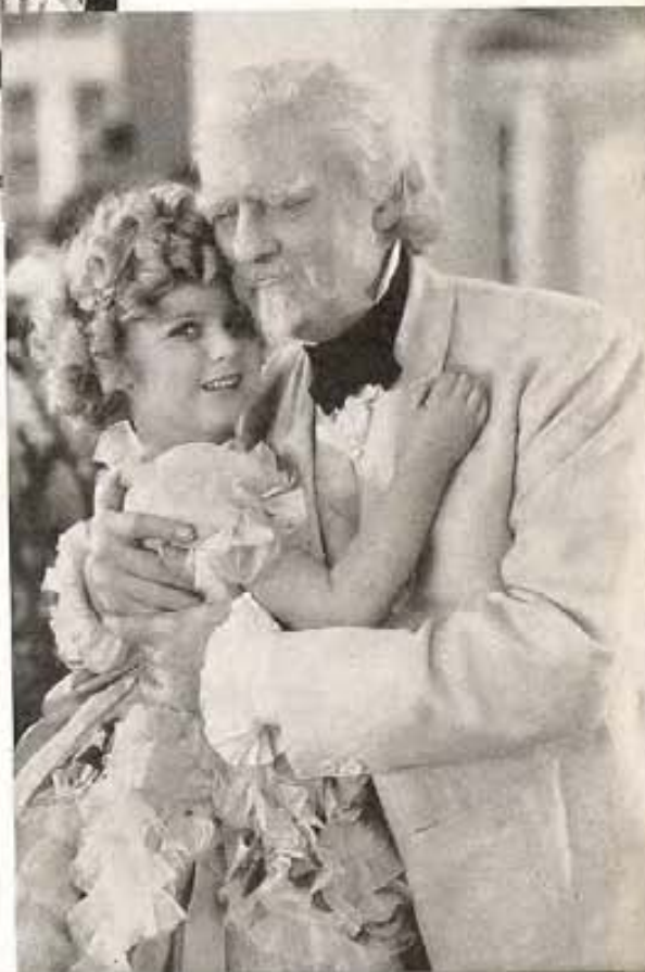
Y por último, el amor del abuelo por la nieta y viceversa. Amor doble, por parte del anciano, a quien la nietecita traviesa y linda transporta a través de los años a otros tiempos y otros momentos inolvidables de amor paternal. Shirley Temple y Lionel Barrymore en "The Little Colonel," de Fox.