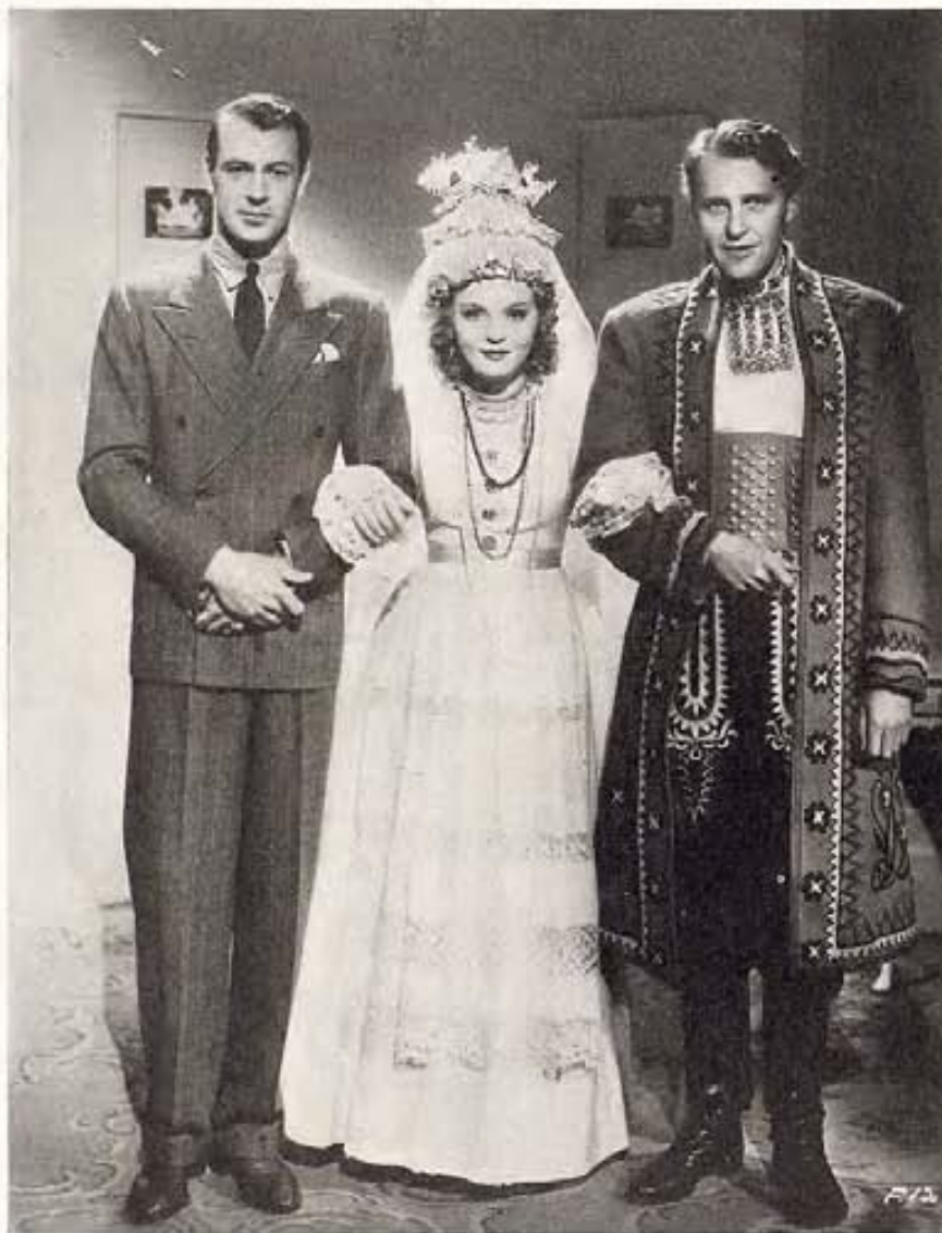
Gary Cooper, Anna Sten y Ralph Bellamy, en los trajes en que aparecen en el film "The Wedding Night," de Artistas Unidos.

—No puedo quejarme. Pero toda mujer siente en lo más íntimo de su corazón el