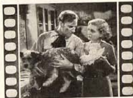
"NIGHT LIFE OF THE GODS"