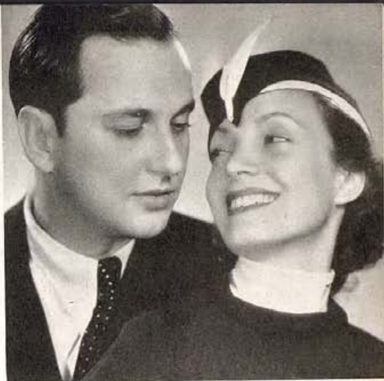
Arriba, dos tórtolos. Coquetona ella, esquivo él, como si no las tuviera todas consigo. Quizá sepa él por experiencia que su sonrisa coqueta no es patrimonio exclusivo de él. Pero en fin, sólo se trata de Raul Roulien y Conchita Montenegro en "Aseguro a su mujer," de Fox.