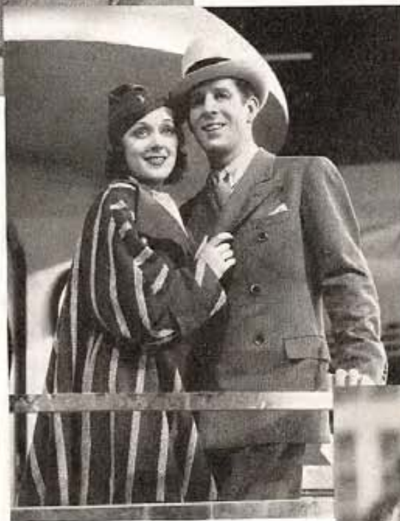
A la izquierda, amor "spanish" a la Hollywood. Un "flirteo" entre George Raft y Margo, en "Rumba," película Paramount. Arriba, amor musical. Ann Dvorak y Rudy Vallée en una escena del film "Sweet Music," de Warner Brothers.