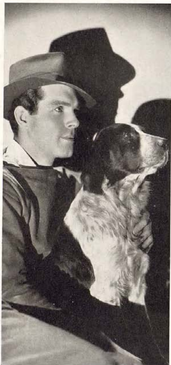
Presentamos a Fred MacMurray joven actor del elenco Paramount, que se distingue en el papel de protagonista en la cinta "The Gilded Lily" de ese estudio. Claudette Colbert desempeña el rol de primera dama.