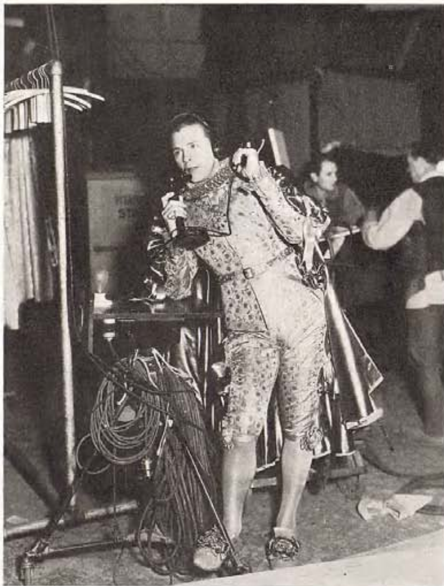
¿Qué cosa más discordante que ver a un paje del siglo XVII hablar por teléfono siglo XX? Pero eso es precisamente lo que está haciendo Dick Powell durante la filmación de "Midsummer Night's Dream," de Warners.

Al año siguiente, 1925, Carole hizo su debut en la pantalla cuando aún no había cumplido los diez y seis. Las burlas de su familia resultaron una broma pesada. La muchachita casquivana que estaba loca por