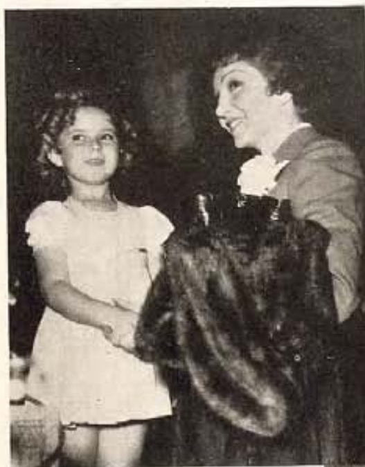
Claudette Colbert la mejor actriz