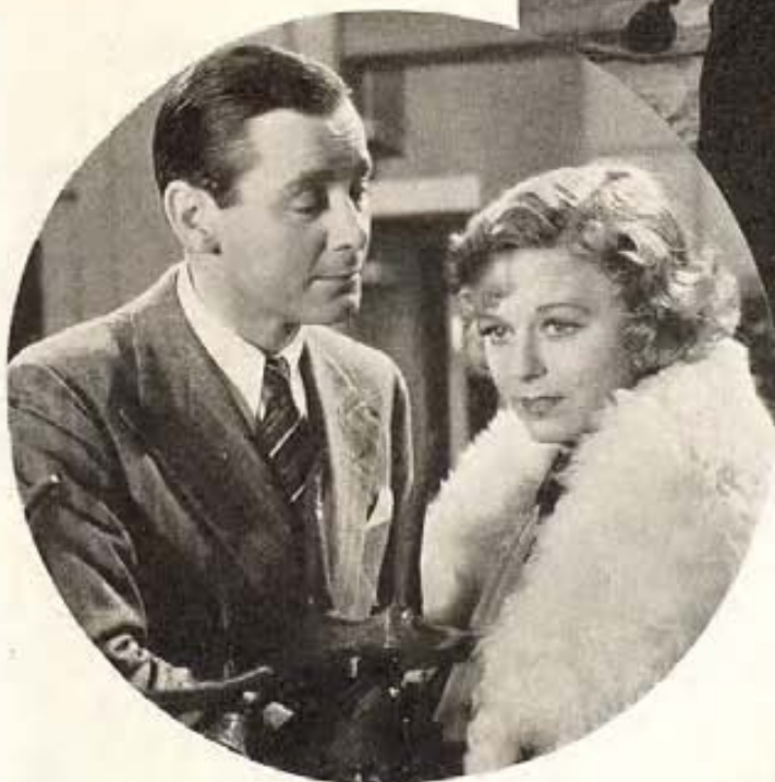
Arriba, en el círculo, Margaret con su leading man, Herbert Marshall, y en la página opuesta, el vestido de novia que luce ella en "The Good Fairy," film Universal.