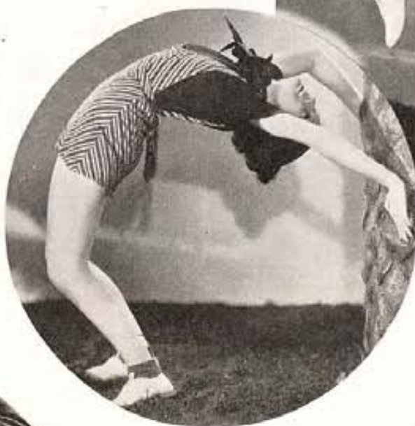
Los ejercicios de Conchita son sencillos, según ella, pero pensamos que se necesita ser esbelta para hacerlos. No podemos imaginarnos a Mae West haciendo el de la izquierda. . . .