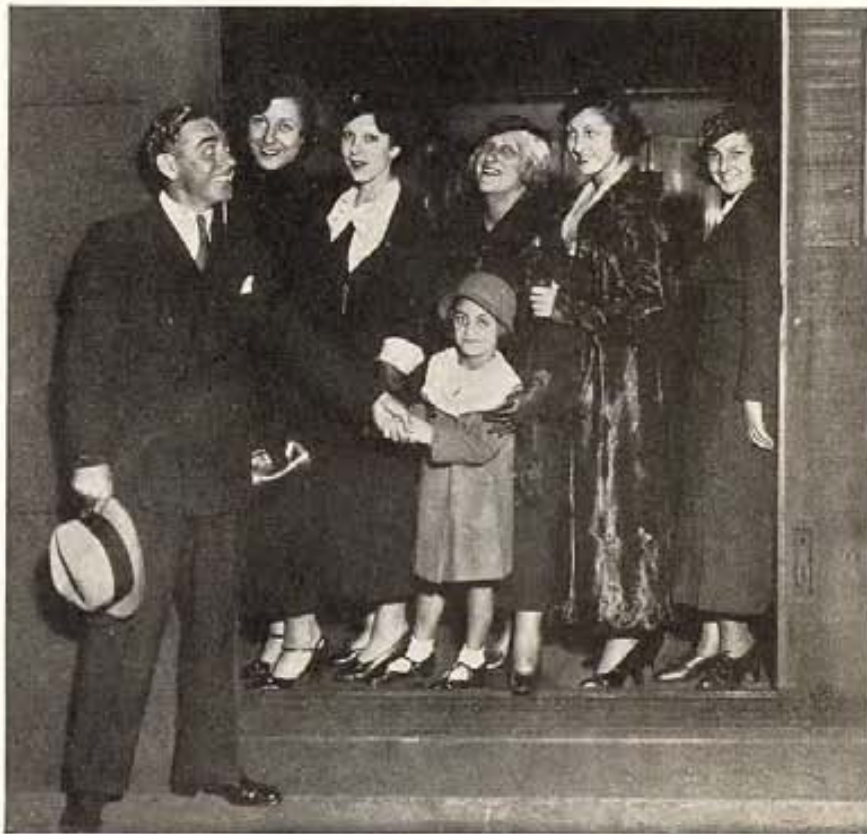
"¡Hot Cha!", dice Eddie Cantor al mostrarnos a su familia compuesta enteramente de mujeres. Cinco hijas, cuéntelas, y ni un solo varón para perpetuar el apellido Cantor. La esposa de Eddie aparece en el centro del grupo.

MARTHA MERRILL, una bella corista que fuese descubierta por Dick Powell para actuar junto al tenor en una cinta corta de propaganda, ha visto con satisfacción que su contrato con Warner-First National ha sido renovado por el plazo de un año.