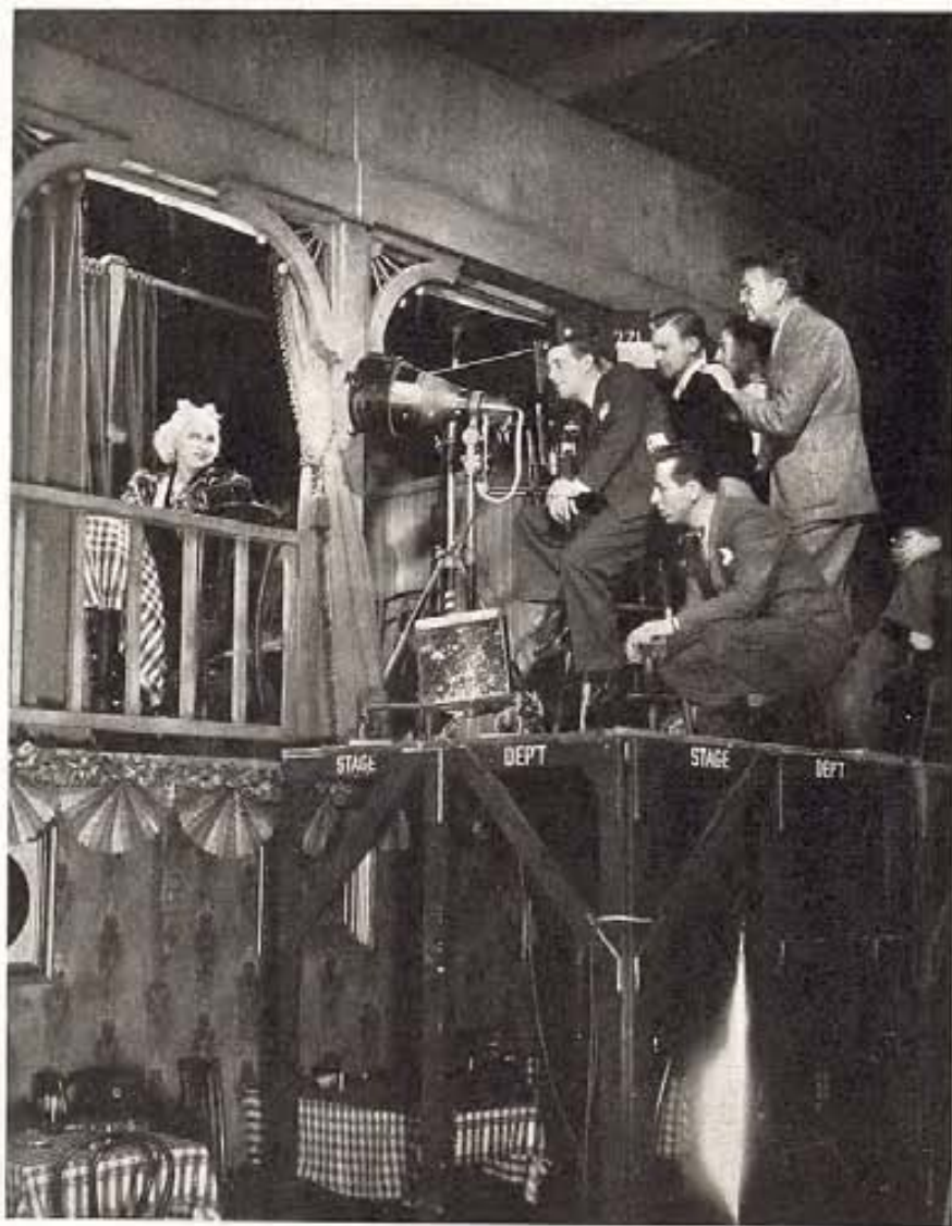
Mae West demanda, como siempre, gran atención del sexo feo. Aquí vemos a Mae con una de esas miradas que la han hecho famosa, durante la filmación de "Now I'm a Lady," de Paramount.

—La era de las líneas delgadas tiene que desaparecer de Hollywood. Comenzó de una manera inesperada, no debido a un capricho