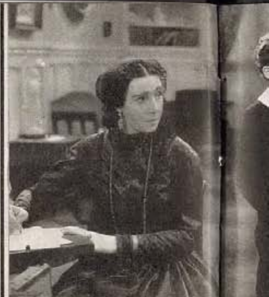
A la derecha, una escena en la que vemos al niño David bajo la austera tutela de su padrastro, Mr. Murdstone, Basil Rathbone, y la hermana de éste.