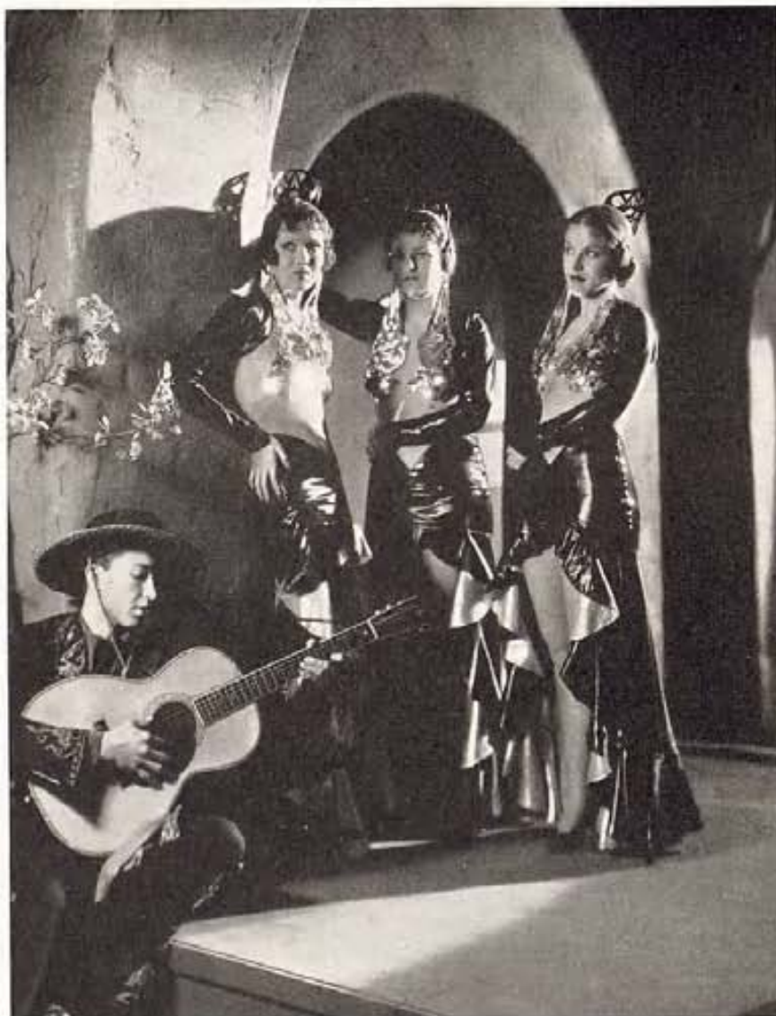
Una escena de la California en tiempos coloniales, reproducida en el film "Go Into Your Dance," de Warners, con Al Jolson y Ruby Keeler, en los papeles principales.

FRANCHOT TONE , el constante compañero de Joan Crawford, también piensa escribir una novela. Pero lo interesante del caso es que la heroína de su libro será la