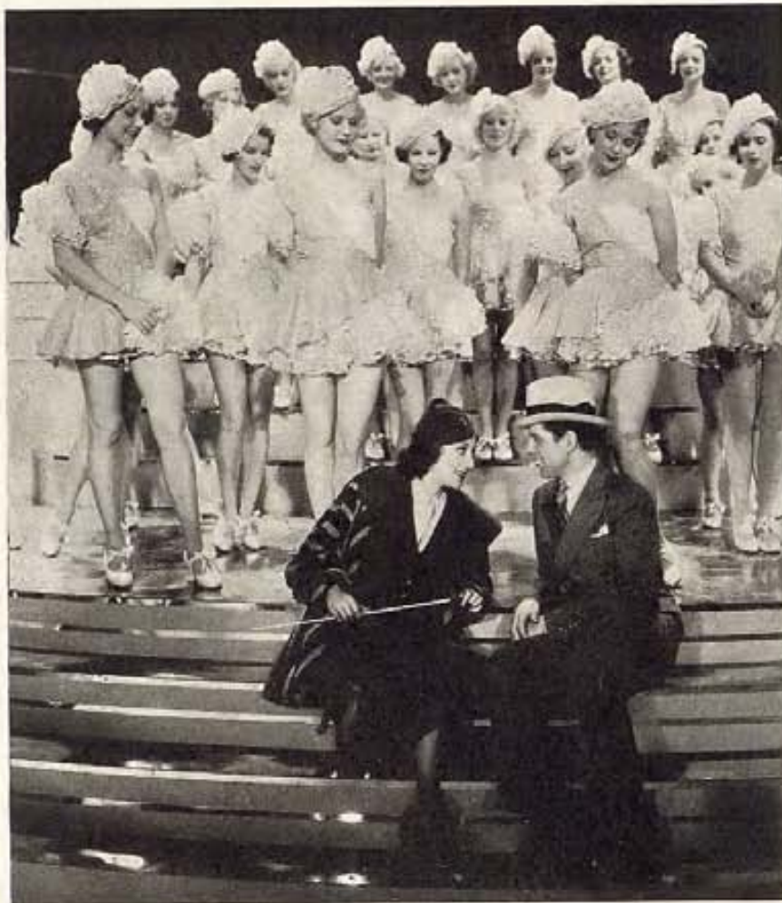
En "Sweet Music," Ann Dvorak y Rudy Vallee aparecen acompañados de un coro de niñas lindas.