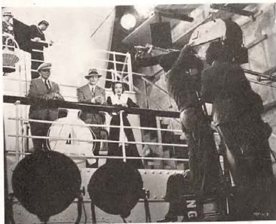
Esta escena detrás de bastidores, durante la filmación de "Forsaking All Others," en los estudios MGM, presenta a Clark Gable y Joan Crawford en una de las escenas principales de la obra. Nótese la fiel reproducción del vapor, enteramente construido en el set.