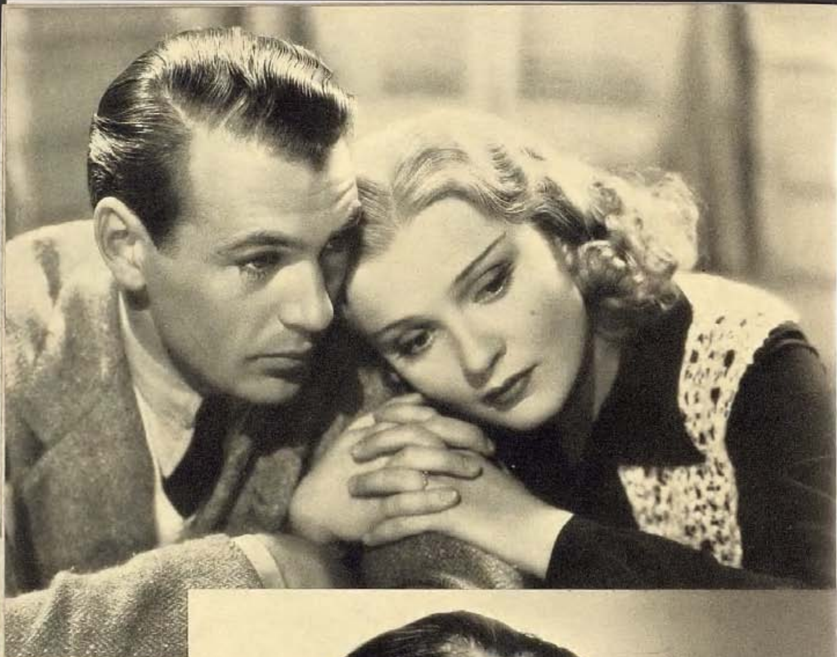
Aquí vemos a Anna Sten con Gary Cooper, en dos poses románticas de su más reciente película, "The Wedding Night," producción de Artistas Unidos. Ambos artistas alcanzan quizá, el triunfo más grande de sus respectivas carreras artísticas en este film de ambiente rural.