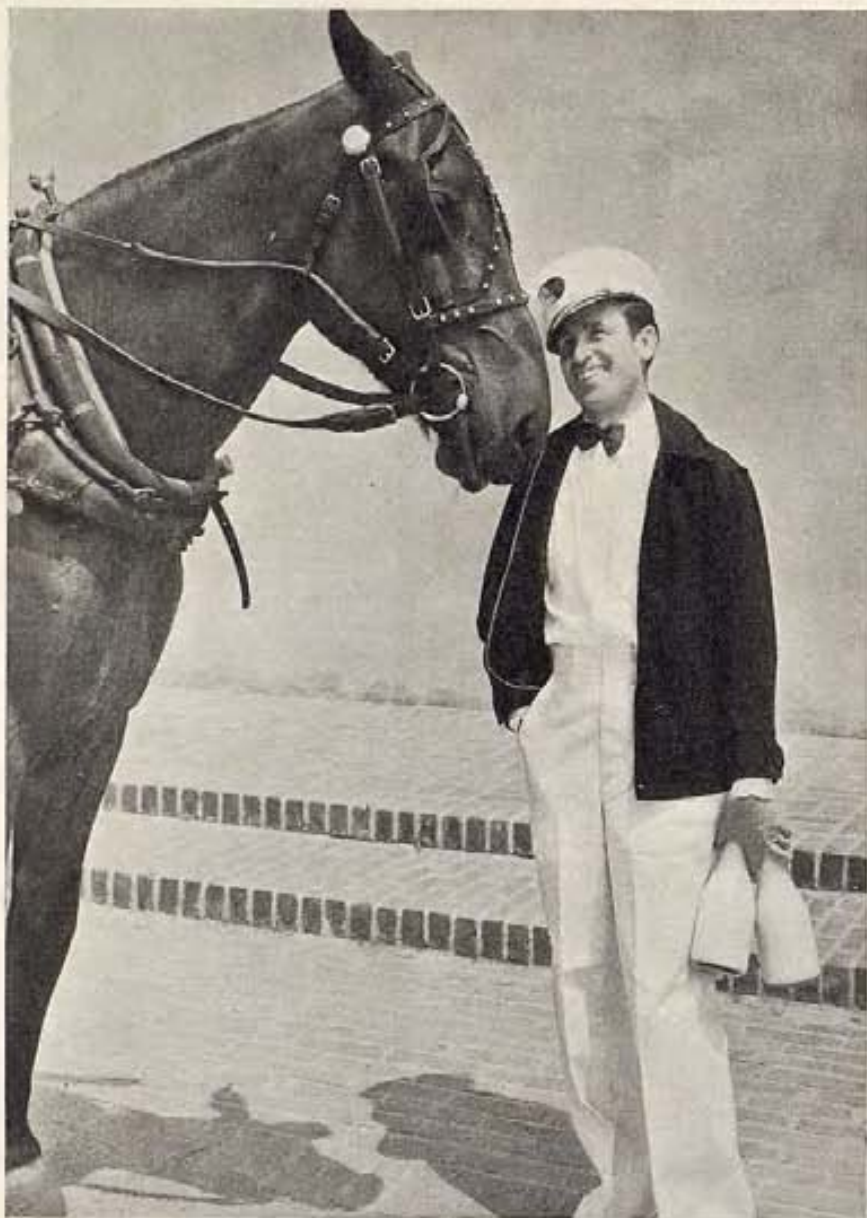
Harold Lloyd, caracteriza a un lechero, o más bien dicho, a un repartidor de leche, en su próxima película, que se titula, "The Milky Way," producción Paramount.

Brothers, Miss Davies tiene fama de ser la más cariñosa y delicada de las estrellas. Tres epítetos se usan generalmente para describirla: nice, sweet, beloved .