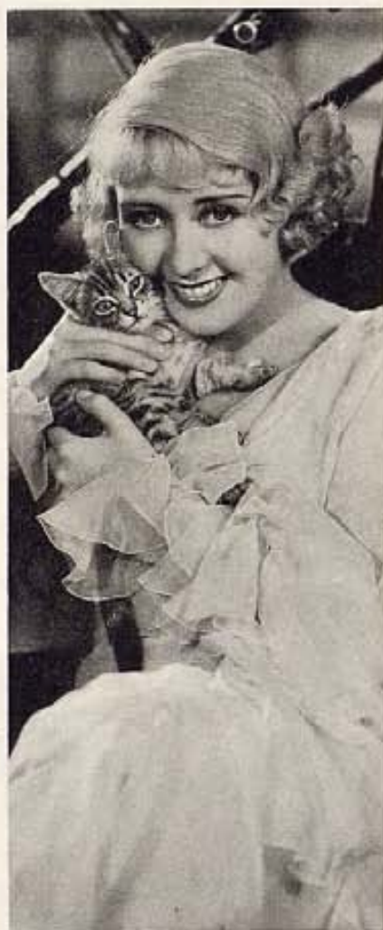
La hermosa Joan Blondell, artista del elenco Warner's sigue triunfando en películas de ese estudio.

Reg. U. S. Patent Office Member Audit Bureau of Circulations