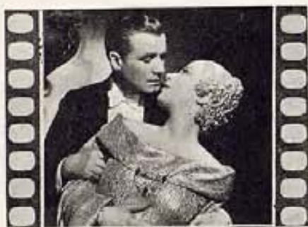
"PARIS IN SPRING"