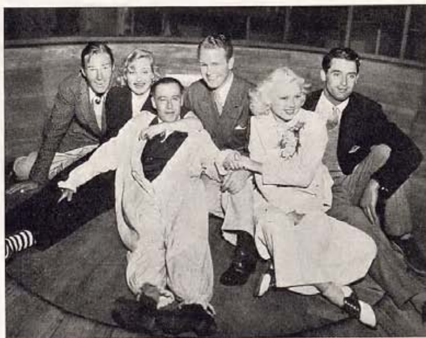
Un grupo de artistas cinematográficos se divierte en la Feria de San Diego. Son Randolph Scott, Carole Lombard, Regis Toomey, Toby Wing y Cary Grant, todos de Paramount.