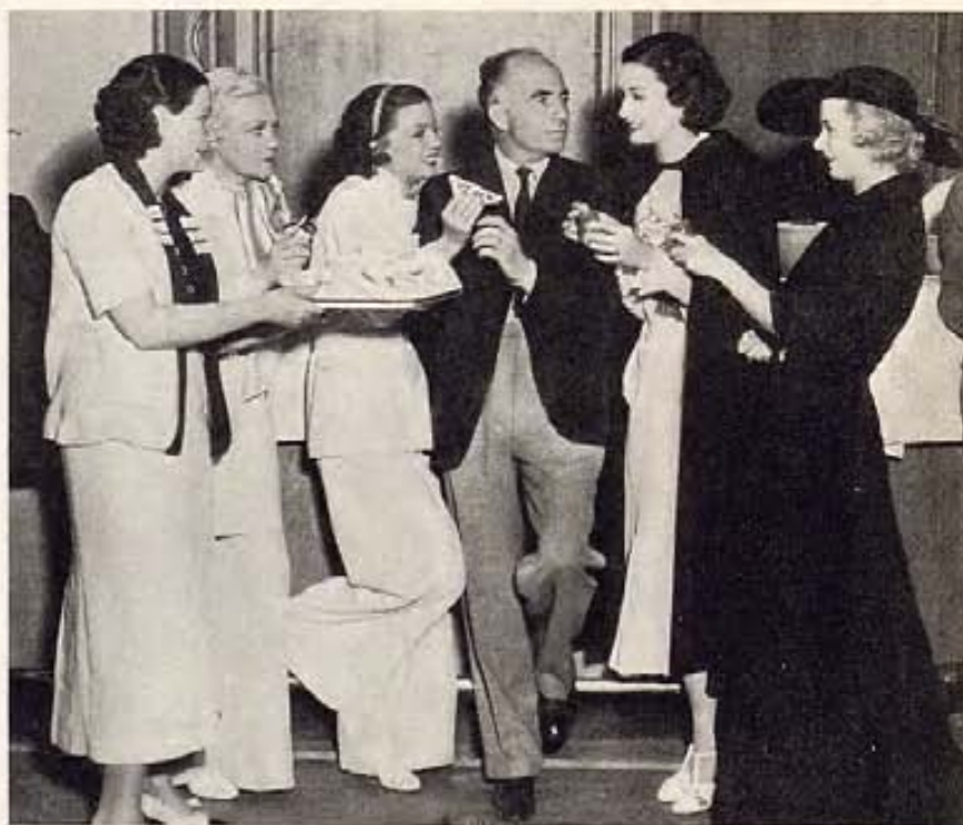
Las ventajas de ser un director famoso. Aquí vemos a Gregory LaCava rodeado de un quinteto de bellas artistas de Paramount que le ofrecen golosinas. Son Patsy Kelly, Alice Faye, Frances Langford, Gail Patrick y Joan Bennett.