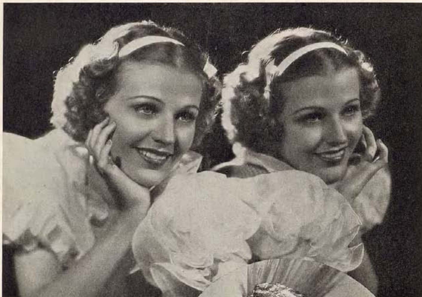
Estas dos jóvenes artistas que no ha mucho fueran contratadas ventajosamente, triunfan por sus propios encantos y personalidades. Arriba, Florence Rice, de la empresa Columbia; en el círculo, Dorothy Page, de la casa Universal.

¡E L CINE está en peligro de quedarse sin estrellas!