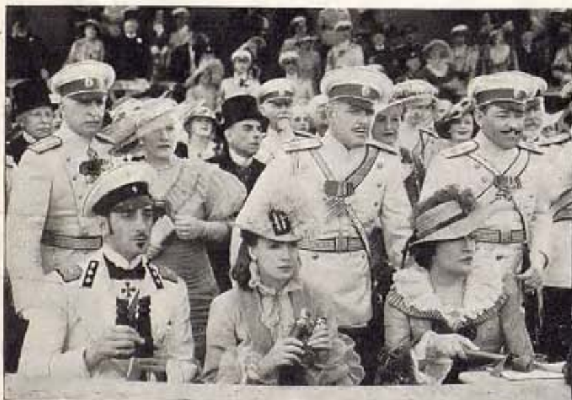
Arriba, Greta Garbo y Fredric March, los protagonistas, en una escena romántica. Abajo, dos escenas importantes de esta película mostrando los principales artistas.

—No tengo el placer—respondió sonriendo el oficial.