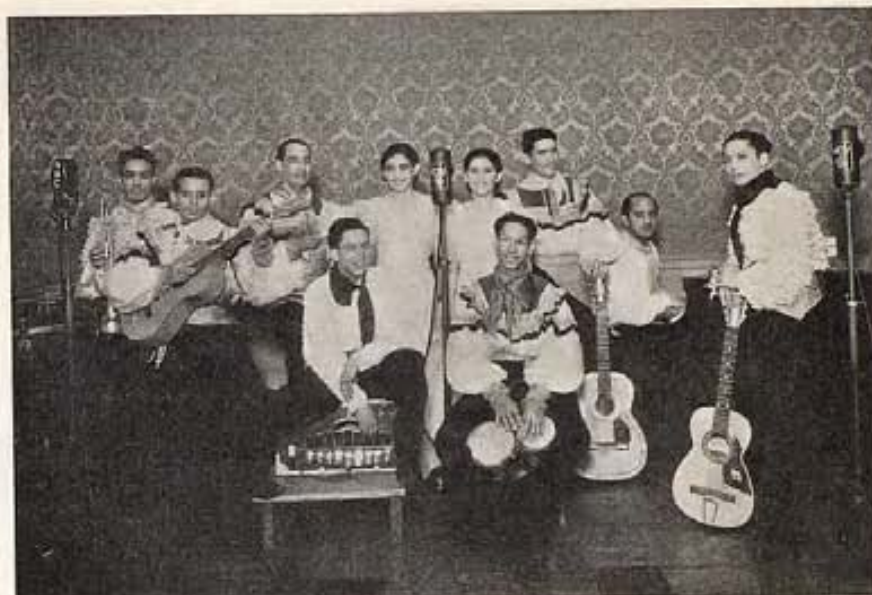
Conjunto puertorriqueño "Brisas de las Antillas," en un estudio de la Estación WZXF de la General Electric en Schenectady. Junio de 1935.

HIDEOUT —MGM.—Con Robert Montgomery y Maureen O'Sullivan. La historia de un "raque-