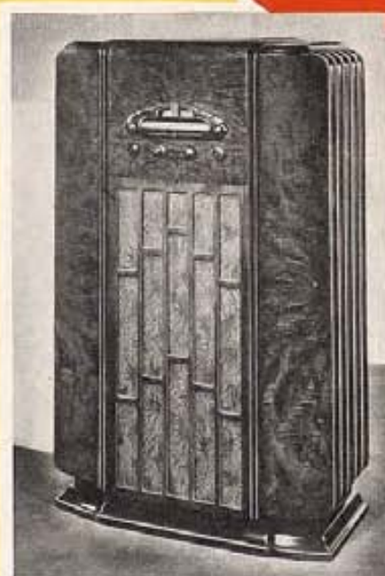
Receptor "General Eléctric" de toda onda, del modelo A-125 superheterodino, de 12 válvulas, con gamas ampliadas de ondas largas y ultracortas. Enteramente provisto de válvulas metálicas. Mueble de nogal de estilo neoclásico.

Los muchos modelos, ya de mesa o de piso, de estilo bellísimo, están actualmente en exhibición en los establecimientos de los revendedores del material "General Eléctric".