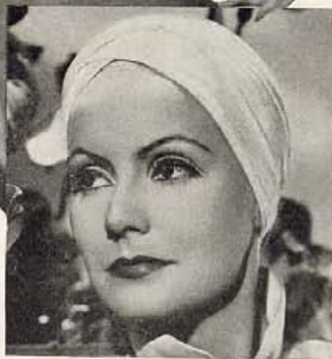
Arriba, Katharine Hepburn, de RKO; centro, Greta Garbo, y derecha, Joan Crawford, ambas de MGM. Luminarias de quienes habla el autor en este artículo.

“G RETA GARBO odia la publicidad,” se ha dicho de ella a menudo en forma casi oficial. “Agradece que no se hable de ella y por eso se niega a presentarse en público y a dejarse entrevistar.” Y sin embargo, todos los meses el chauffeur de la estrella va a dejar al correo un paquete de revistas que la estrella envía a su madre, en Suecia, después de leerlas ella. Lo curioso del caso es que se trata justamente de los magazines cinematográficos de la ciudad del cine y