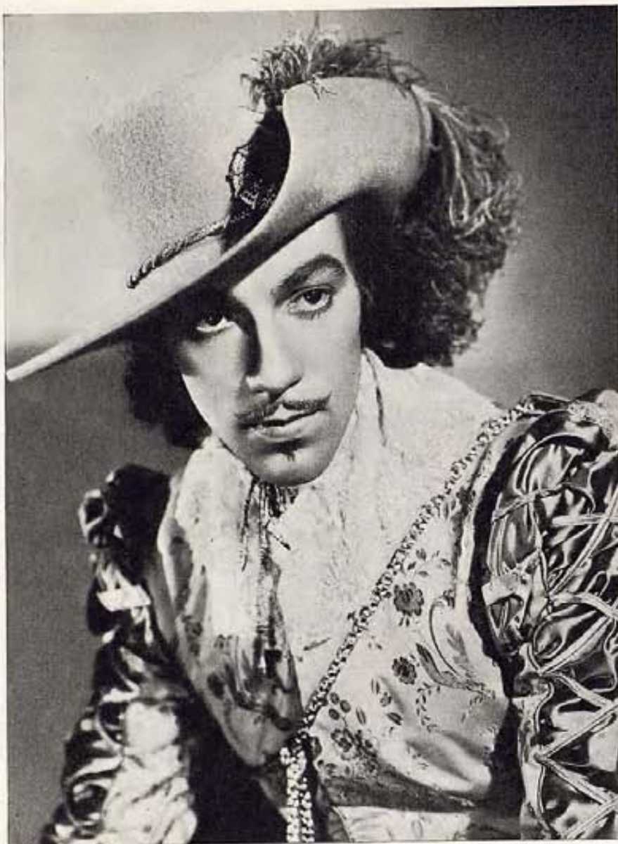
Aquí vemos a Cesar Romero en el uniforme que usara en la película, "El Cardenal Richelieu," en la que desempeñó un buen papel junto al gran actor, George Arliss.