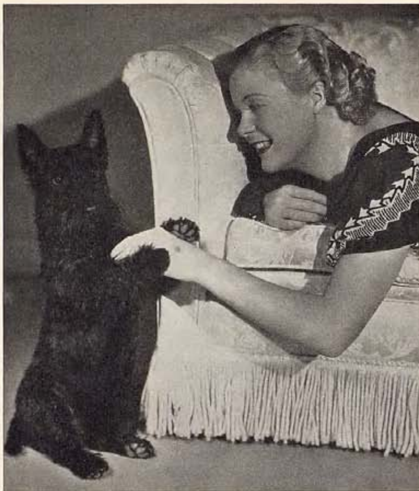
El perrito de Jean Muir, artista de Warner Brothers, es un cachorro "scotch terrier," negro, de pura raza. Estos terriers son muy populares en los momentos actuales.

gran negocio vendiendo cachorros. Joan Crawford posee un perro alemán, Daschund, llamado Baby y Franchot Tone otro de igual raza, regalado por aquella, que se llama Pupchen. Maureen O'Sullivan ha hecho construir un verdadero dormitorio y cuarto de baño para su perro, Roger, y June Knight posee un perro policía llamado Padriac, que es un verdadero compañero de la estrella en sus excursiones.