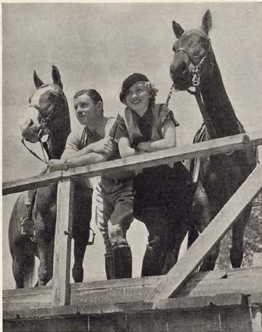
El galán joven, George Murphy, y la dama joven, Marian Marsh, ambos del elenco Columbia, practican su deporte favorito, la equitación, uno de los pasatiempos más populares en Hollywood.