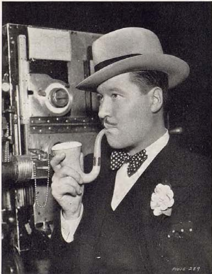
A Jack Oakie le ha entrado por formar una colección de pipas. Aquí lo vemos con su adquisición más reciente que debe usar una libra de picadura cada vez que la fuma. Jack está filmando "The Big Broadcast of 1935."

Cuando el mes pasado entrevisté a Joan Crawford a nombre de CINELANDIA, gran cantidad de muchachas formularon una interesante pregunta. Y la han vuelto a repetir: