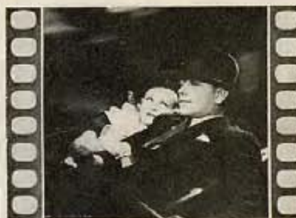
"SHE COULDN'T TAKE IT"

El tipo creado por el actor Horton vuelve a la pantalla una vez más. El argumento nos presenta al hombre tímido y de buena voluntad que está conforme con todo y no aspira a nada. Temeroso de padecer de mal del estómago que él cree curar por medio de una infinidad de píldoras y pastillas de todas clases, y que son causa de su malestar, consulta a un doctor, que lo examina y lo encuentra en perfecto estado de salud. Pero la enfermera le entrega a Horton la diagnosis de otro a quien el doctor no da más de tres meses de vida. Al verse condenado a muerte por una enfermedad que no padece, Horton cambia por completo de carácter y de tímido se vuelve osado en extremo. Su nueva caracterización que tan mal le sienta, y el diálogo chispeante de la obra hacen resaltar la buena dirección de William Nigh.