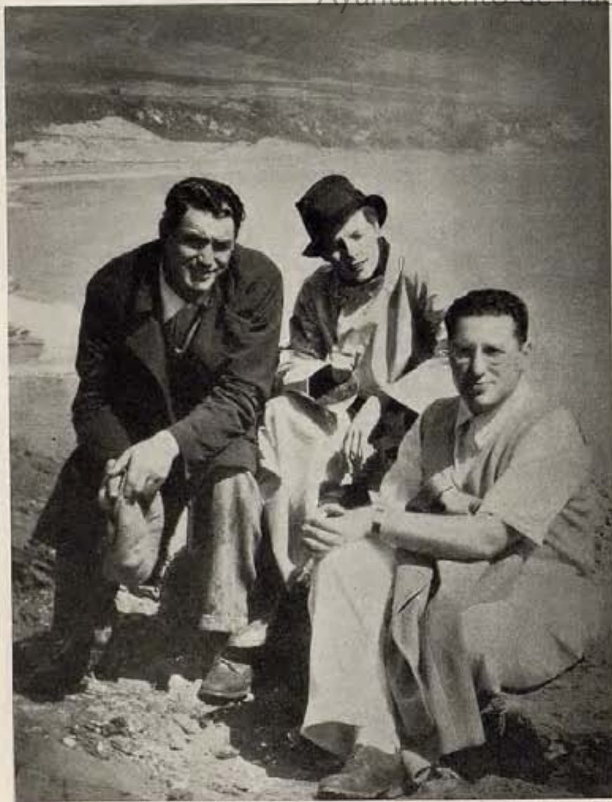
Una consulta íntima entre los personajes más importantes de la película "Sylvia Scarlett," de los estudios R.K.O. Los protagonistas Cary Grant y Katharine Hepburn discuten la producción con el director George Cukor "en location" en la playa.

Se preparan a filmar también "Ramona," y "Message to García," basada en un interesante episodio de la guerra entre Estados Unidos y España, en Cuba, de la que Wallace Beery será el protagonista; "The King of Burlesque," con Warner Baxter; "Professional Soldier," con Victor McLaglen y el chico Freddie Bartholomew y está por entregarse al mercado "The Man Who Broke the Bank at Monte Carlo," de la que Ronald Colman es el astro. Pero hay que confesar que Darryl Zanuck, fundador de la empresa Twentieth Century y nuevo jefe de producción de la empresa recientemente formada con la adición de la Fox, es hombre que sabe lo que la palabra superproducción significa y da a las películas que así califica la ver-