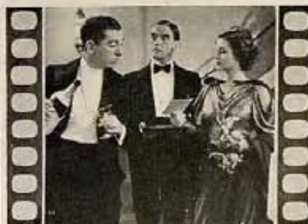
"HIS NIGHT OUT"