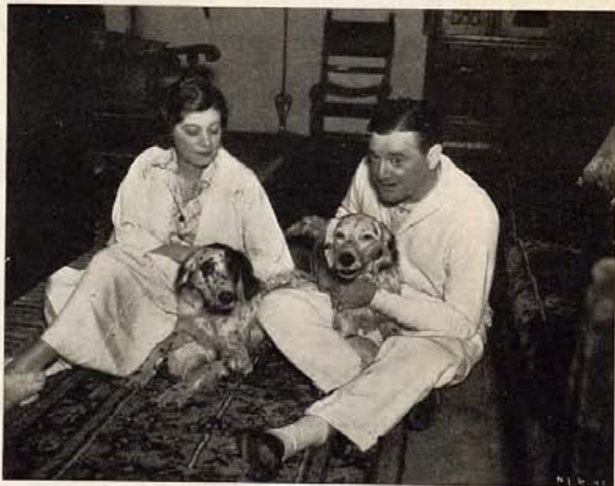
Richard Dix parece haber encontrado felicidad en su último matrimonio. Aquí lo vemos con su esposa, exsecretaria suya, que hace poco presentara a su marido con un par de niños gemelos, muy jóvenes aun para aparecer en el retrato.