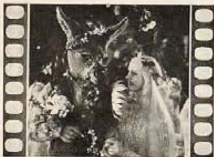
"MIDSUMMER NIGHT'S DREAM"

Pocas veces se da el caso de una personalidad famosa del radio que traiga a la pantalla una figura que resulte agradable a la vista tanto como al oído. James Melton, además de poseer una voz agradable y bien cultivada, es alto, bien proporcionado y tiene una fisonomía atrayente que le ha de conquistar muchas admiradoras. Del argumento no hay que hablar, pues nada tiene de nuevo y sólo sirve de base para presentar al protagonista en varios números de música alegre y popular. Melton prueba también que posee una voz fuerte, cantando con gran maestría un aria de "Aida." Es secundado por Jane Froman, otra debutante del radio, poseedora de una voz bien timbrada y una personalidad atractiva. La parte dramática de la cinta está a cargo de Pat O'Brien y Jean Muir, con el cómico Frank McHugh.