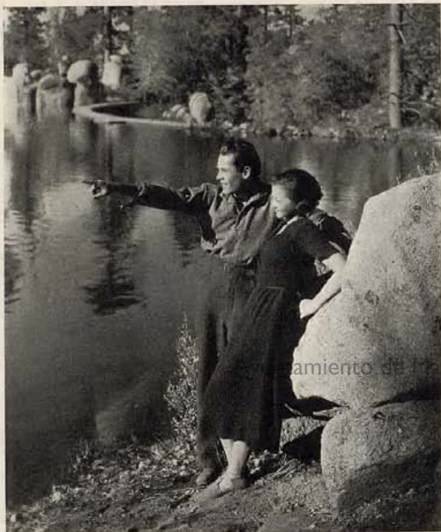
Uno de los mejores paisajes entre los muchos que se ven en la película "The Trail of the Lonesome Pine," que está filmando Paramount. Los artistas son Henry Fonda y Sylvia Sydney. Fred MacMurray es también uno de los principales.

—¿Qué es lo que más la impresiona en la vida?