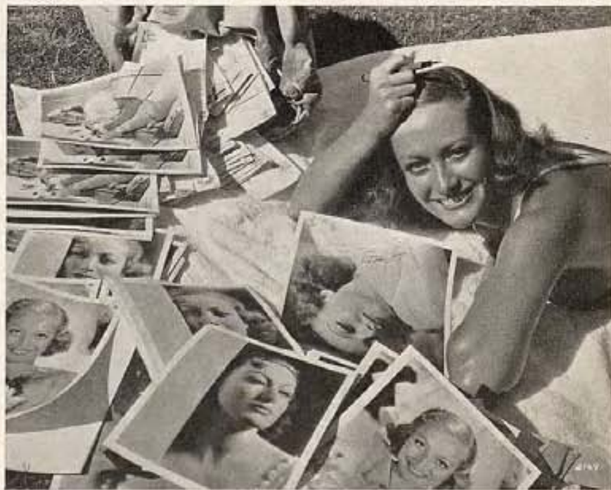
Joan Crawford combina dos placeres. Aquí la vemos tomando una soleada en su jardín, a la vez que aprovecha la oportunidad de firmar autógrafos en las fotos que le piden sus admiradores. Joan acaba de casarse con Franchot Tone.

Es lamentable que los dirigentes de la Metro no pongan más atención a las obras que filman, porque va de por medio la fama de la gran estrella. Mientras que los productores no comprendan que un buen argumento es la base primordial para el éxito de (va a la página 54)