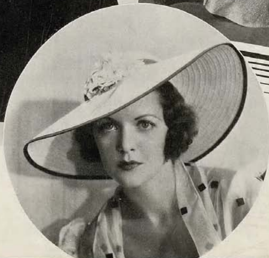
Bonito sombrero de paja, con copa pequeña y ala ancha, es el que vemos en la actriz Kay Hughes, de la casa Columbia. Listón azul y un ramillete de flores, son el adorno del mismo.