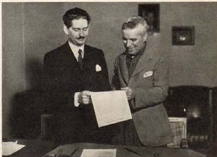
Con fe ciega en el talento de Charles Chaplin y en la excelencia de sus producciones, un empresario de Londres, Mr. A. W. Jarratt, viene personalmente a Hollywood a firmar un contrato con el insigne cómico para presentar su film "Modern Times."

D URANTE LOS ULTIMOS seis meses, los estudios de R.K.O. han usado un total de 25,000 extras en escenas de conjunto de sus producciones, y esperan usar otros tantos en el próximo semestre. Lo que significa que los comparsas de Hollywood están en la gloria, ya que sus vidas son como las acciones de la bolsa. (va a la página 55)