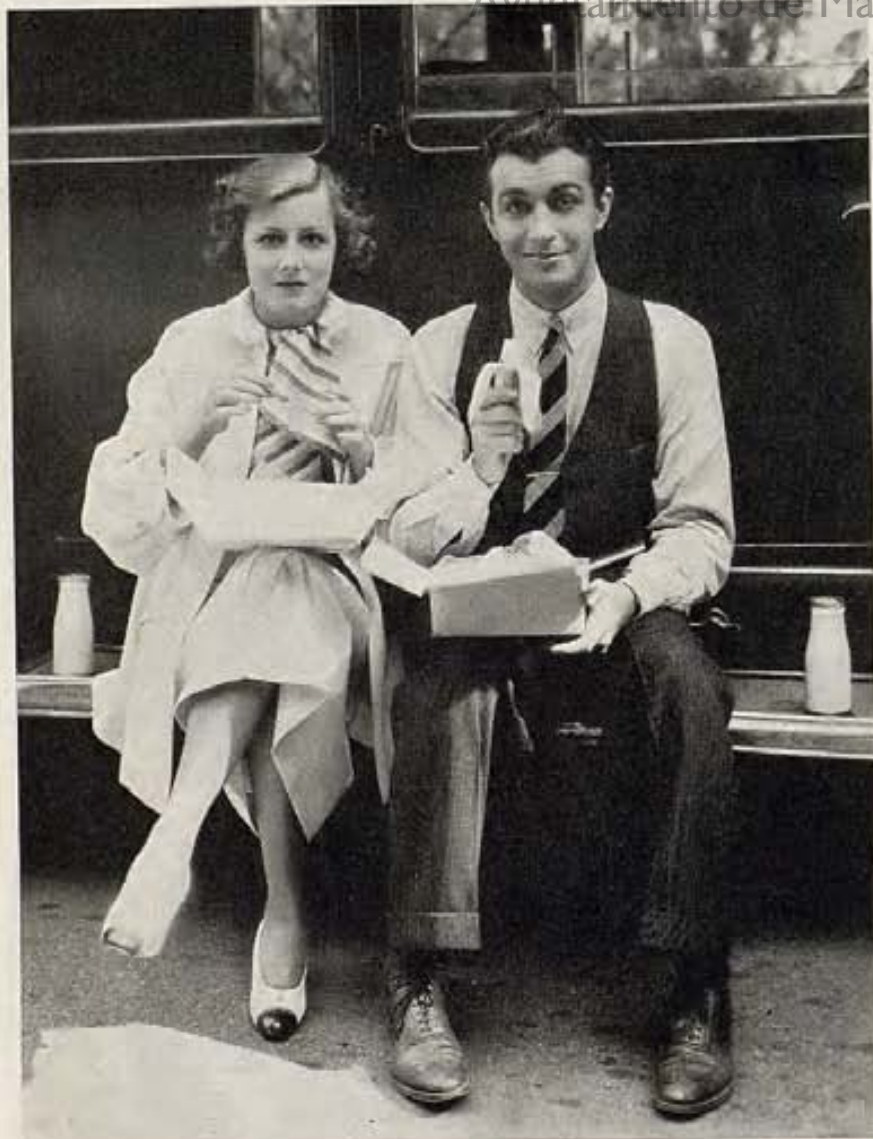
Una escena doméstica entre los protagonistas de la película "Magnificent Obsession," de Universal. Irene Dunne y Robert Taylor, "en location" en uno de los parques de Los Angeles, toman una ligera merienda como cualquier burgués ordinario.

Nada es más peligroso que reunir a esposos divorciados en las mismas películas. Por lo general, todos los estudios evitan tamaño peligro. Pero a veces las circunstancias, o la fuerza obligatoria de los contratos se conjuran contra los buenos deseos de los productores. Hace poco Claudette Colbert y Norman Foster, que estaban divorciados, estuvieron a punto de encabezar