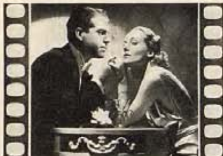
"HANDS ACROSS THE TABLE"