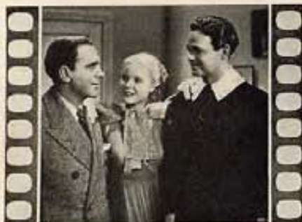
"STARS OVER BROADWAY"