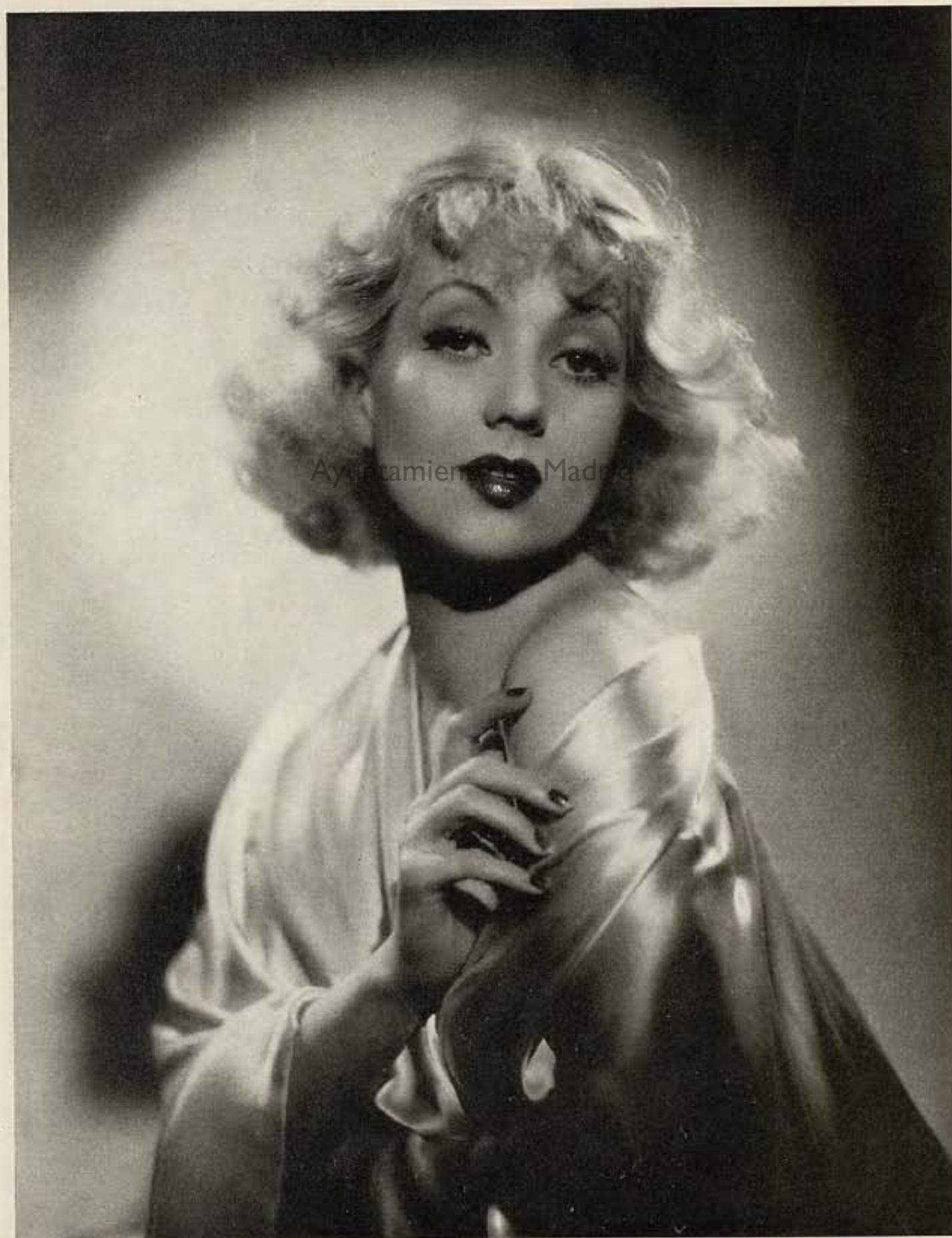
Esta bella actriz del elenco Columbia, se encuentra filmando "Panic On the Air," con Lloyd Nolan. Su próxima película será "Hell Ship Morgan" con George Bancroft, de protagonista, secundado por Victor Jory, del mismo estudio.