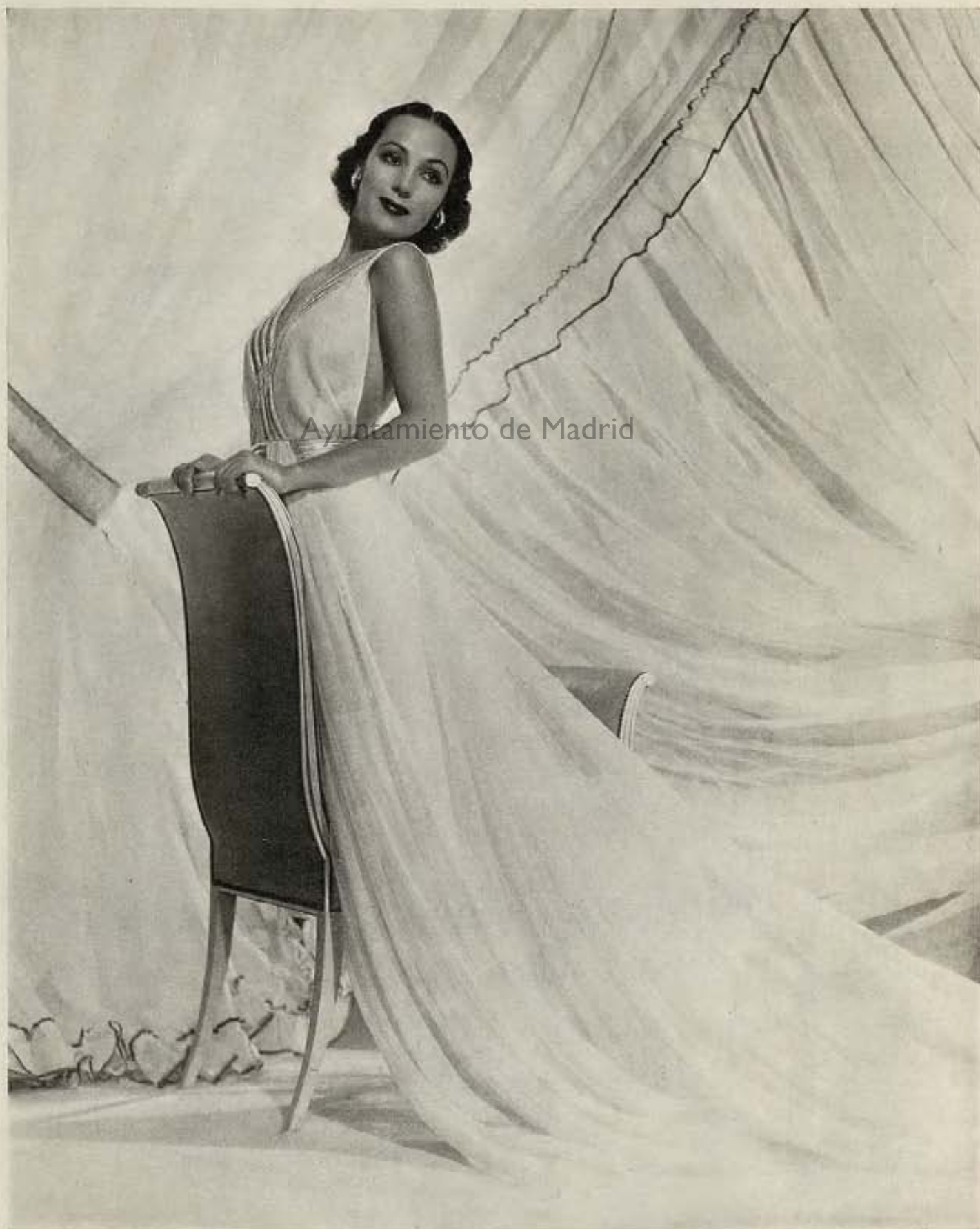
Silueta griega . . . Dolores del Río, aparece así en el film "I Live for Love," de Warner Bros. El talle, de bajo descote, está exquisitamente adornado con bandas de tela metálica.