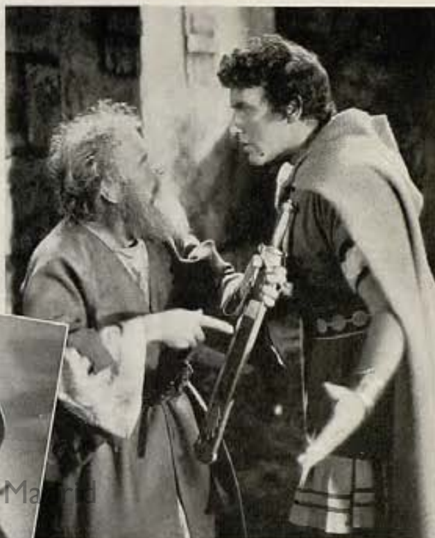
Arriba vemos a Preston Foster en "The Last Days of Pompeii," de R.K.O.; centro, cinco bellezas del film "Anything Goes," de Paramount; círculo, Clark Gable y Maimiti en "Mutiny on the Bounty" de M-G-M. Abajo, Ann Harding y Gary Cooper en "Peter Ibbetson," de Paramount, y Henry Stephenson y Olivia de Havilland en "Captain Blood," de Warners.

midable. Las superproducciones son en realidad golpes de audacia de productores cinematográficos avezados que, echando mano de algún gran tema, se animan a lanzarse en la obra peligrosa de invertir dos o tres veces el costo regular de una cinta, en filmar una película de proporciones que puede dar diez veces su utilidad... como puede ser también un fracaso