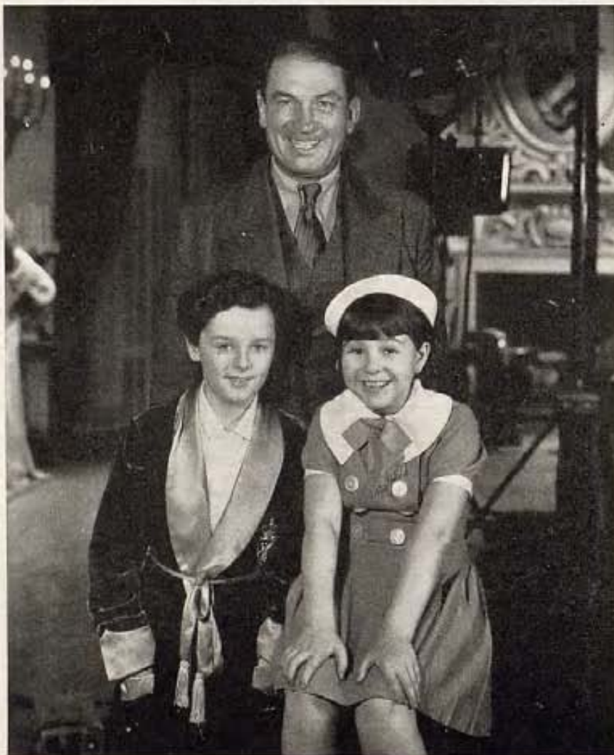
Dos chiquillos que, últimamente, han escalado las alturas de la fama cinematográfica. Freddie Bartholomew, vino de Inglaterra y filma ahora, "Professional Soldier", en 20th Century-Fox. Jane Withers acaba de filmar "Paddy O'Day", en ese estudio.

¿Será que en verdad las cosas son tan fáciles como nos las pinta ella? Porque según Ginger, se puede llegar a ser una gran bailarina sin haber tomado jamás lecciones de baile y a fuerza de saltar rítmicamente sobre las puntas de los pies se puede llegar a ser una actriz magistral y se puede con un poco de "confianza en uno mismo" lograr todas las cosas en la vida incluso la evasiva felicidad, señuelo universal de los seres.