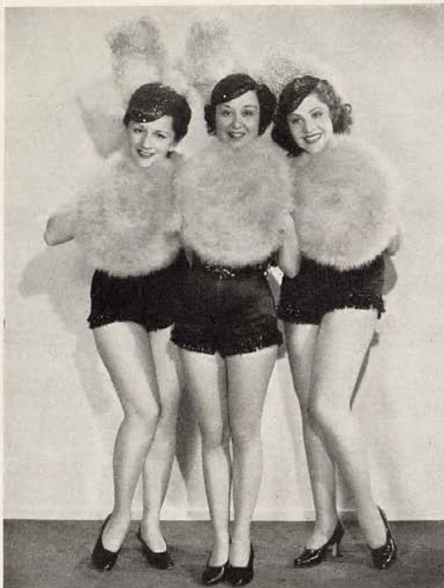
Con las manos calientes y las piernas frías. Estas tres bellezas del coro que aparecerá en el film "King of Burlesque", de 20th Century-Fox, es una pequeña muestra del buen gusto con que se ha escogido el reparto de esa película musical.