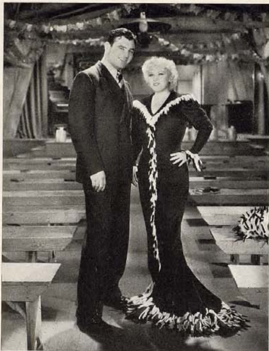
El campeón de boxeo de peso mayor, James J. Braddock, de paso por Los Angeles, visita los estudios Paramount, y se retrata con la actriz Mae West, en el set donde ésta filma "Klondike Lou."

O'Sullivan, Reginald Owen, Jean Parker, Eleanor Powell, William Powell, Luise Rainer, May Robson, Mickey Rooney, Freddie Bartholomew, Lionel Barrymore, Rosalind Russell, Lewis Stone, Gloria Swanson, Robert Taylor, Franchot Tone, Spencer Tracy, Johnny Weissmuller, Robert Young, Jackie Cooper, Charles Chic Sale, Joseph Calleia, Elizabeth Allan y Eric Linden. De esos cincuenta y dos nombres, sólo once son extranjeros. Greta Garbo es sueca, Jean Hersholt dinamarqués, Brian Aherne, Freddie Bartholomew, Elizabeth Allan, Joseph Calleia y Reginald Owen son ingleses, Maureen O'Sullivan irlandesa, Norma Shearer canadiense y Luise Rainer y Paul Lukas son húngaros.