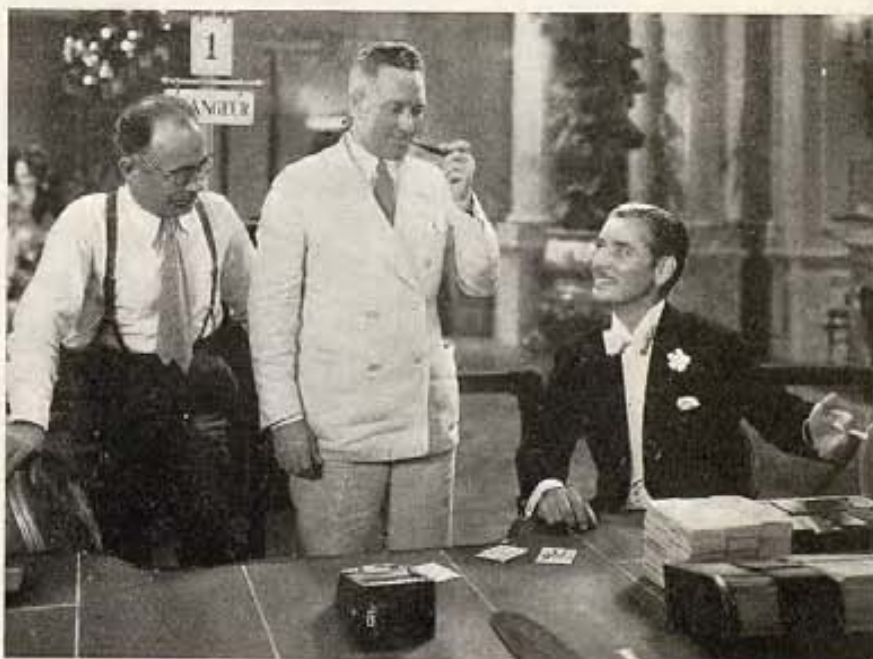
Ronald Colman, "El hombre que hizo saltar la banca en Monte Carlo", (título de su última película) le enseña sus riquezas al famoso explorador polar, el Almirante Byrd, y le promete su ayuda pecuniaria para otro viaje al polo. La película es producto de la 20th Century-Fox.

Un nuevo capítulo comenzaba en la vida del célebre sabio francés. Desde ahora dedicaba todos sus esfuerzos a descubrir el microbio de la rabia.