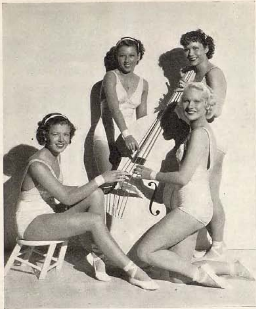
La película musical "King of Burlesque", de 20th Century-Fox, cuenta con un elenco de lindas y bien formadas jóvenes. El protagonista de esta cinta es Warner Baxter, con Alice Faye, Jackie Oakie y Mona Barrie en el reparto.

con una sola misión: la de entretener al público.