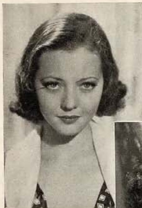
Arriba vemos a la joven estrella, Sylvia Sidney, de Walter Wanger Productions; la sigue Claudette Colbert, estrella de Paramount. En el círculo vemos a Victor McLaglen y Margot Grahame, que se distinguieron en "The Informer," de R.K.O. Abajo, Bette Davis, estrella de Warners.