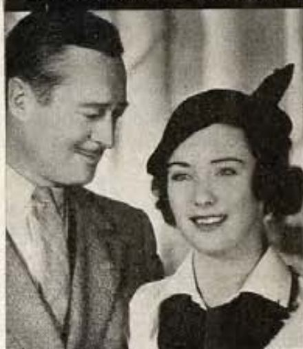
EDMUND LOWE VIO ESTOS LABIOS