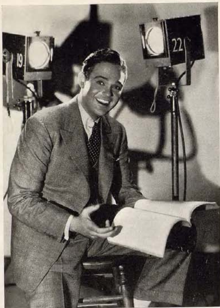
Poseedor de una sonrisa muy atractiva y de una voz viril y melodiosa, el artista de radio James Melton, debuta en el film, "Stars over Broadway," de los estudios Warner Brothers-First National. Aquí lo vemos ensayando su papel, argumento en mano.

la cinematografía francesa, el interés demostrado por Mussolini para ayudar al desarrollo del cine italiano y los esfuerzos dignos de elogio que se están realizando en México, España y la Argentina, parecen indicar a muchos que Hollywood pierde terreno como capital universal de la industria.