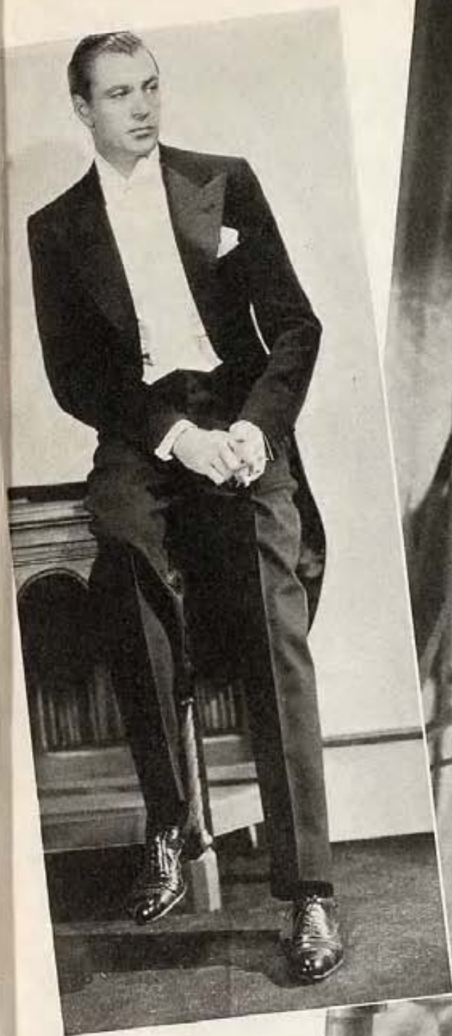
El traje de etiqueta moderno, dice Gary Cooper, no es tan cómodo como el de 1820, que usó en el film "Peter Ibbetson."