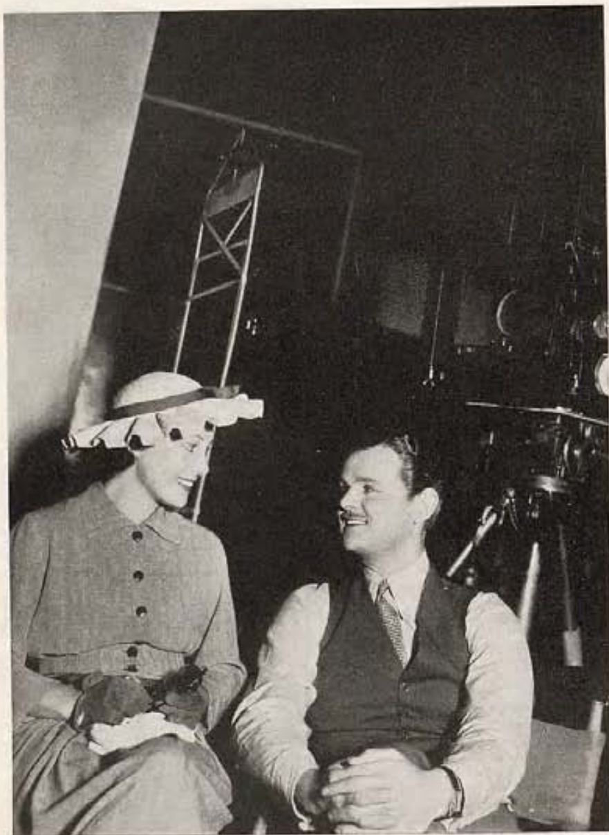
Dos cantantes notables pasan un momento entretenido en alegre charla. Ella es Gladys Swarthout, protagonista del film "Rosa del Rancho", de Paramount. El, Lawrence Tibbett, protagonista del film, "Metropolitan", de Twentieth Century-Fox.

—Que un día de buenas a primeras me convencí de mi gran equivocación. Dos personas que se comprenden pueden ser absolutamente felices y ser más fuertes que todas las dificultades que surjan en su camino. Pero