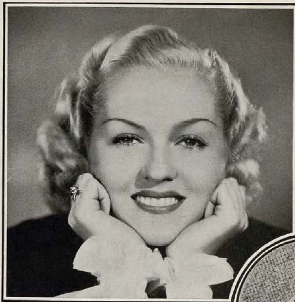
Patricia Ellis, que figura en "Bright Lights", producción musical de Warner Brothers, con Joe E. Brown como estrella.