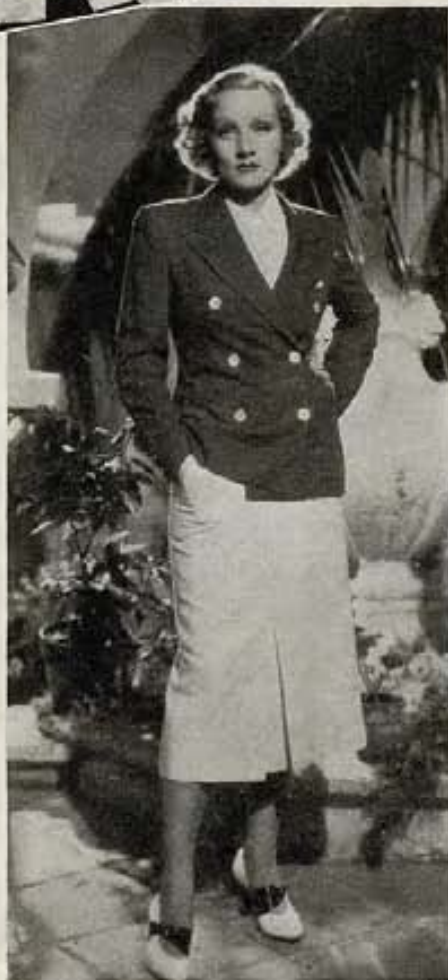
Tres personalidades destacadas del elemento foráneo en Cinelandia, son también las que aquí aparecen. Arriba, Elizabeth Allan, actriz inglesa, de M-G-M. Centro, Marlene Dietrich, estrella de Paramount, y abajo, el actor inglés, Charles Laughton.

Esa fué la primer barrera natural que detuvo al extranjero y abrió más las puertas al artista norteamericano. Pero al mismo tiempo es preciso confesar que ha habido otra razón de más peso y de mayor trascendencia que ha ido aumentando la popularidad de los intérpretes estadounidenses en el exterior, en detrimento de