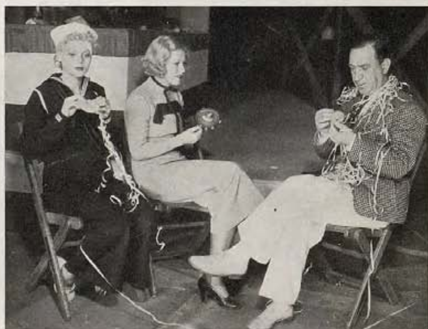
El actor cómico Hugh Herbert enseña a Marie Wilson y Glenda Farrell, como hacer sombreros charros con serpentinas de papel. Los tres aparecen en el film, "Miss Pacific Fleet", de Warner Brothers, con Joan Blondell en el papel principal.

POR PRIMERA VEZ en nueve años, Janet Gaynor dejará los estudios de Fox (ahora Twentieth Century-Fox) para ir a filmar una película a los de Metro-Goldwyn-Mayer. Se trata de intercambios estelares que muy a menudo ocurren entre los talleres cinematográficos. Twentieth Century-Fox recibirá en cambio los servicios de la popular Myrna Loy.