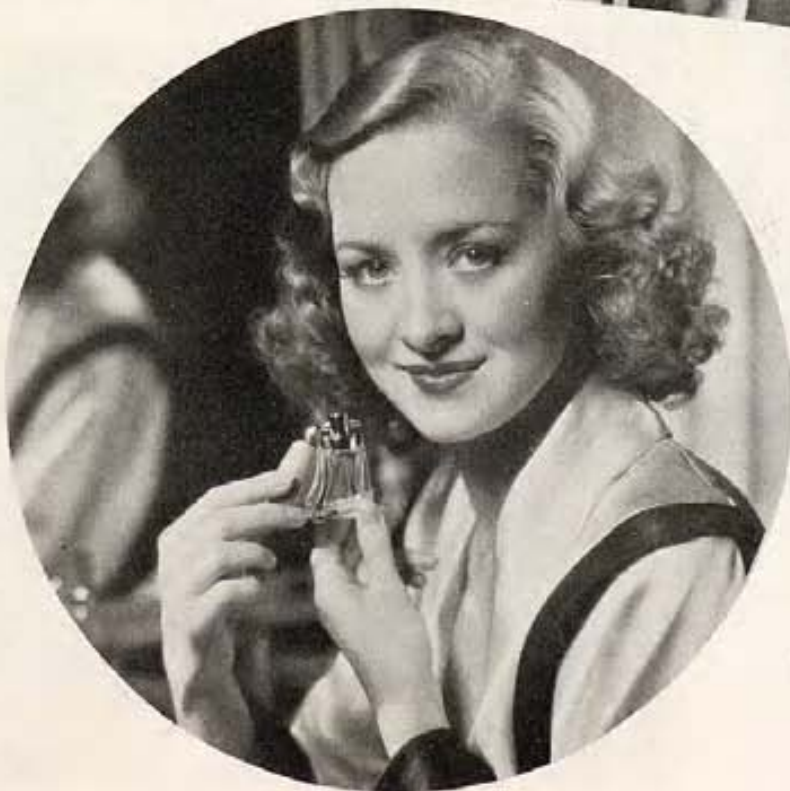
Arriba, Madge Evans, de M-G-M, perfuma las cejas, las muñecas y tras las orejas, aplicando gotas de perfume. Izquierda, Marian Marsh, de Columbia, utiliza el pulverizador para perfumar su bonita cabellera.

verdadero perfume, el aroma dura más poco, pero son los mejores para la que sólo quiere una fragancia delicada a su alrededor.