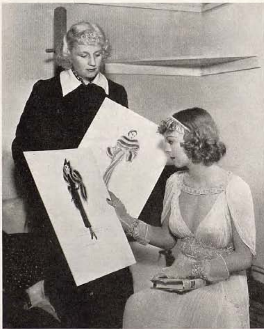
La estrella Margaret Sullivan examina los modelos de trajes que se le preparan para su film "The Moon is Our Home," que está haciendo en los estudios Paramount.

—Mucho temo que usted no está sintiendo lo que dice... Cuando regrese a la ciudad, se olvidará de mí. La belleza de estas montañas ha triunfado sobre los convencionalis-