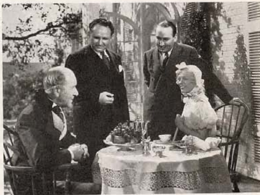
El actor de carácter Henry Stephenson y la estrella Marion Davies, reciben instrucciones del director Frank Borzage y el productor Hal Wallis, durante la filmación de la película "Hearts Divided," de Warner Brothers.