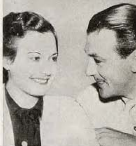
GARY COOPER VIÓ ESTOS LABIOS