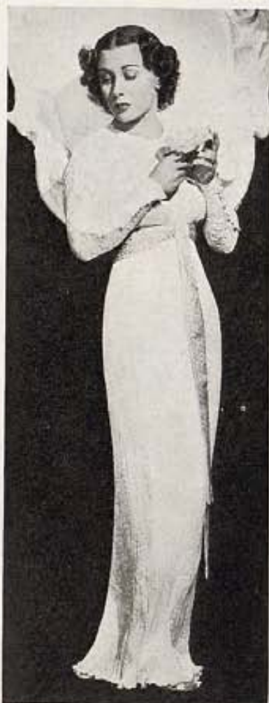
La bella diva de Paramount, Gladys Swarthout, es una favorita de los amantes de la música. Gladys debutó en "Rose of the Rancho" y acaba de terminar "Give Us This Night."

Reg. U. S. Patent Office Member Audit Bureau of Circulations