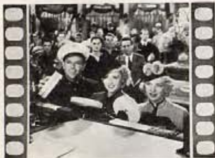
"MISS PACIFIC FLEET"