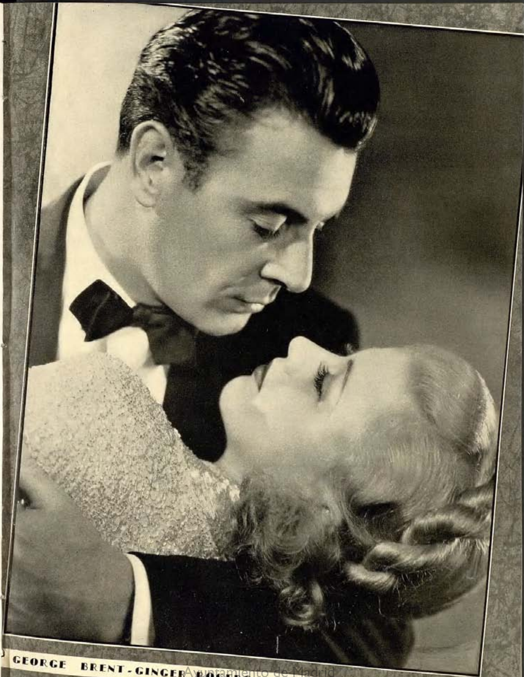
GEORGE BRENT - GINGER ROGERS en "In Person", de E. K. O.