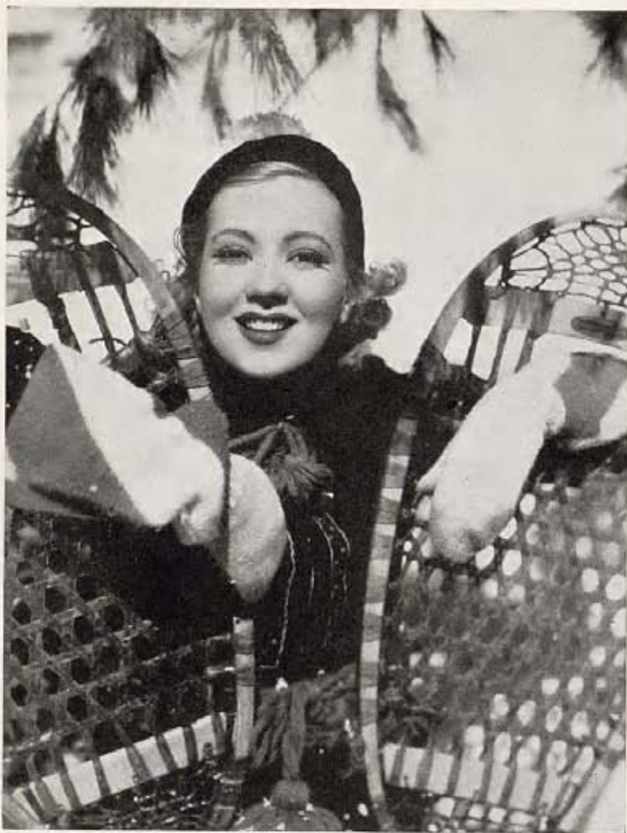
La joven actriz Ann Sothorn, de los estudios Columbia, que acaba de filmar "Panik in the Air" para ese estudio, se va en un viaje de recreo a las montañas.

"El Correo de Hollywood" es la otra sección que quiero destacar. La labor sobresaliente—humilde, si se quiere—del director de esta sección, que ni siquiera ha querido hacer popular un seudónimo, es algo que no puede pasar inadvertido para los lectores. Cada carta que contesta El Correo de Hollywood, más que una contestación, es una sección de información para todos los lectores.