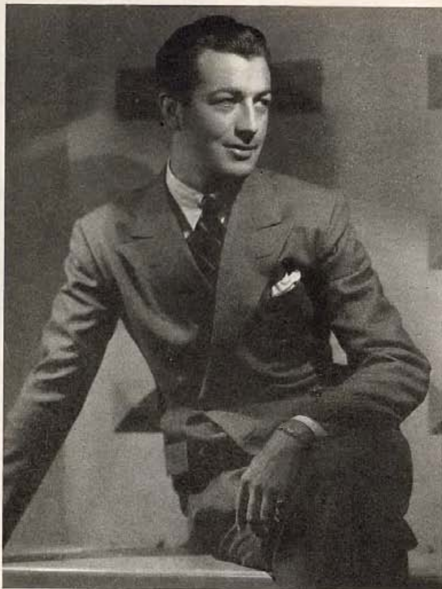
Una pose reciente de Robert Taylor, actor estelar de los estudios M-G-M. Actualmente filma "Small Town Girl," con Janet Gaynor, para el mismo M-G-M.

parar y yo me veo precisado a hacer una observación.