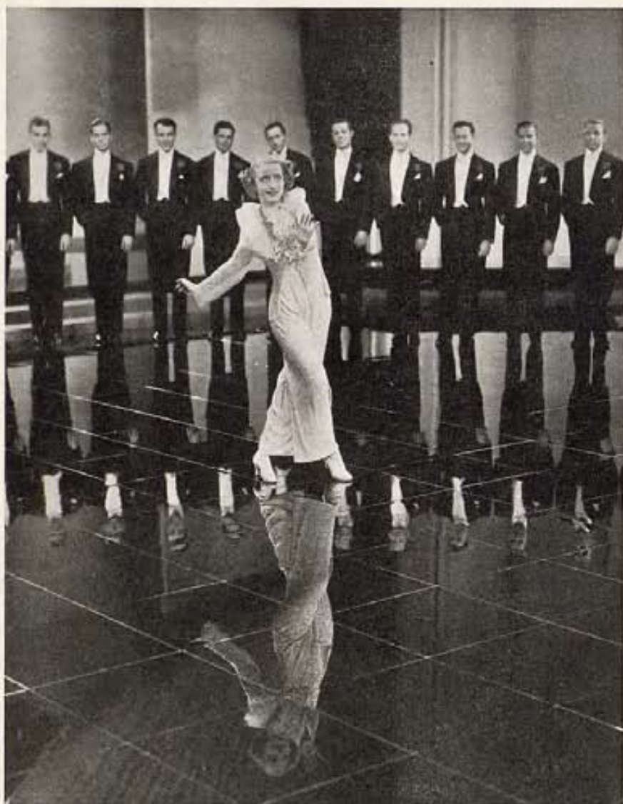
Aquí vemos una de las excelentes escenas de baile que aparecen en el film "Strike Me Pink," de Samuel Goldwyn, con Eddie Cantor en el rol principal.

yorquino de revistas de variedades. Pero solamente hasta hace poco nos presentó una obra realmente maestra en el género: "Thanks a Million," de la cual Dick Powell, facilitado en arriendo por la Warner Brothers, fué el astro y que debe estar exhibiendo en estos momentos en los países de nuestro idioma, bajo el título de "Un Millón de Gracias." Y acaba ahora de darnos otra nueva obra, "King of Burlesque," bastante agradable, bien hecha y con buena música, en que se destaca la sincera personalidad de Warner Baxter, la inimitable gracia de Jack Oakie y la habilidad coreográfica de Dixie Dunbar y de Nick Long, Jr., a quien ya viera el espectador en "The Broadway Melody of 1936."