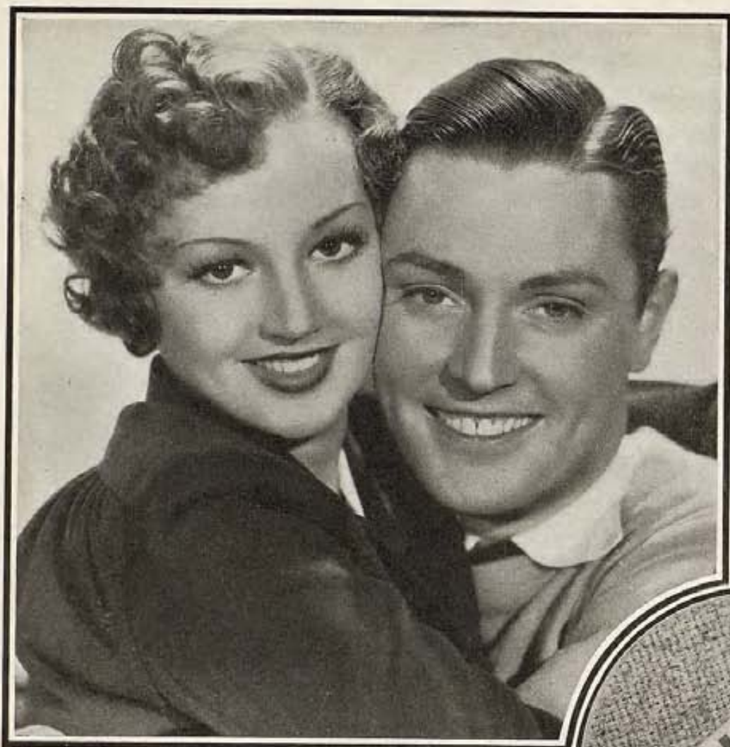
Arline Judge y Eddie Nugent en una escena del film "College Scandal," producción Paramount. Arline se halla contratada por la Twentieth Century-Fox.