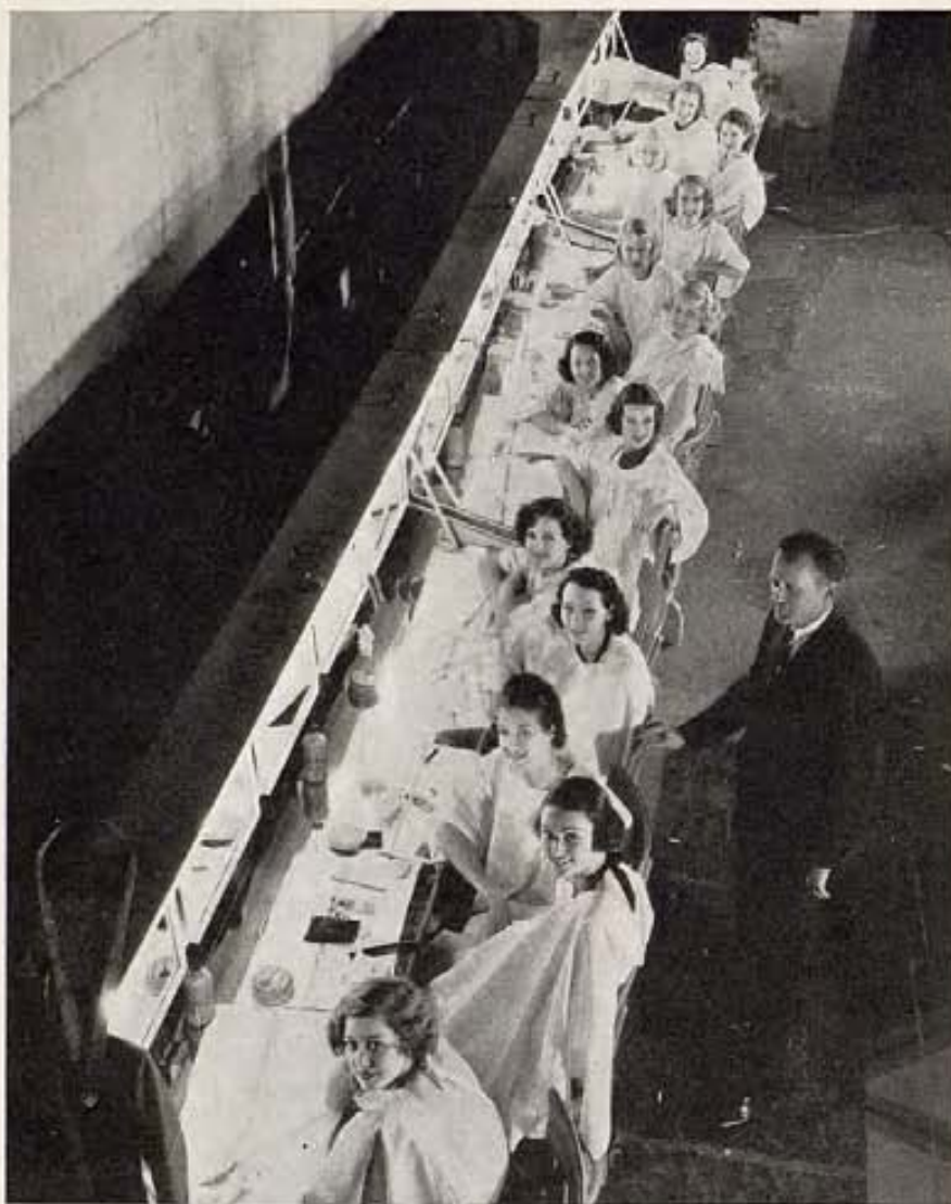
En los estudios M-G-M acaba de filmarse la película "The Great Ziegfeld." Aquí vemos algunas de las jóvenes actrices que aparecen en esta cinta musical.