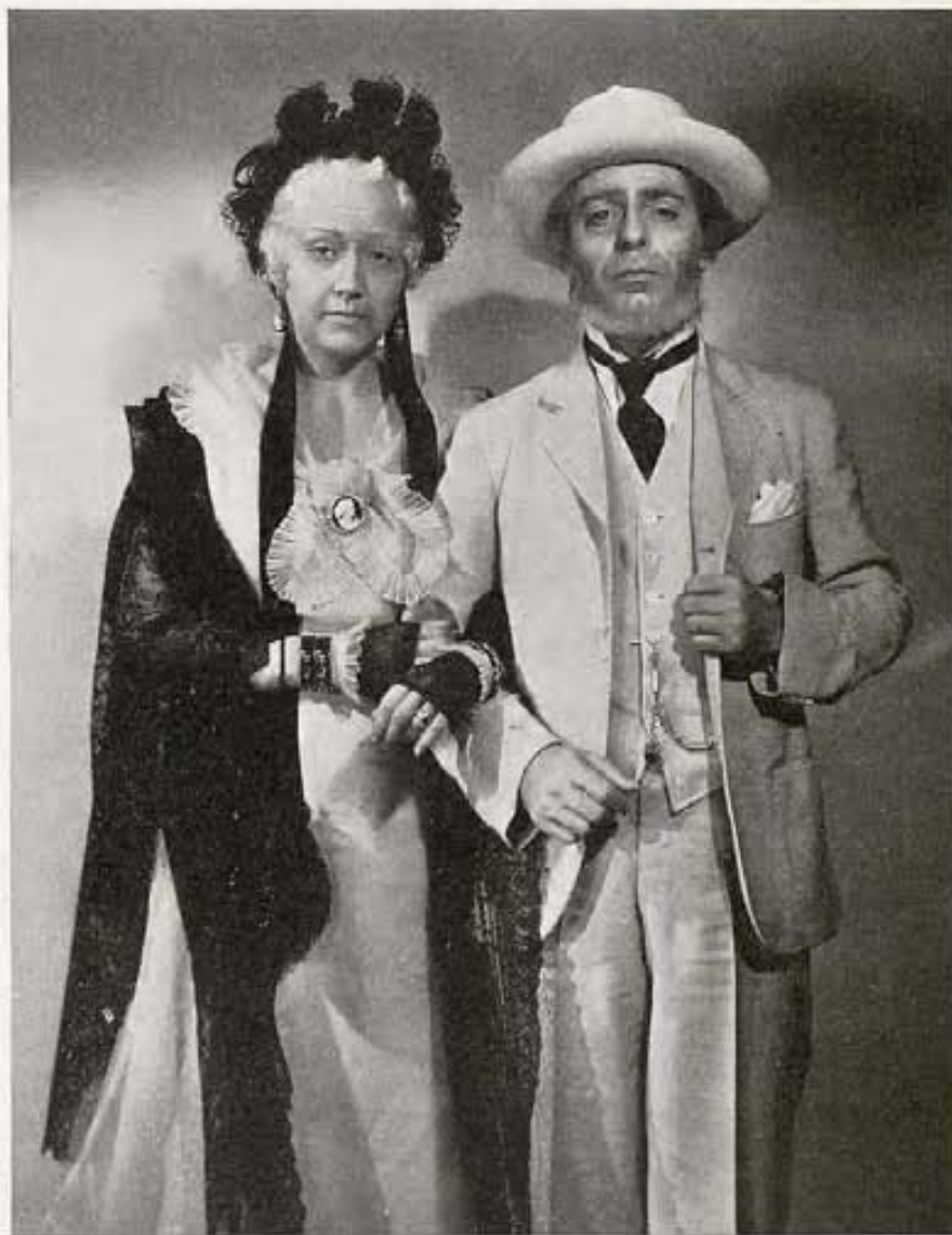
¿Quién reconocería al genial Eddie Cantor y la vivaracha Ethel Merman en este disfraz que adoptaron en la cinta "Strike Me Pink," producción de Samuel Goldwyn, distribuida por Artistas Unidos?

Cuando escriba a los anunciantes, mencione CINELANDIA.