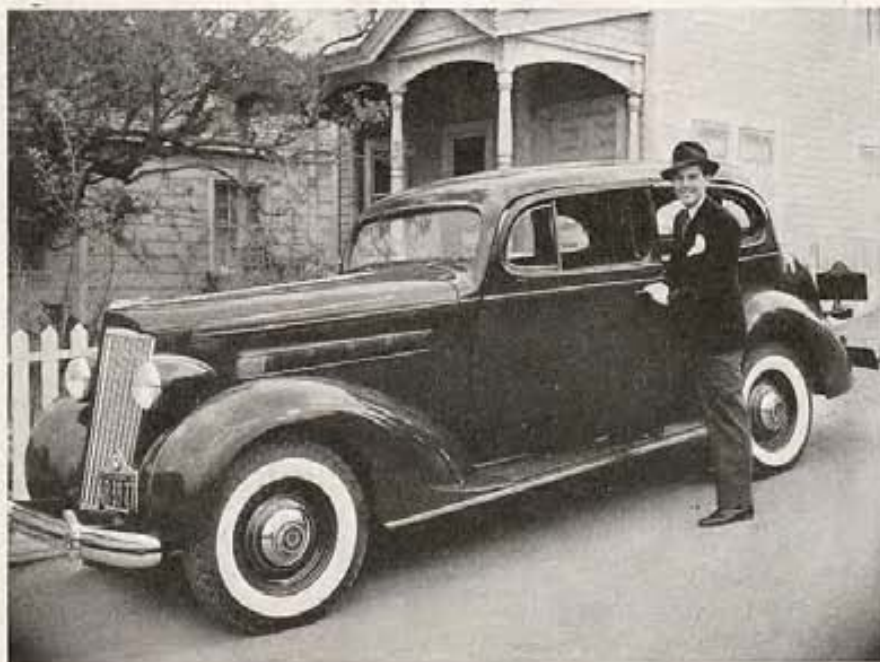
Aquí vemos al joven actor Johnny Downs, de 20th Century-Fox, que actualmente aparece en el film "Everybody's Old Man" de este estudio, con Irvin Cobb y Rochelle Hudson.

De nuestros modestos estudios han salido buenas películas como "Nobleza baturra," "Sor Angélica," "Rumbo al Cairo," "La hermana San Sulpicio" y "La bien pagada." En un número de más de treinta películas, sólo una media docena merece reparos de (va a la página 53)