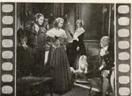
"TALE OF TWO CITIES"

Es difícil juzgar las cintas de Eddie Cantor por su asunto: son pochadas sin sentido en las que se buscan las situaciones que permitan al célebre cómico lucir su gracia y cantar como sólo él sabe hacerlo. Esta vez se ha tomado por tema un cuento titulado "Dreamland" (Tierra de ensueños), que es el nombre de un parque de diversiones, propiedad de una señora de edad y que Cantor decide reorganizar y dirigir, a pesar de su ya clásica timidez, teniendo en cuenta que ver con un grupo de "gangsters" de la peor especie. Hay muchas situaciones cómicas, pero no tantas como en otras cintas del mismo actor y no se le hace cantar a menudo, lo que es una lástima. Los números de conjunto son artísticos e interesantes y hay gran cantidad de muchachas preciosas que lucen sus caras y sus figuras.