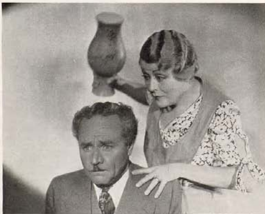
En esta escena del film "If I Had a Million," hecha por Paramount hace algún tiempo, Mary Boland se dió el gusto de romper un florero en la cabeza a Charles Ruggles.

delito de que peca Hollywood cuando toma un nuevo tema por su cuenta.