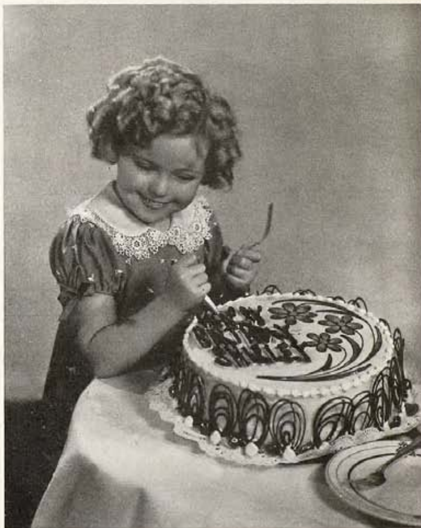
Shirley Temple alcanza la madura edad de siete años y sus compañeros de los estudios Fox, donde está contratada, celebran su cumpleaños con un pastel.

"La cara en la portada" es lo mejor que he leído en cuantas revistas han llegado a mis manos. Con esa sección que todos los meses da CINELANDIA a sus lectores, los pone al corriente de la vida de las estrellas más conocidas y creo que no hay uno solo de los lectores que al comprar el último ejemplar no esté deseando llegar a casa para poder leer el artículo que escribe con tanto acierto el señor J. Quiroz Bustamante.