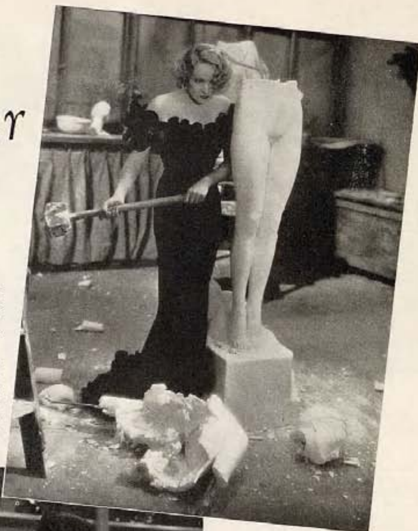
Marlene Dietrich en el film "Song of Songs," que hiciera para Paramount hace tiempo, se dió buen gusto al romper una estatua de sí misma. En el centro vemos a los cómicos Oliver Hardy y Stan Laurel, en una escena de "Tit for Tat," comedia de dos rollos de Hal Roach. Abajo vemos al genial W. C. Fields rompiendo un violín que se supone ser un valioso Stradivarius.

Cuando se trata de un bebé, los padres celebran esos arrebatos infantiles, o hacen como que los celebran cuando ocurren delante de visitas. Pero cuando crecemos, se nos mete en el cuerpo una cosa que se ha dado en llamar "sentido común" y actúa como un freno que nos impide darnos el placer de romper