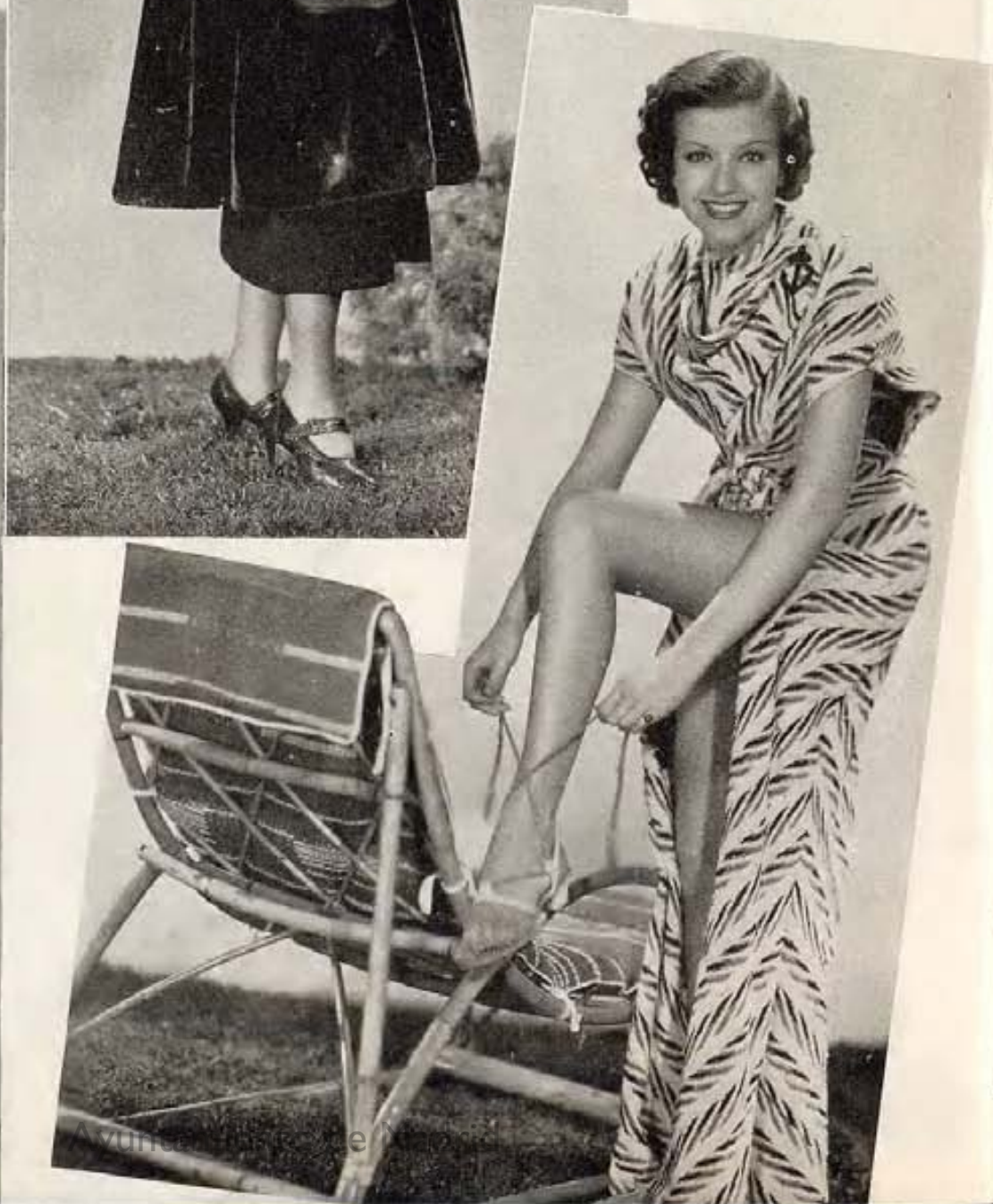
Ginger Rogers en vestido de calle con bonito lazo de tafeta al cuello; y Helen Wood en vestimenta para balneario, estilo albornoz.