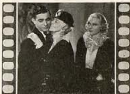
"STRIKE ME PINK"