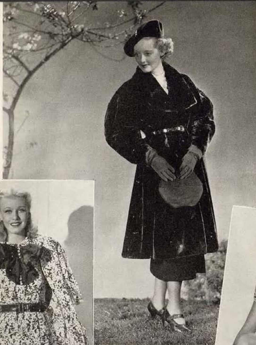
Izquierda, Bette Davis modela elegante abrigo de piel de foca. El estilo es del llamado "Cosaco," popular entre los abrigos sport. Con ampulosas mangas y anchas solapas.