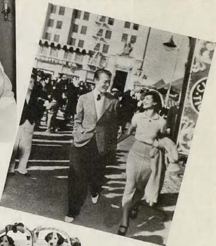
Cuando el circo llegara a Hollywood en días pasados, los jóvenes artistas Richard Cromwell y Rochelle Hudson tomaron un día de asueto, yéndose a ver a los payasos y las fieras como cualquier hijo de vecino. El fotógrafo los sorprende cogidos de la mano y riéndose como un par de chiquillos, de romería.