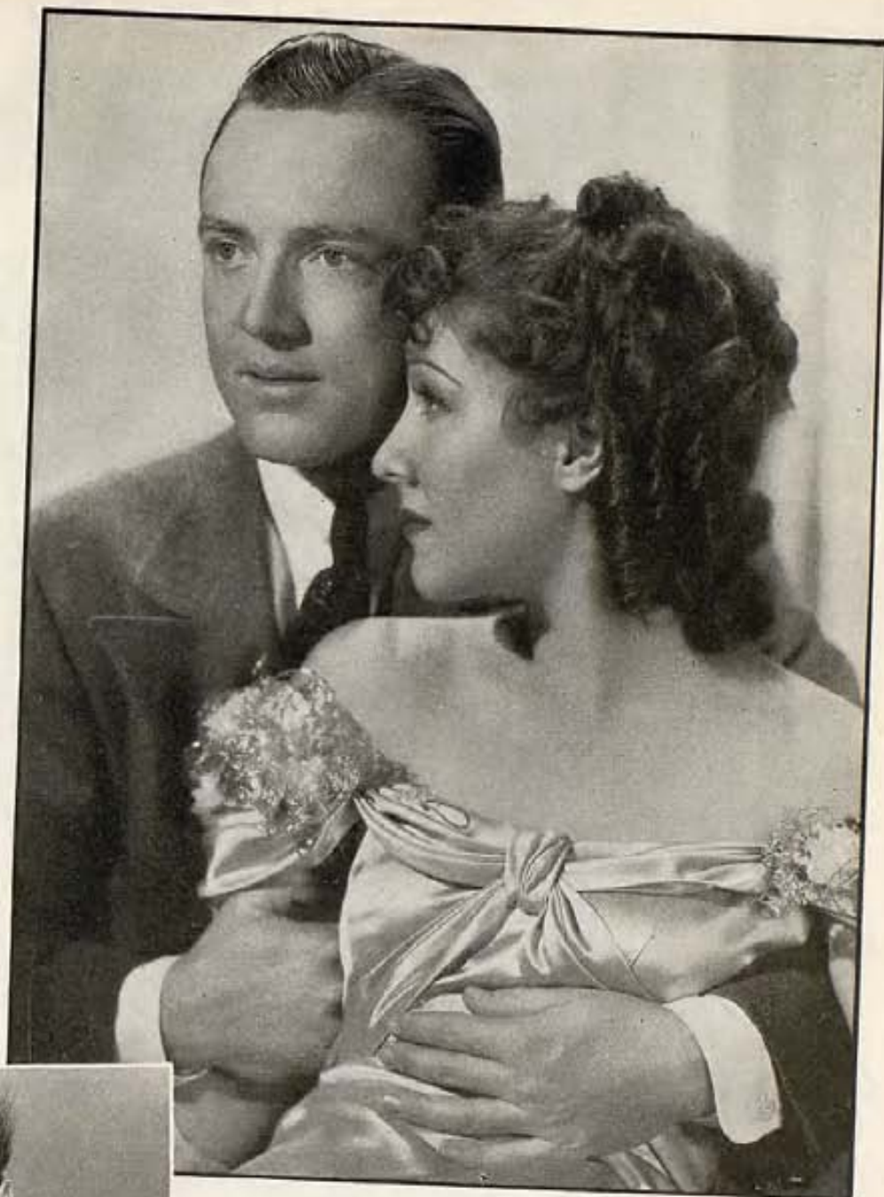
Arriba, Frank Albertson y Jean Parker forman una pareja simpática en el film "Farmer in the Dell," de R.K.O. Robinson le mete miedo a Speck O'Donnell en "Bullets or Ballots", film de Warners.

Durante semanas y meses la región estuvo convertida en campiña romana, invadida por miles de operarios, técnicos y artistas. Terminada la filmación el circo romano de cartón-piedra se echó abajo y, como el circo que pasa y se va, sólo quedaron sobre el terreno algunos vestigios: trozos de balastrada, una rueda de cua-