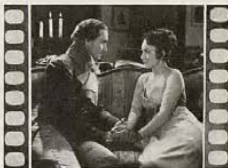
"ADVERSIDAD" (Anthony Adverse)