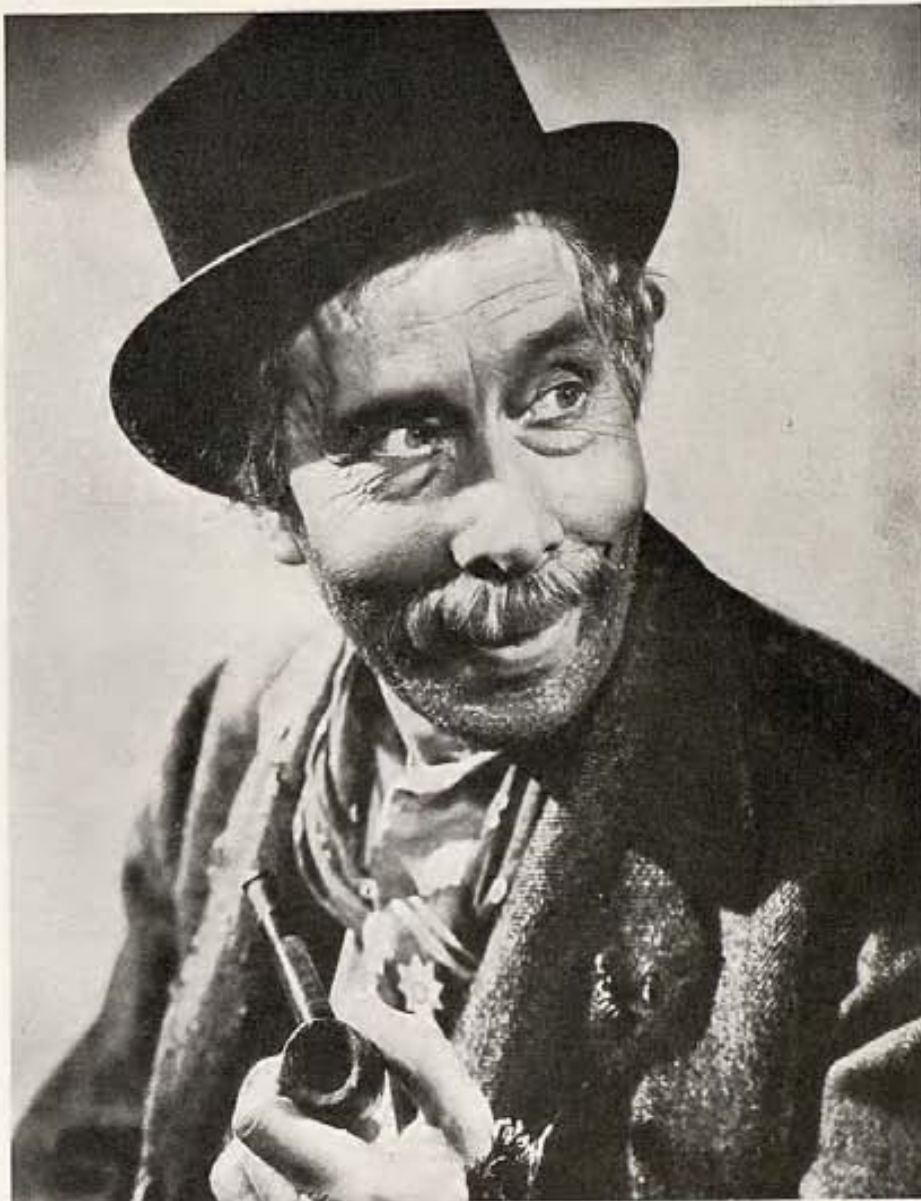
El gran actor de carácter, George Arliss, en su más reciente caracterización del protagonista de "El vagabundo millonario," producción de la Gaumont British.

Un interesante experimento acaba de realizar la oficina representante de Metro-Goldwyn-Mayer en la Argentina, a fin de conocer la opinión del público bonaerense con respecto al programa cinematográfico que se le ofrece. Además, se trataba de observar la recepción que se haría a algunas películas de la empresa que habían sido sincronizadas en castellano, todas ellas ya presentadas en el programa del año anterior, en inglés. Durante una semana el Cine Florida de la capital argentina estuvo exhibiendo cintas de esta índole. Se mostraron sucesivamente "El velo pintado," de Greta Garbo; "Cuando el diablo asoma," con Joan Crawford, Clark Gable y Robert Montgomery; "La cena de los acusados,"