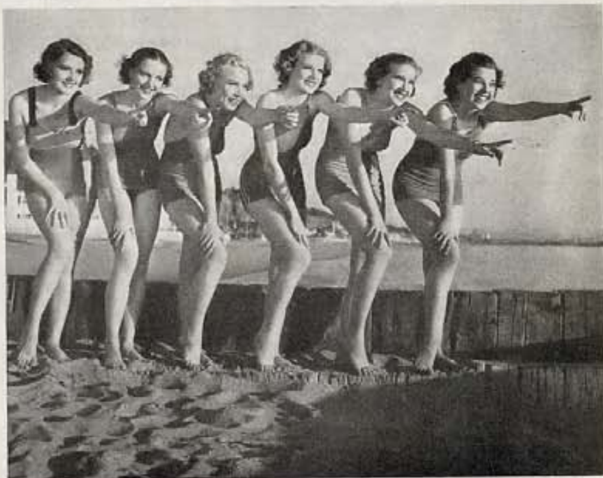
—Apunten, pero no disparen,—podría decirseles a estas seis coristas de Paramount que fueron a la playa a lucir sus lindas figuras ante el fotógrafo.

Pero sus directores no han descansado ni descansarán hasta ver que sus películas (va a la página 64)