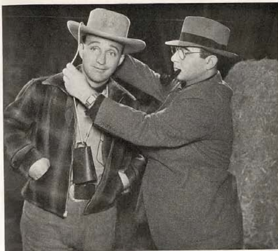
El director Norman Taurog le cuelga una campanilla a Bing Crosby. De esta manera sabe donde está, pues Bing tiene la costumbre de desaparecer en mitad de filmación de "Rhythm on the Range," en los sets de Paramount.