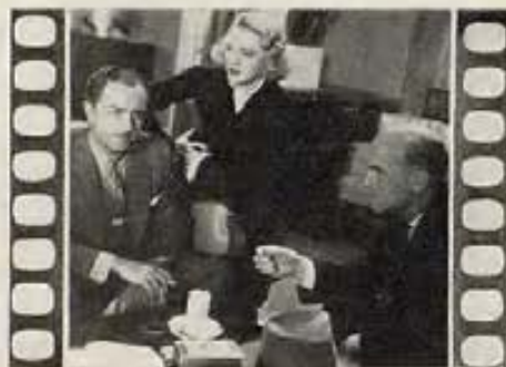
"LA EX-SEÑORA DE BRADFORD" (The Ex-Mrs. Bradford)