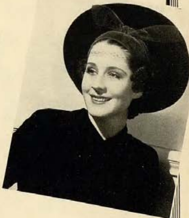
Para reuniones informales de tarde, Joan Crawford y Norma Shearer escogen muy bonitos modelos de sombreros. El de Joan es de paja color negro y su vestido es también negro con botones de plata. El sombrero de Norma es de terciopelo negro con una banda de terciopelo color azul turquesa y fué inspirado en el halo de las pinturas antiguas.