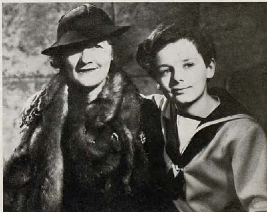
Freddie Bartholomew se retrata orgulloso con su tía Millicent, su tutora, a quien quiere entrañablemente. Arriba una foto de una velada cinematográfica.

Vea el Concurso anunciado en la página 65