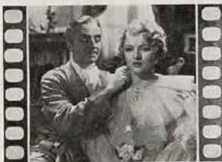
"EL GRAN ZIEGFELD" (The Great Ziegfeld)

Metro-Goldwyn-Mayer DERROCHE DE LUJO Y DE NOMBRES ESTELARES. ESPLÉNDIDA, PERO DEMASIADO EXTENSA. CON WILLIAM POWELL.