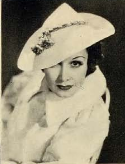
Las boinas modernas son de paja lustrosa, como la de Gail Patrick, izquierda. Arriba, Gail presenta un sombrero de fieltro blanco, para sport. Y derecha, Ginger Rogers presenta un turbante formado con violetas.