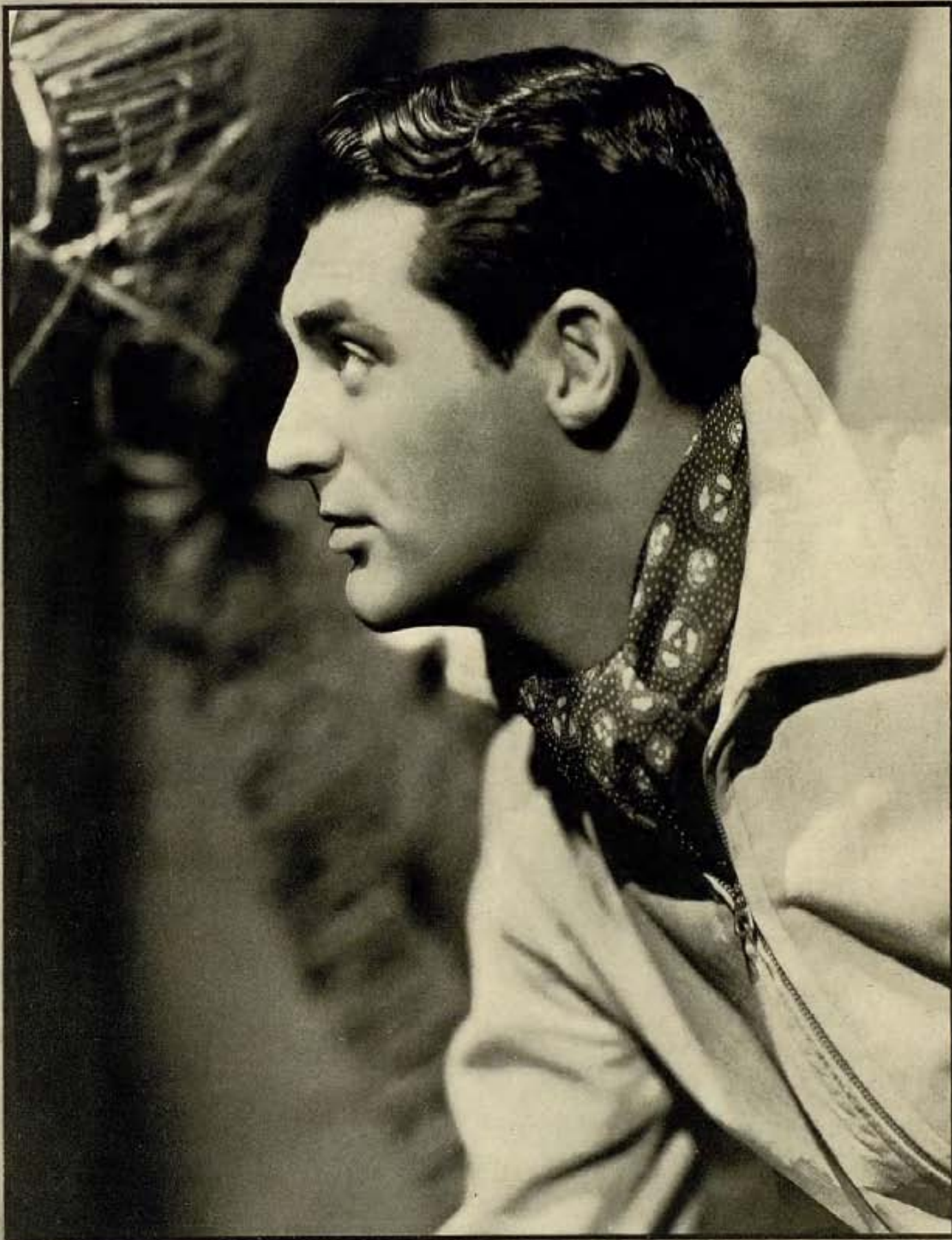
Ayuntamiento de Madrid Cary Grant Paramount