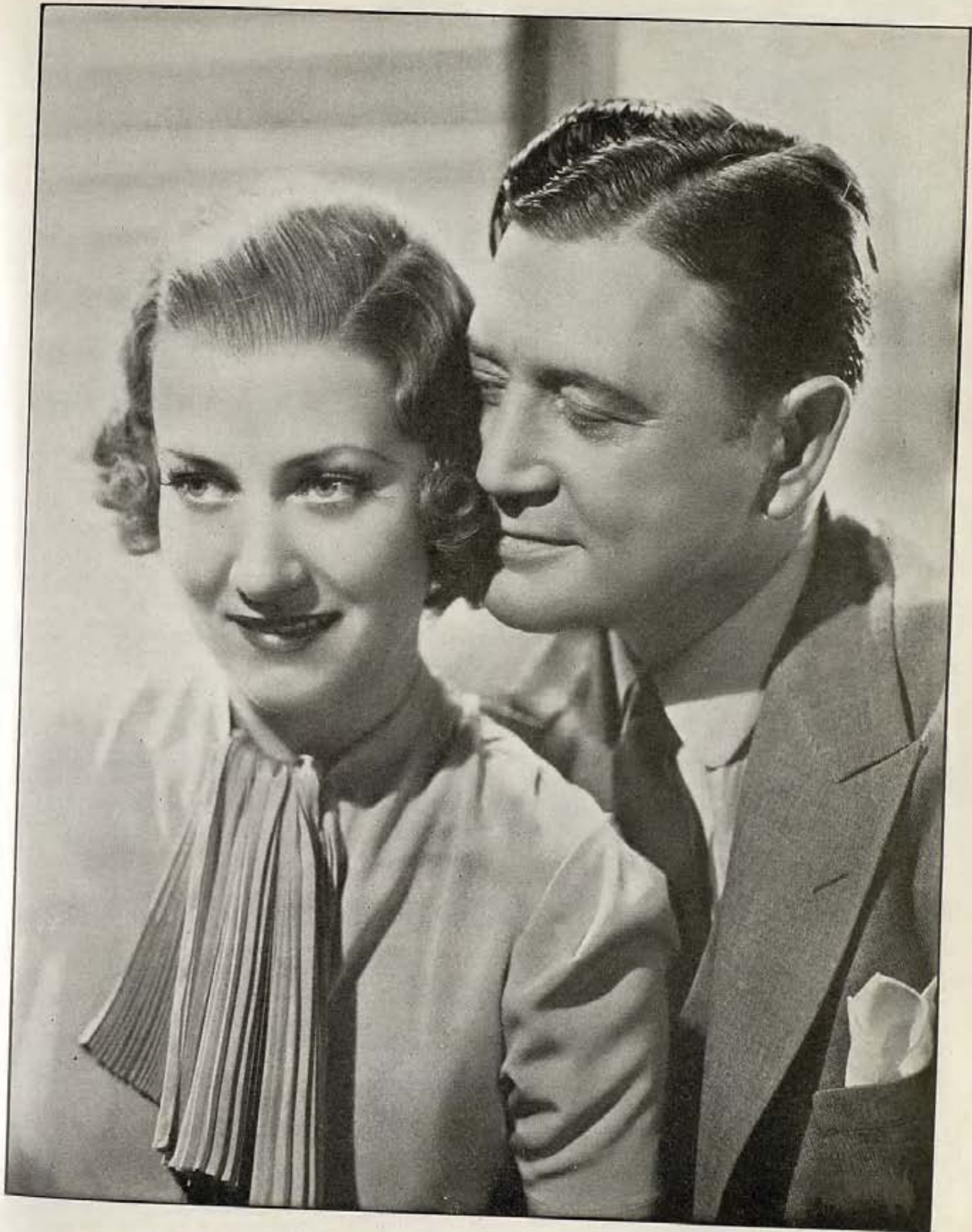
Una pose de Margaret Callahan y Richard Dix, en el film "Special Investigator," de R.K.O.