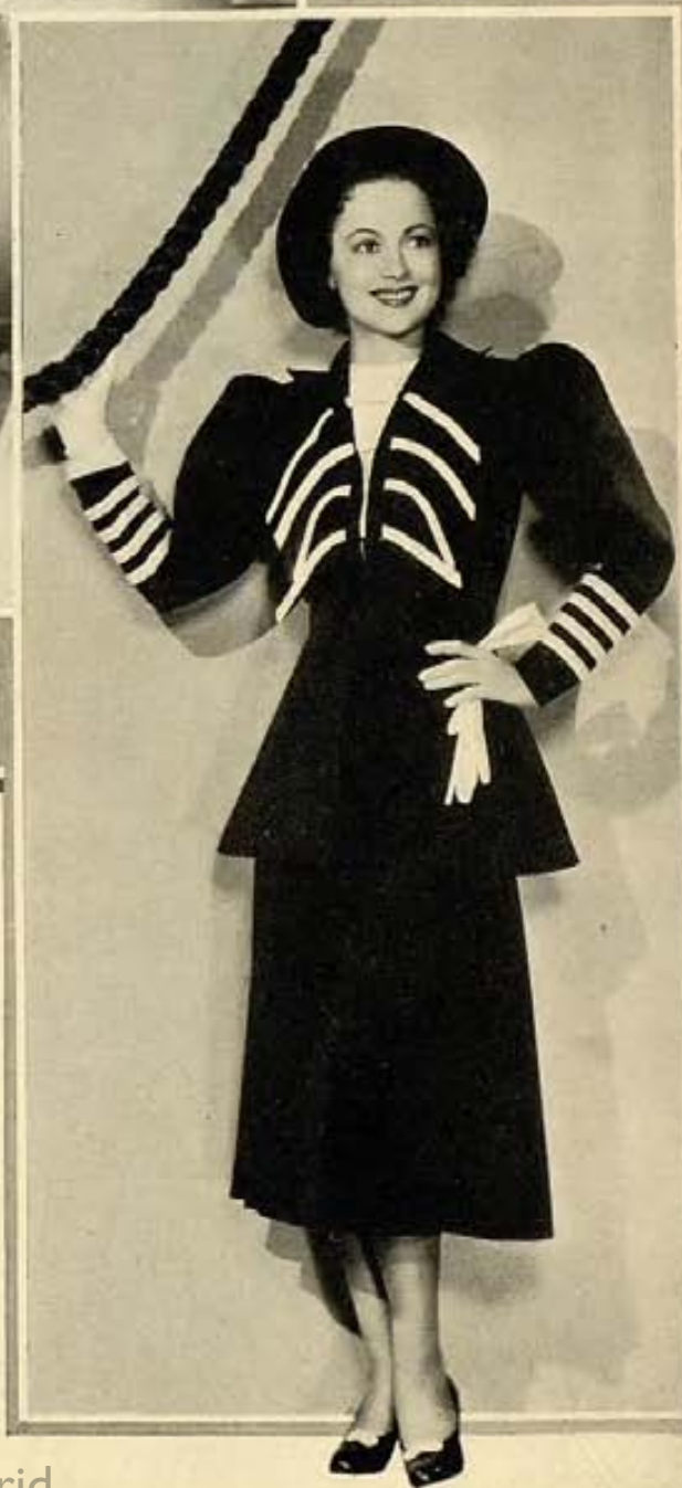
Modelos para calle: arriba, Ann Sothorn, en traje de jersey en dos tonos de azul y accesorios color azul marino. Izquierda, Claire Trevor, en traje sastre de gabardina negra y una blusa blanca, de organdí, que atenúa la severidad del traje. Olivia de Havilland, derecha, en traje estilo "pirata," de crepé azul marino y piqué blanco.