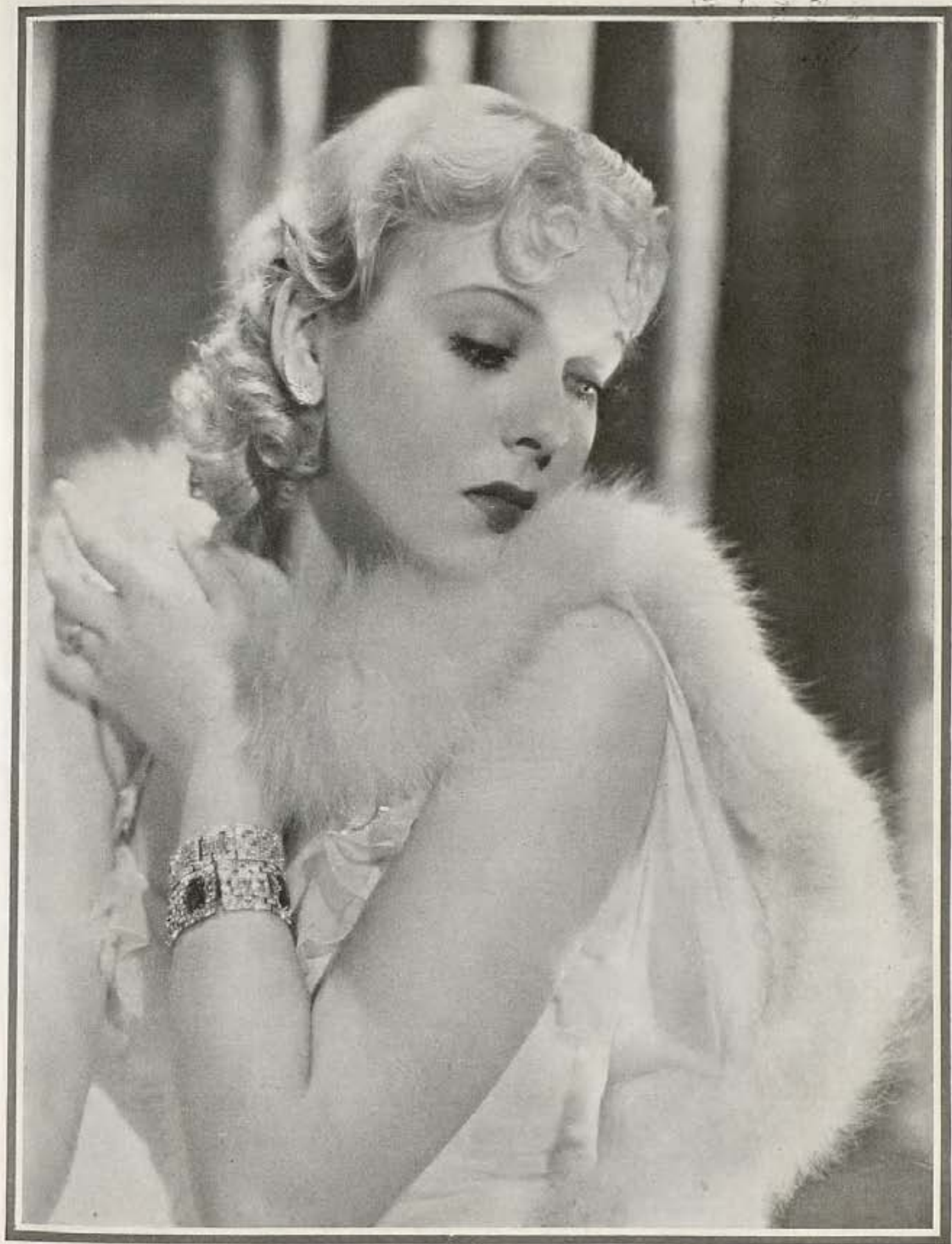
Una pose reciente de la bellissima actriz Ida Lupino, de Paramount.