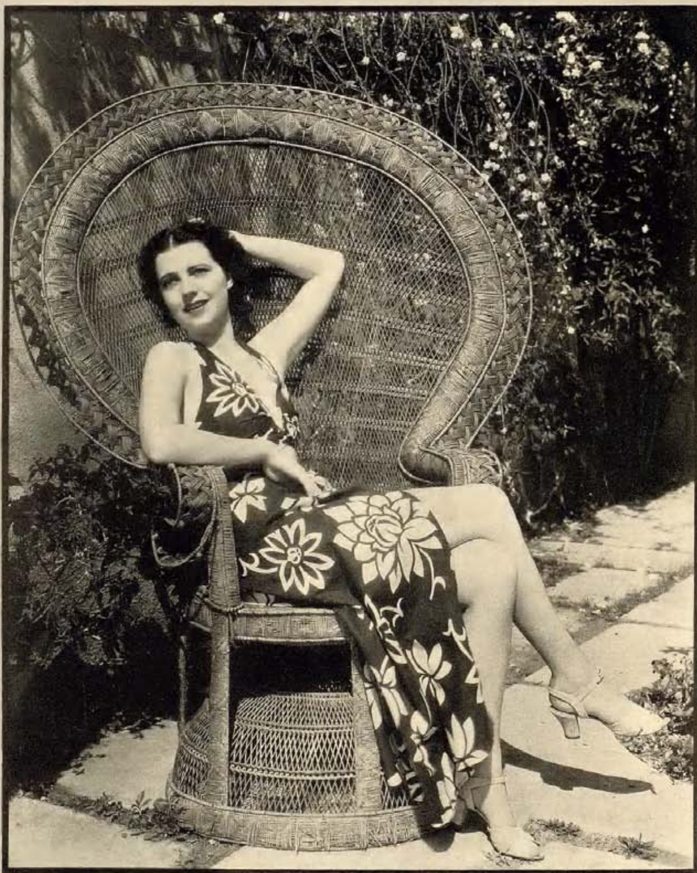
Mona Barrie viste un traje para playa o juego, de tres piezas, confeccionado con una tela de dibujo polinesio en colores azul y blanco. El talle carece de espalda sujetándose, como puede verse, con el descote que pasa sobre el cuello.