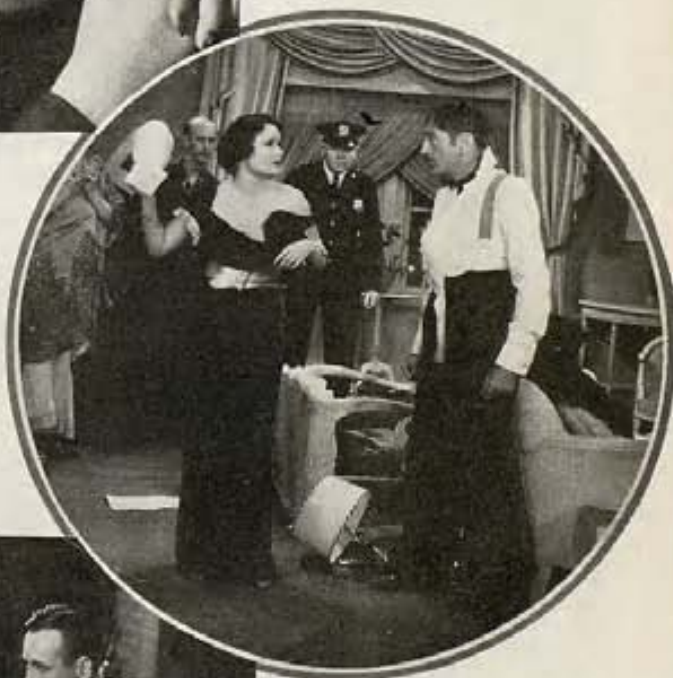
Foto de Charles Ruggles y Monroe Owsley, en "Honor entre amantes," de Paramount. (Izquierda).

Ella:—Lo del beso está bien, pero ¿para qué la retirada?