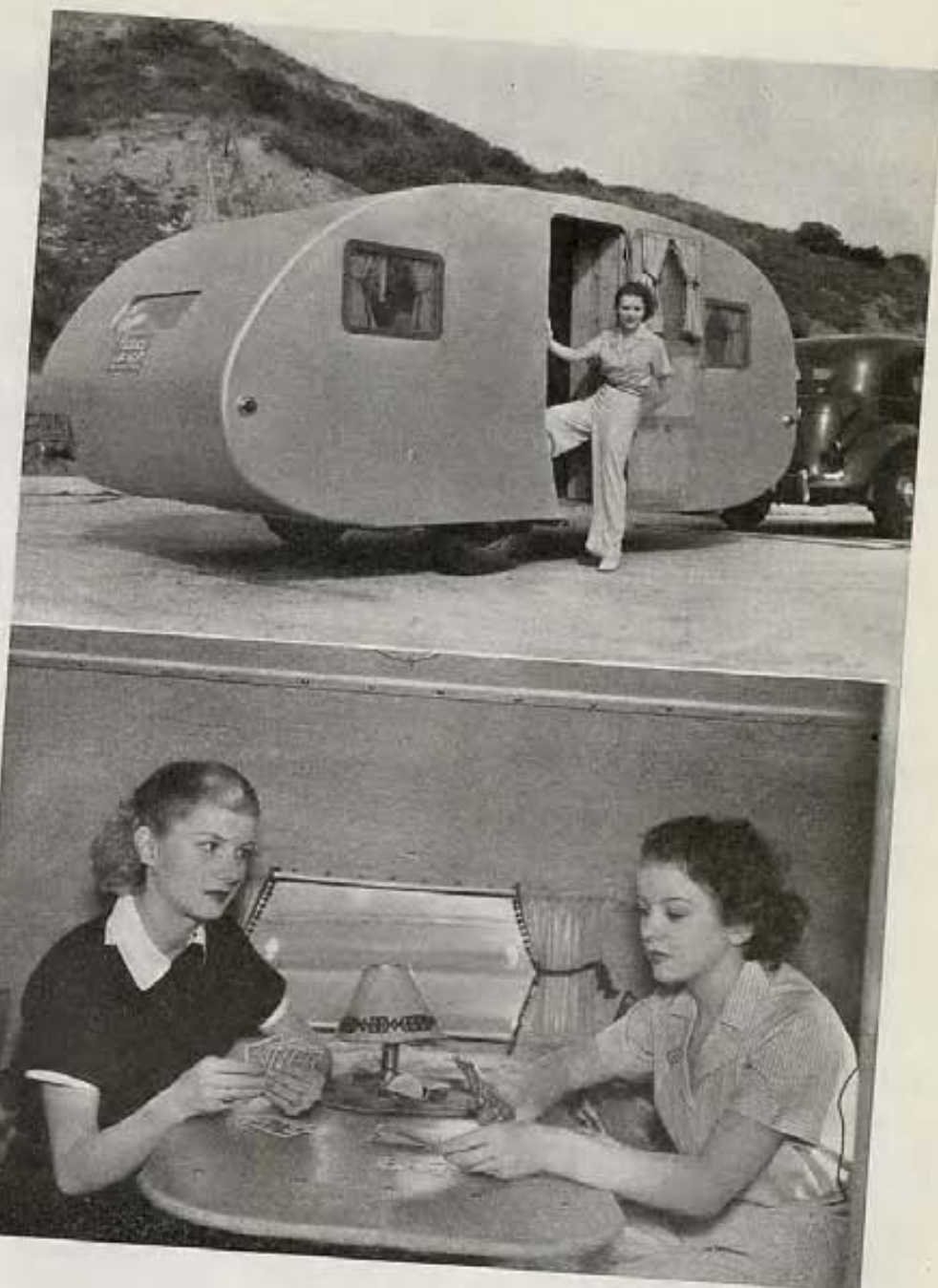
Arriba mostramos el exterior y parte del interior de un "trailer" como se llama en inglés a estas casas ambulantes. Las ocupantes son Marion Ladd y Ida Lupino, artistas de Paramount.

Las dos fotos en estas páginas dan una idea del exterior e interior de dichos vehículos. Su construcción es de madera ligera, cubiertos exteriormente de tela impermeable, y están equipados con literas, cocina, luz eléctrica, radio y otras comodidades domésticas.