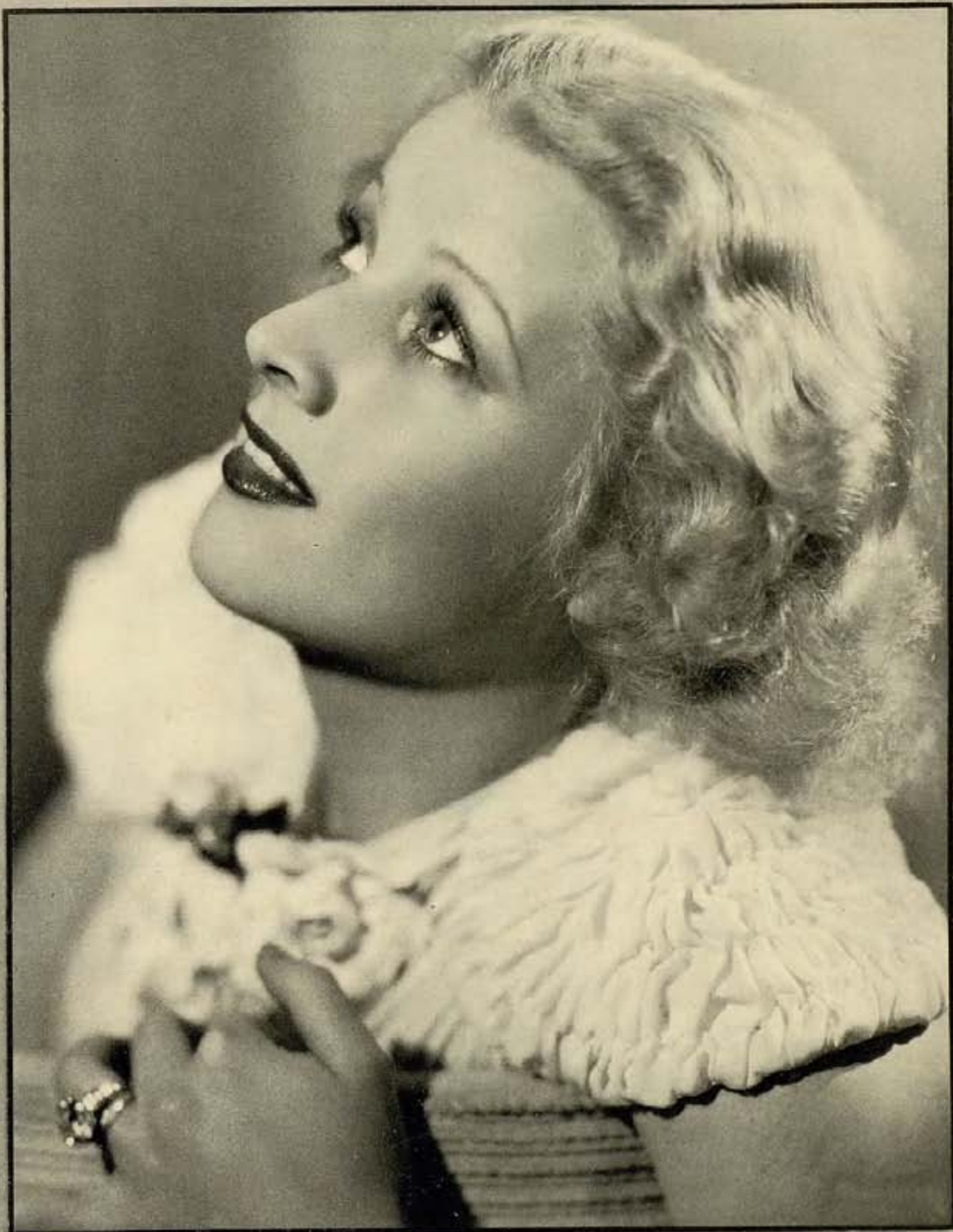
Margot Grahame