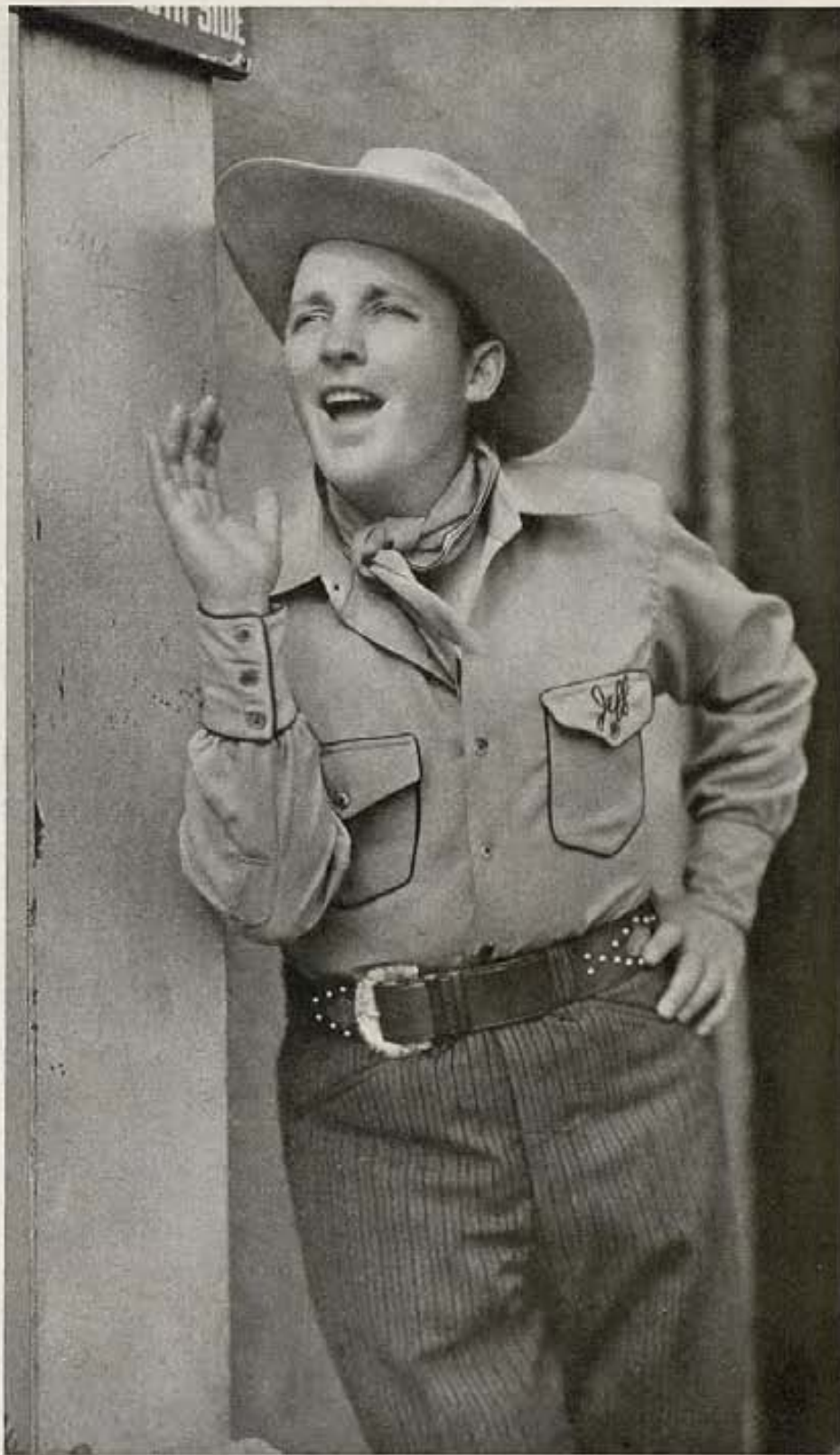
Bing Crosby en el rol de vaquero será increíble, pero suponemos que no hay quien le gane en dar gritos armoniosos en el film "Rhythm on the Range" de Paramount, donde aparece.

Más tarde se filma una escena en que Bing canta, acompañándose con la guitarra y rodeado de una cuadrilla de va-