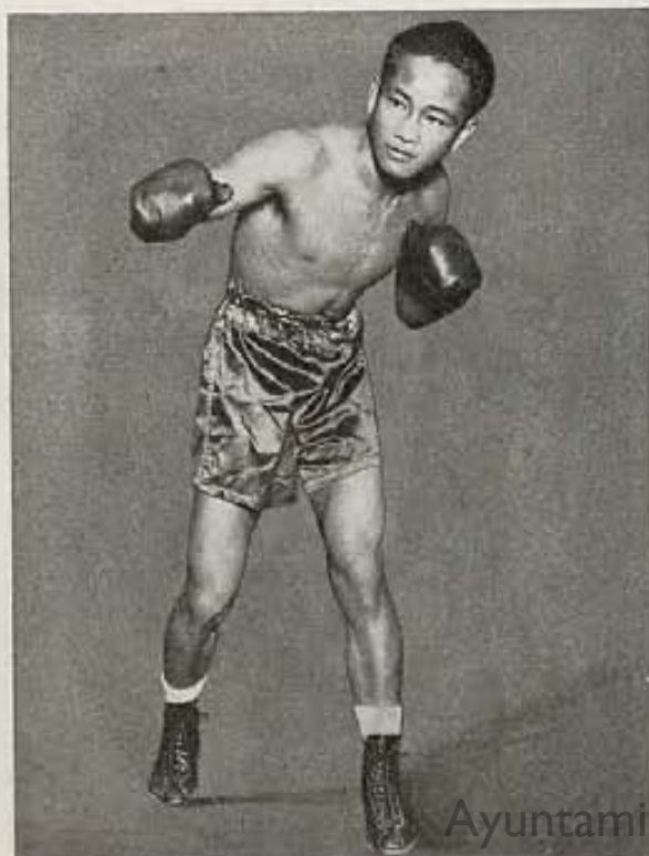
En la página opuesta, abajo, vemos a tres jóvenes artistas de Universal practicando el tiro al blanco con rifles de aire de gran potencia. El pugilista es Speedy Dado, boxeador filipino de que hablamos en estas páginas.

Si es Ud. un hombre pequeño, débil, y de pronto le sale al paso con intenciones bélicas, un gigantón entrenado y fuerte, y no lleva Ud. más arma defensiva que sus puños, ¿qué haría usted?