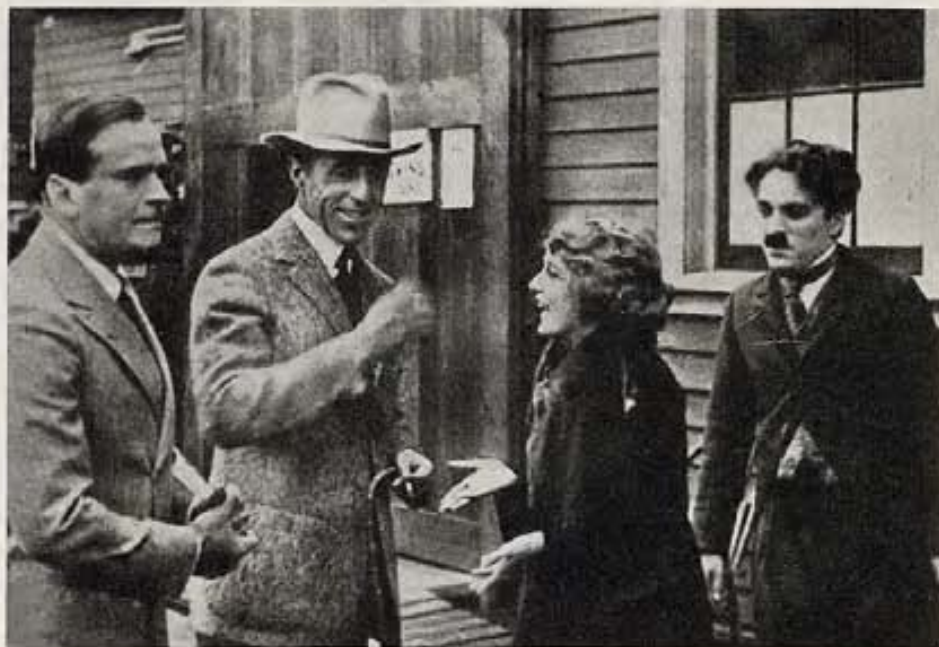
Aquí vemos a David W. Griffith en una antigua foto, con Douglas Fairbanks, Mary Pickford y Charlie Chaplin, un cuarteto de figuras prominentes del cinema, entonces y ahora.

No hace muchos días, estando él de visita en los estudios de Metro-Goldwyn-Mayer, en el "set" en que W. S. Van Dyke dirigía a Jeannette MacDonald en la cinta