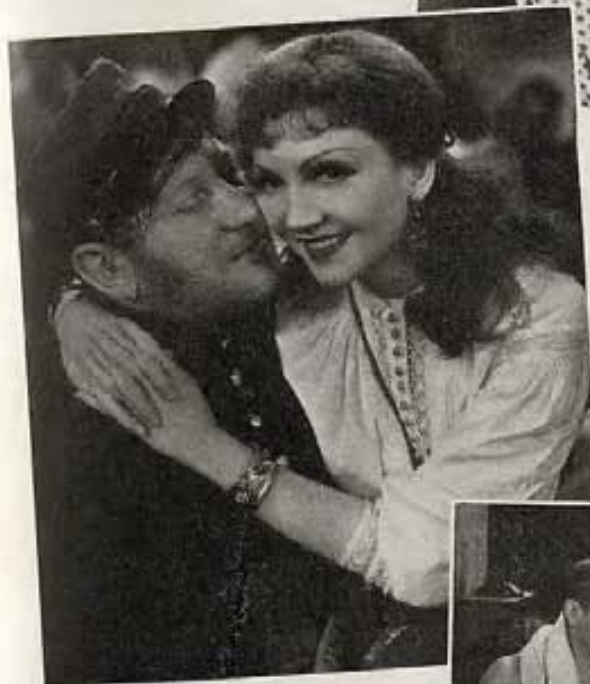
Foto de Claudette Colbert y un extra en "Bajo dos banderas," film de 20th Century-Fox. (Arriba).

Ella:—No necesariamente. Podemos considerar esto un ensayo para una feliz vida de casados.