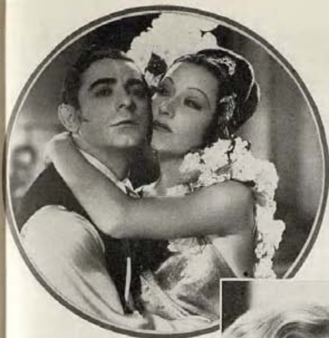
Foto de Chester Morris y Helen Twelvetrees, en "Rey por una noche," film de Universal. (Derecha).

El:—¿Te ha dicho tu mamá lo que todas las jóvenes deben saber?