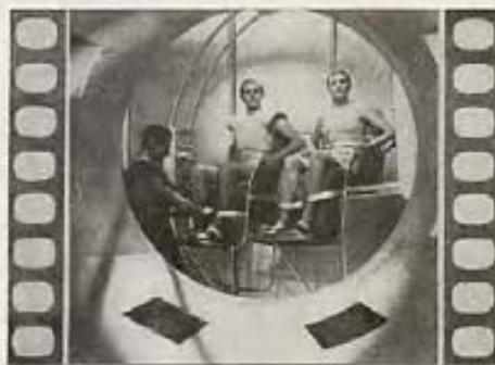
"LO QUE HA DE SUCEDER" (Things to Come)

Esta película está basada en una novela de autor norteamericano, aparecida hace dos años y que ha tenido una venta formidable. Es una obra de la escuela de Victor Hugo, y trata de las desventuras de un huérfano a quien la vida aleja de sus afectos, obligándolo a sacrificar todas sus aspiraciones. Es la historia de la adversidad hecha hombre. Ha sido lograda con gran sentido artístico y está magníficamente interpretada. Peca de excesiva extensión y del relato cronológico de demasiados episodios. Hollywood está olvidando sus tradiciones de rapidez y dinamismo. Fredric March encarna dignamente al protagonista. Olivia de Havilland le secunda en un papel de poca importancia. Anita Louise y Claude Rains realizan elogiosa labor. Pero quien representa a Napoleón I es un desacierto. En conjunto es una obra para públicos cultos.