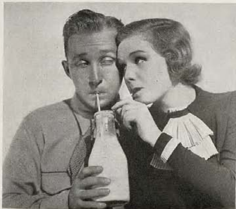
Esta pareja tan amigable son Bing Crosby y Frances Farmer, que filman juntos "Rhythm on the Range," en Paramount.

¿QUE HARA LAEMMLE? Ya es cosa proverbial que la gente de teatro jamás se retira del mismo a tiempo. Los que llegan a primeras figuras se envejecen haciendo galanes o ingenuas y van bajando ... más ligero de lo que subieron. En el cine pasa lo mismo, no sólo con los artistas, sino que ahora también con los productores. Carl Laemmle, padre, vendió los estudios de Universal asegurando que se retiraba del cine, después de haber llegado a decano de la industria. Pero ya está pensando a cuál estudio asociarse y parece que hará tres películas al año para la empresa Artistas Unidos.