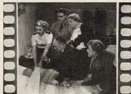
"EL PRIMOGÉNITO" (The First Baby)

El tema es de poca importancia: una aventura cómica-detectivesca más o menos truculenta, con una serie de crímenes misteriosos en los que entra de por medio nada menos que el veneno de una araña llamada aquí "la viuda negra." Pero se necesitaba un tema así para provocar las situaciones de que la película está repleta. William Powell encarna a un médico con aficiones de sabueso policial, cuya ex-esposa (que sigue enamorada de él) lo anima en su idea. Ambos toman a broma el dilucidar un crimen, resultando poco menos que complicados en él. Las situaciones, el diálogo y la interpretación son de un gran sentido humorístico y mantienen al espectador en constante hilaridad. Powell se destaca como un maestro de la gracia y Jean Arthur como una actriz destinada al estrellato en este su retorno a la pantalla. Ambos son secundados por James Gleason, Robert Armstrong y Eric Blore.