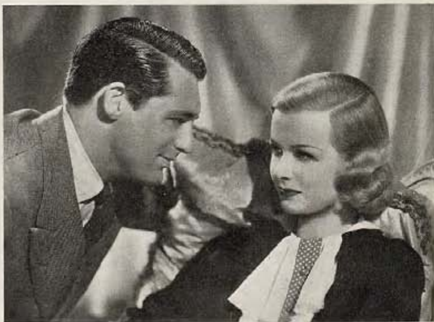
De una escena del film "Big Brown Eyes," de Paramount, entre Cary Grant y Joan Bennett:

El:—Cuando yo era muchacho tomé parte en un acto de ventriloquia.