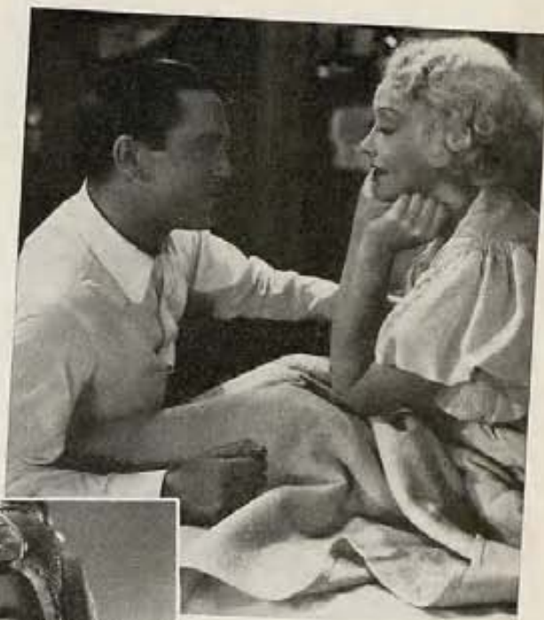
Foto de Betty Furness y Eddie Quillan, en "The Kickoff," film de RKO. (Izquierda).

Ella:—¡No seas tonto! Ella daría mucho por saber lo que saben las jóvenes.