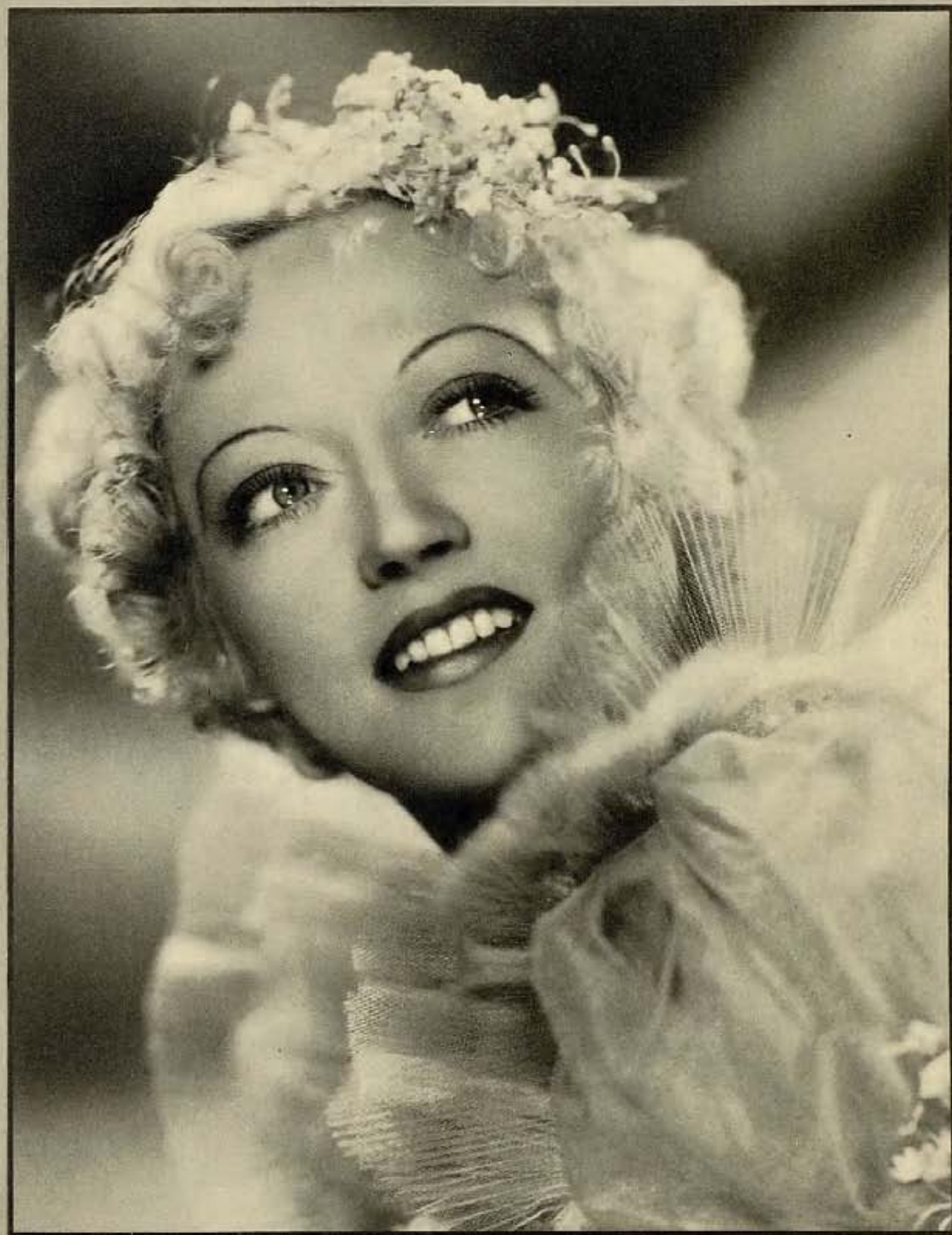
Marion Davies