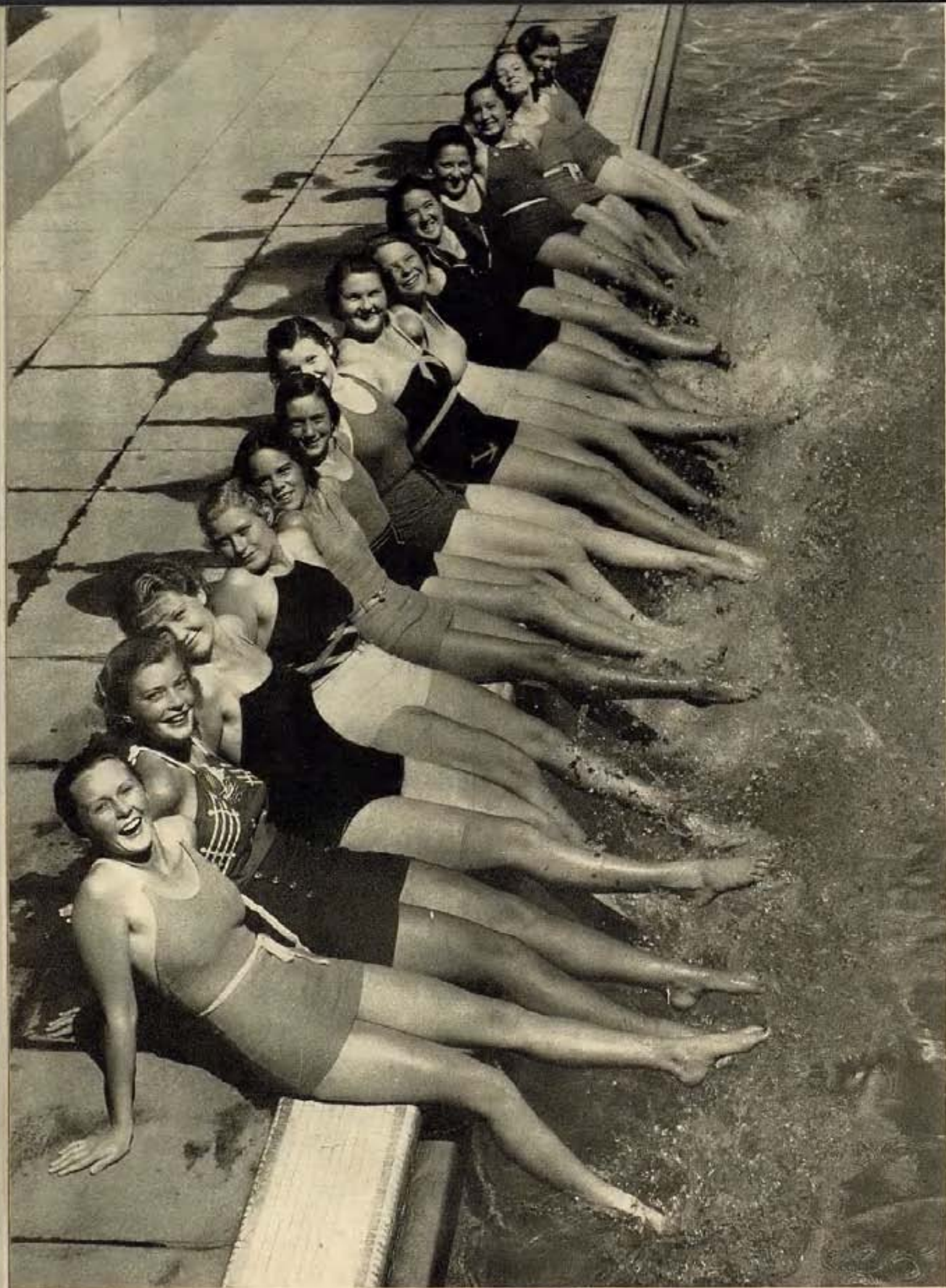
Ayuntamiento de Madrid En estas latitudes el verano ha llegado acompañado de un sol ardiente, y estas futuras candidatas a las glorias nauticas, se lanzan a las piscinas en todo el esplendor de su belleza física.