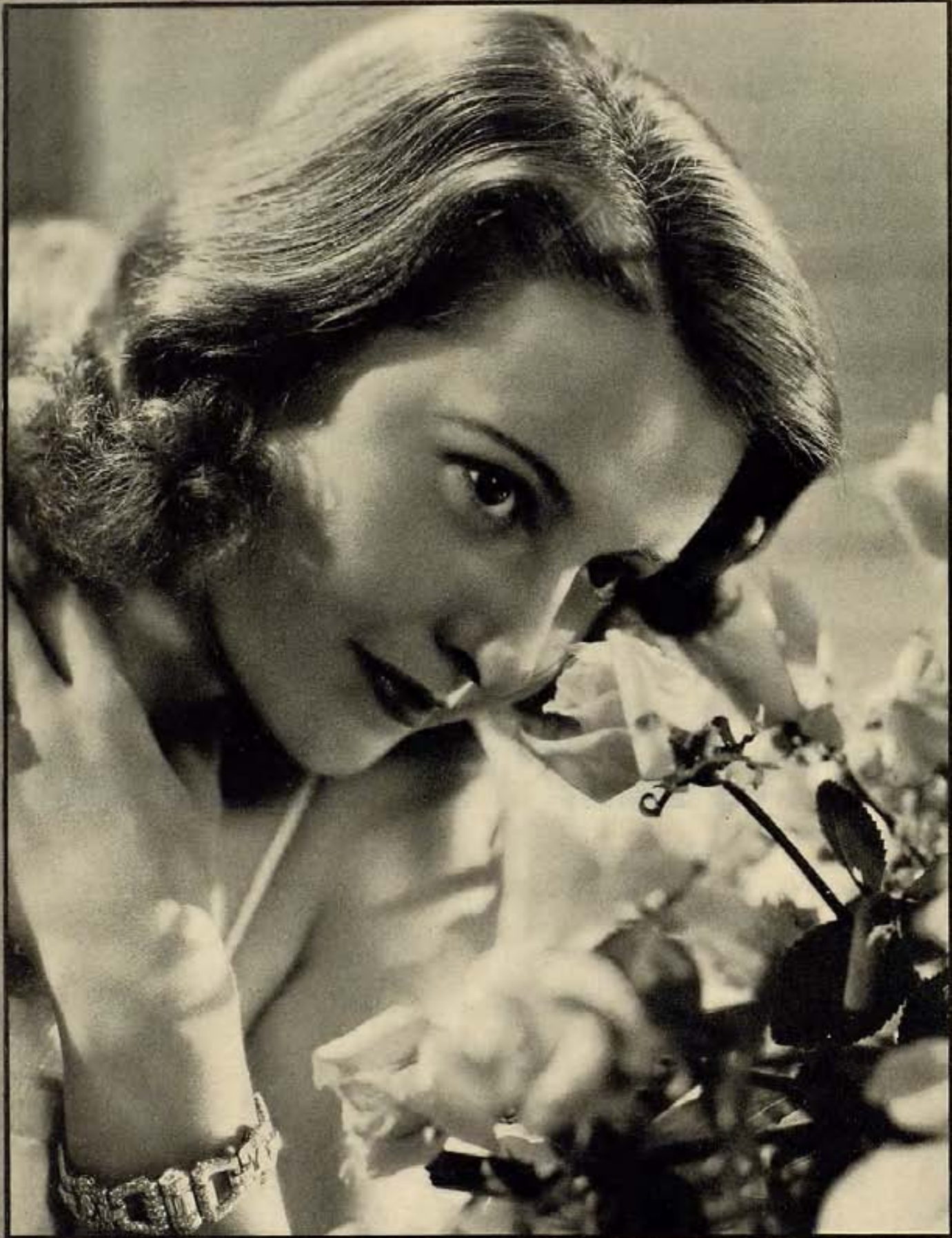
Barbara Stanwyck 20th Century-Fox Ayuntamiento de Madrid