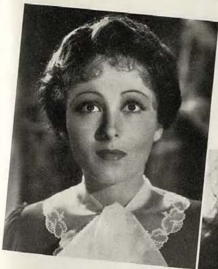
Dos fotos de la bella actriz vienesa Luise Rainer, en los dos films que ha hecho en Hollywood. Arriba en el papel de Anna Held, de "El gran Ziegfeld," y abajo en "Escapade," ambas de M-G-M.

Luise Rainer se atreve a decir en Hollywood que no cree que el mundo deba dividirse en dos clases, los que aciertan y los que se equivocan. Y conste que Hollywood está mortalmente dividido en estas dos clases. Para quienes tienen la buena suerte de trabajar en los estudios, los demás son una manada de seres insignificantes. Y para estos últimos, los que tienen contrato son servil rebaño de asnos.