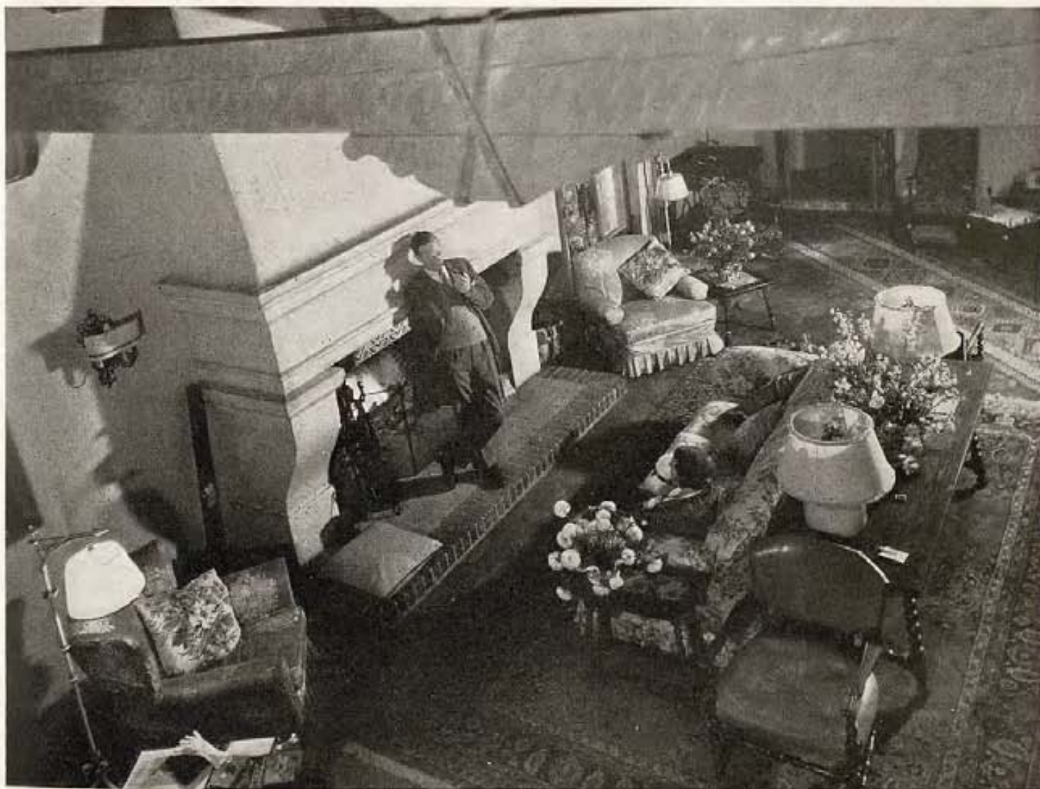
El astro inglés Leslie Howard, con su pipa favorita, pasa una velada tranquila cambiando impresiones con su esposa en esta bien amueblada sala de su casa en Beverly Hills.