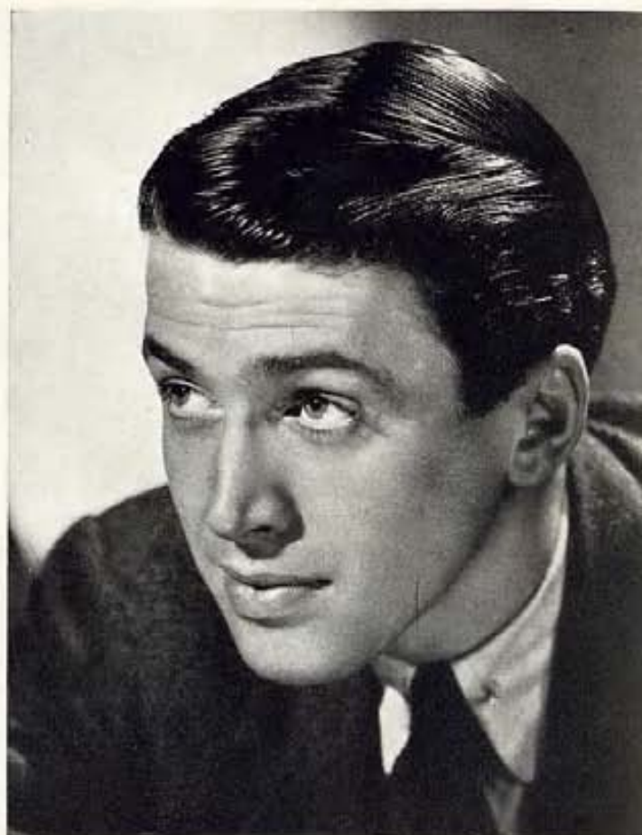
JAMES STEWART, ACTOR DE WARNER BROS.