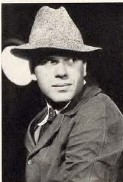
A FRANK CAPRA LE DEBEMOS ESA EXCELENTE PRODUCCION QUE SE TITULA "EL DESEO DE VIVIR", DE LOS ESTUDIOS COLUMBIA.

A MARIA — CON CARINO — "To Mary—with Love" es uno de esos triángulos amorosos que nos muestra a ese tipo extraño a nuestros países y a nuestra psicología. El fiel enamorado que sufre en silencio a través de los años y espera pacientemente — nadie sabe por qué — contentándose con que el objeto de su adoración lo trate como a un hermano querido. Con el corazón hecho pedazos ve a su amada felizmente casada y con hijos, y nunca se encuentra con una mujer que le haga olvidar a la otra. Myrna Loy es la mujer en cuestión que despierta tal pasión; Warner Baxter el marido que no se da cuenta de que su íntimo amigo, Ian Keith, ama secretamente a su mujer. En