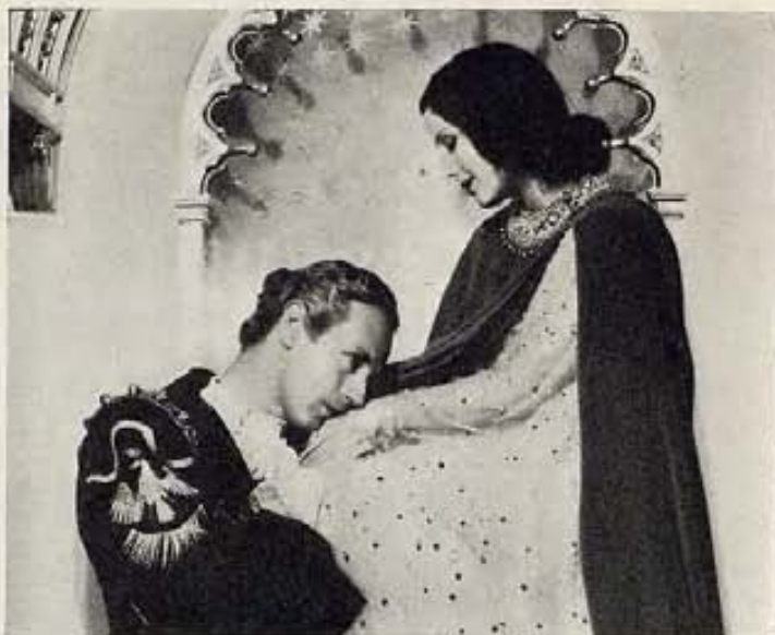
"ROMEO Y JULIETA", FILM DE M-G-M.