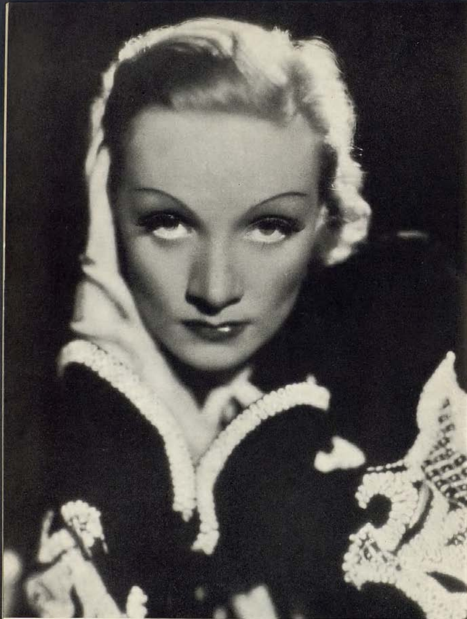
MARLENE DIETRICH, ESTRELLA DE PARAMOUNT