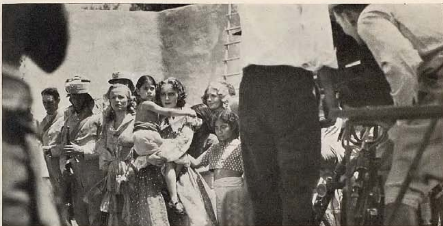
EL CAMERAMAN ENFOCA UNA ESCENA CALLEJERA DURANTE LA FILMACION DE "CHARGE OF THE LIGHT BRIGADE", PELICULA DE WARNER BROS.-FIRST NATIONAL. OLIVIA DE HAVILLAND APARECE EN PRIMERA LINEA.