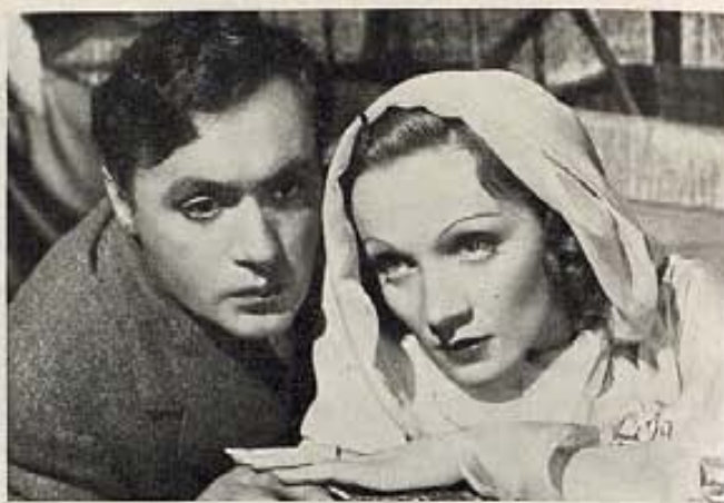
Pronto veremos a Marlene Dietrich y Charles Boyer en el film a colores, "El Jardín de Alá," de Seltznick.