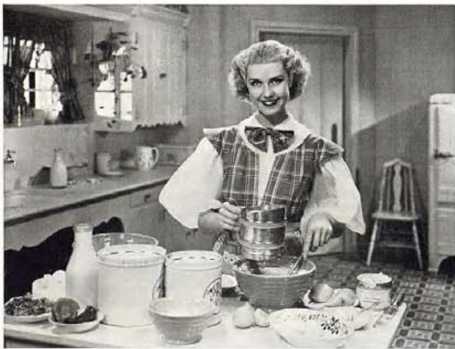
LA AUTORA DE ESTE ARTICULO NOS LLEVA A LA GRANJA DE ANITA LOUISE, BELLA ESTRELLITA DE LOS ESTUDIOS WARNER BROTHERS, DONDE SU AISLAMIENTO NO PROHIBE EL USO DE EQUIPO DE COCINA MODERNO.

—Marie quedó tan encantada con las nuevas paredes de su cocina, que se entusiasmó y pintó todos los muebles viejos, como pueden verlos, de color rojo