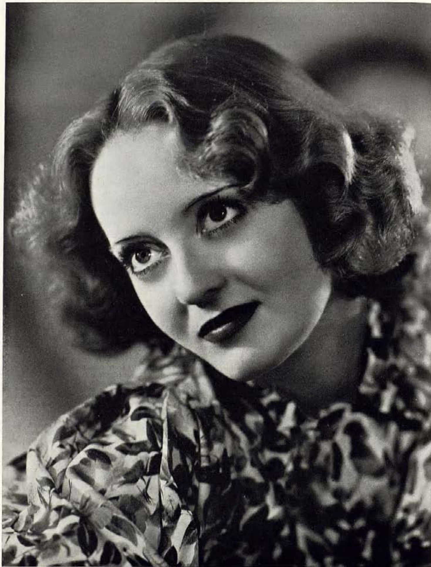
BETTE DAVIS, ESTRELLA DE WARNER BROTHERS-FIRST NATIONAL