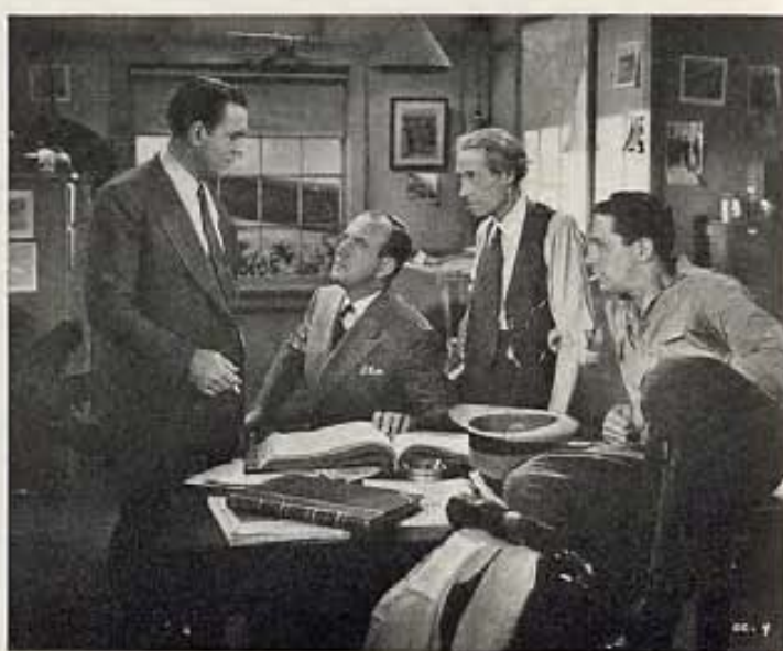
"CHINA CLIPPER", FILM DE WARNER BROTHERS.