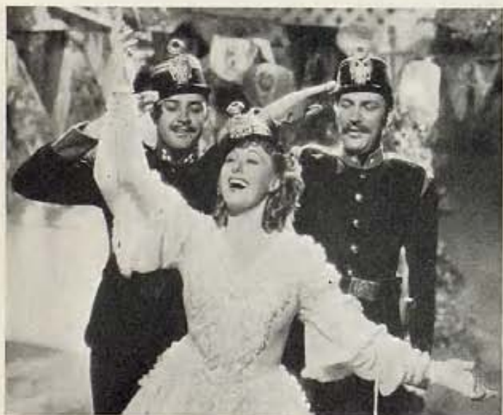
"LA PRINCESA ENCANTADORA", FILM DE COLUMBIA