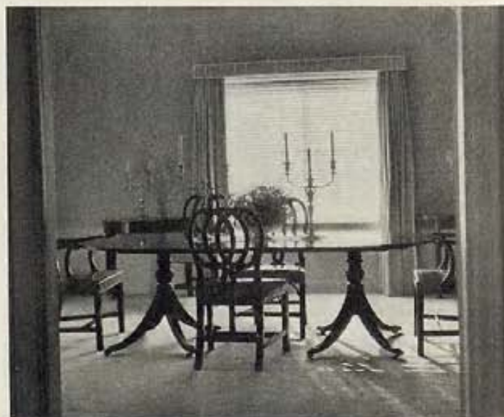
..... CUYA SIMPLICIDAD ENCANTA A SIMPLE VISTA .....