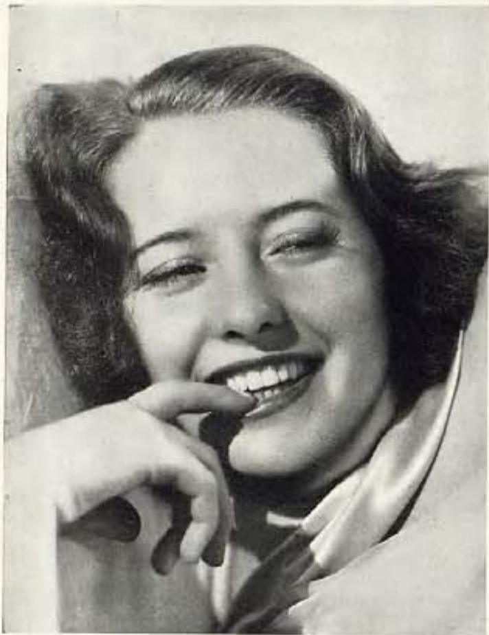
BARBARA STANWYCK, ESTRELLA DE R.K.O.