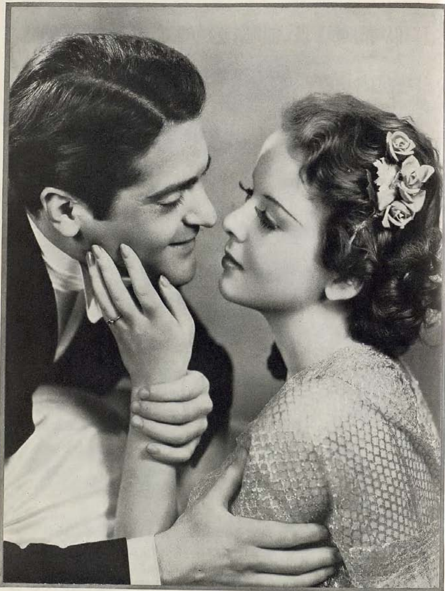
FRANCIS LEDERER Y IDA LUPINO EN "UNA TARDE LLUVIOSA", DE A.U.