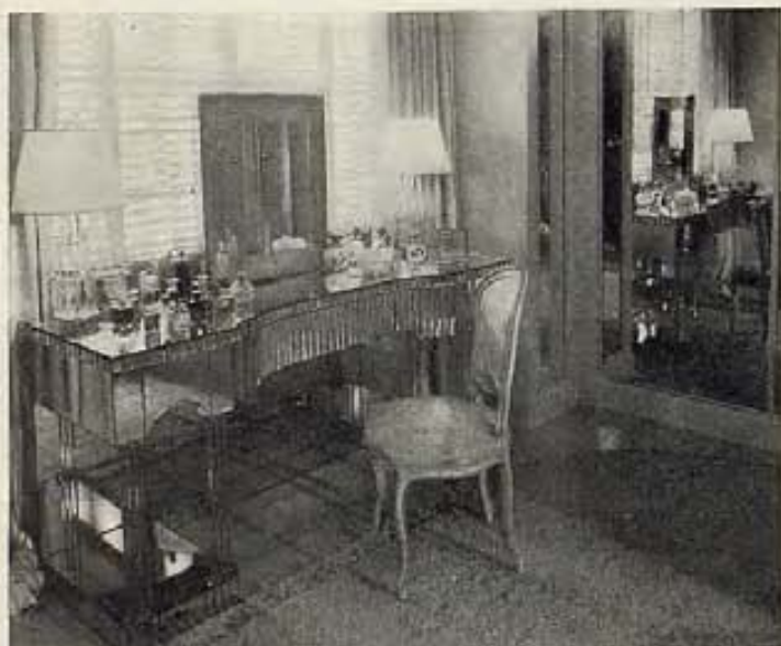
..... CONTRA LA VENTANA UNA MESA DE TOCADOR .....