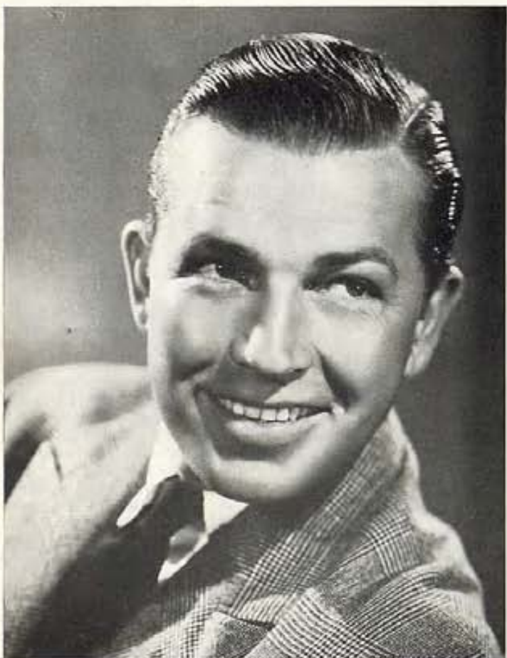
BRUCE CABOT, ACTOR DE WARNER BROTHERS