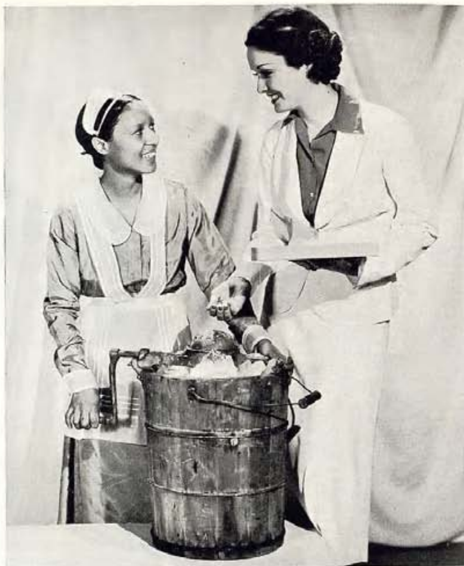
A GAIL PATRICK, ESTRELLA DE PARAMOUNT, LE GUSTAN MUCHO LOS HELADOS Y AFIRMA QUE NINGUN ARTEFACTO MODERNO IGUALA EN RESULTADOS A LA SORBETERA ANTIGUA, AUNQUE SEA MAS DIFICULTOSA DE MANEJAR.

Distribuidor de Exportación Kimball Hall, Chicago, E.U.A.