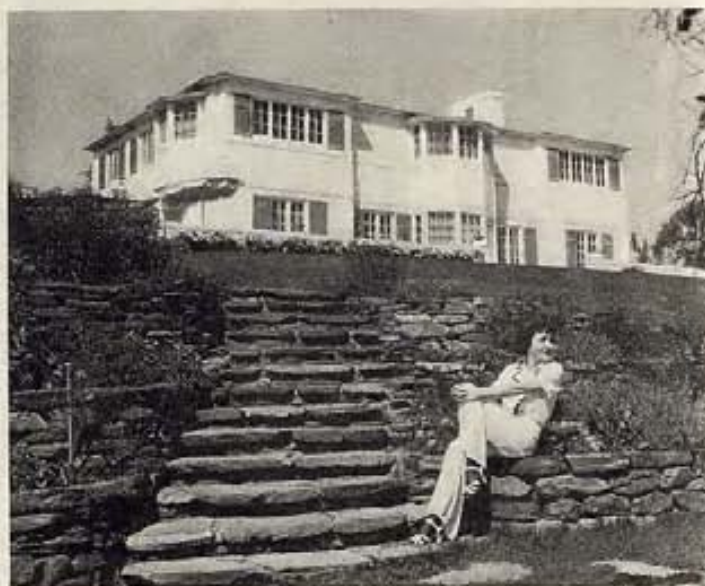
..... SE ALZA UNA MANSION BLANCA Y Suntuosa .....