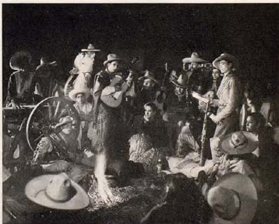
UNA ESCENA CAMPESTRE DE LA PELICULA "CIELITO LINDO", EDITADA POR LA PRODUCTORA JOSE LINDO BUENO, EMPRESA MEXICANA.

ANDA ahora de vuelta por los estudios de esta tierra, el autor-productor-director Miguel Contreras Torres, responsable, entre otras cosas, de "Juárez y Maximiliano", que la Columbia Pictures presentó en las pantallas de todo el mundo. Miguel Contreras Torres, uno