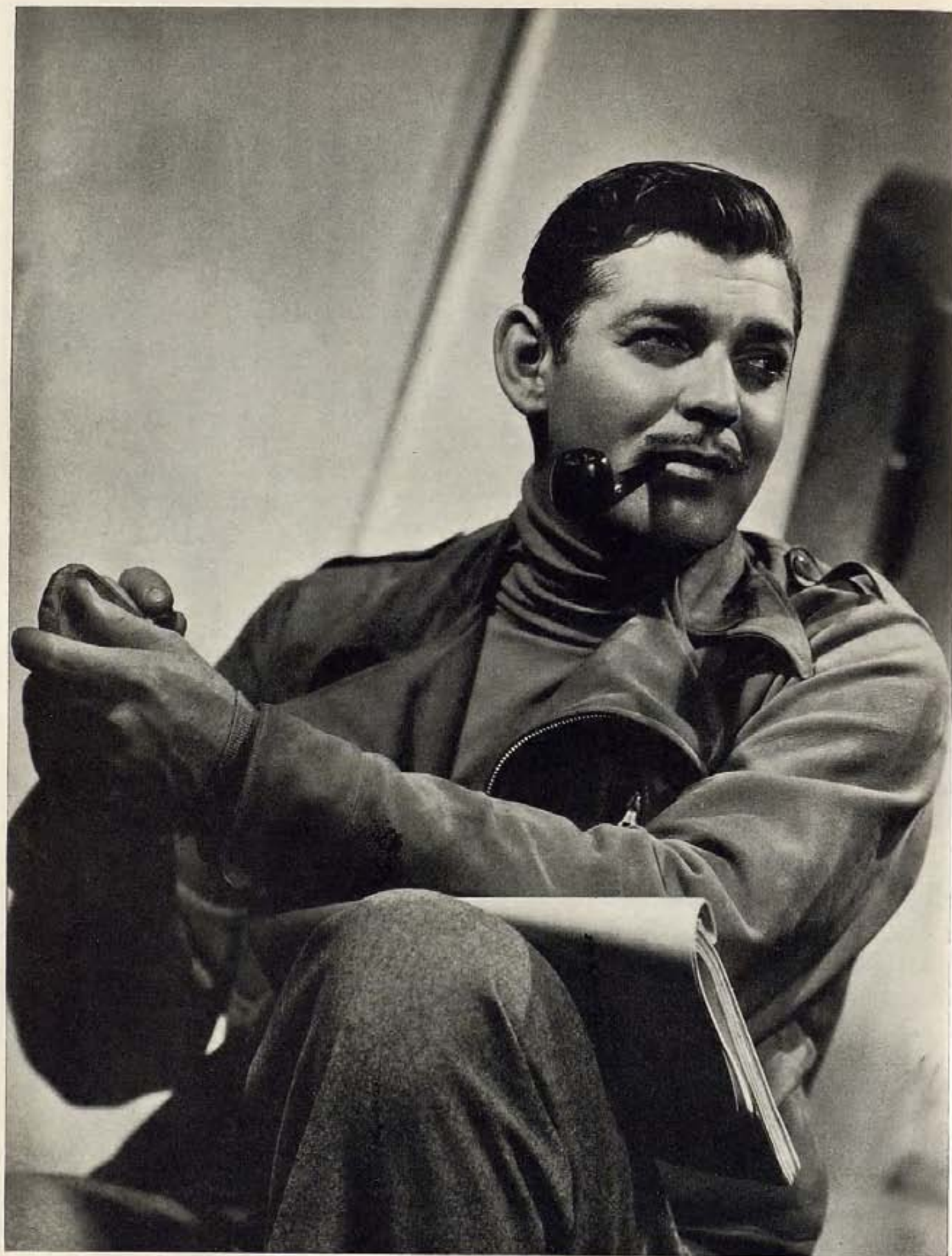
CLARK GABLE, ASTRO DE M-G-M.