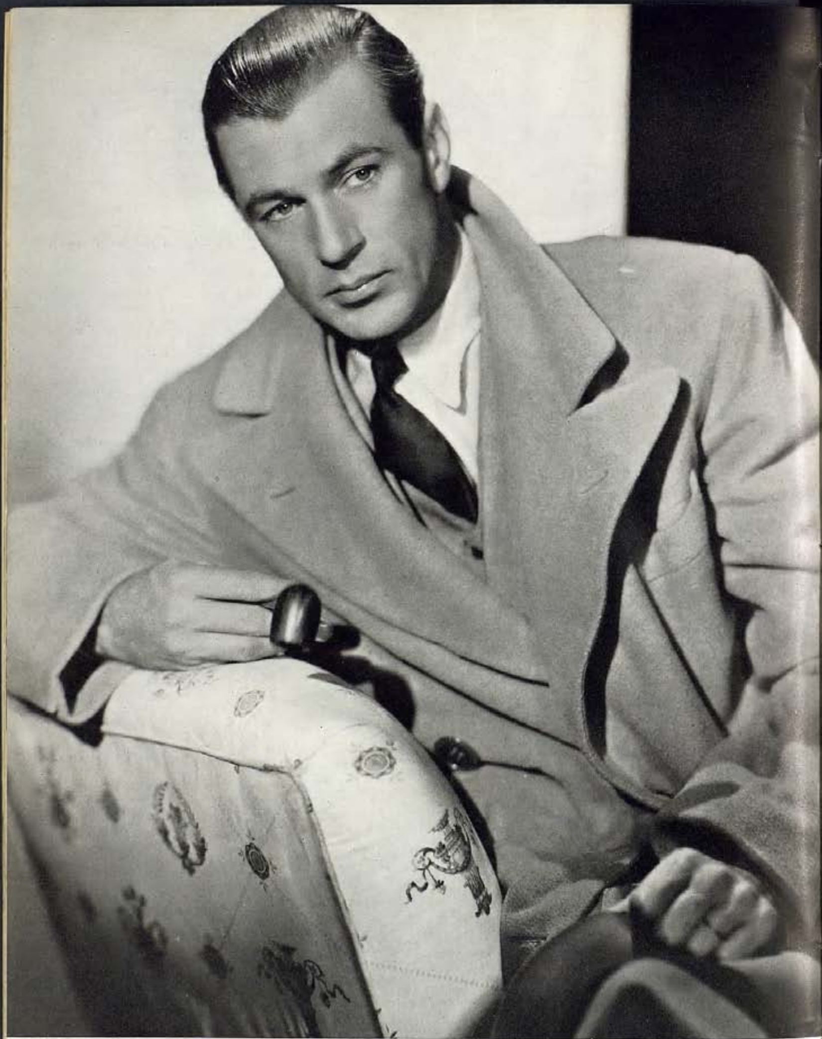
GARY COOPER, ASTRO DE PARAMOUNT