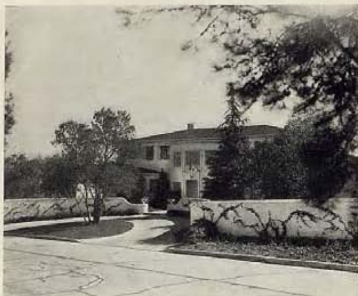
..... EN LA CURVA SUAVE DE UNA VERDE COLINA .....