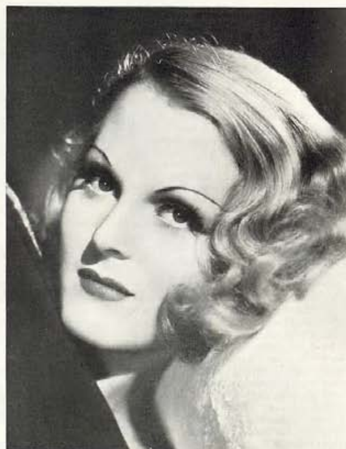
KETTI GALLIAN, ESTRELLA DE PARAMOUNT.