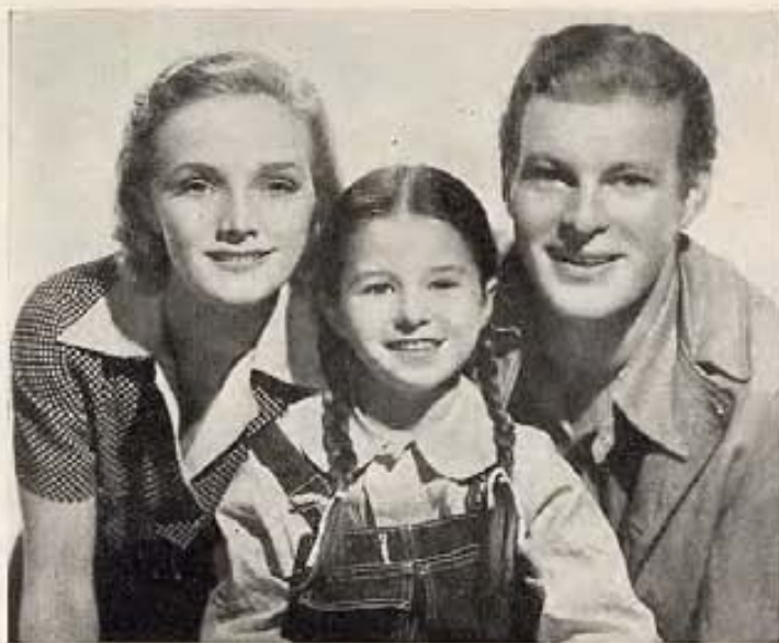
ELIZABETH RUSSELL, VIRGINIA WEIDLER Y LEIF ERIKSON, EN "LA ALDEA DORMIDA", DE PARAMOUNT.