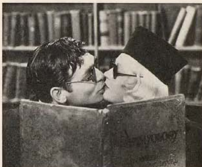
CLARK GABLE Y MARION DAVIES, CON ANTEOJOS NEGROS, EN "CAIN Y MABEL", DE WARNER BROS.-FIRST NATIONAL.