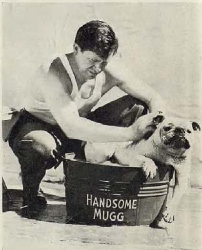
STUART ERWIN LE TIENE GRAN CARÍO A SU PERRO, POR SU EXTRAÑO PARECIDO CON EL, TANTO EN LO FÍSICO COMO EN LO MORAL. PERO A MUGG NO LE GUSTA QUE LO BAREN MUCHO.