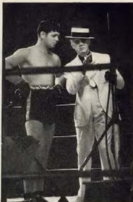
A CLARK GABLE LE HAN ENTRADO AMBICIONES PUGILÍSTICAS, O ES UN CANARD DE PUBLICIDAD. AQUÍ LO VEMOS PREPARÁNDOSE A FILMAR UNA ESCENA DE "CAIN Y MABEL", DE WARNER BROTHERS, BAJO LA DIRECCIÓN DE LLOYD BACON.