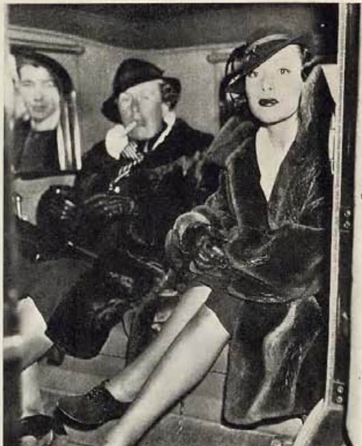
UN FOTOGRAFO SORPRENDE A DOLORES DEL RIO Y SU MAMA, A SU LLEGADA A NUEVA YORK. DOLORES ACABA DE REGRESAR A HOLLYWOOD, HABIENDO FIRMADO CONTRATO CON COLUMBIA.