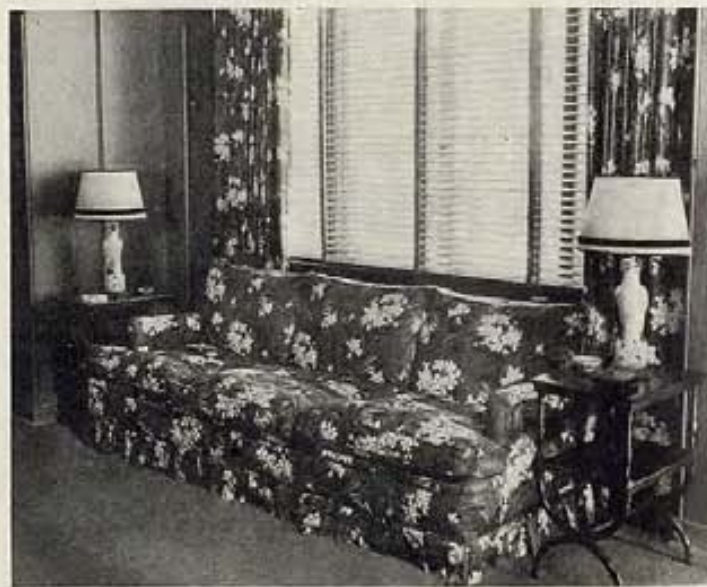
..... SUMERGIDOS EN UN SOFA DE IMPECABLE ESTILO .....