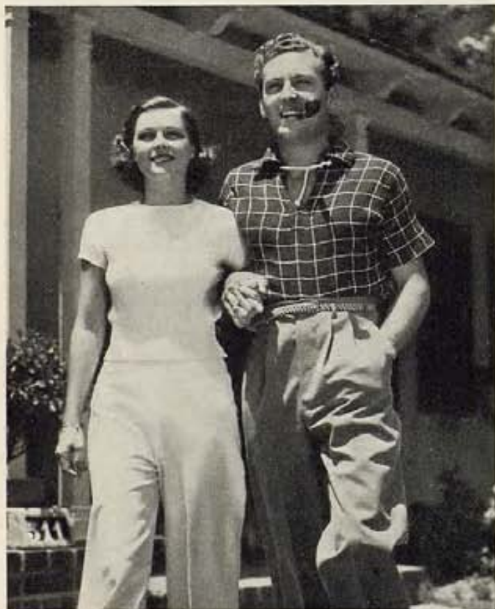
ALLAN JONES, EL CANTANTE QUE TANTO EXITO CONQUISTARA EN LA CINTA "MAGNOLIA", DE UNIVERSAL, ACABA DE CONTRAER MATRIMONIO CON IRENE HARVEY, ACTRIZ DE M-G-M.