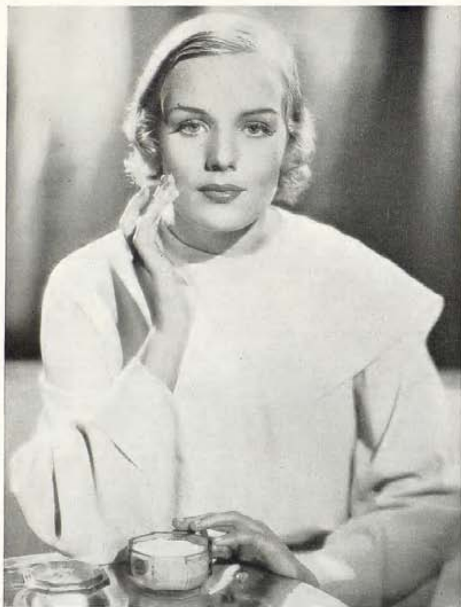
FRANCES FARMER DEMUESTRA LA TÉCNICA DE APLICAR UNA CREMAL AL ROSTRO CON EL OBJETO DE CONSERVAR LA SUAVIDAD Y TERSURA DEL CUTIS. FRANCES ES UNA DE LAS ESTRELLITAS MÁS POPULARES DEL ELENCO PARAMOUNT, Y ACABA DE FILMAR "RHYTHM ON THE RANGE", CON BING CROSBY.