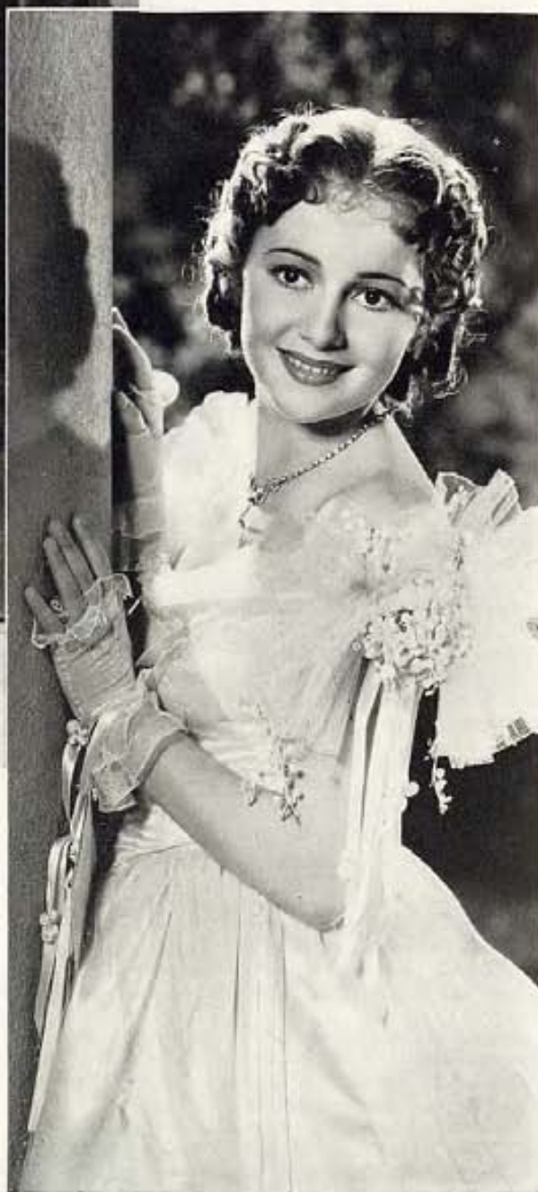
OLIVIA DE HAVILLAND ES UNA DE LAS MAS BELLAS ESTRELLAS DE CINELANDIA. AQUI LA VEMOS EN UNO DE LOS TRAJES QUE LUCE EN LA PRODUCCION "ADVERSIDAD", DE WARNER BROTHERS.