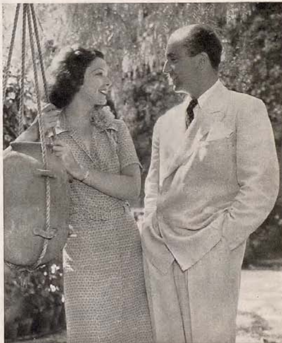
MYRNA LOY, POPULAR ESTRELLA DE METRO GOLDWYN MAYER, PRUEBA SU POPULARIDAD CON ARTHUR HORNBLow, JR., PRODUCTOR ASOCIADO DE PARAMOUNT, CASANDOSE CON EL. MYRNA ACABA DE HACER "TO MARY—WITH LOVE", EN LOS ESTUDIO 20th CENTURY-FOX.

de ocurrirle a Myrna Loy. La ya famosa estrella es, en la pantalla, la mujer mimada por excelencia, que vive en un ambiente de lujo, en casas espléndidas, rodeada de servidumbre, adorada de su esposo. Ya sea éste William Powell, Clark Gable o Warner Baxter, Myrna Loy es siempre el eje de todas las atenciones de sus admiradores. Es una princesa de cuentos de hadas reencarnada en tiempos modernos. Y cuando el tema de sus películas exige una ceremonia matrimonial en la que Myrna sea la novia, entonces sí que el estudio echa la casa por la ventana. Una capilla de mármol y ónix, un traje de novia digno de una reina, un bouquet de orquídeas que no lo podría comprar la estrella