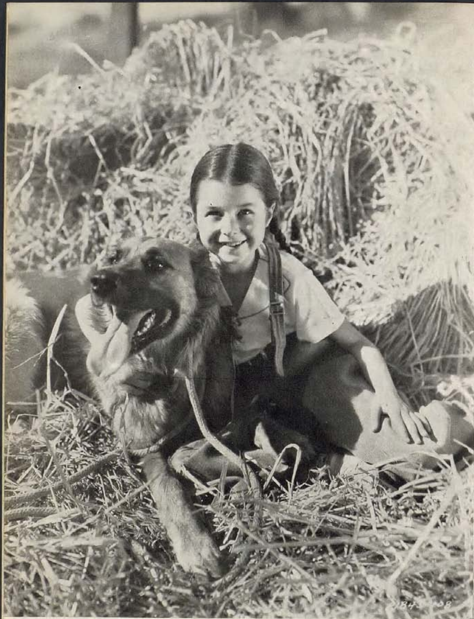
VIRGINIA WEIDLER, ESTRELLITA DE PARAMOUNT