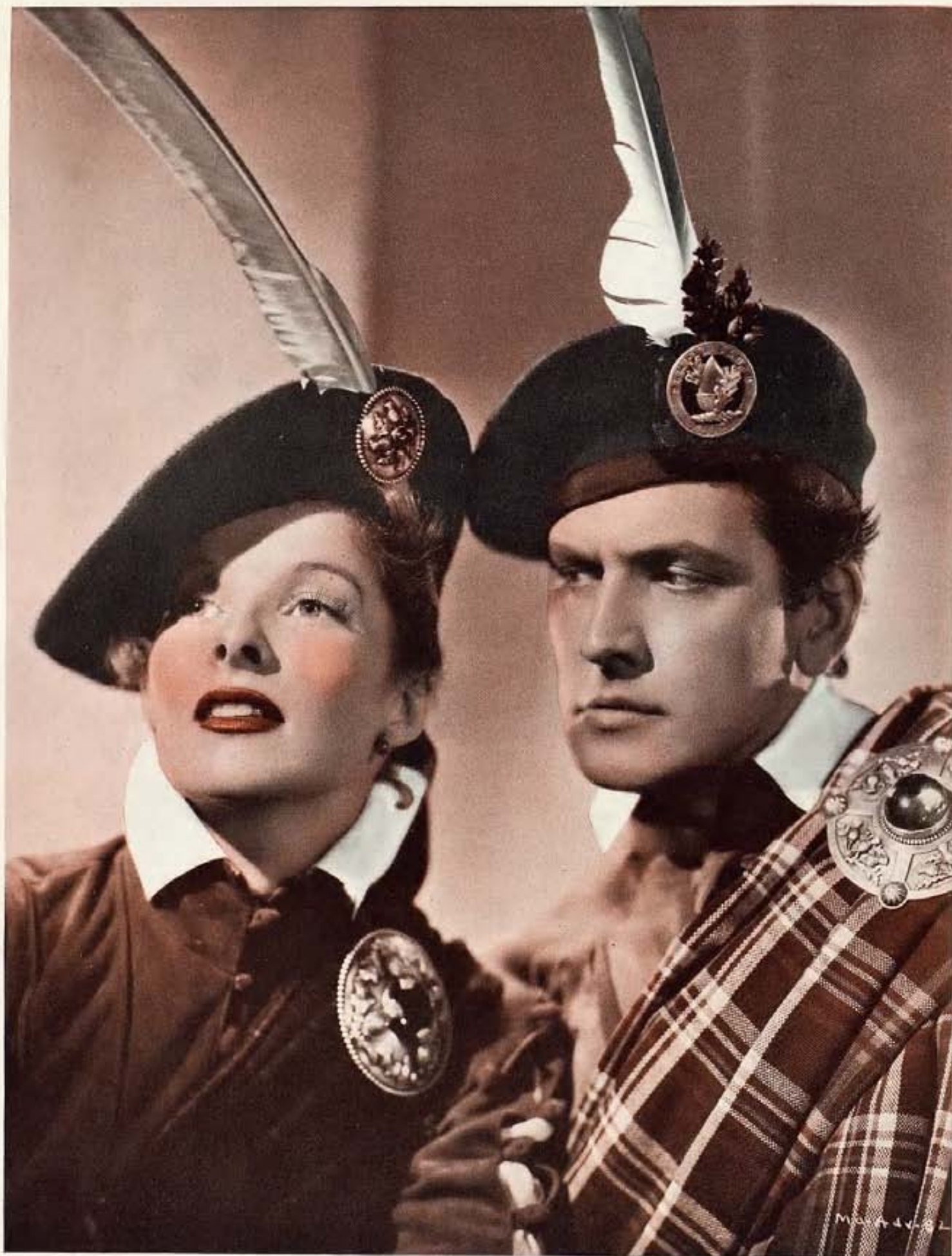
KATHARINE HEPBURN Y FREDRIC MARCH, EN "MARIA DE ESCOCIA", DE R.K.O.