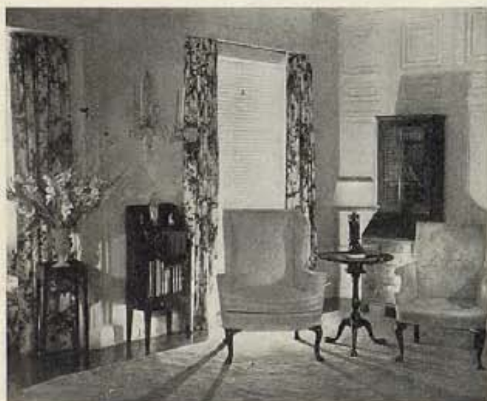
..... UN RINCON ENCANTADOR QUE INVITA A LA CHARLA .....