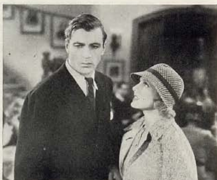
"EL SECRETO DE VIVIR", FILM DE COLUMBIA.