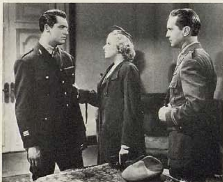
"SUZY", FILM DE M-G-M.