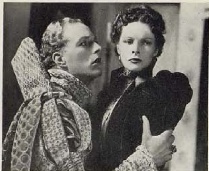
"MARIA DE ESCOCIA", FILM DE R.K.O.