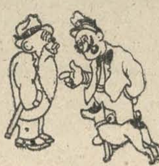
—El segundo fué Mola.