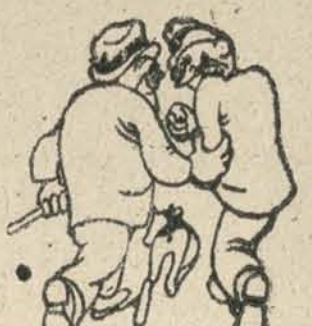
—Y el quinto, lo estamos haciendo nosotros con nuestra pasividad, al no entrellarnos a todos.