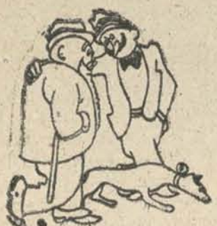
—Primero fué Sanjurjo.