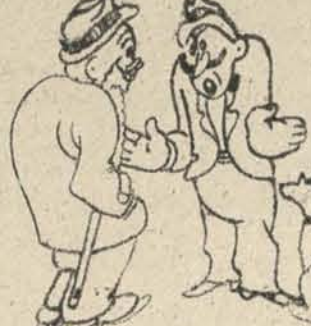
—El cuarto, bien lo puede hacer el caudillo.