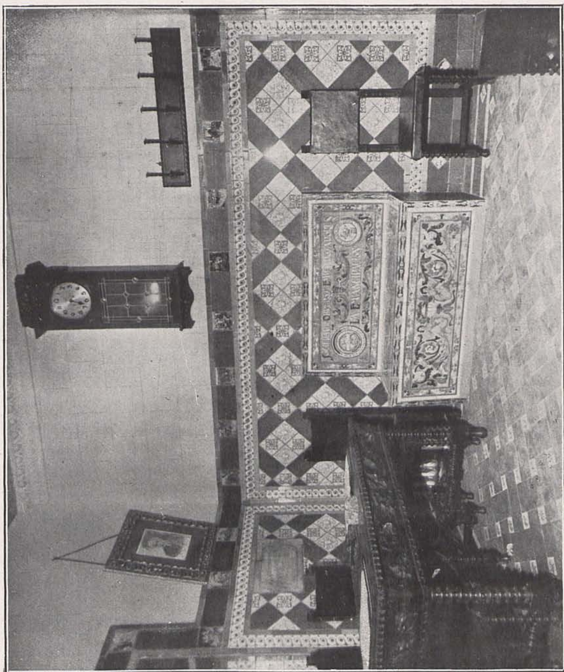
Ayuntamiento de Madrid