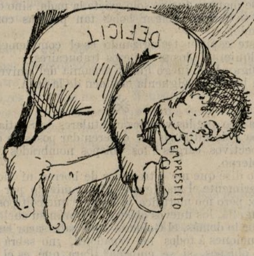
También se verificó un empréstito.