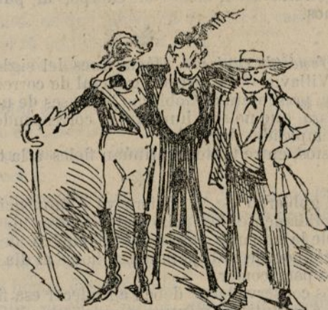
Y se formó la gran liga nacional.