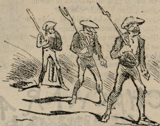
En la provincia de Lérida se presentaron otros tres carlistas: esta vez con armas.