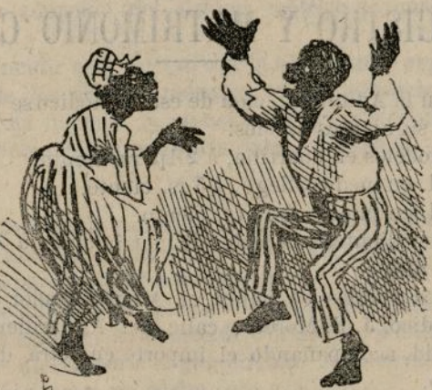
Consecuencias del discurso de Castelar.