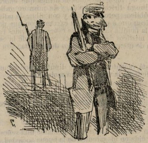
Y el motín de reglamento.