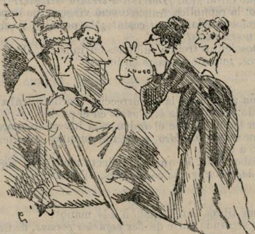
Una diputación de señoras presentó al Papa un álbum con 20,000 firmas y una bolsa con 70,000 escudos.