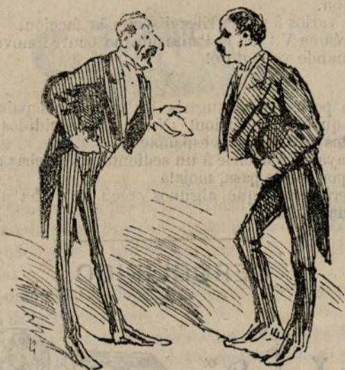
El círculo alfonsino celebró el natalicio de uno de los príncipes de Asturias.