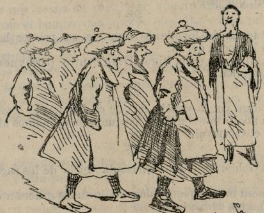
El elemento joven de la mayoría, á pesar de sus tiernos años, almorzó en Los Dos Cisnes. Se cree que acabará por comer.