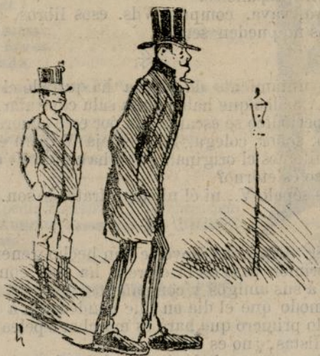
El señorito salió á paseo.