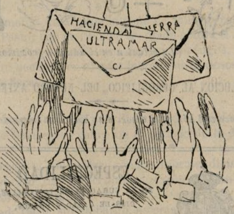
Y la crisis correspondiente á cada mes.