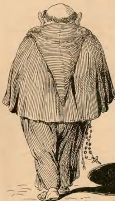
Microbis de primera.