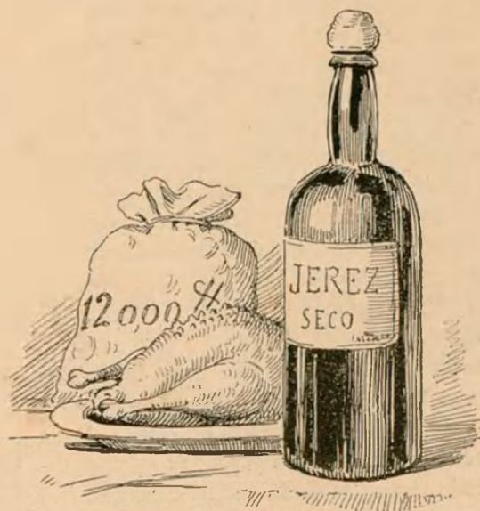
Lo millor anti-colérich del Dr. Tranquil.