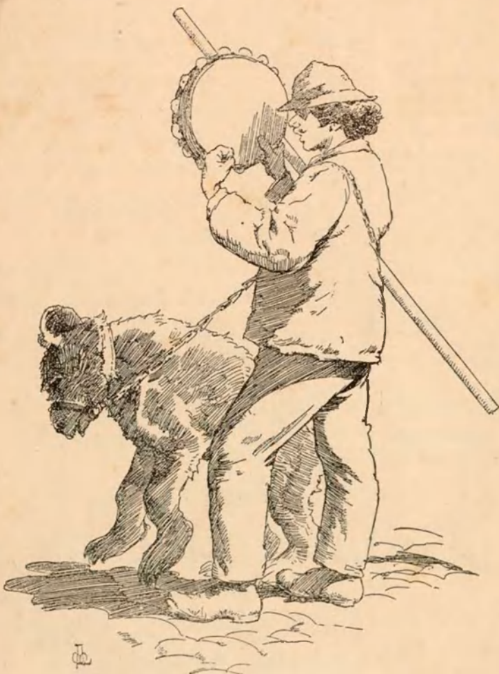
Per las plassas.