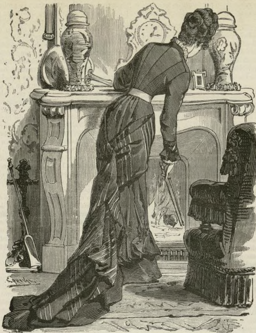
TRAJE DE CASA.

El grabado adjunto dá idea de un traje de faulle color de núa, de casimir de la India, de color semejante, con rayas color amarillo de oro. Este modelo se compone de una falda y de un cuerpo liso. La falda, fruncida en la cintura, tiene una larga cola. Por delante es bastante ancha para poder disponer el bajo de ella de la manera siguiente: el borde de la falda está doblado hacia arriba y después fruncido á la altura del dobladillo por grupos de pliegues. Una banda de faulle completa la longitud del delantero. Dos echarpes de casimir rayado están colocados sobre la falda formando drapería; la una rodea la parte superior y baja luego á confundirse con la cola de la falda; la otra arranca de la parte inferior de la costura del costado izquierdo y formando pliegues después, se une con la precedente. El cuerpo, alto y liso, está ceñido por un cinturón color amarillo de oro. La parte inferior de la manga está plegada en forma de embudo y rodeada de una drapería de casimir.