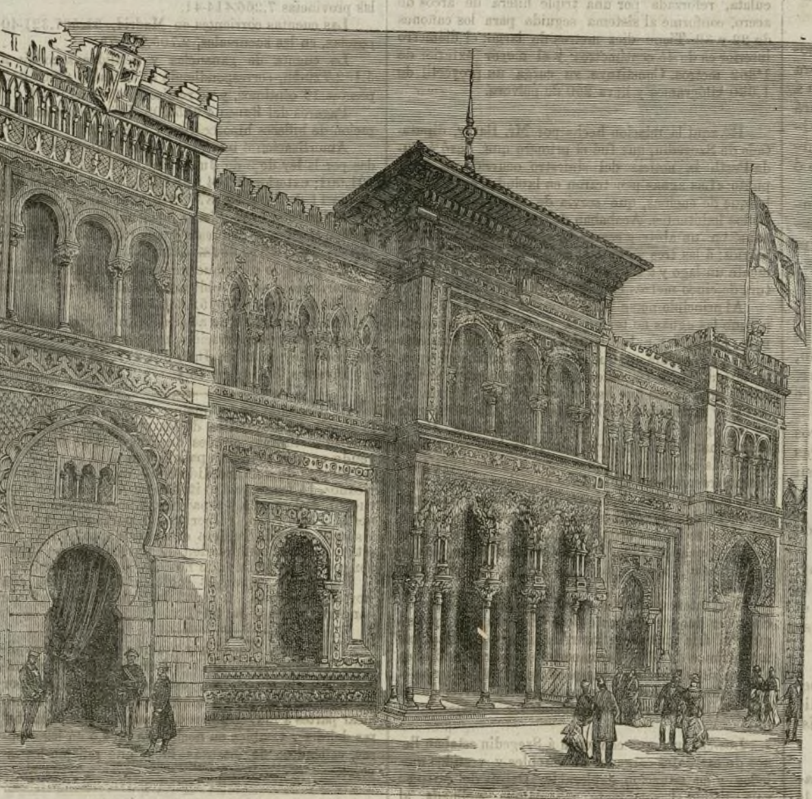
FACHADA DE ESPAÑA EN LA EXPOSICION UNIVERSAL.