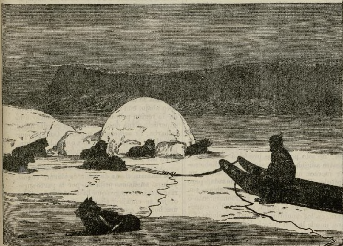
TREN DE PERROS CON SUS ARREOS.