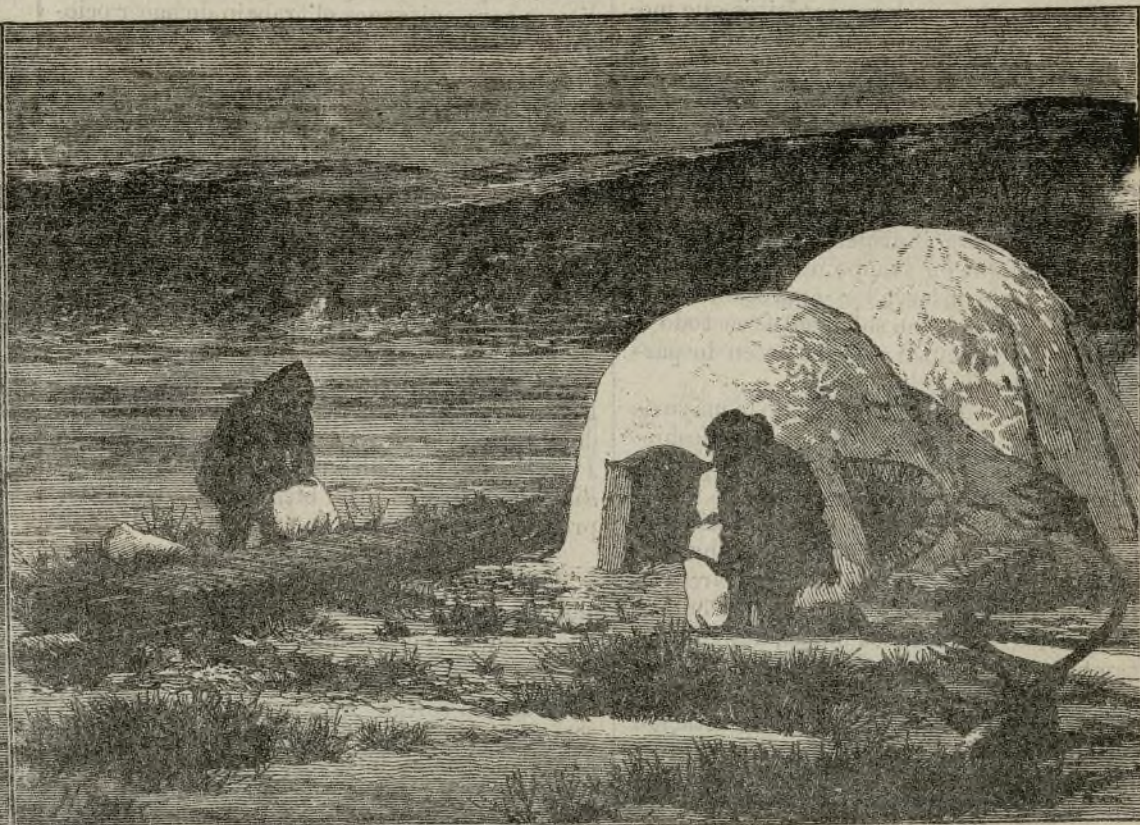
CABAÑA DE NIEVE CONSTRUIDA Á ORILLAS DEL RIACHUELO DE LA BALLENA.