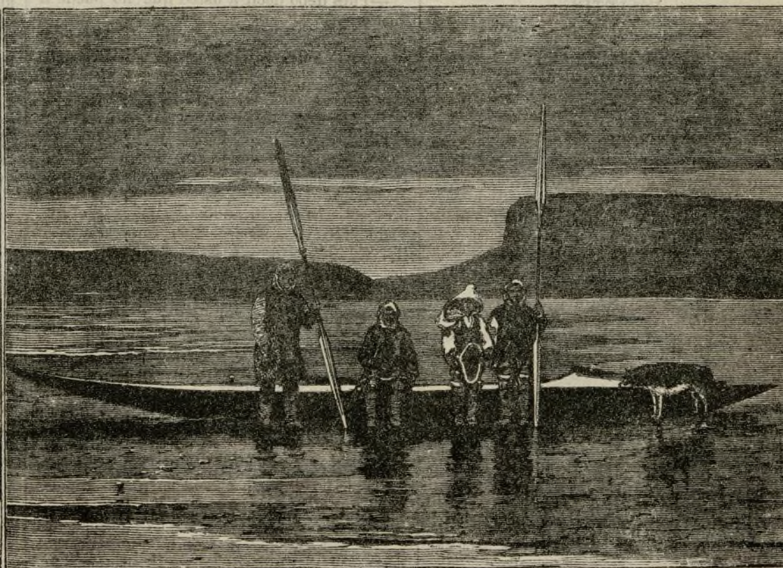
CANOA DE ESQUIMALES.