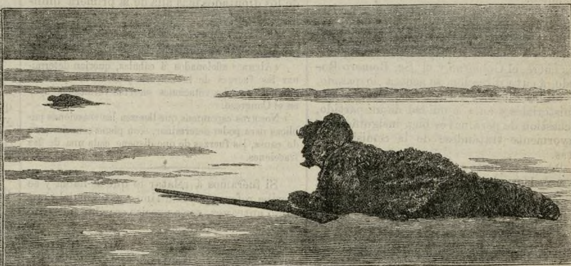
CAZA SOBRE EL HIELO DE LA FOCA.