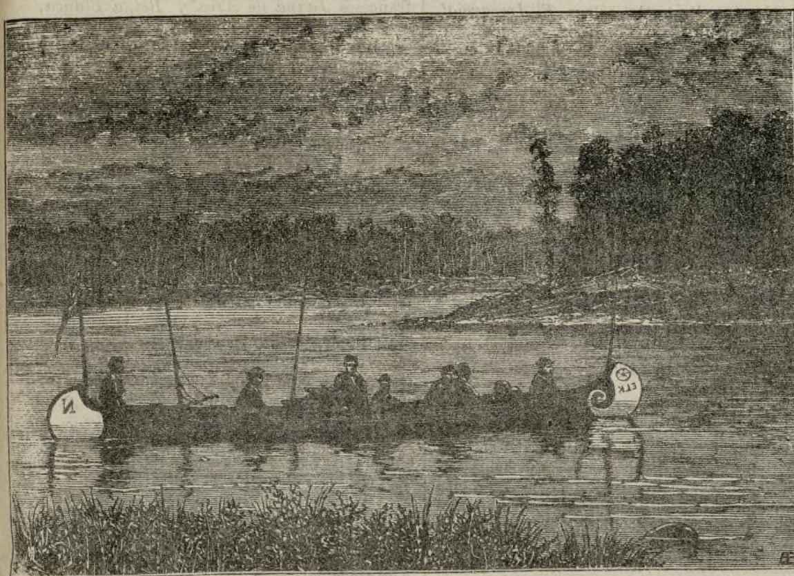
CANOA PRENTE Á LA FACTORÍA MOOSE.