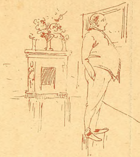
Su esposo sospechaba, y como era muy bruto, recelaba.