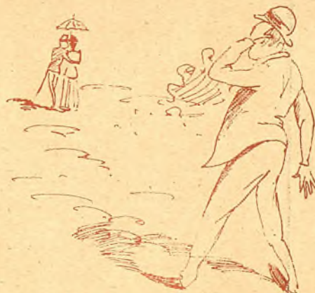
Los toros eran ciertos; ¡Sinforiana y su amante descubiertos!