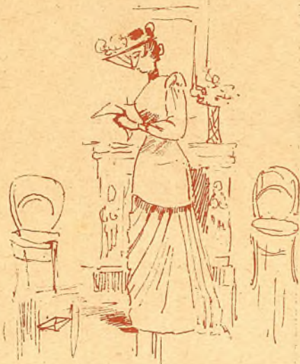
Era Sinforianita una chica tenida por bonita.