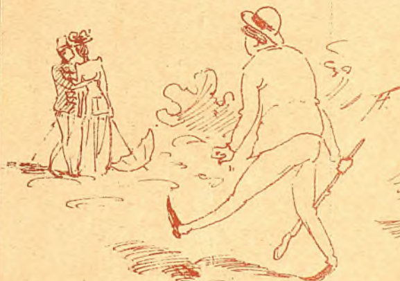
Con mucha bizarria el marido atacó al de infantería.