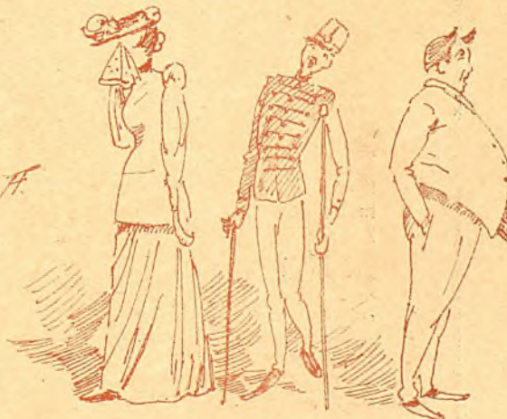
¡Consecuencias fatales del amor á las cosas terrenales!