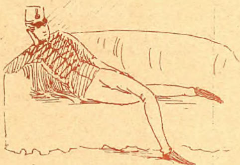
Porque la perseguía un joven oficial de infantería.