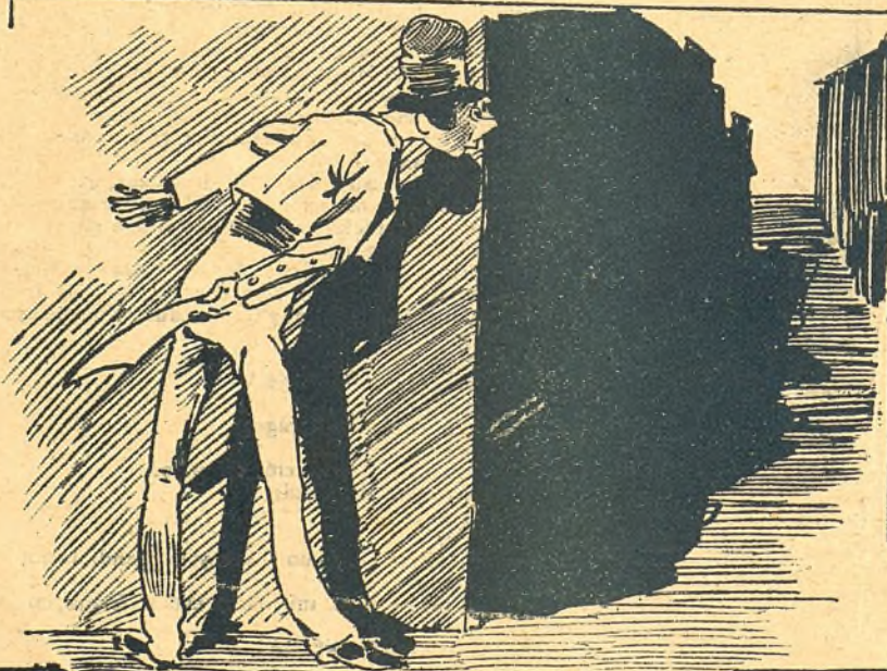
Caza de espera.