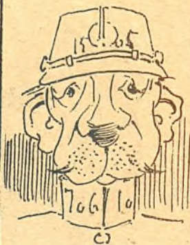
A caza de petardistas.