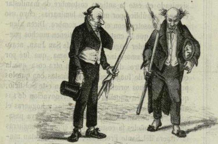
Mozitos del año doce.