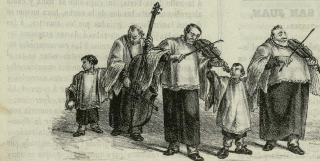
Paganini, Olle-Bull y Paque, ó sea la música den Felip.