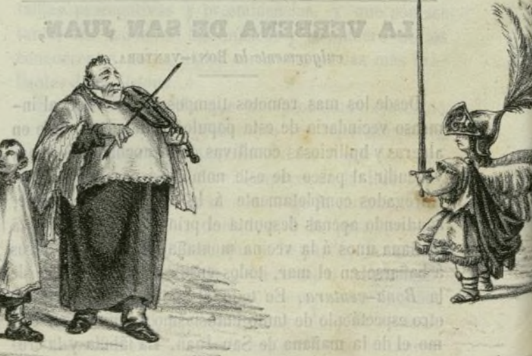
Pasaron luego Angelitos Bailando la Americana.