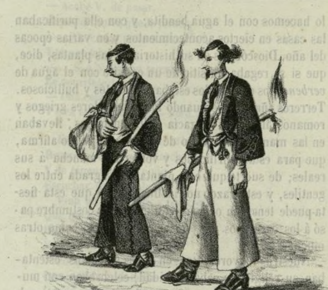
Paus y Gitanos.