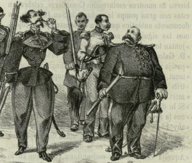
Lucimiento de la procesion.