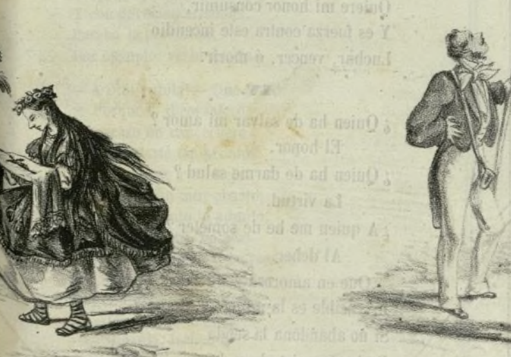
Y Santas con miriñaque; Hasta lo llevan las santas!!