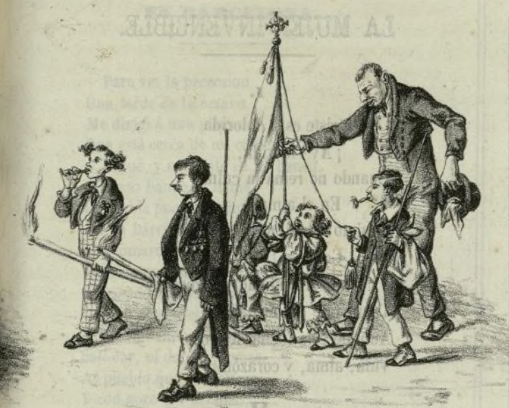
El mas aplicado del colegio con la casaca de su padre.