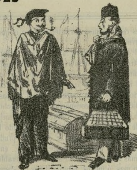
—¿Cuánt ne voleu de portarme aqueix bagul?—¿Por quien me toma V. zopenco?—Ay! perdoni; pensaba que era un camalich! Ja ho entench, es moda portar mantas.