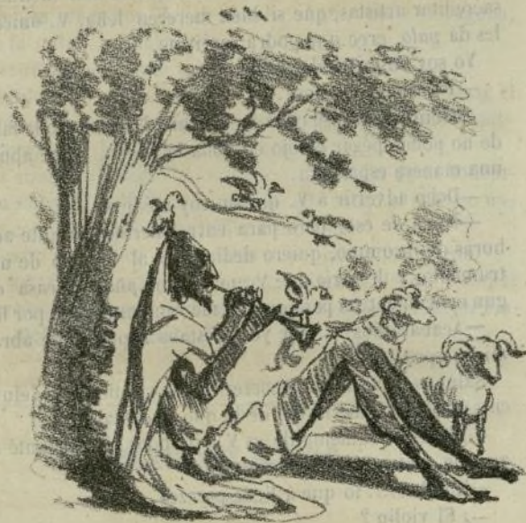
Palomas sin hiel, mansos corderos: he ahí lo que son los marroquies, según el periódico mencionado.