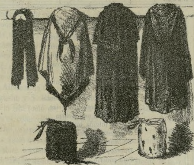
Junta de armamento y defensa que ha nombrado la nación, por habernos declarado la guerra S. M. Invernal.