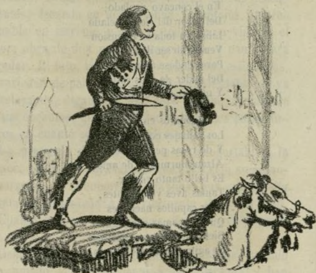
Circo Real, Cuadros de costumbres españolas por Mr. Price, hijo. ¡Juy... salero!..