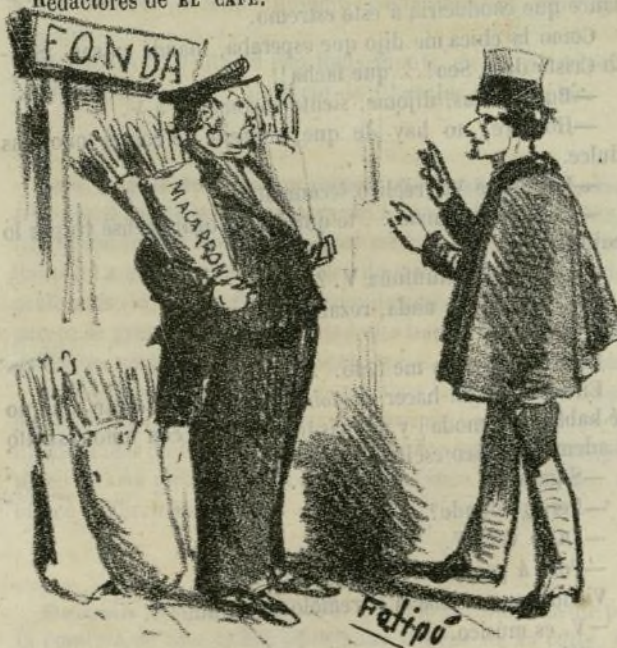
—Hombre de Dios! donde va con tantos macarrones? —Oh Dio! io fato molta provisione, come la compagnia del teatro Principale sarà tanto numerosa!