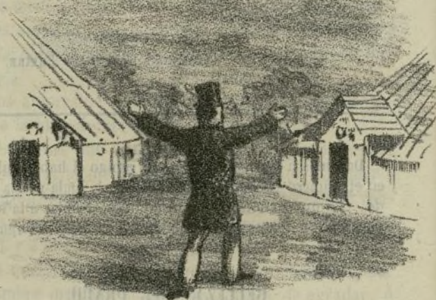
Entre Scyla y Charibdis, ó sea la vista anterior desde otro punto.