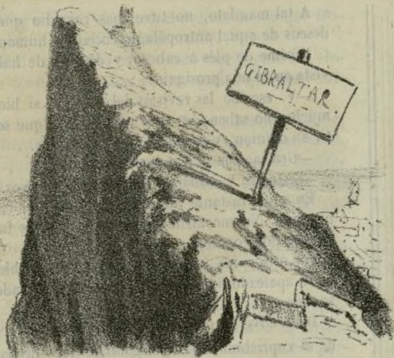
Parque ingles de S. M. berberisca y atalaya marroquí en España.