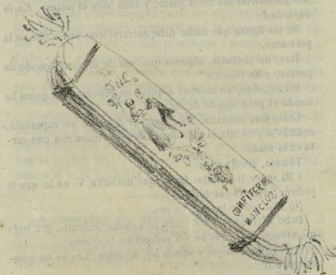
Al Gibraltar Chronicle, por lo bien que se explica. Los Redactores de EL CAFÉ.