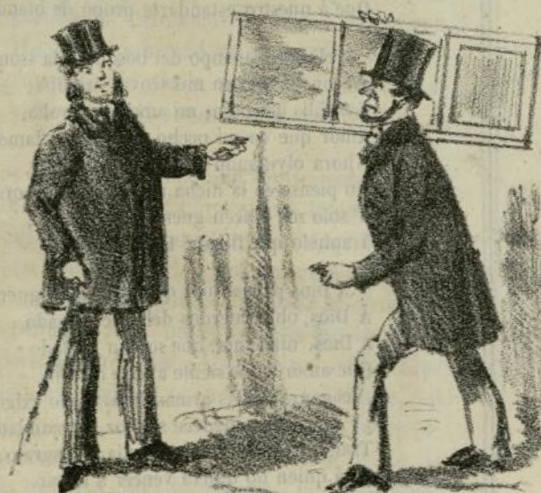
—Donde va V. con esa vidriera?—Al Circo de M. Price para resguardarme del aire.