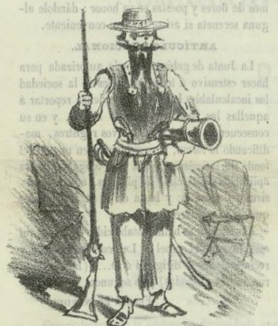
Nuevo traje para los acomodadores de las llas de la Rambla que sometemos a la aprobación del gacillero del Viario.