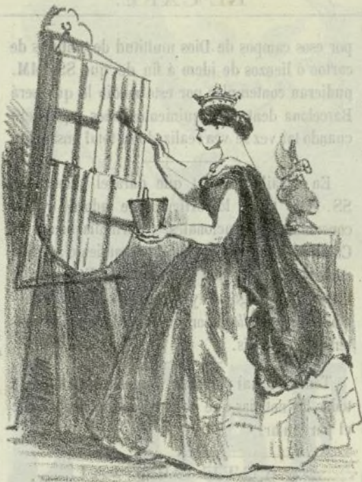
Barcelona preparandose para los festejos.