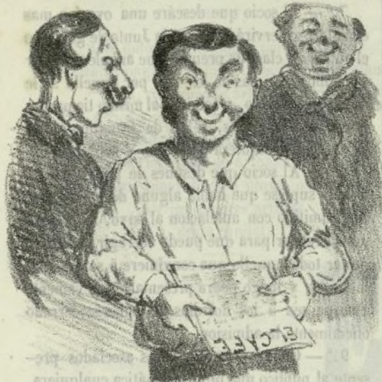
Obispo de nuestro Semanario.