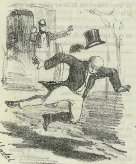
Saludo de despedida al bajar de los omnibus traspirenarios.