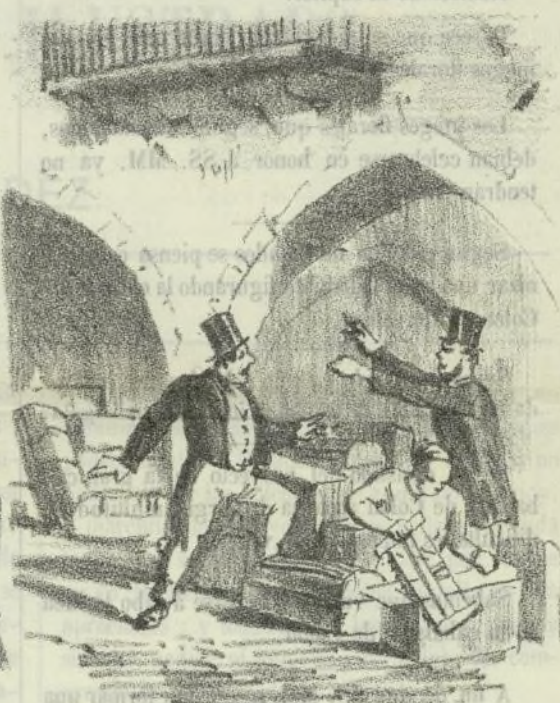
—Señores, aqui tienen ustedes su casa por si gustan suscribirse.