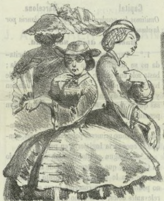
—Mes ay de los cors! que son eixas. Una duda: Los arcos de los encantos pertenecen a los bauleros ó tambien al público?