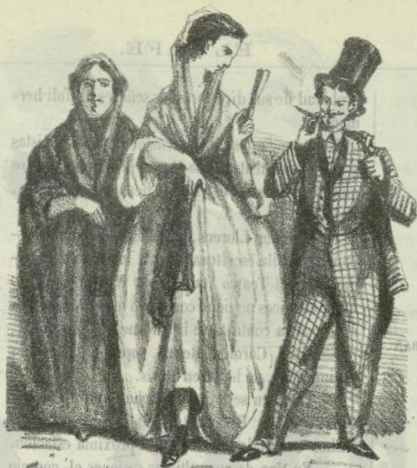
Jardines del Tivoli.