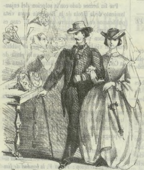
Paseo de las flores.