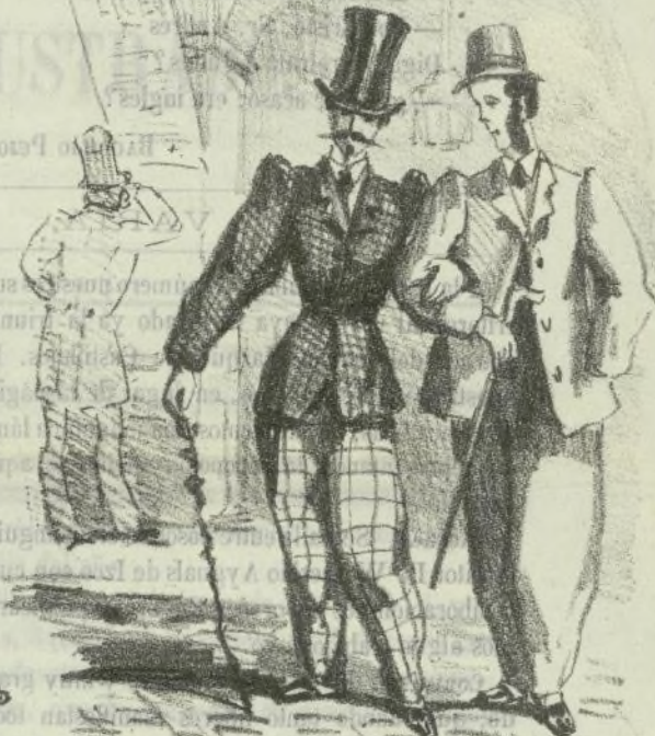
Lieco- salida del concierto.