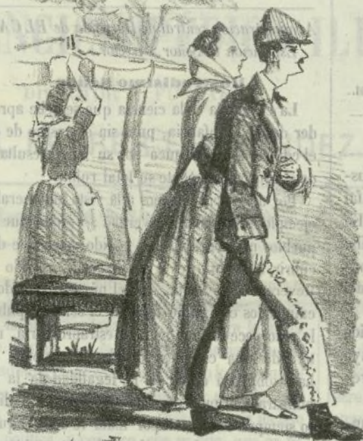
A los jardines de Entenpe.