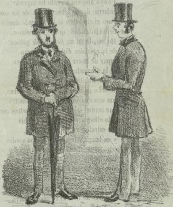
— ¿Que tal los Mártires?... — ¿Cuales?... el público o los cantantes?