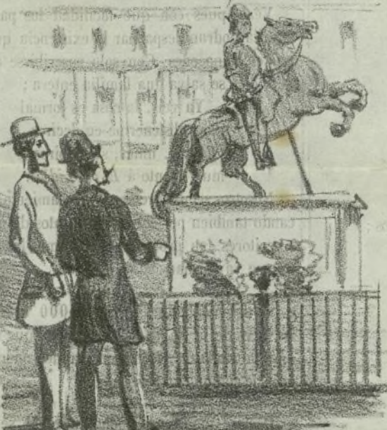
PLAZA REAL. — Ve V.¿ la cola, sirve para sostener la estátua.