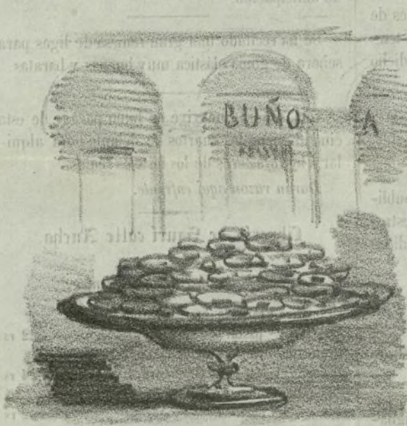
Una fuente de festejos.