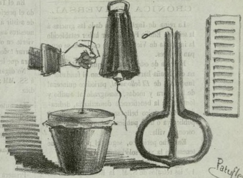
Para dar una serenata en acción de gracias a cierta corporación.