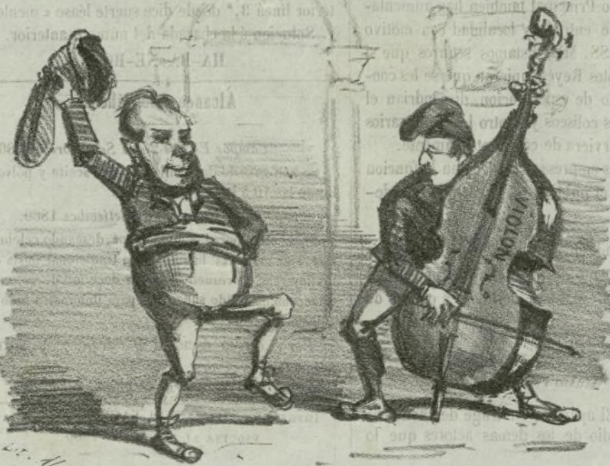
Siguen los preparativos para los festejos.