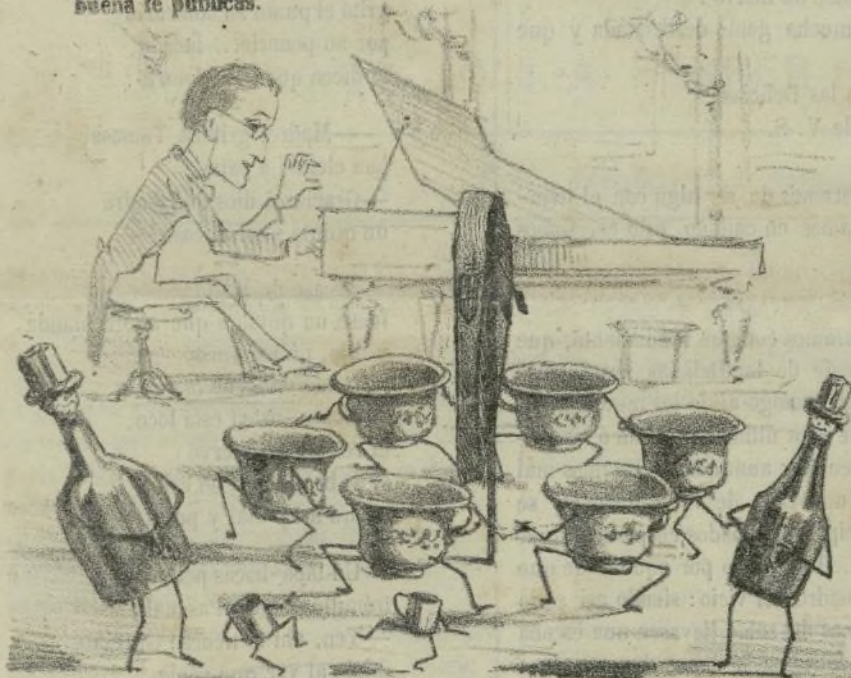
Un Café alegre. — Coro bailable —