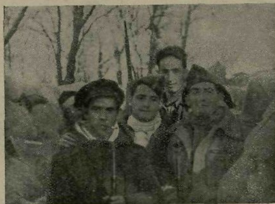
En las trincheras.

Las ametralladoras pueden en una guerra funcionar con mayor o menor eficacia. La táctica puede ser acertada o errónea. Los contingentes serán mayores o más cortos. Eso no importa, porque se corrige. Lo que no puede corregirse es la ausencia de un espíritu y de una moral que constituyen el elemento más necesario para los que combaten. Entre las armas que