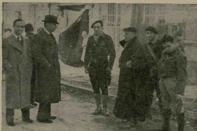
El representante de la Argentina con nuestro Jefe, durante su visita.

Para la Representación Argentina en Madrid ha sido un honor recibir y aceptar la invitación del teniente coronel Ortega de visitar su Cuartel general y los emplazamientos en que luchan, bajo su experta dirección, las Milicias Vascas y otros heroicos grupos de milicianos y soldados. Era preocupación fuertemente sentida por esa Representación la de que en los días mismos en que el mundo entero olvida problemas y deja a un lado querellas para dedicarse a las fiestas de la intimidad, aquellos que en pos de un ideal sufren todas las priva-