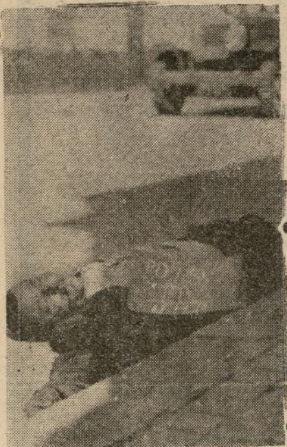
Un pobre vecino del barrio sevillano de Triana, asesinado por las hordas marxistas. Le dejaron abandonado en el arroyo, después de poner sobre su cuerpo el cartel que ostenta, con la inscripción: "Po fascista. U. H. P."

El ejecutor de las altas órdenes bolcheviques no admite que se falte a la disciplina. Pero apostaríamos cualquier cosa, que no serán los últimos en dirigirse a Gibraltar o Tánger, el día que las tropas del ge-