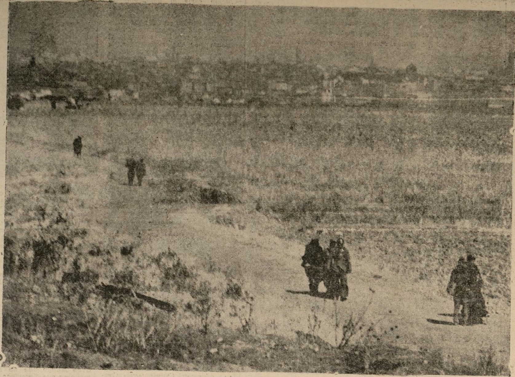
Lo que está allá lejos es Madrid. ¡Madrid! Hacia allí va un soldadito cargado de municiones, con las que les darán "p'al pelo" a los muchachos de la hoz. Ese cuadrúpedo que está ahí en medio es un rojillo que se ha pasado. Los que están en la trinchera confundidos con el suelo, aguardan el momento de marcarse un chotis castizo en la Bombilla on cuanto les dejen ¡arrear pa delante!

Que eres Madrid lo más grande no lo dudo, lo compruebo, al ver que te tienen rabia lo mismo propios que ajenos. Y no es de ahora la Inquina, hace muchísimo tiempo que tratan de asesinarte, pero tú, siempre "felendo" devuelves las agresiones, las injurias, los desprecios, con gesto de gran señor: perdonando y sonriendo.