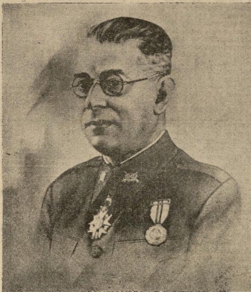
EXCMO. SR. D. EMILIO MOLA Y VIDAL, GENERAL EN JEFE DE LOS EJERCITOS DEL NORTE

Desde luego, hay que descartar la idea de que puedan referirse a nuestra imposibilidad de entrar donde ellos dominan. Que eso no puede ser está más claro que el agua. Entramos en donde